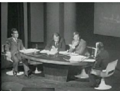
Figure n°2 : Émission À armes égales diffusée le 28/03/1973 - Invités : Robert Boulin et André Chandernagor