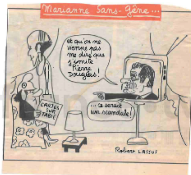
Figure n°14 - Caricature de Georges Marchais par Robert Lassus publiée dans Le Parisien du 24 mars 1981.

D'autres journaux choisissent de publier des caricatures pour illustrer les performances du candidat du PCF et pour s'en moquer. On retrouve dans Le Parisien , le lendemain de la prestation du candidat, un dessin mettant en avant une des principales répliques qui lui est associée « C'est un scandale », soulignant ainsi ses colères répétées.