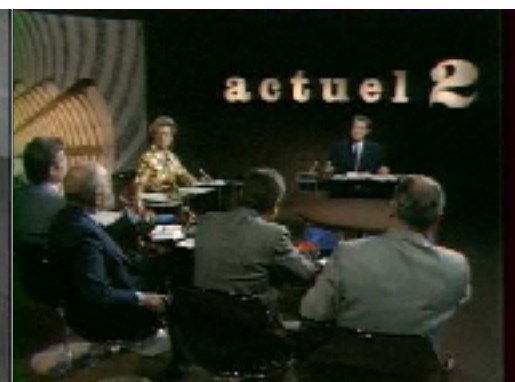
Figure n°3 : Émission Actuel 2 diffusée le 08/07/1974 - Invité : François Ceyrac

Les plateaux de ces trois émissions affichent des formes arrondies, une atmosphère plutôt lumineuse et une mise à distance, de manière plus ou moins marquées, des personnes participantes. Les formes arrondies des décors amènent une impression de douceur. Même si les débats sont animés, les courbes des plateaux compensent l'atmosphère tendue qui peut y prendre place. Le plateau en cercle de Face à Face , celui de forme oval d' À armes égales ou encore le demi-cercle d' Actuel 2 mettent en avant l'échange entre les différents acteurs plutôt que le conflit. Nous verrons que pour Cartes sur table , l'effet inverse est proposé.