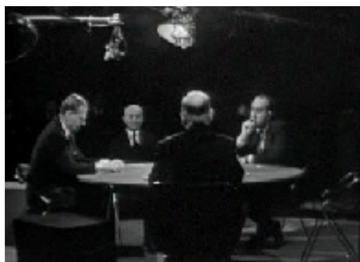
Figure n°1 : Émission Face à Face diffusée le 07/03/1966 - Invité : Waldeck Rochet

Tout mode d'organisation et de structuration des plateaux de télévision a des incidences sur le régime de présence (mise en place physique) et de visibilité (mise en images) des acteurs qui y sont installés et montrés. [...] La scénographie d'un studio de télévision produit donc des effets attendus, elle livre des indices qui permettent d'inférer les types de relations appelées à s'instaurer sur le plateau entre les acteurs, et entre ceux-ci et les téléspectateurs.