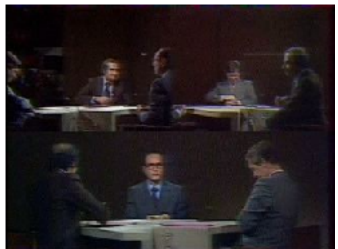
Figure n°6 : Émission du 08/02/1978 avec Jacques Chirac - Générique de fin d'émission (Imagette - Inathèque)