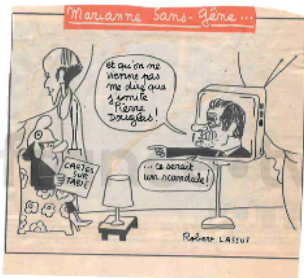
Figure n°14 - Caricature de Georges Marchais par Robert Lassus publiée dans Le Parisien du 24 mars 1981.

D'autres journaux choisissent de publier des caricatures pour illustrer les performances du candidat du PCF et pour s'en moquer. On retrouve dans Le Parisien , le lendemain de la prestation du candidat, un dessin mettant en avant une des principales répliques qui lui est associée « C'est un scandale », soulignant ainsi ses colères répétées.