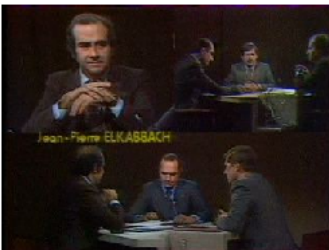
Figure n°5 : Émission du 08/02/1978 avec Jacques Chirac - Générique du début d'émission

gifle » et « pris en tenaille », on imagine bien l'intention des deux producteurs de l'émission (qui ne sont autres que les deux présentateurs) vis à vis de l'invité qu'ils reçoivent. On peut reprendre ici la grammaire des distances interindividuelles de Edward T. Hall 7 . Ce dernier explique que la mise à distance ou le rapprochement entre les personnalités présentent sur un plateau de télévision donne des indications sur les échanges et les comportements attendus entre eux. Les distances sont très parlantes sur l'ambiance que l'on veut faire régner sur le plateau. Edward T. Hall montre qu'une trop grande proximité entre les acteurs ferait émerger une certaine empathie entre eux et qu'à l'inverse un éloignement trop prononcé diminuerait fortement les émotions susceptibles d'apparaître. Le plateau de Cartes sur table se situe exactement à la frontière entre ces deux distances, on observe une certaine proximité mais tout de même limitée pour conserver les effets de tensions entre les interlocuteurs. Les journalistes tout comme la personnalité qu'ils reçoivent sont convoqués dans une sorte de joute verbale qui s'apparente à un combat stratégique. L'invité doit se sentir coincé par les questions des journalistes selon les propos du réalisateur. Cela amène à des réponses ou des gestes parfois brutaux ou cyniques de la part de l'invité. Cependant, les deux parties doivent garder une apparence calme et posée pour ne pas paraître déplacer ou malveillant aux yeux du téléspectateur.