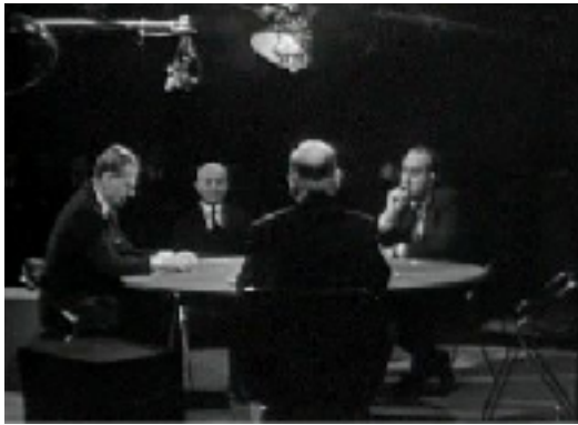
Figure n°1 : Émission Face à Face diffusée le 07/03/1966 - Invité : Waldeck Rochet (imagerie - Inathèque)

Tout mode d'organisation et de structuration des plateaux de télévision a des incidences sur le régime de présence (mise en place physique) et de visibilité (mise en images) des acteurs qui y sont installés et montrés. [...] La scénographie d'un studio de télévision produit donc des effets attendus, elle livre des indices qui permettent d'inférer les types de relations appelées à s'instaurer sur le plateau entre les acteurs, et entre ceux-ci et les téléspectateurs.