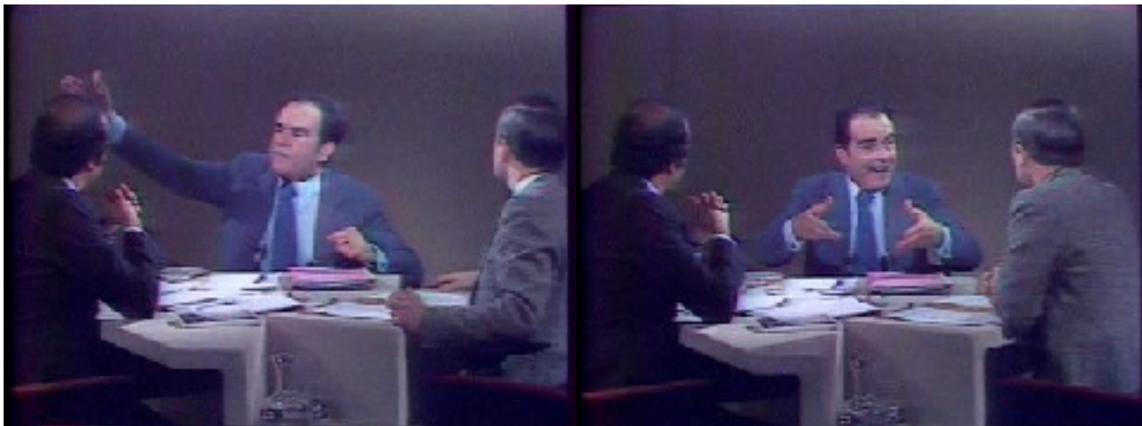
Figure n°10 et 11 - Émission Cartes sur table du 01 février 1978 avec Georges Marchais

Mais le spécialiste du divertissement reste Georges Marchais dont chaque émission est attendue par le public (partisan ou non du candidat). Le chef du Parti Communiste n'a de cesse de s'emporter face aux journalistes, multipliant les petites phrases et les grands gestes.