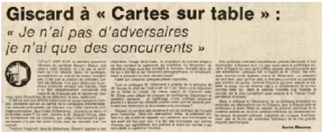
Figure n°13 - Article paru dans Sud-Ouest le 31 mars 1981 dans la page Élysée 81. (Europresse).

Une fois de plus, on souligne l'assurance du candidat en mettant en avant une phrase dite à un certains moments et en réponse à une question. Cette phrase devient le titre principale de l'article alors que d'autres choses ont été évidemment évoquées.