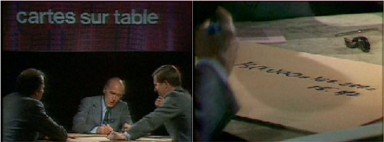
Figure n° 8 et 9 - Émission Cartes sur table du 30 mars 1981 avec Valéry Giscard d'Estaing.

plus frappant est sans doute le moment où il sort un grand tableau et un stylo pour expliquer le chiffrage de son programme pour l'élection présidentielle de 1981.