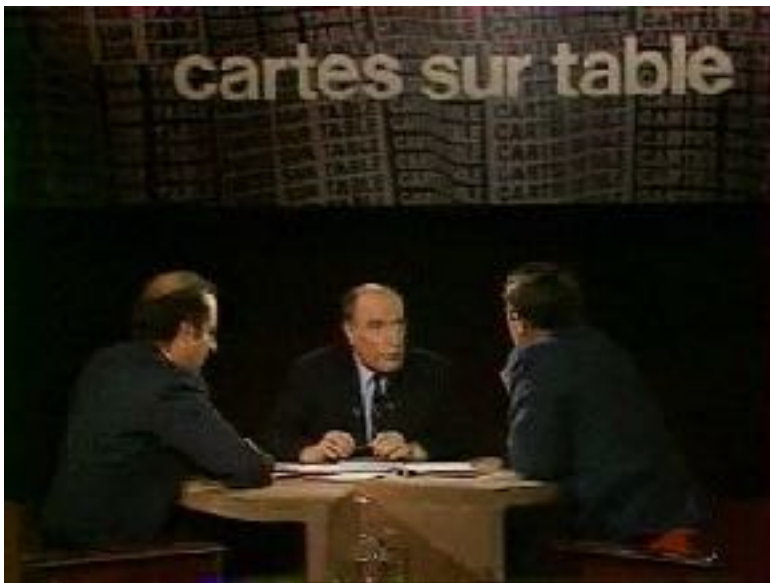
Figure n°4 : Émission Cartes sur table du 15 février 1978 avec François Mitterrand (Imagette - Inathèque).

invité. C'est sur lui que l'attention doit être portée. Enfin, l'émission À armes égales met en opposition deux invités encore une fois largement tenus à l'écart l'un de l'autre. Deux journalistes/présentateurs sont placés entre les deux hommes politiques pour réguler leurs échanges. Cette émission propose un régime plus égalitaire entre les deux groupes d'acteurs. Cependant, les deux hommes politiques sont placés plus à l'avant du plateau que les deux journalistes. Pour ces trois émissions, nous remarquons par la scénographie que les « effets attendus », pour reprendre le propos de Patrick Amey, sont une logique d'échange plutôt calme et des relations apaisées entre les acteurs.