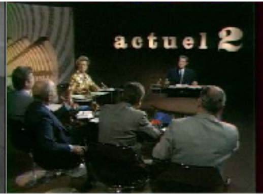
Figure n°3 : Émission Actuel 2 diffusée le 08/07/1974 - Invité : François Ceyrac (Imagerie - Inathèque)

Les plateaux de ces trois émissions affichent des formes arrondies, une atmosphère plutôt lumineuse et une mise à distance, de manière plus ou moins marquées, des personnes participantes. Les formes arrondies des décors amènent une impression de douceur. Même si les débats sont animés, les courbes des plateaux compensent l'atmosphère tendue qui peut y prendre place. Le plateau en cercle de Face à Face , celui de forme oval d' À armes égales ou encore le demi-cercle d' Actuel 2 mettent en avant l'échange entre les différents acteurs plutôt que le conflit. Nous verrons que pour Cartes sur table , l'effet inverse est proposé.