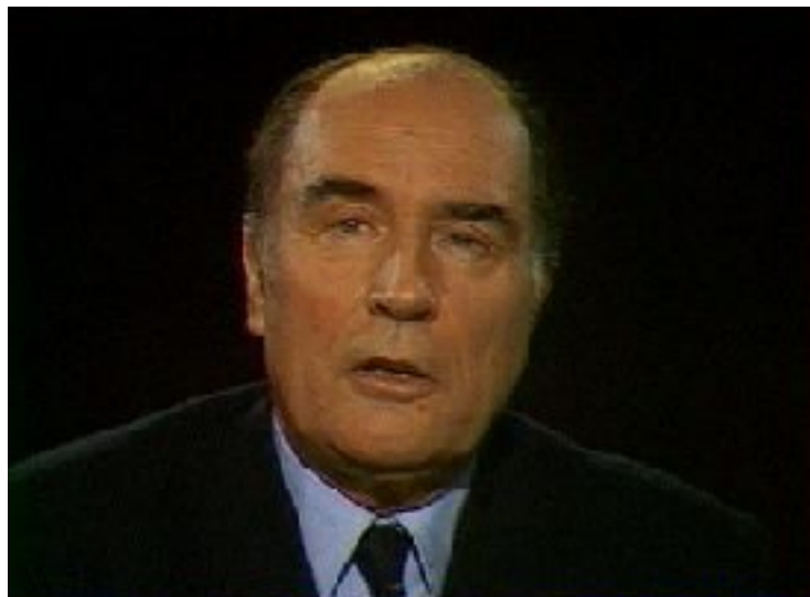
Figure n° 12 - Émission Cartes sur table du 16 mars 1981 avec François Mitterrand. Le candidat s'adresse aux téléspectateurs à propos de la peine de mort.

montre qu'il sait que la décision est difficile et qu'elle lui a valu un long temps de réflexion. Le regard face caméra permet au candidat de faire tomber la barrière de l'écran entre lui et le téléspectateur. Il entre directement dans leur foyer pour leur faire part d'un des points essentiels de son programme et pour les convaincre qu'il s'agit de la bonne décision. L'émotion est suscitée par la réponse et la façon dont celle-ci est mise en scène.