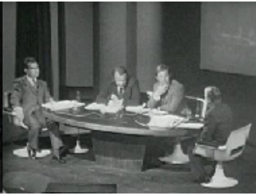
Figure n°2 : Émission À armes égales diffusée le 28/03/1973 - Invités : Robert Boulin et André Chandernagor