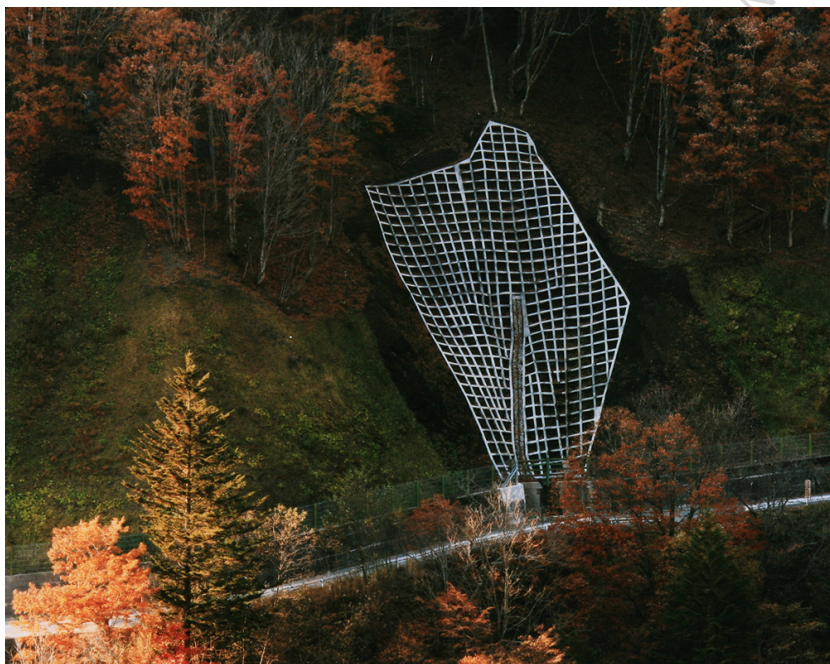
✚ Landscape 2 TOSHIO SHIBATA, 2008