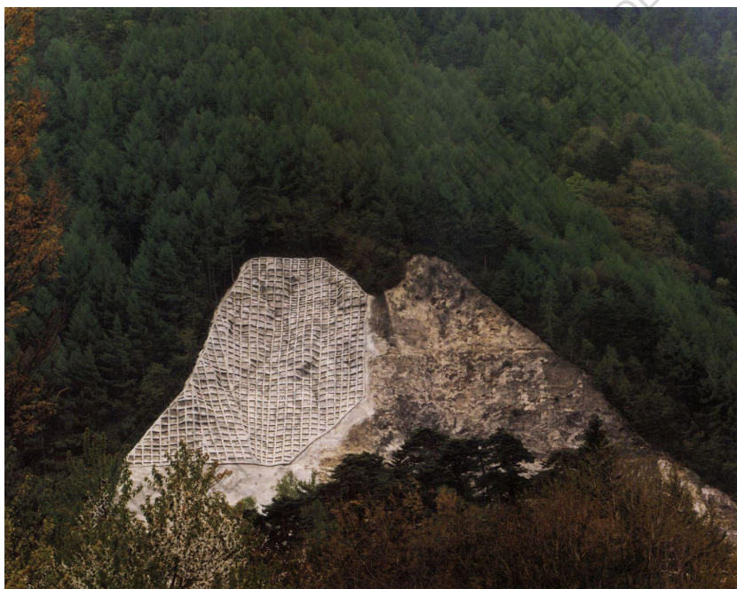
✚ Landscape 2 TOSHIO SHIBATA, 2008