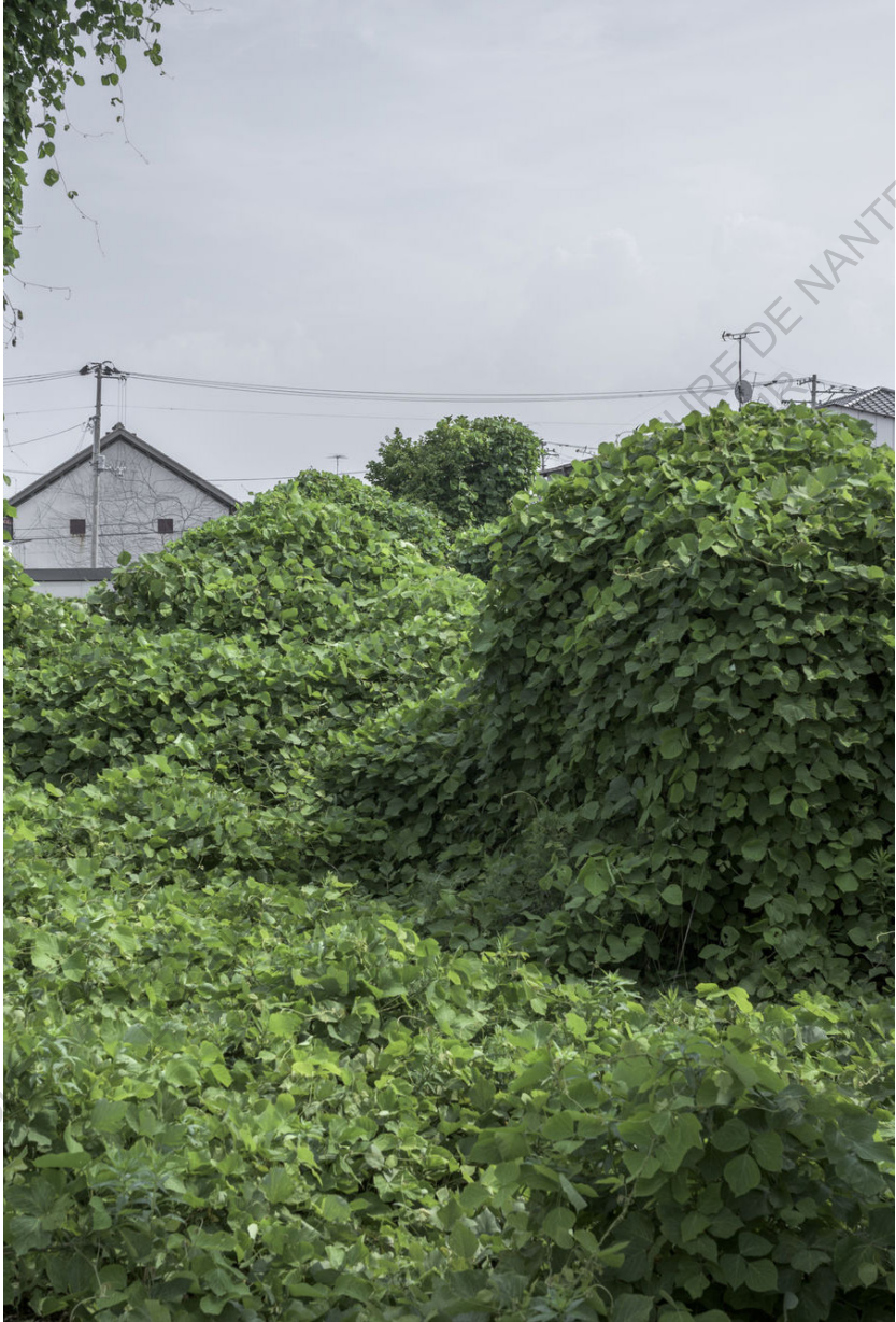
✚ La Villes abandonnées de Fukushima aux prises avec les plantes grimpantes et les herbes folles. Guillaume Bression et Carlos Ayesta Source : fukushima-nogozone.com