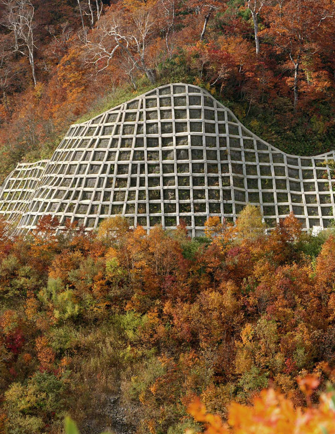
✚ Kitashiobara Village, Fukushima, 2016, TOSHIO SHIBATA