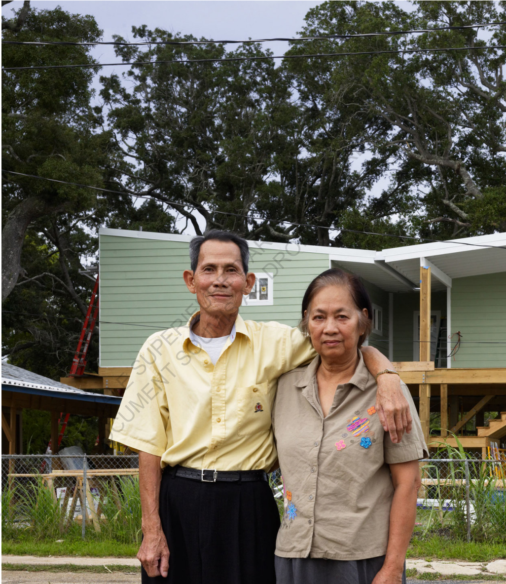
✚ Maisons reconstruit par le Gulf Coast Community Design studio après l'ouragan Katrina en 2005.