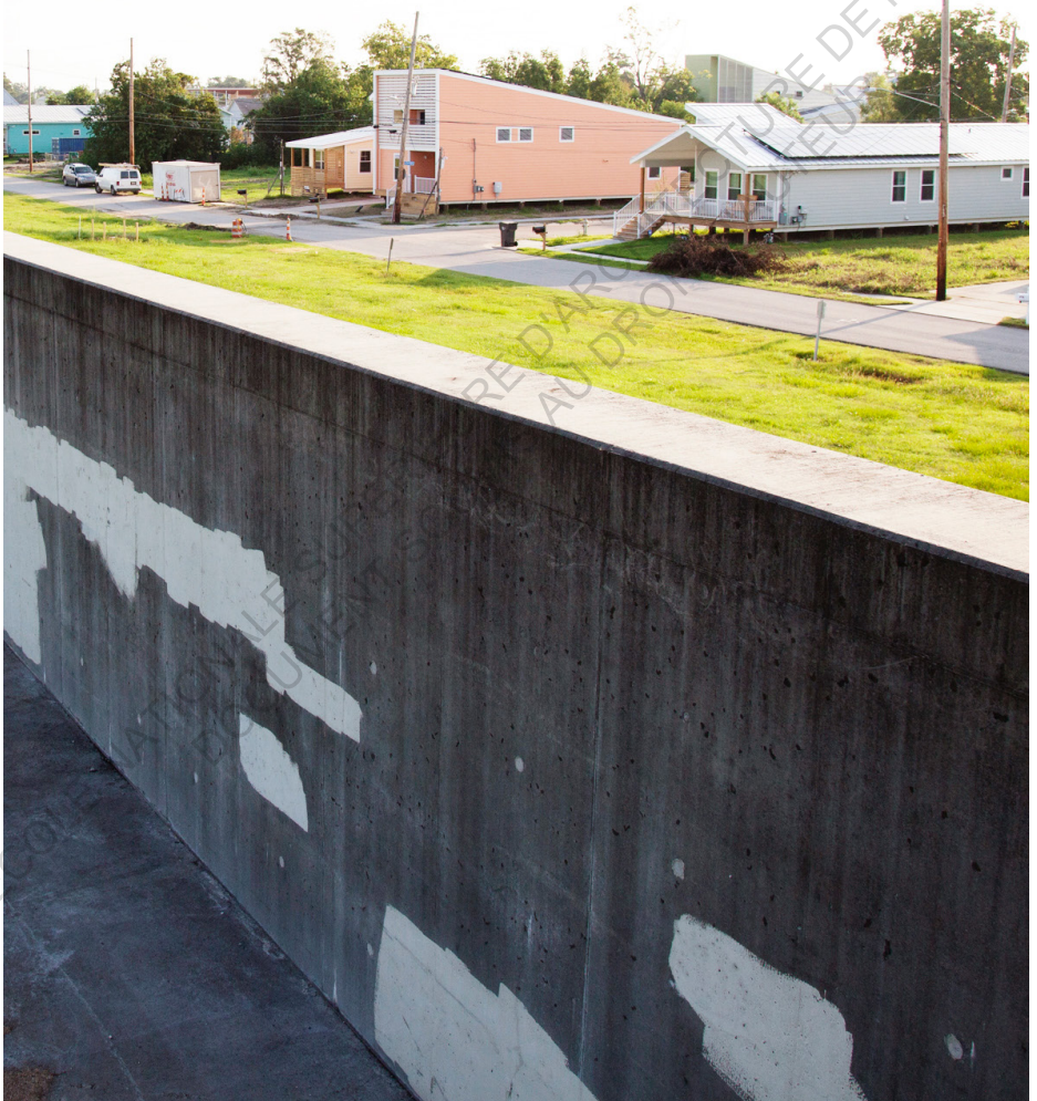
✚ Les maisons make it right New Orleans, à l'ombre de la digue.