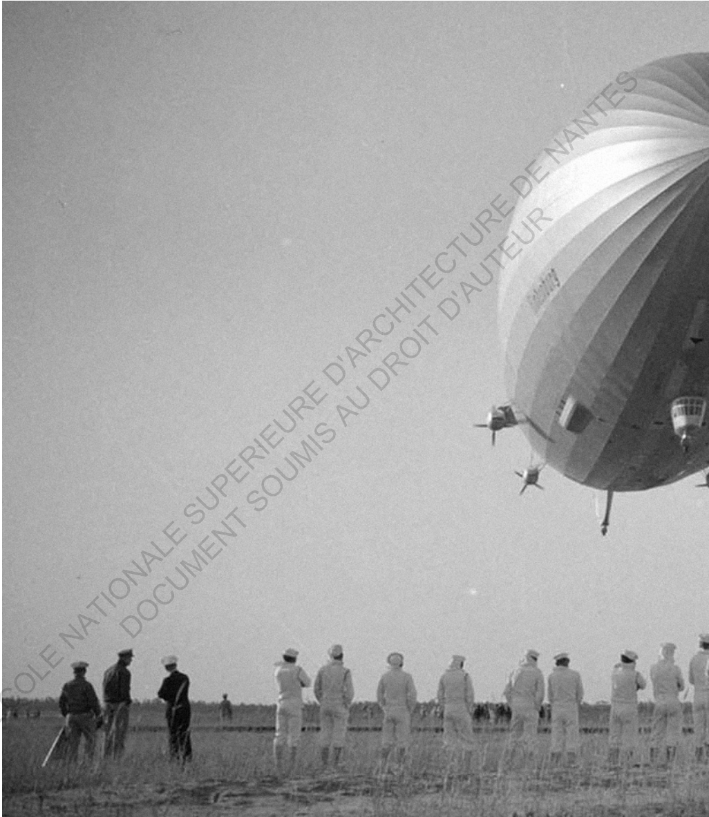
✚ Le dirigeable Hindenburg peut de temps avant son embrasement, base aérienne de la marine américaine à Lakehurst, New Jersey 1937.