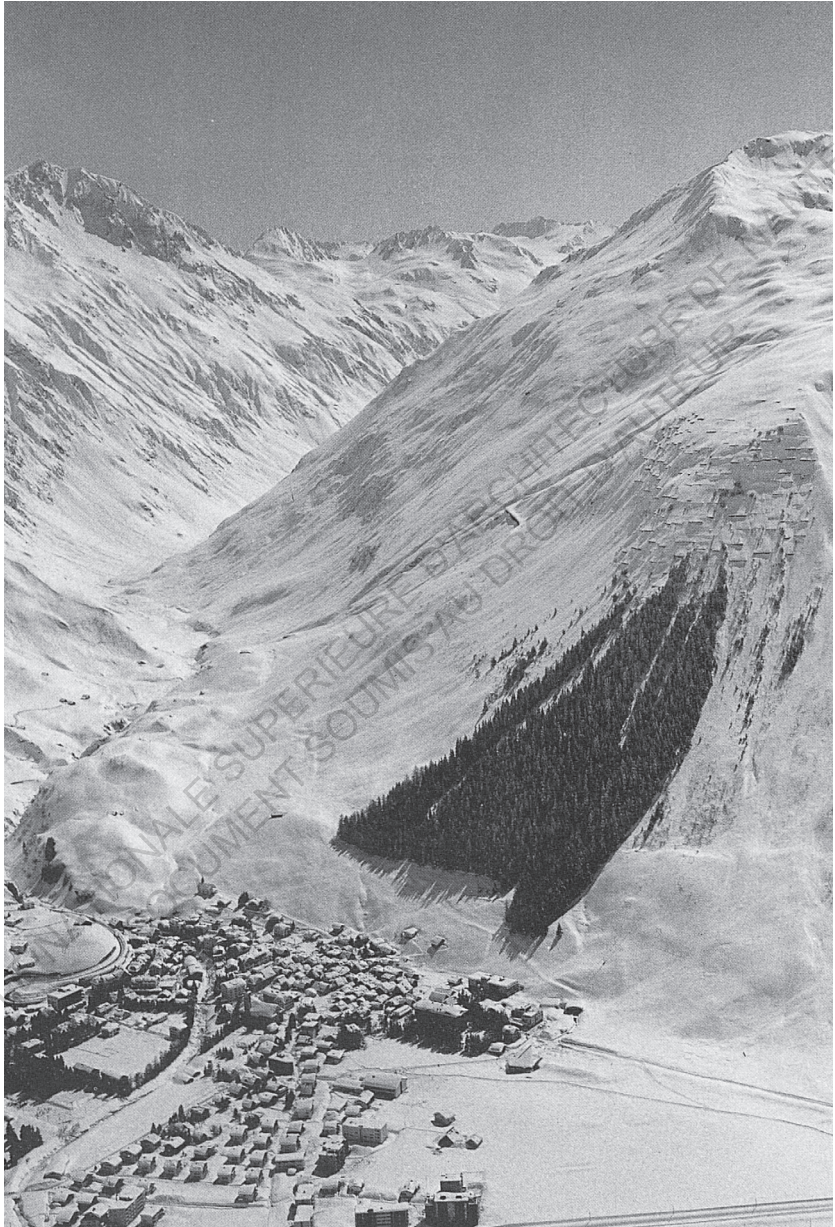
✚ Village d'Andermatt en Suisse et sa forêt triangulaire.