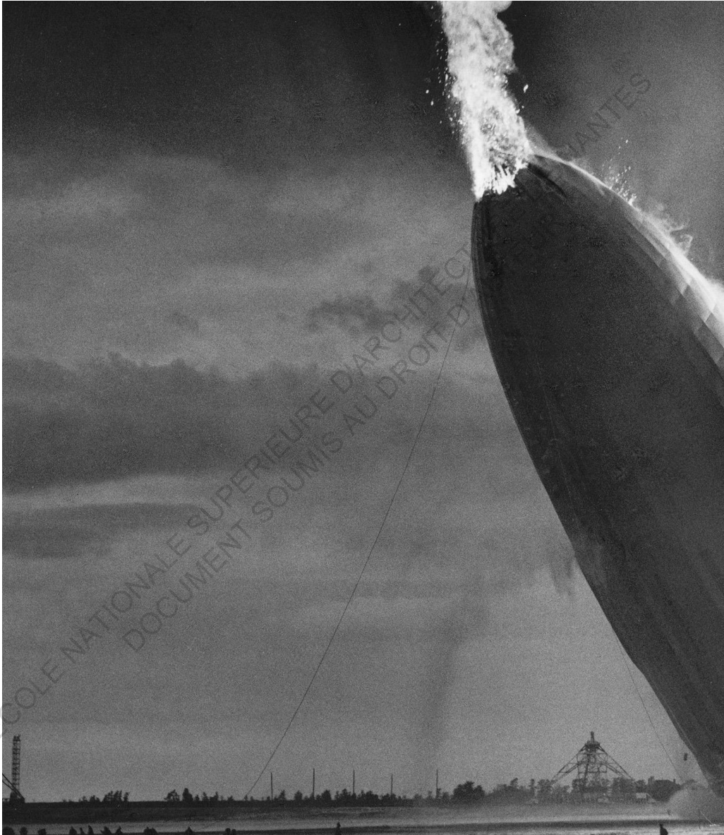
✚ Le dirigeable Hindenburg quelques instants plus tard, base aérienne de la marine américaine à Lakehurst, New Jersey 1937.