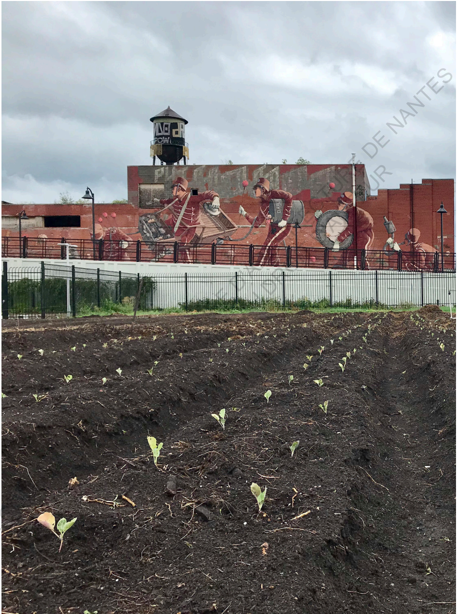
✚ Une Ferme urbaine à Détroit