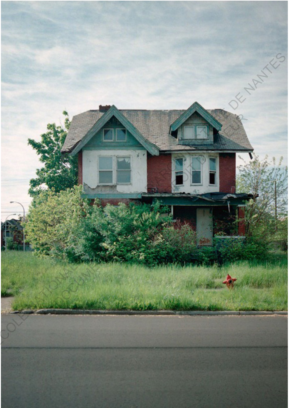
✚ Les maisons abandonnées de Détroit