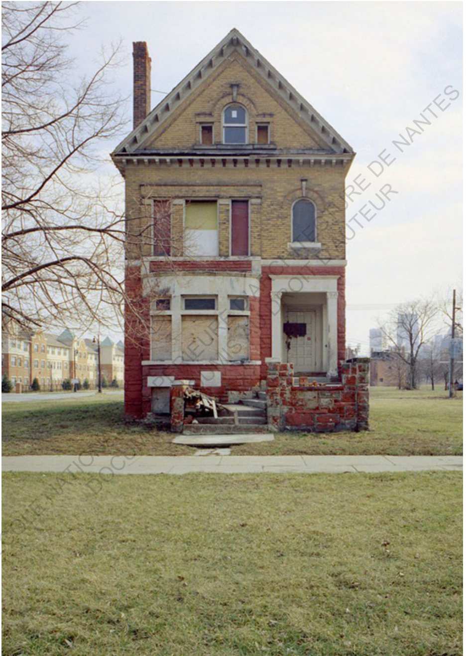
✚ Les maisons abandonnées de Détroit, photographe Kevin Bauman