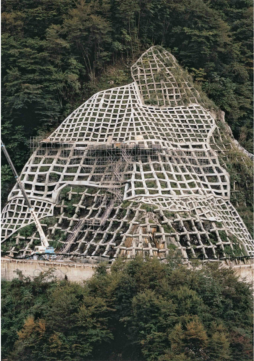
✚ Retenue de terre, Chichibu City, Saitama Prefecture, 2007, TOSHIO SHIBATA Source: www.sfmoma.org