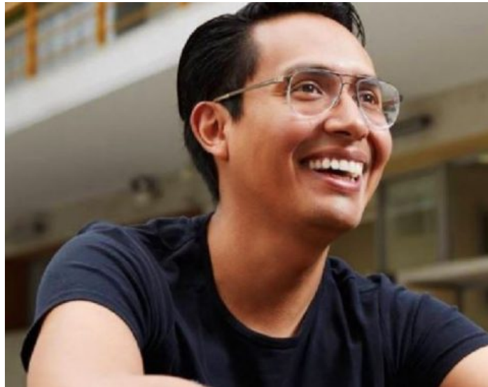
Figure 42 : Portrait d'Edward Venero