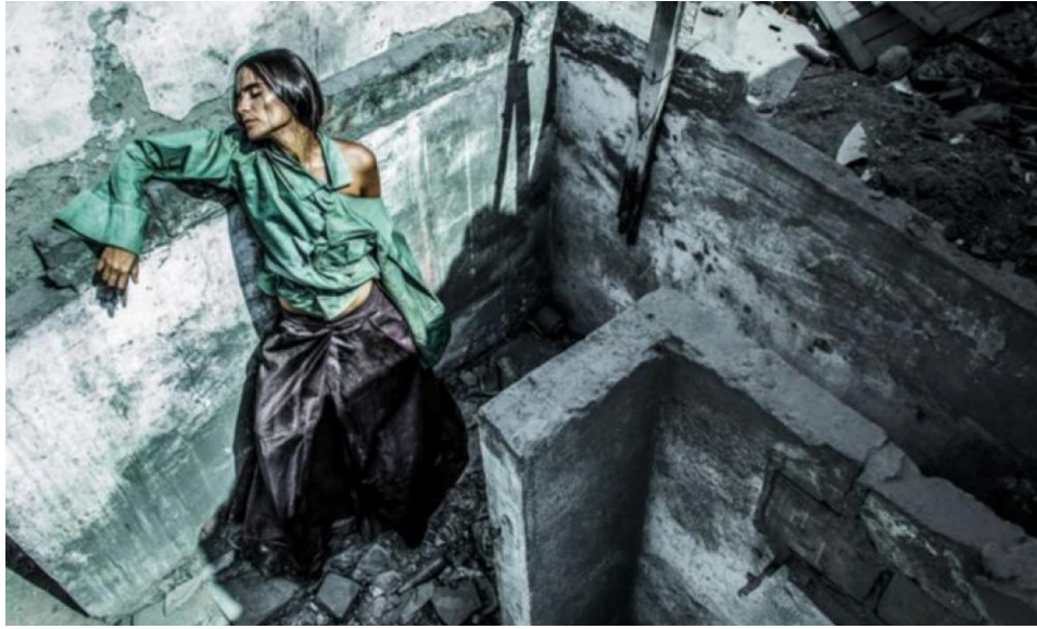
Figure 1 : Editorial de Mode “No olvido, ni perdono 50 ”, Mars 2016.