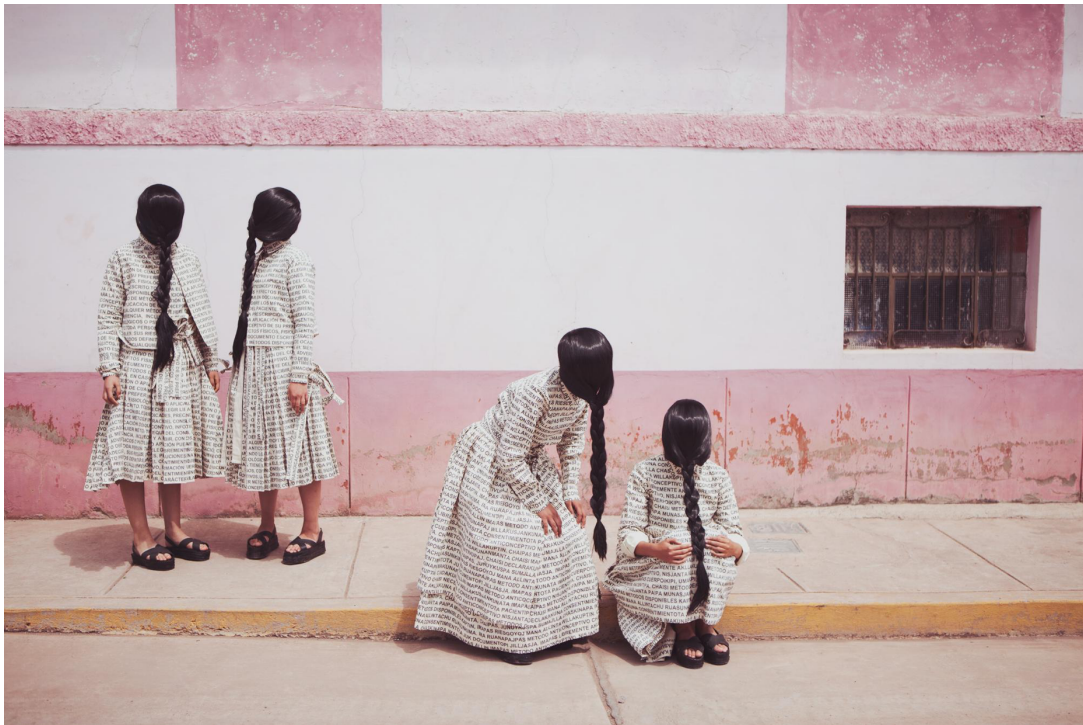
Figure 2 : Éditorial de mode “Artículo 6”, Robes de Lucia Cuba, Septiembre 2016.