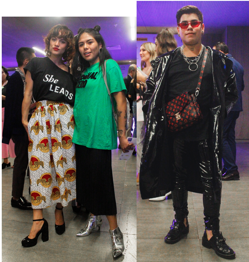
Figures 19, 20, 21, 22 : Des jeunes qui posent avec leur tenues. Ces photos ont été prises par Carolina, cool hunter. Elle était chargée de prendre des photos des tenues originales. Elles ont été reprises sur son blog et ont été publiées au moment de l'événement.