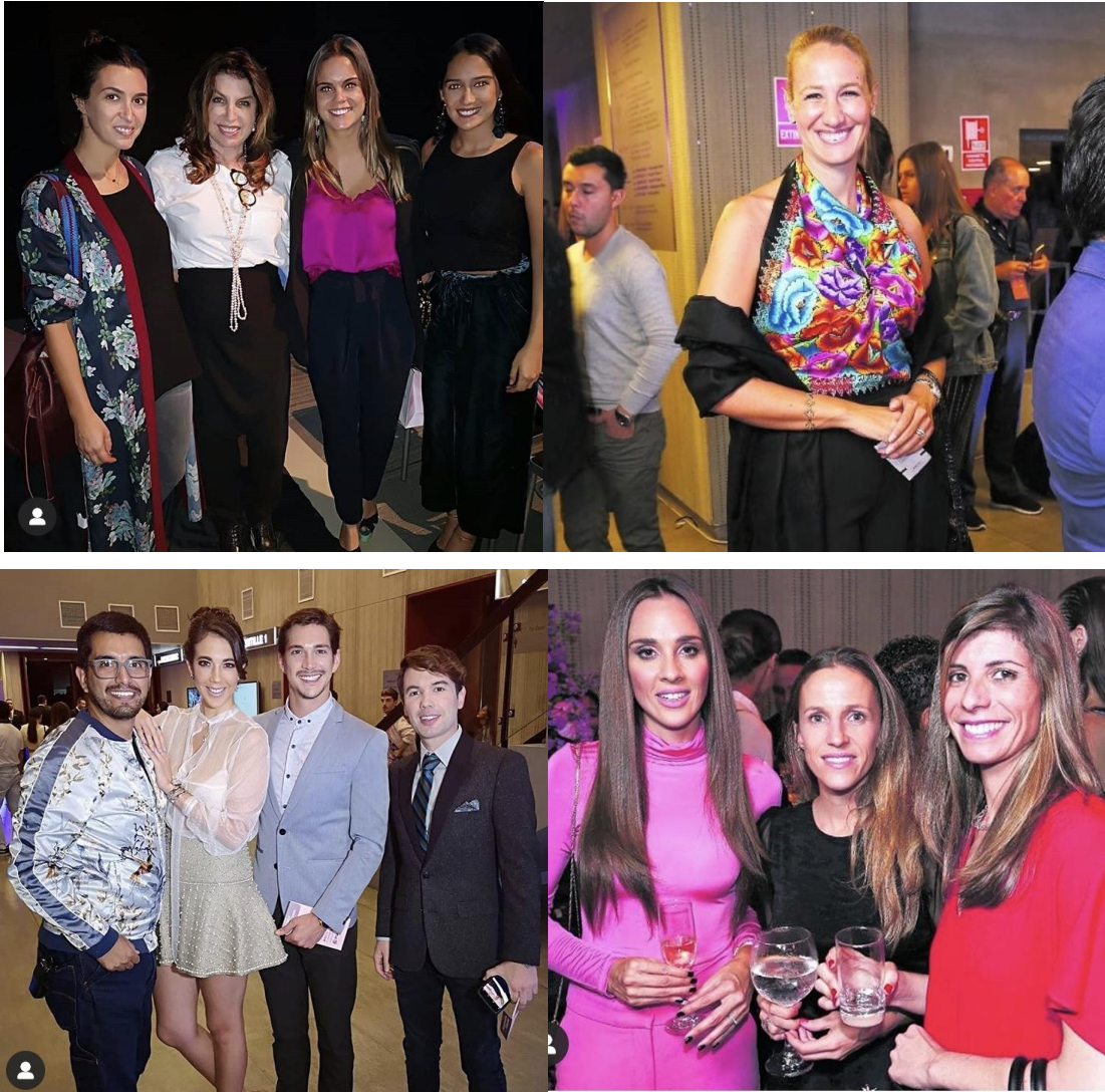
Figures 15, 16, 17 et 18: Des participants aux LifWeek. Toutes ces photos ont été prises sur le compte Instagram du Lima Fashion Week, elles ont été publiées entre le 24 et le 26 avril .

Aucune information concernant les photographes est répertoriée.