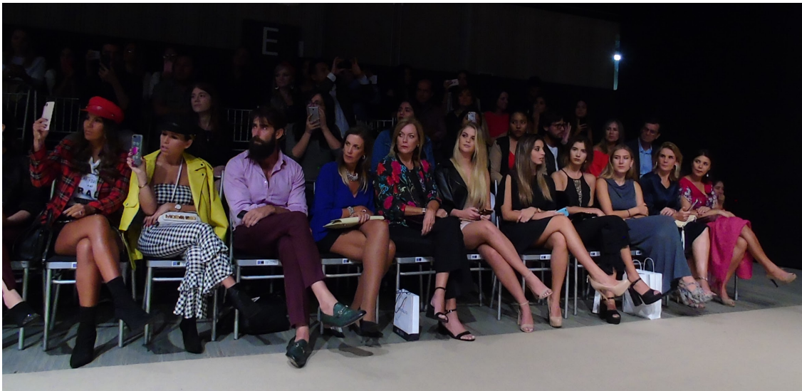
Figure 23 : Premier rang pour le défilé de la designer Fatima Arrieta.

L'image ci-dessous montre le profil de personnes que j'ai pu observer assises au premier rang pendant la semaine, des femmes montrant des attributs d'une classe aisée à travers leur vêtements et souvent accompagnées de leurs filles. Les décisions quant à l'accès et l'image de l'événement prises par les organisateurs de l'événement montrent que l'aspect social prime sur tous les autres aspects.