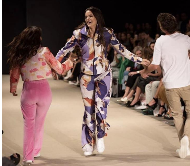
Figure 25 : Des influencers pendant le défilé d'Ana G. La photo a été prise sur le compte Instagram d'une des influencers. Elle a été publiée le 24 avril 2018.

Ce moment qui parut interminable montre la place des influencers. Ces personnes qui ont donc de l'influence sont présentes sur les réseaux sociaux, ils partagent leur quotidien avec des photos ou vidéos d'une esthétique recherchée et attirante, pouvant atteindre des milliers voire des millions de personnes. Cette notoriété est justement calculée par leur nombre de followers, comme nous l'avons vu dans le premier chapitre. Le public de ces influencers est surtout un public jeune. Ces personnes sont souvent rémunérées pour effectuer des placements de produits sur leur comptes. Je considère que dans ce cas, il y a un double enjeu, dans un premier temps, le désir d'attirer une clientèle jeune, étant donné que ces vêtements ont un style qui vise une clientèle plus âgée. Puis d'un autre côté, l'attitude de influencers montre également un désir de notoriété.