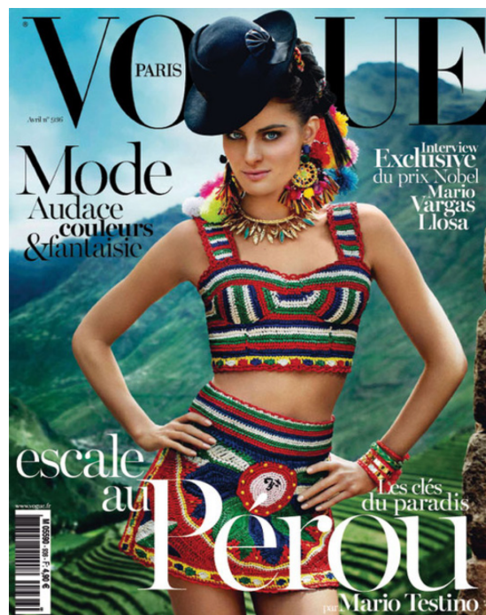
Figure 5: Isabela Fontani en couverture du Magazine Vogue Paris, avril 2013, photographié par Mario Testino. Source: https://www.vogue.fr/mode/news-mode/articles/numro-avril-2013-vogue-paris-spcial-prou-mario-testino-isabeli-fontana/20203 , consulté le 16 juin 2019.

Jorge a été un des assistants de Mario lorsqu'il a travaillé au Pérou. Son nom a été prononcé dans la plupart de mes entretiens comme étant un modèle de réussite du milieu de la photographie grâce à son parcours international. Il quitte le Pérou à l'âge de 22 ans pour commencer des cours de photographie à Londres, il a travaillé pour les plus importants magazines de Mode ainsi qu'avec les mannequins plus célèbres et des célébrités mondiales. Tout au long de sa carrière, il reçoit différentes prix en reconnaissance de son travail. En 2012, il inaugure le musée Mario Testino (MATE), en plein cœur du quartier branché de Barranco, à Lima. Le musée présente une collection permanente qui expose ses photographies les plus célèbres, mais également une partie dans laquelle il montre des photos prises à des péruviens portant des vêtements dits traditionnels. Comme toile de fond, il utilise des photos qui appartenaient au photographe péruvien Martin Chambi (1891-1973).