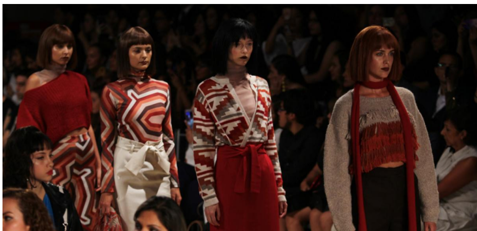
Figures 46 et 47 : Photos du défilé de Paola Gamero