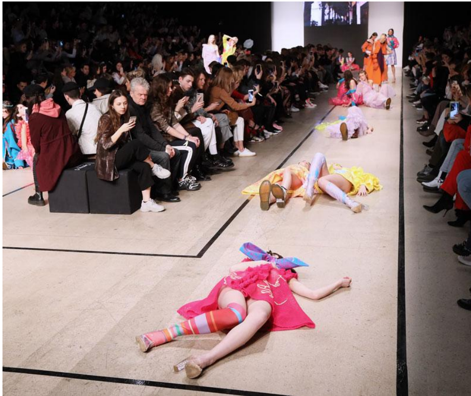
Figure 63 : Le défilé d’Annais Yucra à la dernière édition du Lima Fashion Week qui s’est déroulé au mois de mars.

inconnue dans la scène péruvienne - est entrée dans la passerelle pour fermer son premier défilé individuel dans notre pays” 48 .