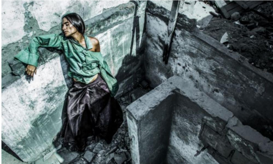
Figure 1 : Editorial de Mode “No olvido, ni perdono 50 ”, Photographié par Rodrigo Diaz, Mars 2016. Source: https://peru21.pe/cheka/redes-sociales/facebook-usuarios-critican-muestra-moda-inspirada-terrorismo-peru-213110?foto=4