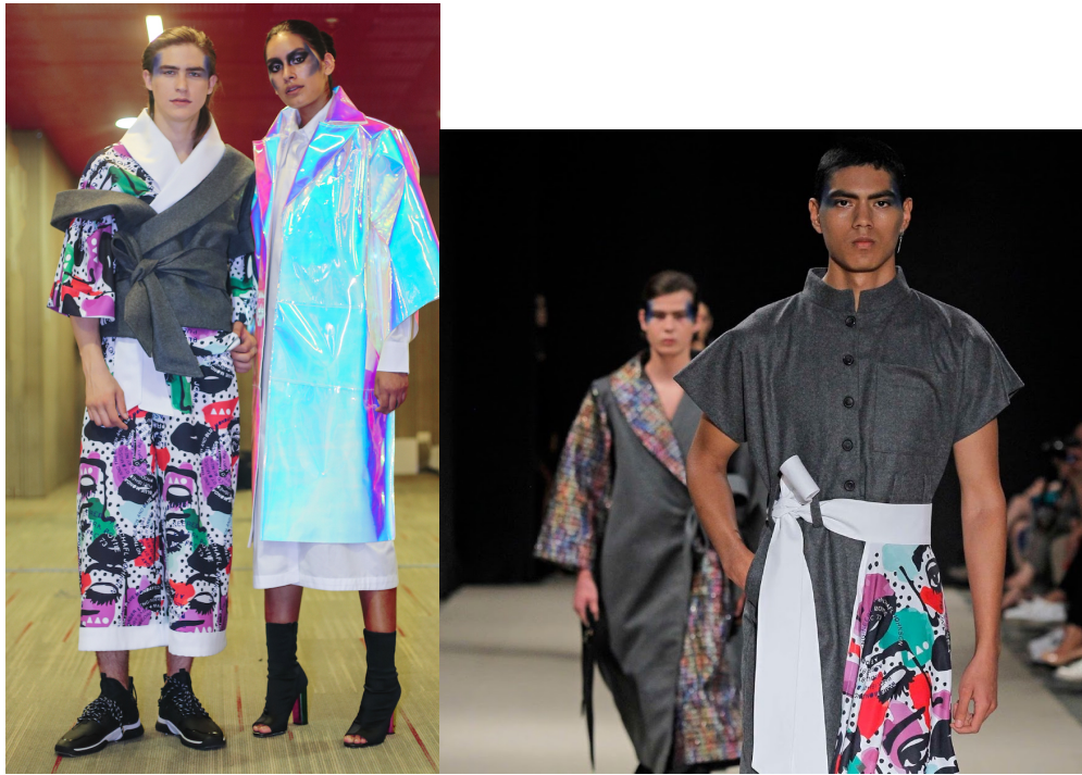
Figures 37 et 38: Photos montrant les designs de Pat Sedano,