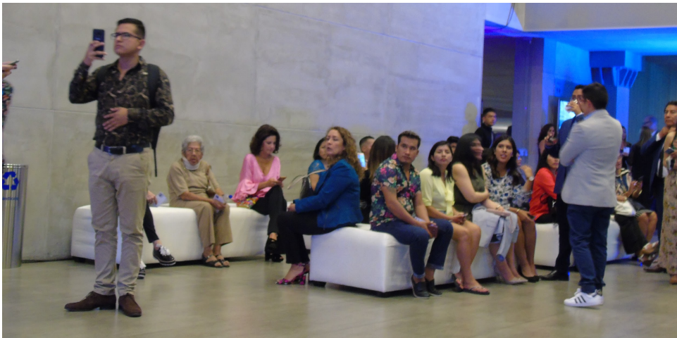
Figure 13 : Des invités qui patientent à côté de l'entrée pour les défilés, photo prise par moi le premier jour.

passées chez des professionnels avant. Il y a des ressemblances dans leur tenues, comme si une sorte de dress code, marqué nul part, leur avait été communiqué à elles. Les hommes sont en chemise à manches longues et certains portent également un costume mais sans cravate. Leurs tenues me font penser à des hommes d'affaire venus se détendre après le travail. Dans les deux cas, les accessoires, montres, bijoux et sacs, montrent aussi une sorte de richesse que je n'avais pas vu de l'autre côté. Je continue à avancer et décide d'aller voir le prix des boissons. La bouteille d'eau coûte 10 soles (environ 3 euros), la bière 20 soles (environ 6 euros), la coupe de vin coûte 25 soles (environ 8 euros) et la coupe de champagne 40 soles (environ 13 euros). Les prix sont excessivement chers en comparaison pour Lima.