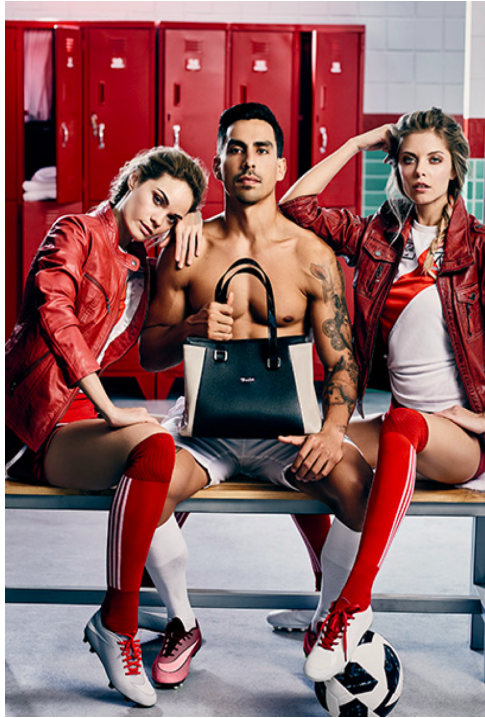
Figure 3 : Publicité pour la Marque Renzo Costa dans la thématique de la Coupe du monde, Mai 2018.