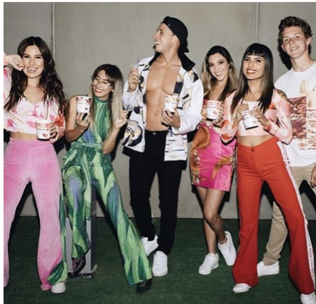
Figure 24 : Des influences qui posent avec leurs pots de glace. La photo a été prise sur le compte Instagram d'une des influencers. Elle a été publiée le 24 avril 2018.

nouveau avec leur pot de glace, tout en filmant et prenant des photos avec des téléphones. Les 3 derniers arrivent, deux filles et le fils de la créatrice avancent également. Ils se promènent tous dans la salle, dansent, sautent, exagèrent leur mouvements, continuent à se prendre en photo 33 . Ce sont des pots Haagen das et des téléphones de la marque HP. Ils sont tous habillés avec les vêtements de la marque. Je lis plus tard sur les réseaux sociaux d'Ana Giulfo que les vêtements étaient inspirés par les différents parfums de glace. Je vois autour de moi que les personnes ont comme moi l'air confus.