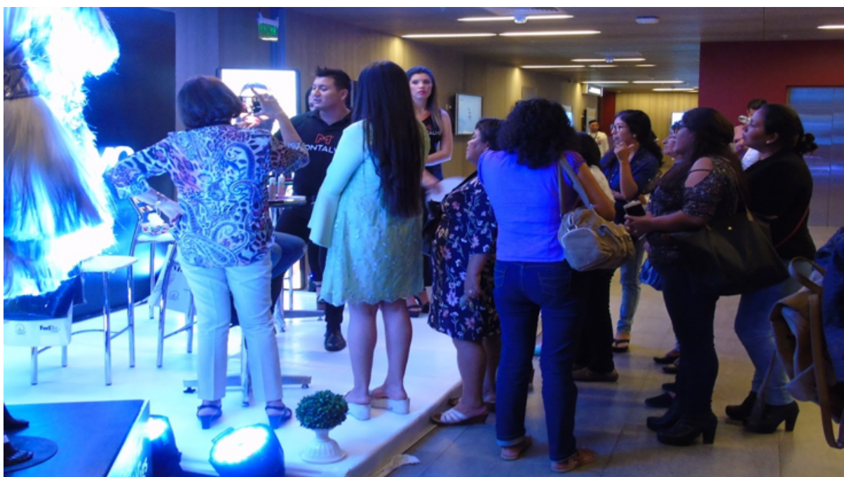
Figure 12 : Des femmes devant le stand Montalvo, photo prise par moi le premier jour du LifWeek.

Le premier jour, je rentre par le côté presse situé dans un espace de stockage, j'émerge mon nom et monte directement au 6ème étage où se déroulaient les défilés. Je sors de l'ascenseur et aperçois à ma gauche un homme avec un uniforme et deux femmes tenant un stand Montalvo. Les deux femmes sont très maquillées, portent de hauts talons et des vêtements moulants. Une dizaine de femmes regardaient avec attention un tutoriel de maquillage effectué sur l'une d'entre elles. Elles sont habillées avec des tenues plutôt décontractées : jean, chemise, t-shirt, robe d'été, sandales plates ou bottines. Elles portent beaucoup d'attention au tutoriel et filment avec leur téléphones tout en regardant d'un air minutieux comment une de leur amie se fait maquiller. Le maquilleur me paraît charismatique et on peut expliquer cela car les spectatrices semblent très attentives, j'arrive au moment où tous s'esclaffent en réaction à l'une de ses blagues.