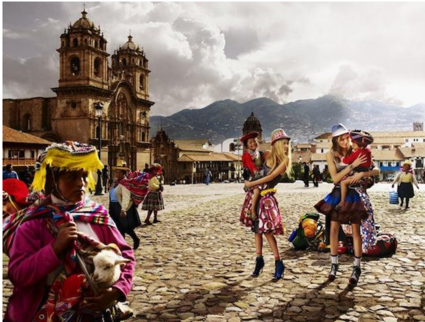
Figure 4 : Photo parue dans le Vogue Anglais, Photographiée par Mario Testino, Novembre 2012.

comment présenter leurs collections (50m00). Il estime que, pour la plupart, ils n'ont pas fait d'études de mode, mais sont à l'origine mannequins, architectes ou señoras con plata . Son opinion sur le LifWeek se résume d'une part, au désir des influenceurs et designers de vouloir apparaître quelque part à tout prix ; et d'autre part, au fait de toujours observer et présenter des collections similaires. Il estime que la forte migration vénézuélienne actuelle aura probablement un impact sur la façon de se vêtir des péruviens. Notre entretien se termine évoquant Pietà , marque créée par un français, dont le concept est de déléguer la confection à des prisonniers.