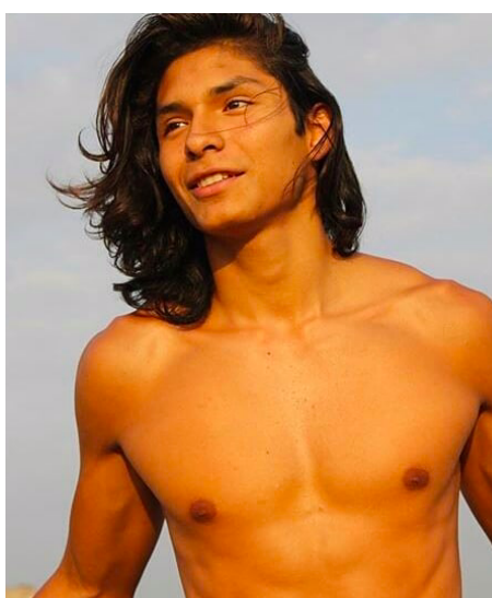
Figure 4 : Photo prise sur le profil Instagram du mannequin de Fahd Salés, c'est le mannequin dont parle Pablo, elle a été publiée le 05 mars 2018.

Pablo : Oui ... il mesure 1m90, il a perdu du poids parce qu'en Argentine on lui demande les mensurations internationales."