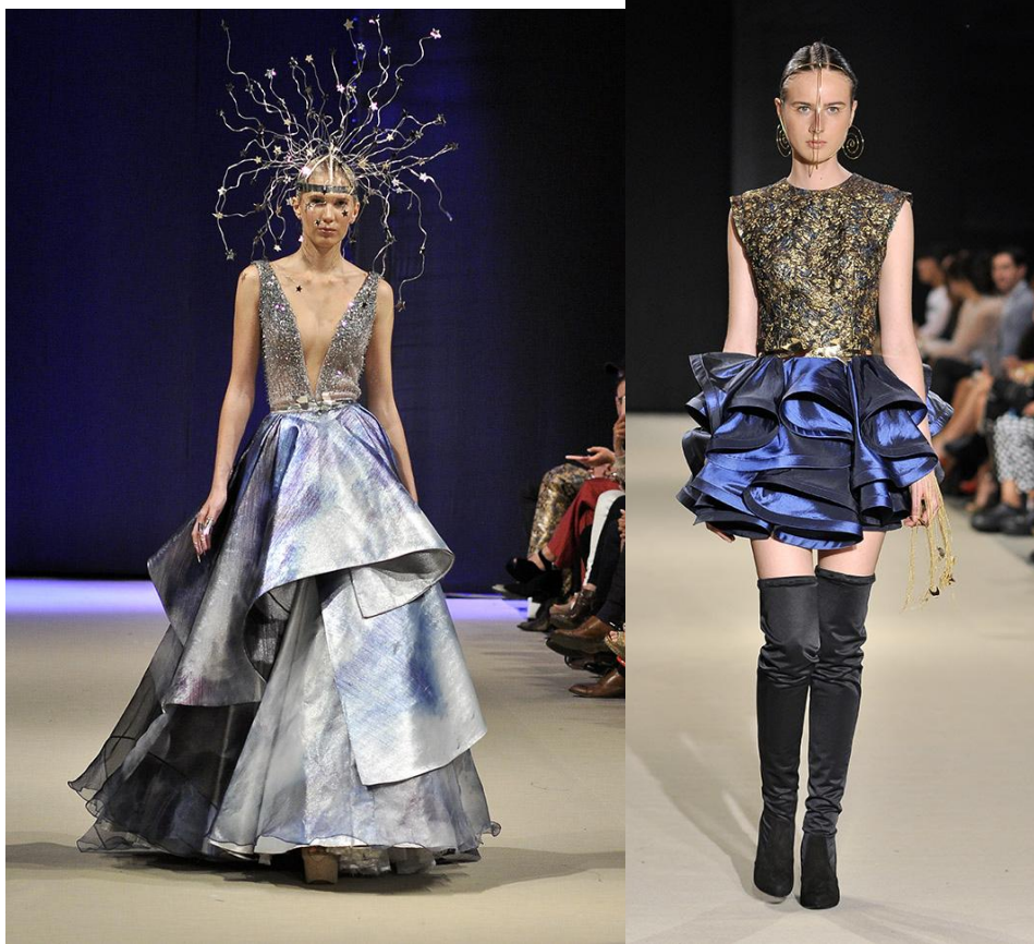
Figures 49 et 50 : Photos du défilé de Claudia Jiménez