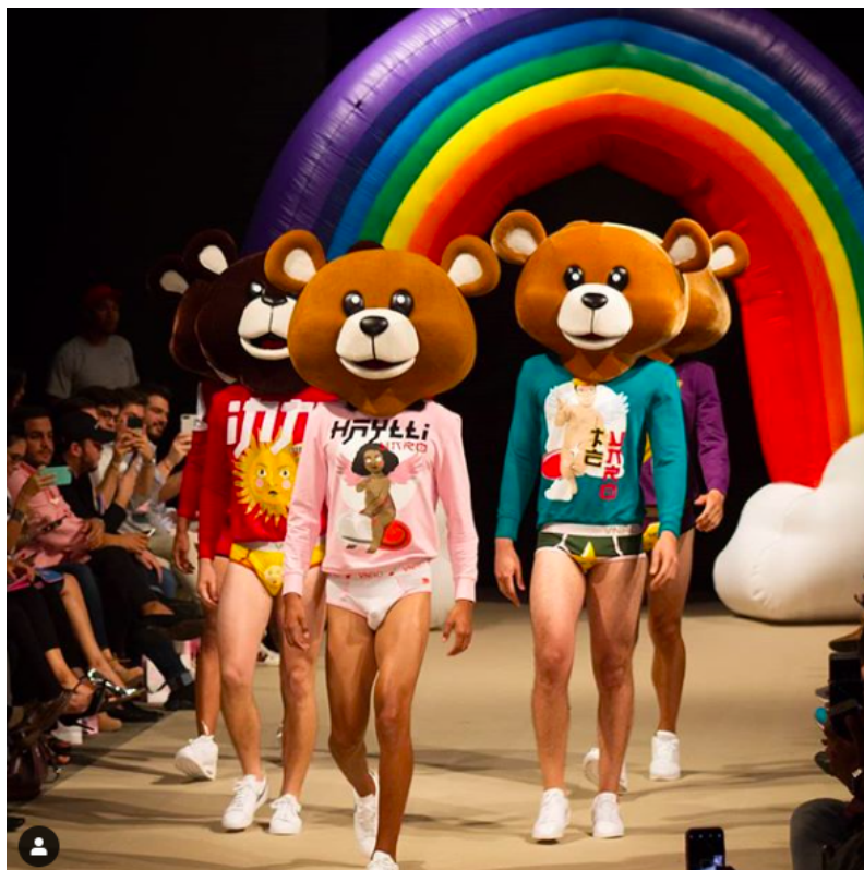
Figure 43 : Photo reprise du profil Instagram de d'Edward Venero, présentation de sa collection pendant le LifWeek, édition 2018, publiée le 27 avril 2018.