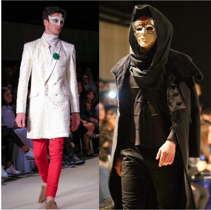
Figures 34 et 35 : Photos du défilé de Cristian Vera.