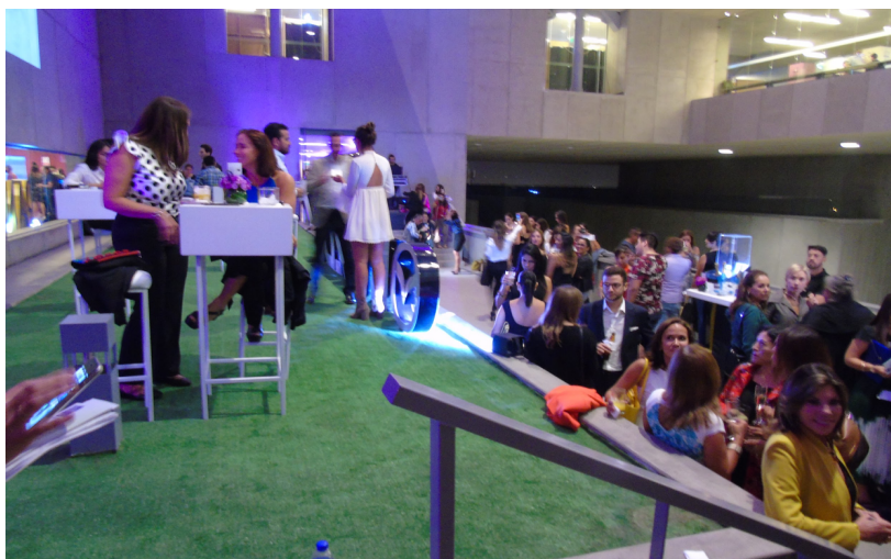
Figure 14 : Des invités dans le bar de l'événement, photo prise par moi le premier jour.