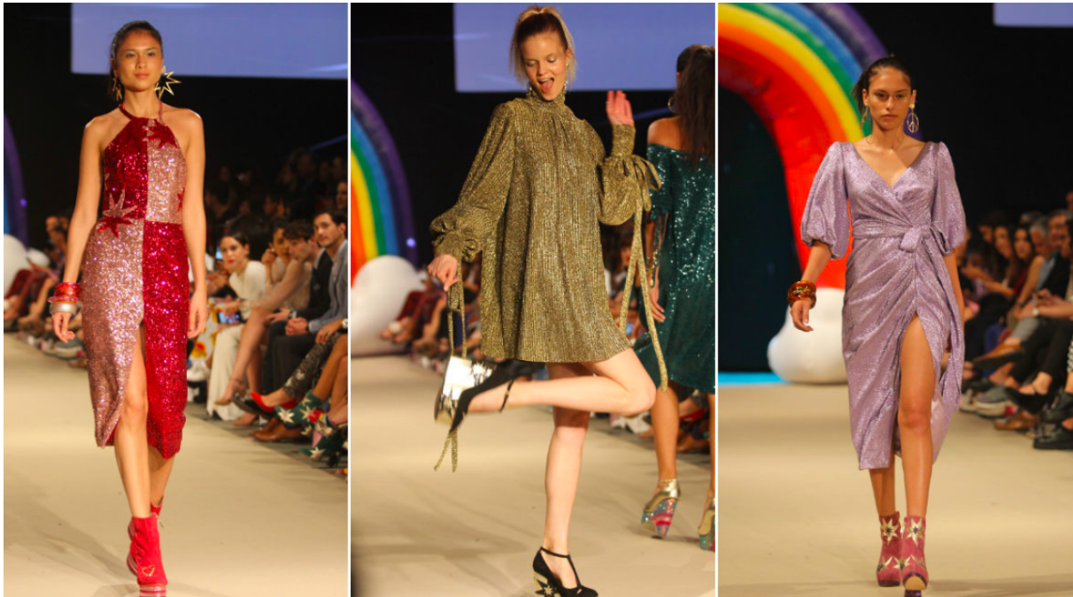
Figure 41 : Des mannequins pendant le défilé de Jessica Butrich, source : https://rpp.pe/cultura/mas-cultura/fotos-lif-week-color-tejidos-peruanos-segundo-dia-pasarela-butrich-noticia-1119044/4 .