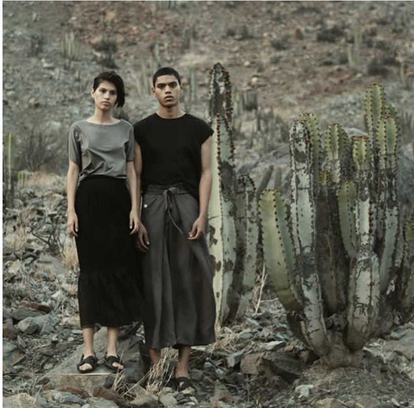
Figure 62 : Photo prise sur le compte Instagram de la marque Maco Calderón, publiée le 21 janvier 2019. Photographiée par Orlando Sander.