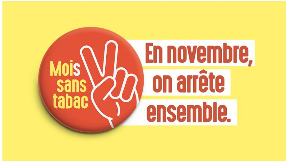
Image n°2 : Affiche de la campagne du #MoisSansTabac : En novembre, on arrête ensemble.