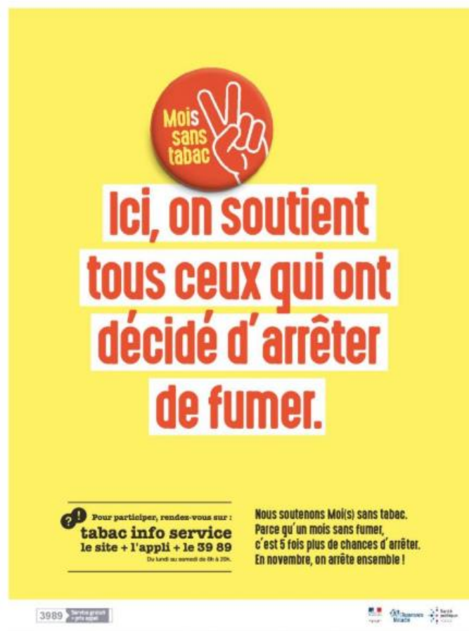
Image n°3 : Affiche de la campagne du #MoisSansTabac : Ici, on soutient tous ceux qui ont décidé d'arrêter de fumer.