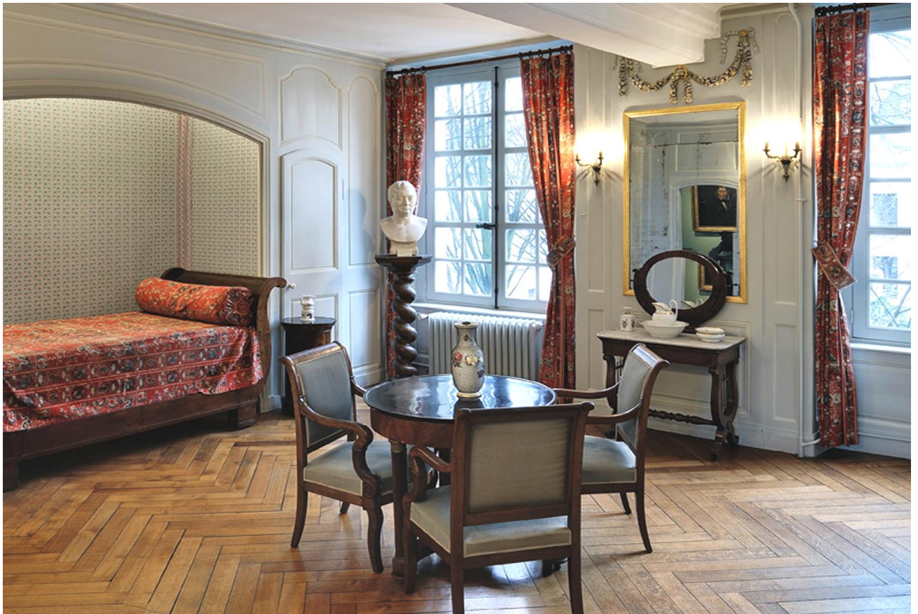
Photographie de la chambre de Gustave Flaubert enfant, musée Flaubert et d'histoire de la médecine CHU de Rouen (1)