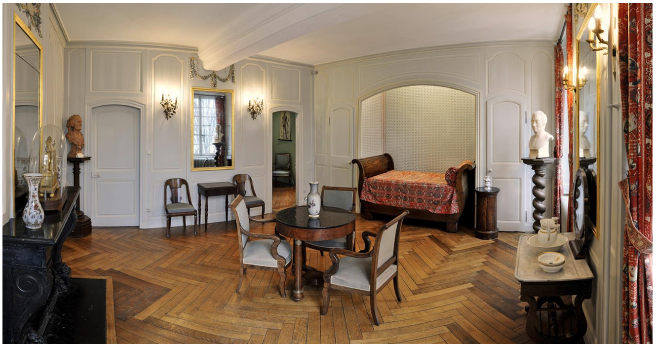
Photographie de la chambre de Gustave Flaubert enfant, musée Flaubert et d'histoire de la médecine CHU de Rouen (2)