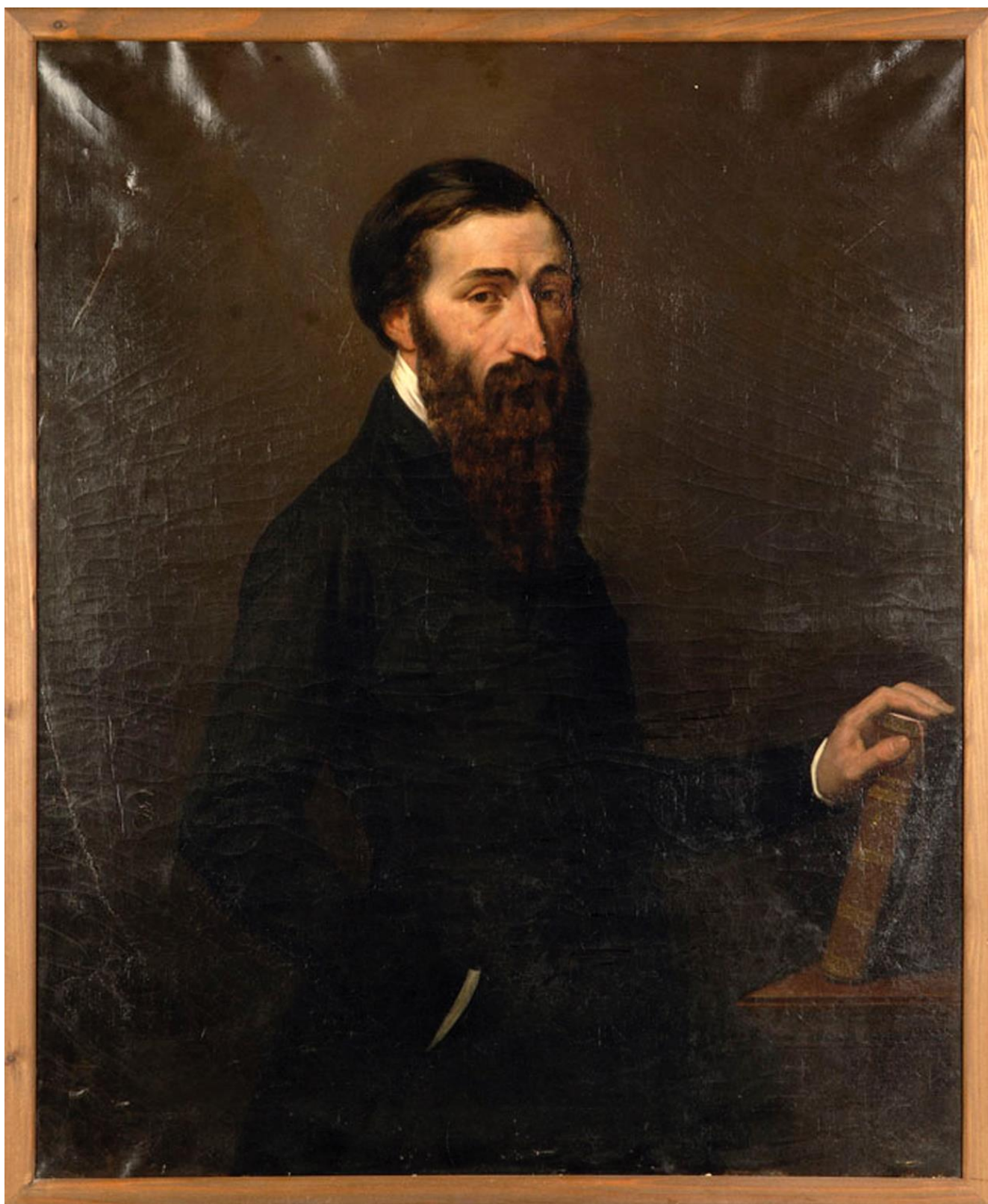
« Achille Flaubert » par Hippolyte Bellangé, 1849, musée Flaubert et d'histoire de la médecine CHU de Rouen