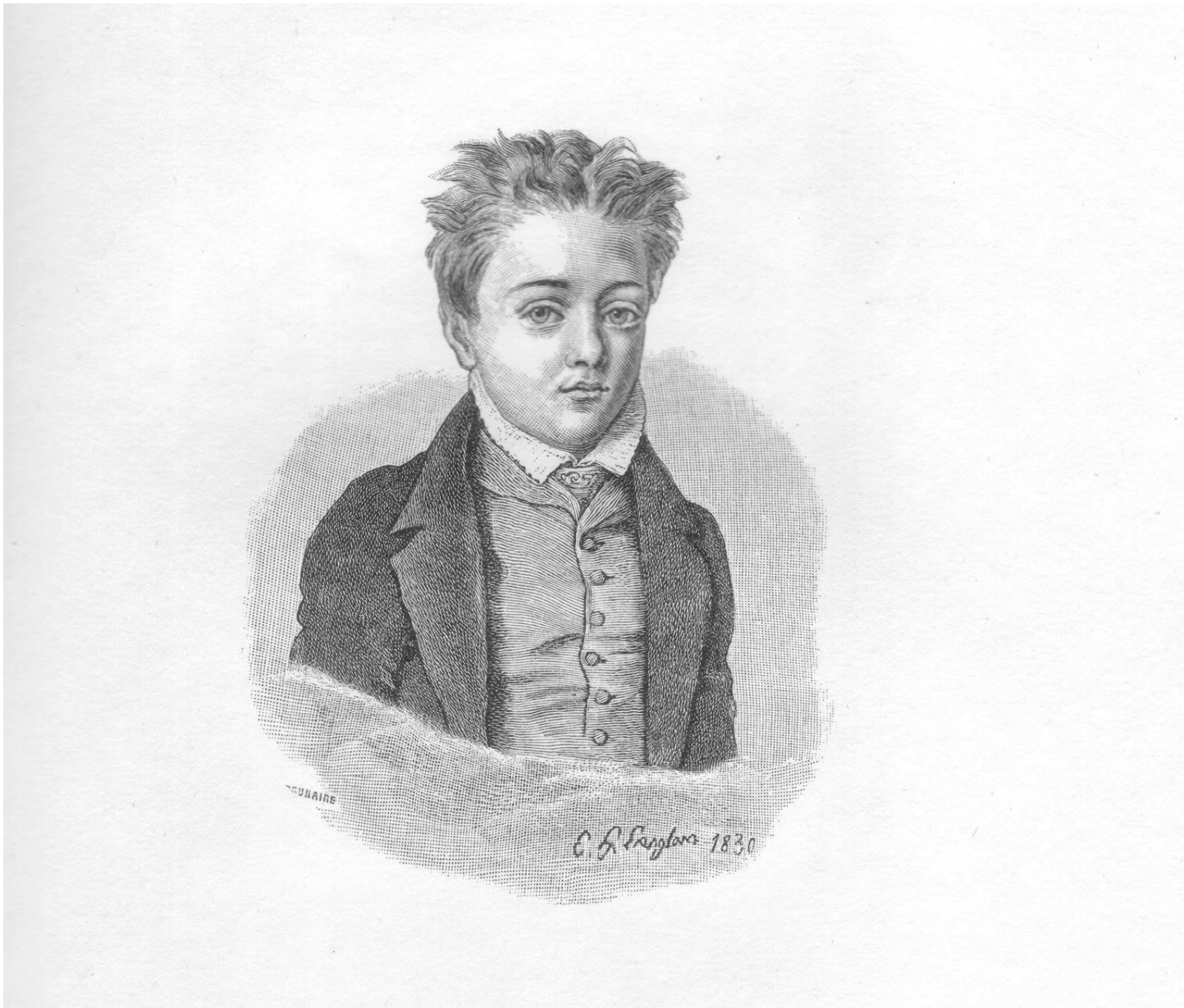
« Gustave Flaubert âgé de neuf ans » gravure d'après Eustache-Hyacinthe Langlois, 1830 musée Flaubert et d'histoire de la médecine CHU de Rouen