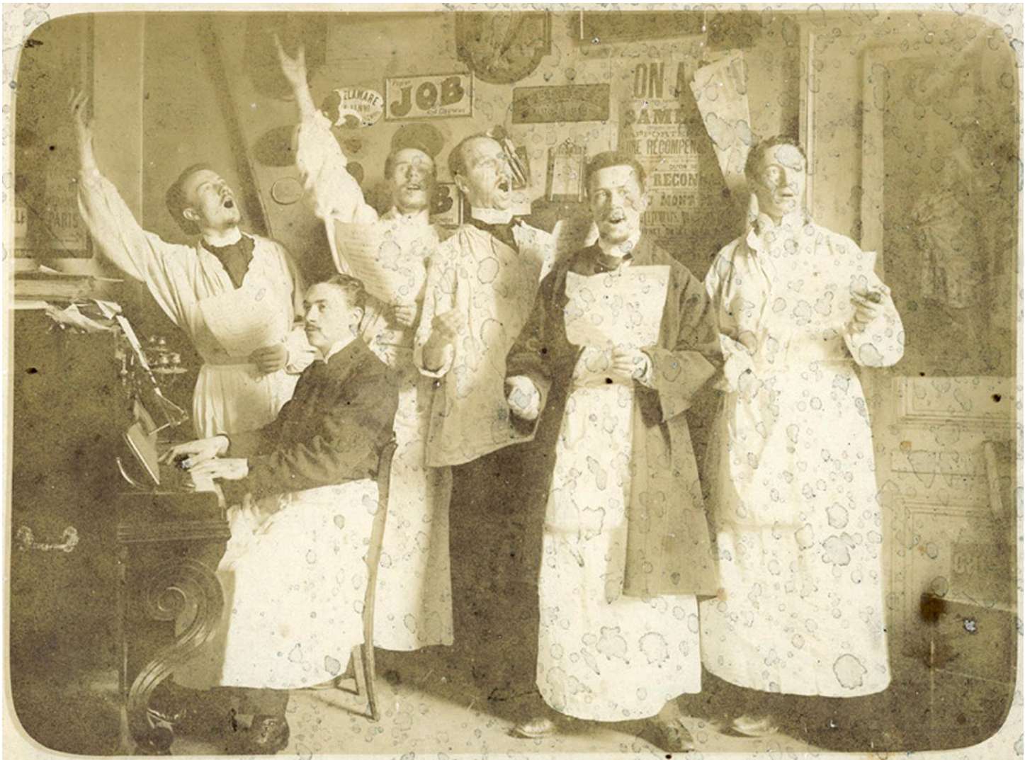
« La chorale des internes de l'Hôtel-Dieu de Rouen en 1899 », photographie originale, musée Flaubert et d'histoire de la médecine CHU de Rouen