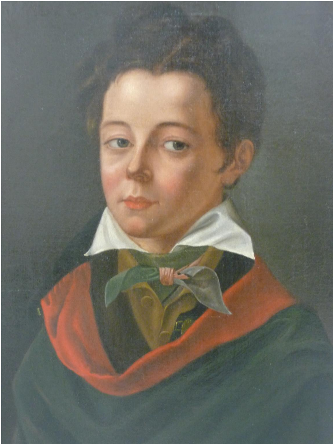
« Gustave Flaubert, portrait au ruban », anonyme, huile sur toile, vers 1833, reproduction d'après l'original conservé au musée Picasso, Antibes