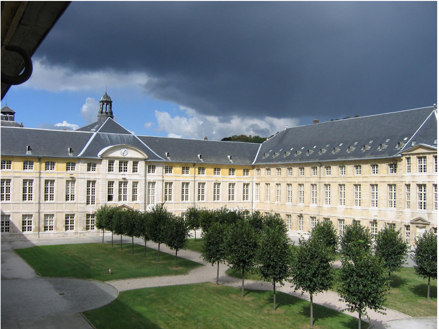
Vue de l'ancien Hôtel-Dieu de Rouen (actuelle préfecture de région)