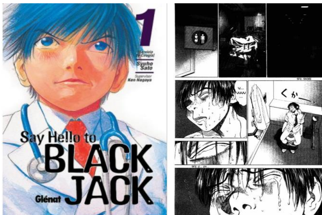
Image de gauche : couverture du tome 1, Say helle to Black Jack, Sato Syuho, Glénat. Image de droite : tiré du tome 2, chapitre 8.