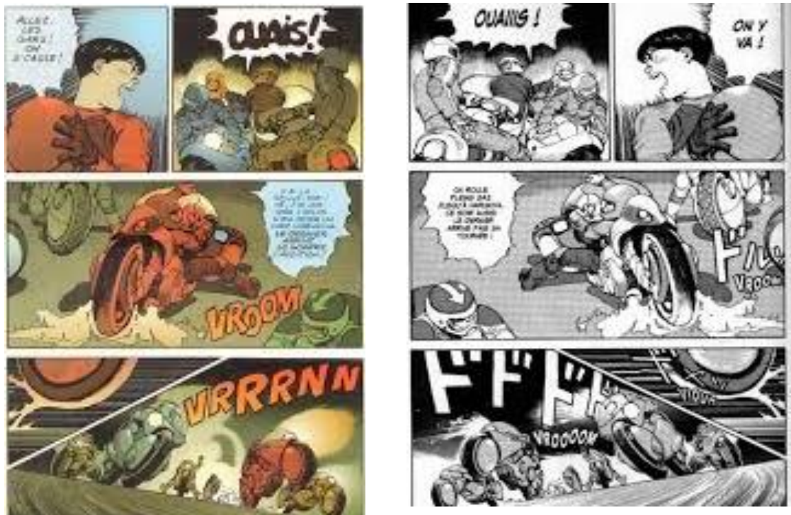
Image de gauche, tiré du volume 1 d' Akira dans sa version occidentale. Image de droite, même planche mais dans sa version japonaise.

Mais dans un second temps lors de la publication des premiers volumes de la série Dragon Ball , avec le même format que précédemment cité, les éditeurs japonais lancent un premier avertissement, ils souhaitent que les volumes publiés en France suivent exactement les mêmes codes, structures et découpages que ceux publiés au Japon. Jacques Glénat tente de résister, arguant que le public occidental n'est pas prêt pour une BD dans un format si différent de ses habitudes. Cependant, il doit se plier aux exigences pour conserver les droits d'exploitation de ces séries.