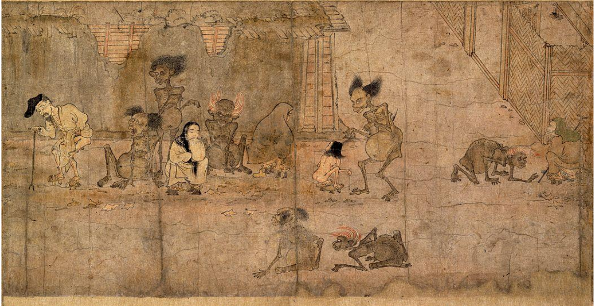
Scène de la vie quotidienne du peuple, hanté par les gaki (damnés dans le bouddhisme) tiré du Rouleau des fantômes affamés.

Les combats de pets dessinés au XII ème siècle par l'abbé Toba, les spectres mangeurs d'excréments du Rouleau des fantômes affamés (XII ème siècle) ou le grouillement des monstres de la Promenade nocturne des mille démons (XV ème siècle) peuvent choquer ceux pour qui la culture japonaise se résume aux fleurs de cerisiers et aux jardins de pierre... En réalité, à côté de la culture éprise de rigueur des élites, il existe depuis longtemps une culture japonaise populaire, exubérante et frondeuse, volontairement vulgaire, burlesque, accompagné de mélodrame, de sexe et de fantômes. Comme on peut le voir ci-dessus, des fantômes hantent des habitants, probablement pauvres, la plupart sont dénudés et dans des positions dégradantes.