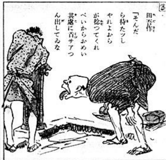
Tagosaku et Mokube visitent Tokyo, 1902, publié dans Jiji Manga; par Kitazawa Rakuten.