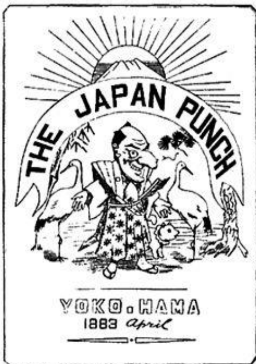
Charles Wirgman, caricaturiste londonien, publie le premier magazine au Japon, le Japan Punch , un mensuel publié de 1862 à 1887.

Le Japon découvre de son côté les techniques modernes d'imprimerie comme l'« offset », qui permettent des tirages massifs. Les premiers magazines illustrés, destinés aux expatriés occidentaux, furent bientôt copiés en grand nombre. À l'imitation des cartoons américains, les grands journaux lancèrent des suppléments illustrés du week-end. Le premier fut créé en 1900 par le grand réformateur Yukichi Fukuzawa et baptisé Jiji Manga .