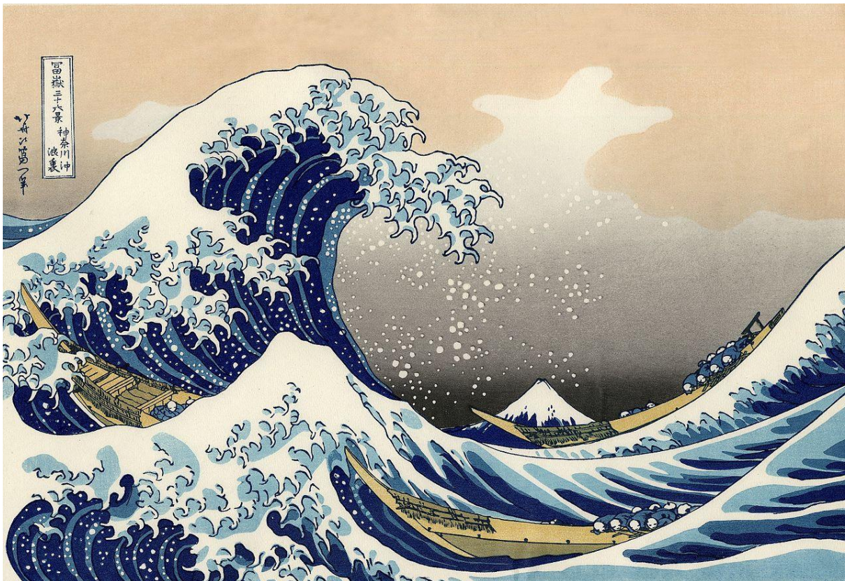
Grande vague de Kanagawa (1831), première des 46 estampes qui composent les 36 vues du mont Fuji.

Le terme « manga », signifiant littéralement « images dérisoires », aurait été inventé par le maître de l'estampe Hokusai pour désigner ses croquis et ses dessins « au fil du pinceau ». Cependant nous reviendrons plus tard sur la traduction du terme « manga » en France et de son utilisation dans la presse. Mais l'on comprend déjà assez bien que le fait de qualifier d'images dérisoires les œuvres japonaises résulte d'un parti pris anti-manga.