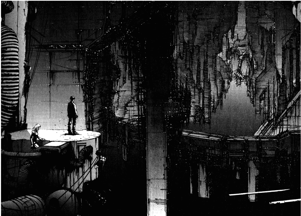
Image tiré du manga Blame ! de Tsutomu Nihei. Le dessin de cette artiste n'est pas à généraliser à tous les autres mangas, mais il est l'un de ceux avec l'ambiance artistique la plus sombre.

En effet, même si pour nous, occidentaux, le terme manga désigne toute la bande dessinée japonaise moderne, il n'en est pas ainsi. Le manga se décline en autant de genre qu'il est possible d'imaginer, on retrouve ainsi des histoires de fantaisie jusqu'à des BD de cuisine en passant par des œuvres qui ont pour thème un sport, un état d'âme, un métier particulier, etc. Tout cela étant découpé par âges, classe sociale et genre.