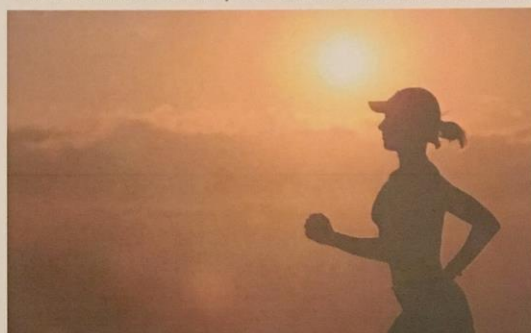
PROGRAMME SPORTIF / SOUTIEN CHANGEMENT DE VIE