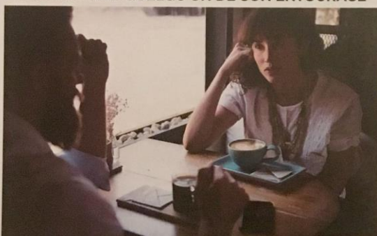
SOUTIEN PAR QUELQU'UN DE SON ENTOURAGE