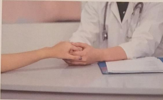
ACCOMPAGNEMENT PROFESSIONNEL DE SANTÉ