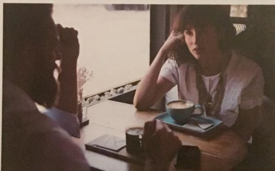
SOUTIEN PAR QUELQU'UN DE SON ENTOURAGE