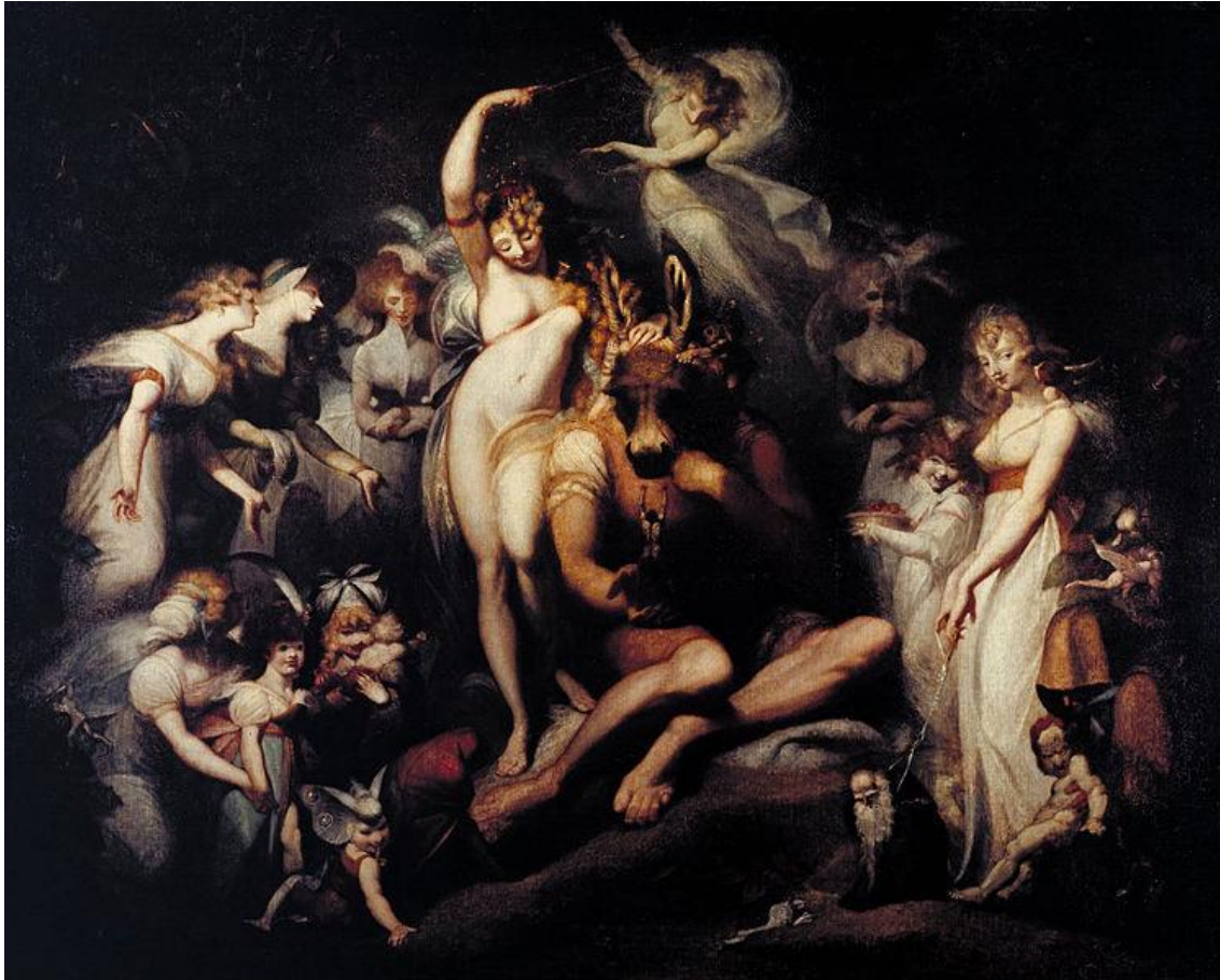
Tableau 3 FÜSSLI Henry. Titania caresse Bottom à la tête d'âne , 1780-90, huile sur toile, (216 × 274), Londres, Tate Gallery.

Cet esprit et cette capacité à faire s'évader le spectateur se retrouvent dans bon nombre des œuvres de Füssli, si ce n'est l'intégralité de son œuvre. Titania caresse Bottom à la tête d'âne (1780-1790), et le Réveil de Titania (1785-1790) en sont les meilleurs exemples. Ces deux toiles qui sont à étudier en miroir, sont respectivement les deuxièmes et troisièmes toiles de la Boydell Gallery. Füssli peint alors le pendant et l'après du « rêve » de Titania, ou plutôt de son délire onirique. Car en plus d'être soumise à l'influence du nectar de la « pensée d'amour » dont Oberon humecte ses paupières, créatures fantastiques et effrayantes se mêlent, faisant ainsi de ces toiles d'authentiques spectacles, pour ne pas dire une véritable orgie visuelle. Les personnages sont, en effet, nombreux et le spectateur ne peut pas vraiment les distinguer, effet probablement souhaité par l'artiste, car le halo de lumière éclaire uniquement les protagonistes principaux : Titania et Bottom (pour Titania caresse Bottom à la tête d'âne ), ou encore Titania et Oberon (pour le Réveil de Titania ). Le reste des personnages se trouvent dans la pénombre, à peine discernables les uns des autres. Certains nous observent même, tapis dans l'ombre comme Bottom, créature mi-humaine, mi-animale. Alors que Titania, soudainement