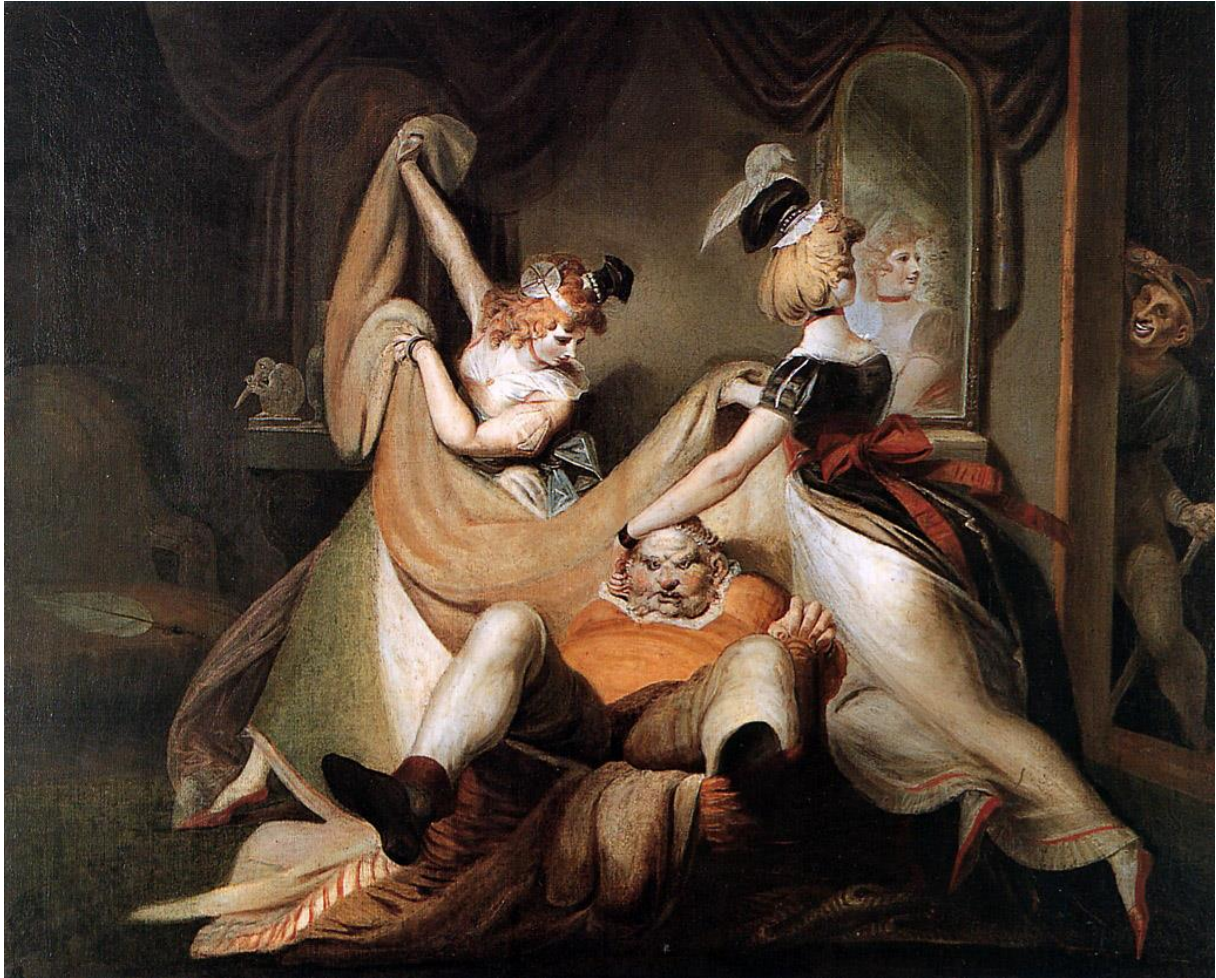
Tableau 30 FÜSSLI Henry. Falstaff dans le panier à linge , 1792, huile sur toile, (137 × 170), Zürich, Kunsthaus.

Dans le voyeurisme, on peut également intégrer les jeux de miroir. Le miroir sert à s'observer soi-même, mais aussi les autres. C'est un outil qui permet de voir là où l'on ne peut pas, derrière soi par exemple. Il prévient tout autant d'un danger qu'il permet d'épier. La simple présence de cet objet banal du quotidien est chargée symboliquement. Car le miroir est synonyme de « vérité » et de « sincérité 37 ». Il est supposé refléter l'âme. Alors lorsqu'il renvoie le reflet d'un personnage, cette signification est décuplée car ce n'est plus simplement un symbole de vérité, il devient le miroir de nos pulsions. Le miroir de notre « Moi 38 » illusoire, bien que les pulsions ne soient pas le « Moi ». Illusoire car cette conscience n'est plus que partielle, elle n'est que surface. Elle est un film entre la réalité et la plongée dans le miroir de l'inconscient. Lorsque l'on observe les personnages dépeints par Füssli, cela est encore plus frappant car ces protagonistes reflètent généralement ce qu'il y a de plus pervers en nous. Une des représentations de miroir se trouve dans Falstaff dans le panier à linge (1792), scène des