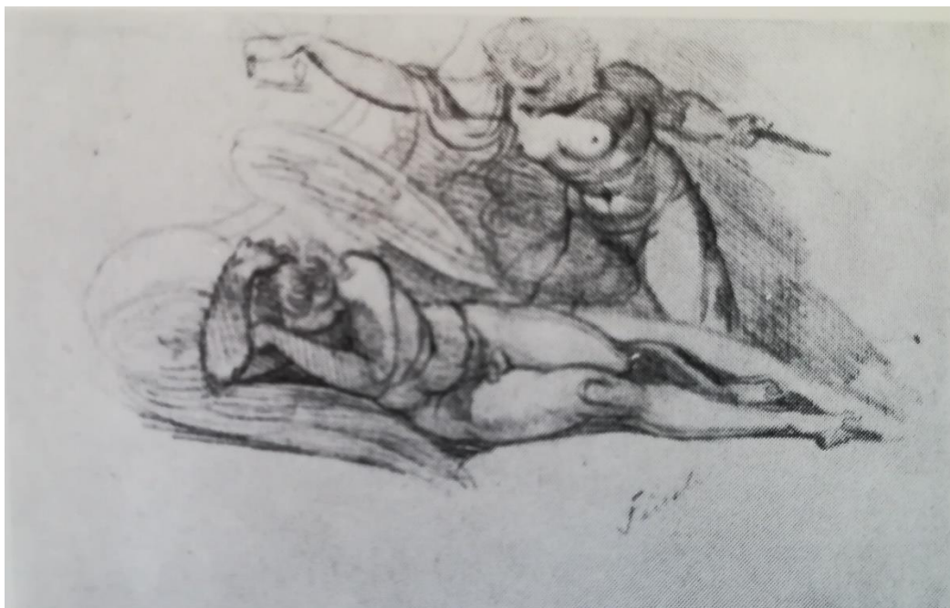
Tableau 14 FÜSSLII Henry. Psyché contemple l'amour à la lueur d'une lampe, 1770-1778, pierre noire sur papier, (187 × 267), Zürich, Kunsthaus.