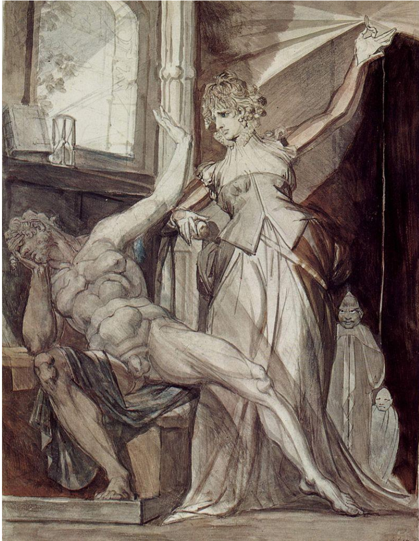
Tableau 24 FÜSSLI Henry. Kriemhilde montre à Hagen l'anneau des Nibelungen , 1807, aquarelle et crayon sur carton, (500 × 384), Zürich, Kunsthaus.

serait alors possible qu'en évitant le regard de l'autre, objet de notre propre regard, pouvant nous renvoyer notre image d'objet désirant. Être fasciné, c'est être saisi, immobilisé et donc pétrifié par l'objet visé.