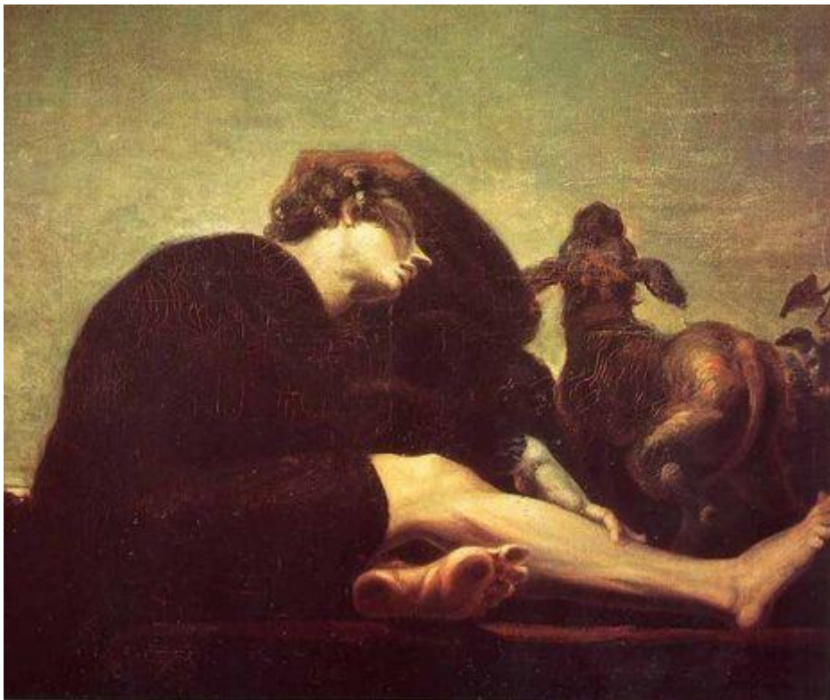
Tableau 17 FÜSSLER Henry. Solitude à l'aube , 1794-96, huile sur toile, (95 × 102), Zürich, Kunsthaus.