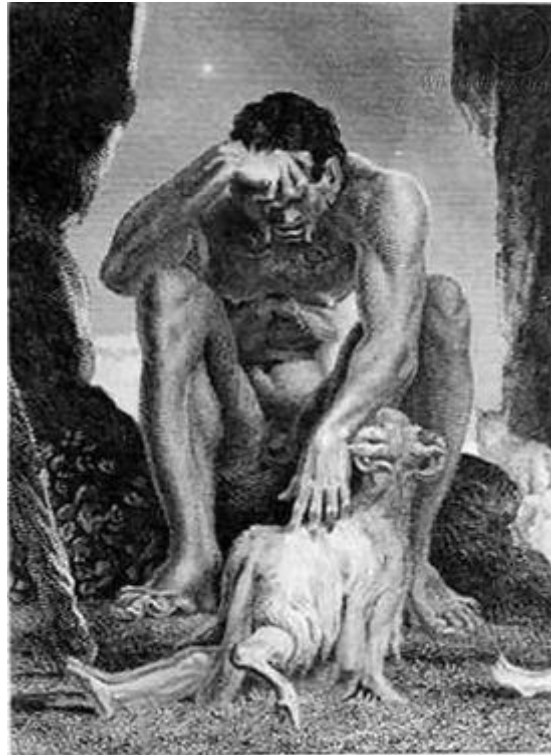
Tableau 28 FÜSSLI Henry. Polyphème aveuglé tête, sur seuil de sa grotte, le bélier sous lequel est caché Ulysse , 1803, huile sur toile, (91 × 71), Zürich, collection particulière.

Kriemhilde incite, il séduit notre pulsion scopique qui ne demande qu'à voir ce qui se passe derrière.