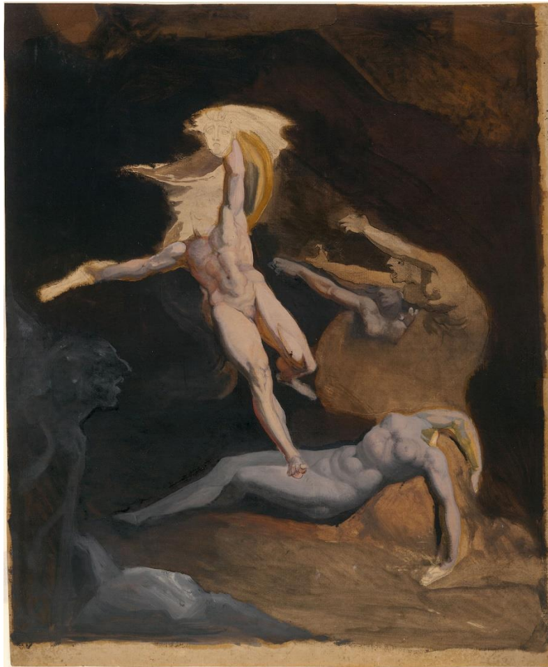
Tableau 23 FÜSSLII Henry. Persée s'envole de la grotte de la gorgone , 1816-1817, huile sur toile, œuvre perdue.

démembrement aura lieu. Ajouté à cela, la vision de l'artiste des femmes dominantes, Méduse semble être toujours impliquée quelque part dans l'art de Füssli. On peut en effet, expliciter le propos en s'appuyant sur l'extrait même du poème de Milton. Il est question de "secret" et d'"eclipses", de ce qui est caché donc. L'on retrouve, là encore, le goût pour l'interdit. Cacher, c'est aussi s'interposer, bloquer la vue, séparé, couper. L'on a donc une notion de séparation, de découpage, de scission dans le poème, que Füssli parvient parfaitement à transposer sur la toile : il effectue une castration visuelle symbolique.