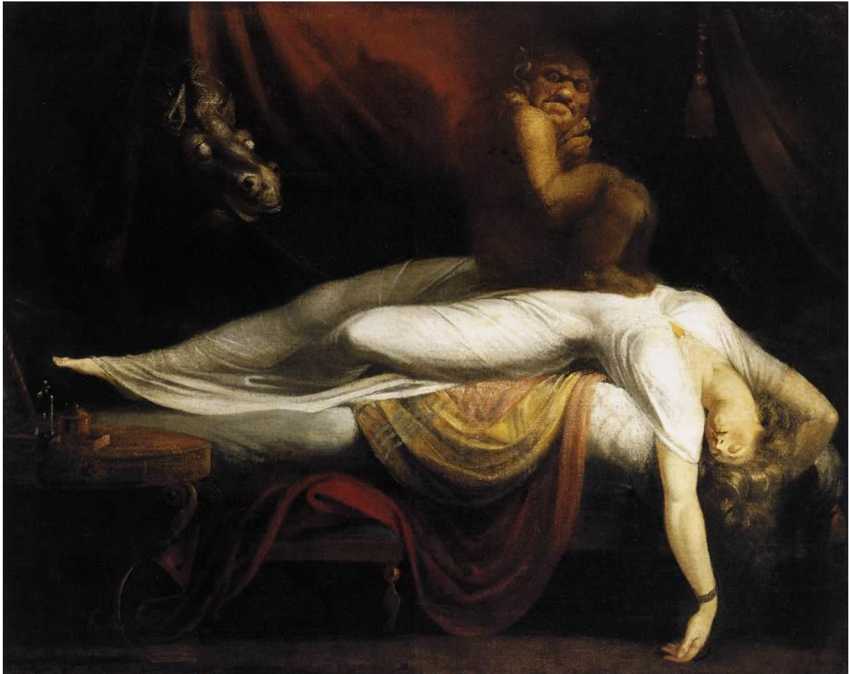
Tableau 21 FÜSSLI Henry. Le Cauchemar , 1781, huile sur toile, (101.6 × 127 cm), Detroit, Detroit Institute of Arts.

également renvoyer au sublime et ainsi servir de qualificatif afin de décrire la nature excessivement imposante de quelque chose. On retrouve alors ce lien avec l'effroi. Il existe également une connotation morale dans l'utilisation de ce terme, comme ayant « atteint un degré extrême dans le mal 46 ». Monstrueux, c'est aussi « monstrare » en latin, c'est montrer, désigner, afficher, pointer du doigt comme le font les trois sorcières de Macbeth. Et ce « montré » du doigt, attire l'attention, attire le regard. C'est aussi en cela que le monstrueux est lié de façon si ténue au regard : le monstrueux captive.