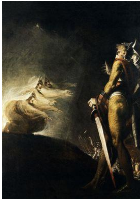
Tableau 4 FÜSSLI Henry. Les Trois sorcières apparaissent à Macbeth et Banquo , 1793-1794, huile sur toile, (167 × 134), Petworth House, Wyndham.

En matière de fantasmagorie, Füssli ne connaît pas d'égal, du moins face à ses pairs qui ont également contribué à la Boydell Gallery. Cela est d'autant plus frappant lorsqu'il choisit