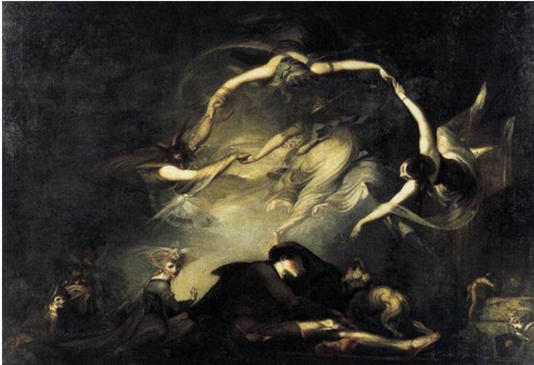
Tableau 7 FÜSSLI Henry. Le Songe du berger , 1793, huile sur toile, (154,5 × 215,5), Londres, Tate Gallery.

At once with joy and fear his heart rebounds 14 .”