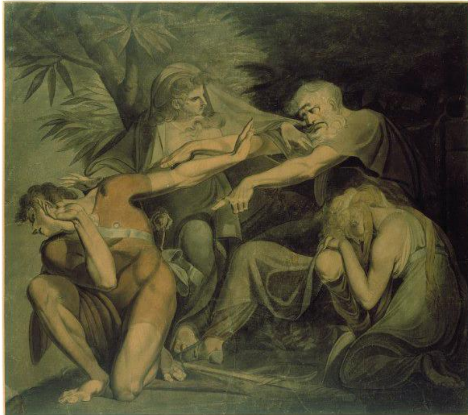
Tableau 12 FÜSSLI Henry. Œdipe maudit son fils Polynice , 1786, huile sur toile, (145 ×164,5), Etats Unis, coll. part.