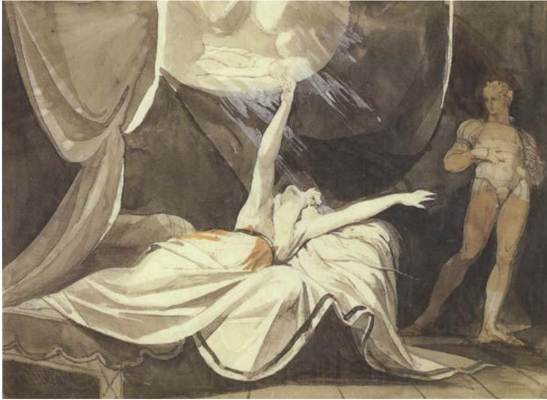
Tableau 9 FÜSSLI Henry. Kriemhilde voit en songe Siegfried mort , 1805-10, huile sur toile, (385 × 485), Zürich, Kunsthaus.

Kriemhilde voit en songe Siegfried mort (1805-1810) est la toile paraissant la plus accessible pour débiter une étude des toiles de Füssli sur ce sujet. Kriemhilde est représentée en train d'avoir une vision de Siegfried, mort, vision représentée au-dessus d'elle, qu'elle touche du bout des doigts. Sa vision est là, tangible, il y a quelque chose qui relève du tactile dans les représentations de la vision par Füssli, parce que cela met systématiquement en exergue les êtres désirants que nous sommes. Car comme cela a été mentionné, voir relève aussi du tactile. Kriemhilde est étendue dans une pose très dramatique, collant un peu plus à ce que l'on connaît de Füssli en termes de représentation de dormeur et de cauchemars 20 . Kriemhilde étant le sujet principal de la toile, c'est elle qui est mise en avant, là encore par une utilisation judicieuse du clair-obscur : son corps mais aussi son songe, sont entourés de lumière. Dans l'ombre, Gunther l'observe, il a l'air à la fois surpris et préoccupé de voir Kriemhilde si dérangée dans son sommeil. Peut-être comprend-il à ce moment qu'elle a découvert l'identité des meurtriers de Siegfried ? La toile est en effet une bonne porte d'entrée dans le mythe, car elle recoupe de nombreuses caractéristiques de l'art de Füssli, comme le surnaturel, ici entièrement lié à la rêverie. La rêverie est non seulement représentée en même temps que le