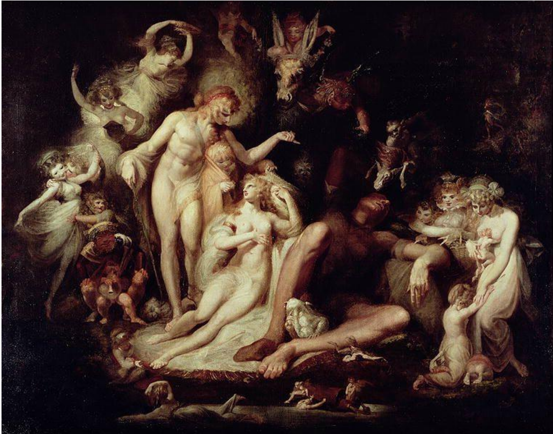
Tableau 2 FÜSSLER Henry. Le Réveil de Titania , 1785-1790, huile sur toile, (222 × 280), Winterthur, Kunstmuseum.

dépourvu d'intérêt bien entendu car, au-delà de faire partie de la scène, il la contextualise et permet au spectateur de s'immerger complètement dans le monde imaginé par Shakespeare : les créatures, la végétation florissante, l'océan en arrière-plan comblent le désir d'évasion de l'esprit romantique.