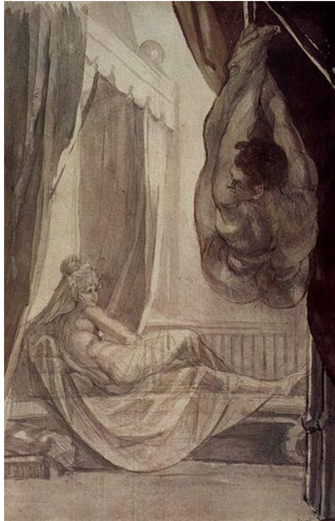
Tableau 10 FÜSSLI Henry, Brunhilde contempe Gunther suspendu au plafond , 1807, crayon, plume, encre, aquarelle sur papier, (483 × 317), Nottingham, Castle Museum.

abysses, c'est la vision d'une profondeur à la fois géographique, temporelle, spirituelle et émotionnelle. C'est la projection par l'artiste, pour le spectateur, d'une réalité autre.