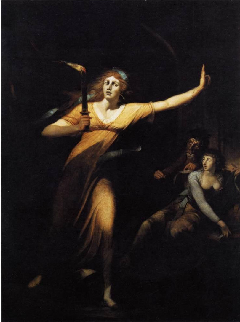
Tableau 20 FÜSSLI Henry. Lady Macbeth somnambule , 1781-1784, huile sur toile, (221 × 160), Paris, Louvre.

Une pièce qu'il est intéressant d'étudier au regard de l'effroi, des angoisses et de la nuit, est Macbeth (1606). Cela se manifeste de façon assez parlante avec le personnage de Lady Macbeth, à côté duquel Füssli ne peut passer en termes de représentation de l'irrationnel. Il a produit une toile qui se prête très bien au jeu de l'étude des angoisses et terreurs du personnage, intitulée Lady Macbeth somnambule (1784), sur laquelle il est possible de voir Lady Macbeth, somnambule en train d'errer dans le château, portant dans une main un flambeau. Le tableau dépeint donc la dernière apparition de Lady Macbeth sur scène, se déroulant lors de l'Acte V scène 1. Le docteur et la dame de compagnie présents dans le coin inférieur droit de la toile semblent n'être là que pour aiguiller le spectateur sur la scène dont il est question. Toutefois, l'on peut noter l'aspect horrifique du visage du docteur qui semble avoir perdu toute trace d'humanité : il rajoute une dose supplémentaire d'horreur et d'absurdité au spectacle. En effet, le docteur est l'esprit rationnel par excellence. Ainsi, en le dépeignant, Füssli remet totalement