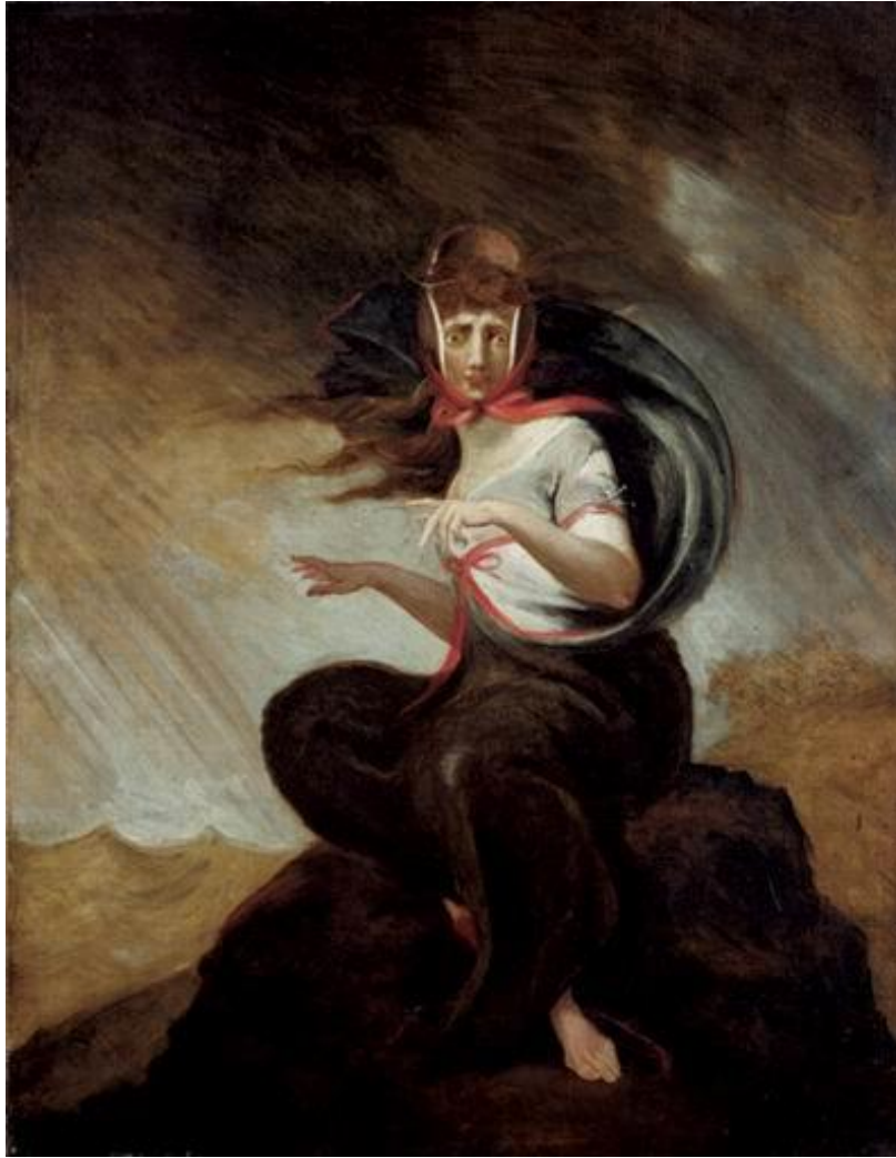
Tableau 19 FÜSSLI Henry. La Folie de Kate , 1806-1807, huile sur toile, (92 × 72,3), Francfort-sur-le-Main, Goethe-Museum.

Ceci est notamment le cas pour La folie de Kate (1806) créée pour le poète William Cowper dans le cadre de son œuvre The Task (1785). Füssli choisit de s'inspirer de l'œuvre de Cowper, majoritairement car il s'agit d'un poème extrêmement populaire à l'époque. Comme avec Milton, il fait le choix de dépeindre un morceau très court du poème. L'extrait, et donc la toile, porte sur une jeune femme, Kate, qui perd la raison après avoir appris que son fiancé a perdu la vie en mer. L'artiste la représente accroupie sur un rocher que l'on devine en bord de mer, dont il est possible de distinguer les vagues en arrière-plan. Tout dans sa représentation la porte à la limite de l'humanité : la position particulière de son corps ainsi que de ses doigts et plus particulièrement, son regard. Sa posture presque surnaturelle évoque de façon quasi-inévitable la position de l'incube que l'on peut trouver dans la toile du Cauchemar mettant de cette façon l'emphase sur le caractère irrationnel, presque surnaturel, de Kate.