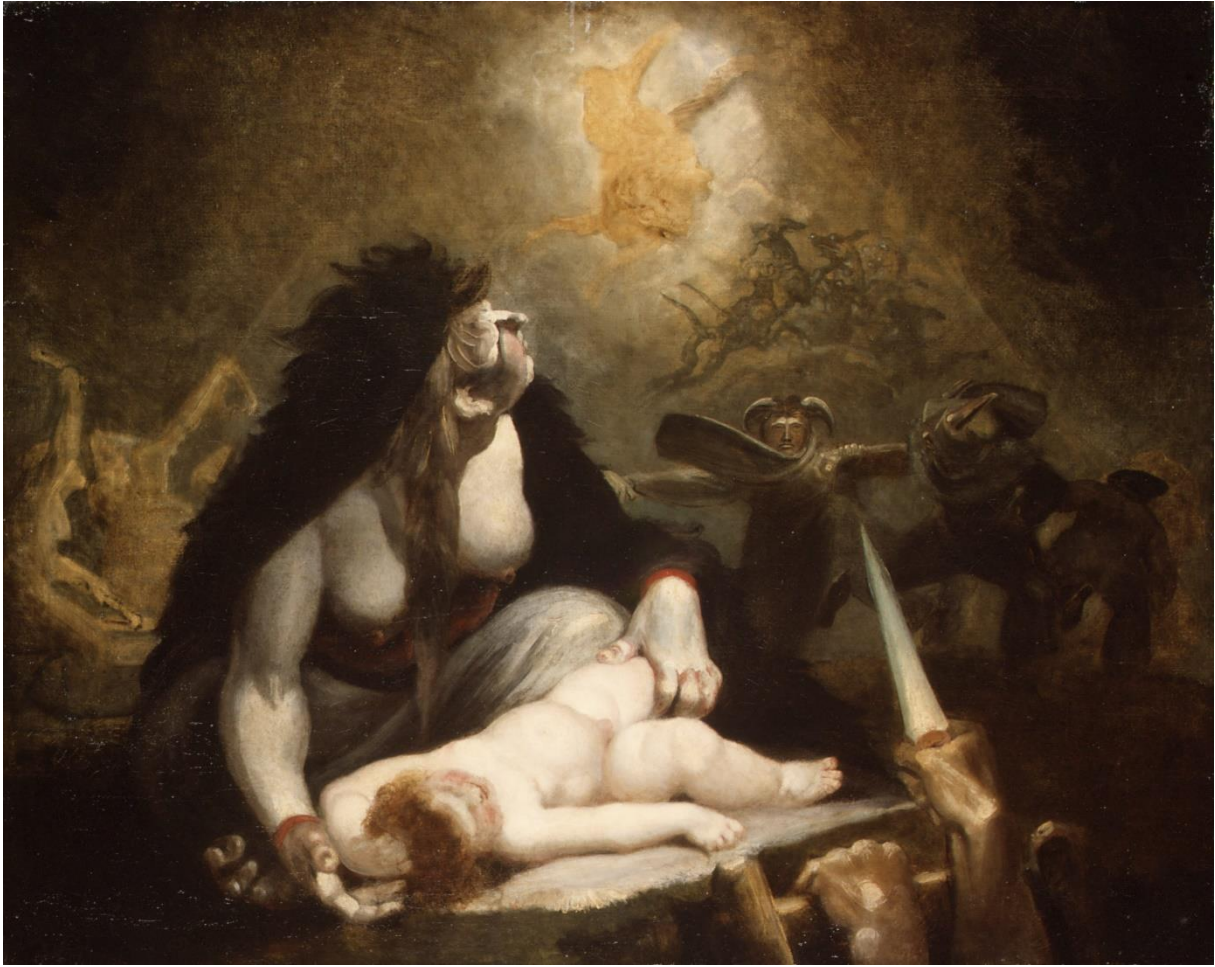
Tableau 22 FÜSSLI Henry. La Mégère de la nuit rendant visite aux sorcières de Laponie , 1796, huile sur toile, (101,6 × 126,4), New York, The Metropolitan Museum of Art.

Cette définition riche est très complète au vu de deux toiles de Füssli : le Cauchemar et la Mégère de la nuit rendant visite aux sorcières de Laponie (1796). Les deux toiles sont intéressantes à étudier l'une à la suite de l'autre car elles comportent des éléments de ressemblance dans leur composition, mais dans leurs titres également. En effet, dans leur langue originale, les tableaux sont respectivement intitulés The Nightmare et The Night-Hag Visiting Lapland Witches 47 . La « nuit » est alors récurrente avec la répétition de “night” dans les deux tableaux. On a donc une fois encore, une référence à cette « incomplétude inconsolable 48 » que nous procure la nuit. Par ailleurs, comme cela a été précisé antérieurement, il est possible de voir dans la figure de la sorcière (ou fée) qui monte son cheval dans la nuit, la personnification du cauchemar. On a alors une analogie entre le titre même du tableau, le cheval qui le compose,