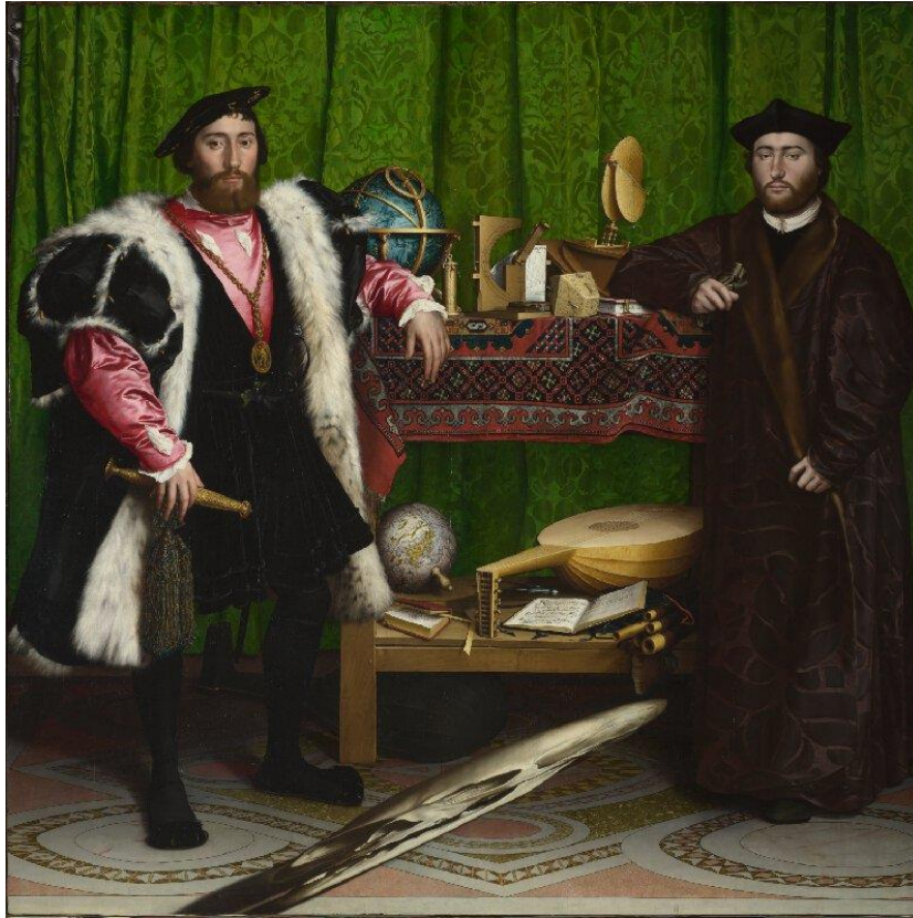
Tableau 29 HOLBEIN LE JEUNE Hans. Les Ambassadeurs , 1533, huile sur panneaux de chêne, (207 x 209), Londres, National Gallery.

Le point de fuite peut aussi être, un peu paradoxalement, le point aveugle de la toile. C'est ce point dépourvu de photorécepteurs : c'est l'endroit où l'on ne voit pas. Ainsi, on peut essayer de trouver là une corrélation avec l'explication que l'on a fournie sur le point de fuite, car finalement on ne voit pas grand-chose : soit le flou (pour la mégère), soit le rien (pour l'anneau). Cela reste cet espace que l'on ne peut pas voir mais que l'on a envie de voir. On observe que cet aspect n'est pas que particulier à Füssli, mais à la peinture dans son ensemble. Pour illustrer le propos, on peut ici mentionner un tableau très connu : Les Ambassadeurs (1533) par Hans Holbein le Jeune. En effet, cette toile est renommée pour son très célèbre point aveugle qui se trouve également être une anamorphose. Il est évidemment chargé de sens sur lequel on ne s'attardera pas vraiment, mais ce qui est pertinent et corrobore l'argument ici, c'est qu'il s'agit du point dans le tableau par lequel nous sommes immédiatement attiré, sans pour autant réellement savoir ce qu'il représente. C'est le désir d'une jouissance qui ne peut être porté à la visibilité et ne peut être matérialisé que par l'indistinction du flou. C'est l'image par excellence de la castration visuelle, c'est là que vient se loger l'essence même de la relation entre l'artiste et son objet.