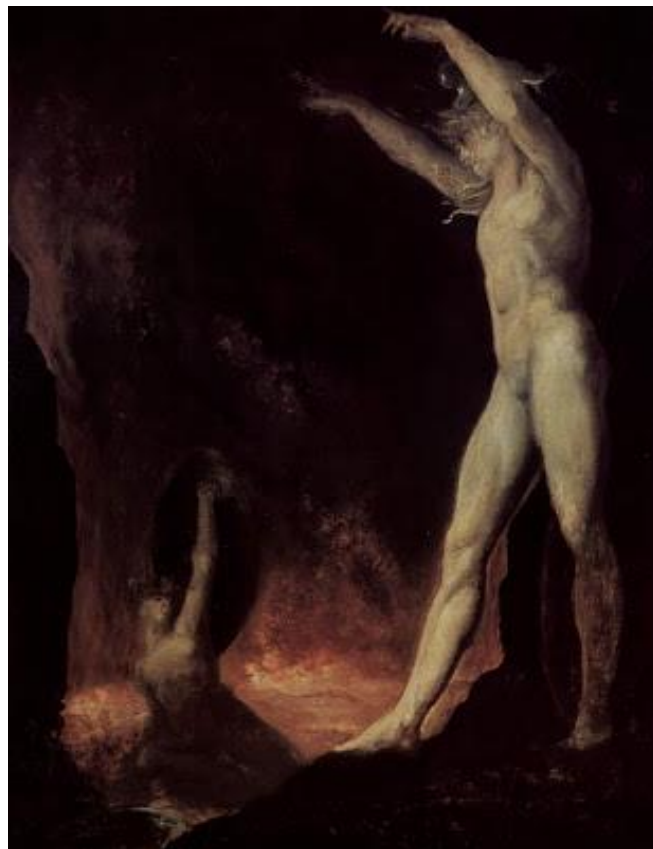
Tableau 6 FÜSSLI Henry. Satan invoquant Belzébuth sur la mer de feu , 1797-1799, huile sur toile, (442 × 366), Stratfield Saye, duc de Wellington.

poème épique en allemand, donnant à son élève le goût pour la littérature britannique. C'est grâce à ces discussions avec son professeur que Füssli conservera « la marque » Milton sur lui tout au long de sa carrière. L'évènement le plus notable en la matière est la création de sa Milton Gallery. Très influencé par la Boydell Shakespeare Gallery inaugurée en 1789, il s'en inspire et, en 1790, décide de dédier toutes ses prochaines toiles au sujet. Il sera d'ailleurs le seul artiste à travailler sur le projet 11 ). Le projet est titanesque, à la mesure du poème dont il s'inspire, et les toiles sont nombreuses, quarante-sept en tout 12 . La galerie ouvre en 1799, mais ne rencontre cependant pas le succès attendu par l'artiste ; il s'agit même d'un échec total. Le public n'est pas du tout réceptif, et le sujet du Paradis Perdu ne fait pas l'unanimité, jugé peu pertinent et élitiste à certains égards. Toutefois, les toiles de cette galerie, nombreuses, se trouvent être un formidable vivier permettant de mieux comprendre l'artiste, et notamment d'expliquer son rapport à la vision et ce en quoi elles font écho à celles de la Boydell Gallery.