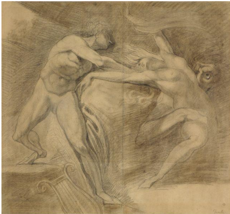
Tableau 13 FÜSSLII Henry. Tandis qu'elle s'apprête à quitter le royaume des morts, Eurydice est ravie à Orphée par Hadès , 1780-1785, plume, encre, crayon sur carton, (187 × 187 mm), lieu inconnu.

représenter une partie « populaire » du mythe. L'on pourrait attendre le moment de la révélation de son identité, par exemple, ou encore celui où il se perce les yeux. Mais Füssli choisit de dépeindre Œdipe aveugle et dans une position prophétique, comme pour mettre l'emphase sur le fait qu'il n'y a que celui qui ne voit dans le réel qui est capable de vision. La vision, comme l'art, ne serait-elle pas alors un moyen de se retirer du monde ? Un moyen de permettre cette introspection et cette clairvoyance dont Œdipe fait preuve, comme pour empêcher la reproduction de son erreur. Ainsi, la vision serait cette porte d'entrée sur l'altérité, sur autre chose : c'est une forme de clairvoyance.