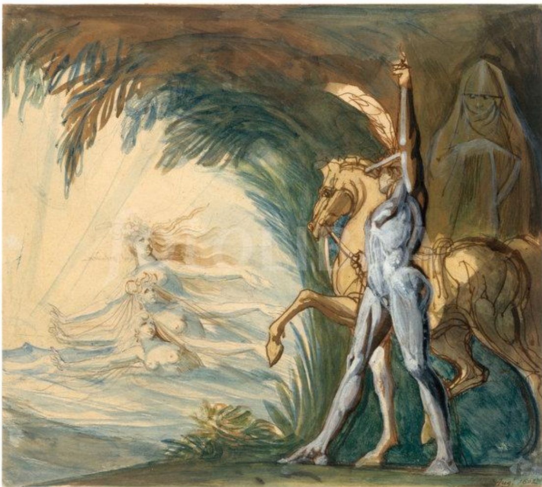
Tableau 11 FÜSSLI Henry, Hagen et les nymphes du Danube , 1802, plume, crayon et aquarelle sur papier, (312 × 336), New Orleans, Levy.

effet, le simple fait de représenter une femme, adoptant une position dominante sur un homme, d'autant plus un homme qui s'avère être le roi des Burgondes, dans le cadre de la chambre à coucher, comporte une dimension de transgression qui n'est pas pour déplaire à l'artiste. On est dans un cadre diamétralement différent (et parfaitement violé) de l'éducation littéraire qu'a pu recevoir Füssli de la part de Bodmer. Ces divers facteurs et interrogations amènent donc à penser que cette toile, et ce sujet, des Nibelungen puisse trouver sa place en tant que préambule au courant romantique, puisque l'on est ostensiblement en présence d'un désir d'aller au-delà de la raison, et de dévoiler ce qu'il se passe dans les profondeurs du visible. Le but est ici d'accéder à ce qui est normalement prohibé, au risque d'excéder ou choquer l'amateur d'art.