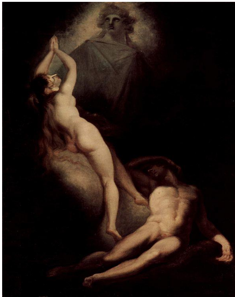
Tableau 8 FÜSSLII Henry. Le Songe d'Eve , 1796-99, huile sur toile, (102 × 96), détruit dans un bombardement à Londres.

demander à ses spectateurs si l'artiste n'a effectivement pas effectué un hors-sujet. Il fait le choix délibéré de refuser ce qui peut le plus se rapprocher de la réalité (donc un sujet biblique), et représente alors l'irréel, le surnaturel. Ici, ce que Füssli retient de Milton c'est la notion de « moment-limite ». En effet, le songe représente un moment particulier, car il est celui de l'endormissement, un espace-temps limite dans lequel s'épanouissent les romantiques dans leur quête des origines. Par ailleurs, il est nécessaire de faire un commentaire sur la répétition de "see" dans le passage cité, qui révèle l'intérêt pour l'artiste de représenter cette partie du poème. La vision est toujours présente, et rejoint bien cette idée selon laquelle le rêve, le cauchemar, et plus largement l'imaginaire, sont des formes de visions permettant d'accéder à un autre monde (Milton parle de « voir le rêve »), une réalité différente, de toucher du doigt, ou plutôt du regard, ce qui n'est que pure évanescence. Le « toucher » et la vision sont par ailleurs, intrinsèquement liés par le geste d'une des fées qui semble vouloir toucher du bout des doigts le rêve du berger : c'est la main tendue de l'inconscient vers le conscient.