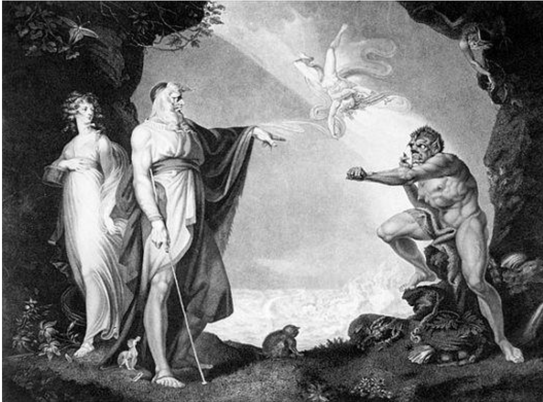
Tableau 1 FÜSSLI Henry. Prospero et Miranda, Ariel et Caliban , 1789, huile sur toile, dimensions inconnues, œuvre perdue.

L'idée de départ de John Boydell est donc de remettre au goût du jour la peinture d'histoire, mais plus largement, de redonner de la vigueur à l'art britannique. Ce projet prend vie en mai 1789, année charnière et tumultueuse en Europe.