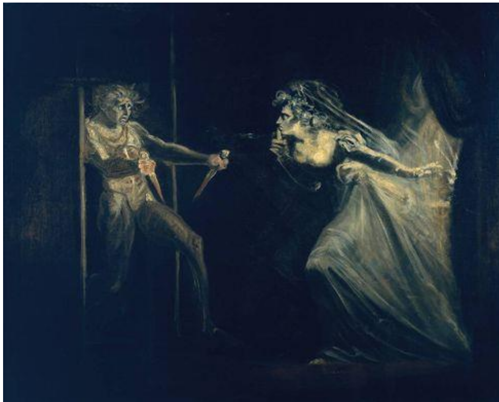
Tableau 18 FÜSSLI Henry. Lady Macbeth saisissant les poignards , 1812, huile sur toile, (1016 × 1270), Londres, Tate Gallery.

En effet, celui-ci a été le premier à théoriser et à cartographier le psychisme humain. Il le divise en deux parties principales et deux sous parties. Pour résumer, on retrouve en premier lieu le conscient et le préconscient (barrière poreuse avec le conscient), puis l'inconscient et la censure (couvercle se posant sur l'inconscient et permettant de le maintenir scellé). Dans le cas de la folie, il est possible de penser que le couvercle de la censure entre l'inconscient et le conscient soit maintenu ouvert, permettant ainsi aux pulsions et comportements censurés de s'échapper et de se concrétiser dans le réel. On a alors un modèle concret de l'irrationnel dans le réel. A ce stade, il est pertinent de combiner notre propre réflexion aux travaux de Freud, notamment en matière de pulsion et du travail de l'inconscient. La folie n'est alors pas entendue au sens médical dans ce cadre-ci, mais plutôt dans le sens de l'analyse du psychisme. Elle est en ce cas perçue comme une source de libération des pulsions et désirs inconscients, elle est libératrice de l'irrationnel. Comme cela a été développé plus haut, le surnaturel occupe une place de choix dans l'inspiration artistique de Füssli et notamment par le biais d'auteurs qui l'inspirent, comme William Shakespeare.