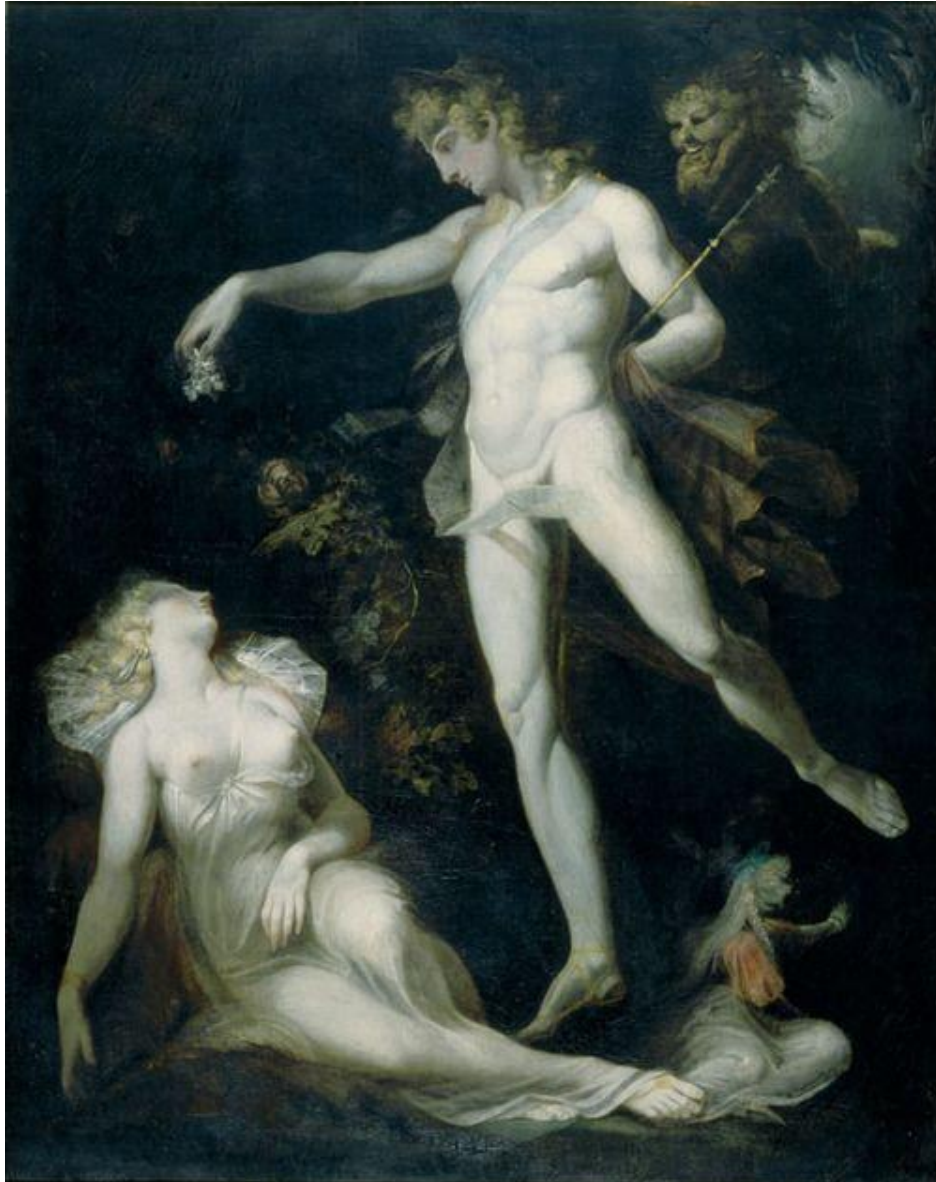
Tableau 25 FÜSSLI Henry. Oberon humecte de suc de fleurs les paupières de Titania endormie , 1793-94, huile sur toile, (169 × 135), Wangen bei Olten, Frey.

Füssli, maître des songes et des cauchemars, aime à plonger ses personnages dans une certaine léthargie, il aime faire dormir les habitants de ses toiles. Le sommeil peut tout à fait être considéré comme une forme de pétrification. Même s'il ne la transforme pas en pierre, il met le corps dans un état végétatif, le corps devient ainsi de trop, inutile. Le sommeil, et les rêves et cauchemars, pétrifient le dormeur par le « regard » de l'inconscient, le regard des rêves. Car les songes font passer une partie de l'inconscient dans le conscient, ils permettent d'apaiser les tensions du désir. En cela, ils sont un moyen direct d'avoir une vision plus ou moins nette de l'inconscient. C'est ainsi que l'on se retrouve pétrifié, pour avoir eu une vision de nos pulsions et désirs enfermés dans l'inconscient. Le choix de toiles est large en ce sens dans l'œuvre de Füssli. En cela, Oberon humecte les paupières de Titania (1793-1794) se trouve être