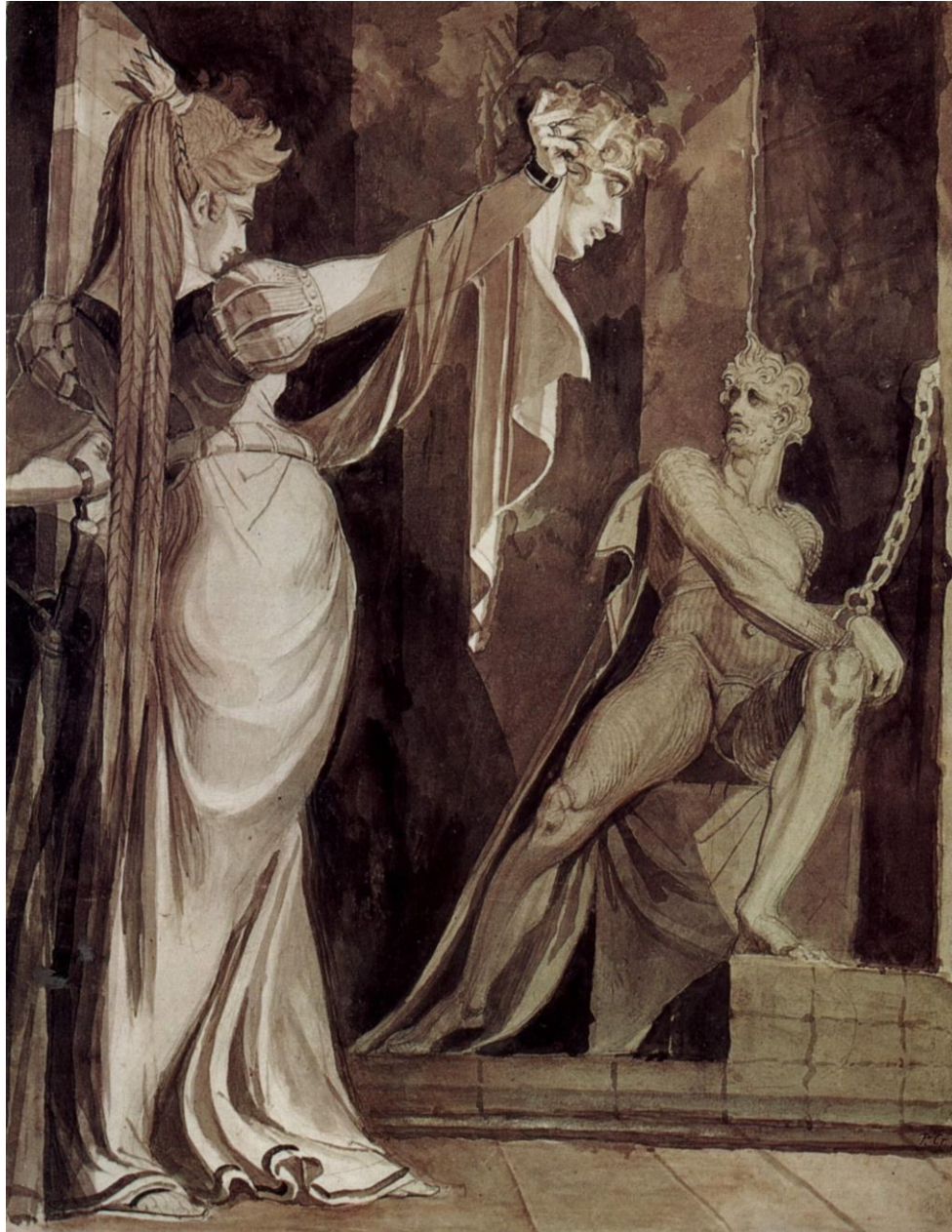
Tableau 27 FÜSSLI Henry. Kriemhilde montre à Hagen la tête de Gunther , 1805, crayon et aquarelle sur carton, (488 × 387), Zürich, Kunsthaus.

Ainsi, Kriemhilde montre à Hagen la tête de Gunther (1805) permet une différente approche de l'art de Fuseli. Tel Persée en sortant de la grotte de la gorgone, Kriemhilde brandit fièrement la tête de son ennemi à son adversaire. Gunther qui, s'est allié à Hagen pour commettre le meurtre de Siegfried, époux de Kriemhilde. Cette toile a tout pour rappeler le mythe de la gorgone. D'une part, parce que là encore, la tête coupée de Gunther nous évoque l'image la Méduse 11 : avec ses yeux morts et l'entremêlement de ses cheveux pouvant évoquer l'entrelacs de serpents de la taie de la gorgone. D'autre part, parce que la posture de Kriemhilde,