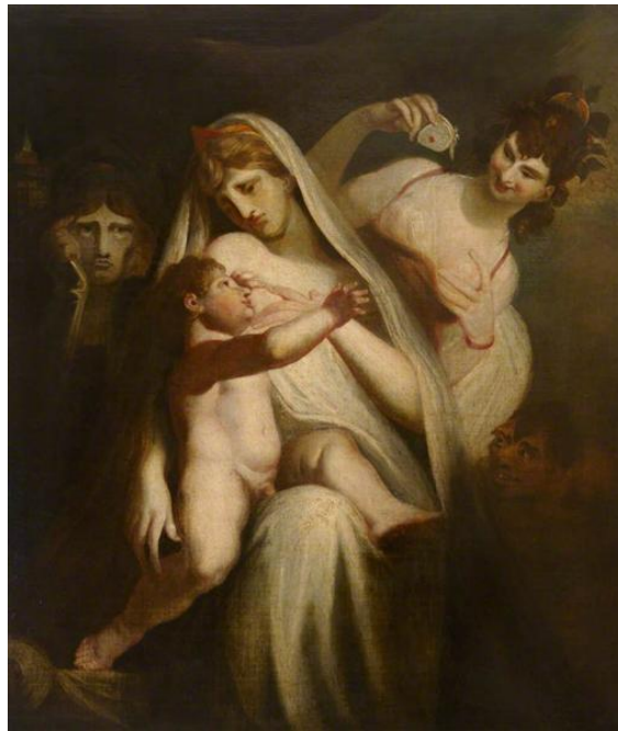
Tableau 5 FÜSSLI Henry. Shakespeare enfant entre la tragédie et la comédie , 1805-1806, huile sur toile, (103 × 91), Londres, Courtauld Institute of Art.

Il est un élément qui se doit d'être développé ici : l'enchaînement des toiles dans cette galerie. D'abord la Tempête , puis le Songe d'une nuit d'été , et enfin Macbeth . Ces trois pièces sont bien différentes les unes des autres, et exposer un tableau d'une tragédie faisant suite à trois tableaux portant sur des comédies semblait être un choix peu judicieux, mais il n'en n'est rien. La logique réside dans cette ode au point de non-retour, au moment de suspens, de déséquilibre, qui fait basculer l'intégralité de la pièce.