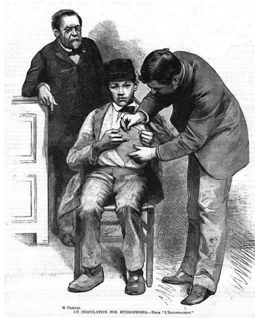
Illustration 2 : Gravure de Scientific American , New York, 19 décembre 1885. : Louis Pasteur, surveillant son assistant qui inocule Joseph Meister. [70]

L'ambition de Pasteur était de trouver le moyen de modifier la virulence de n'importe quel organisme pathogène pour en faire un vaccin. Ainsi, le vaccin contre la rage fut mis au point et l'étape décisive fut franchie en 1885 lorsqu'il vaccina pour la première fois Joseph Meister, un petit garçon sévèrement mordu par un chien atteint de rage. [3]