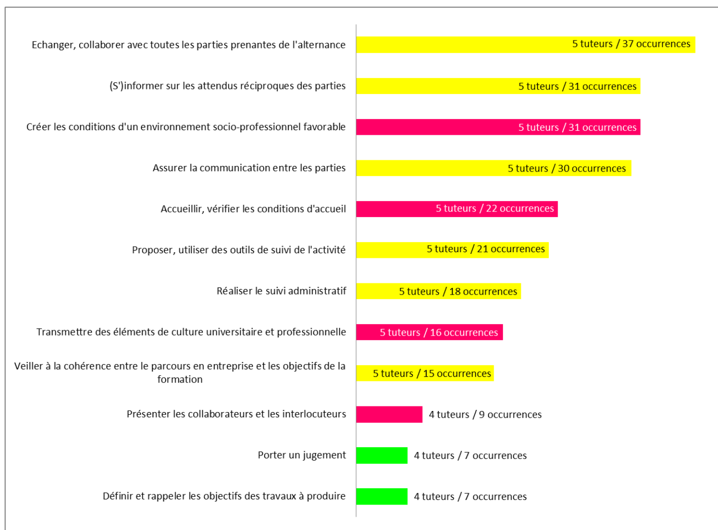
Figure 4 : hiérarchisation des pratiques principales (objectifs poursuivis, activités menées) des tuteurs académiques interrogés, en fonction du nombre d'occurrences, d'après les données de la figure 2).

Les catégories de pratiques relevant de la fonction 3 « Gérer les interactions pédagogiques et relationnelles entre l'entreprise et l'université » sont figurées en jaune : ■