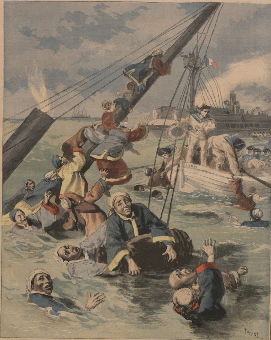
LES ÉVÉNEMENTS DE CORÉE Un vaisseau chinois coulé par les Japonais