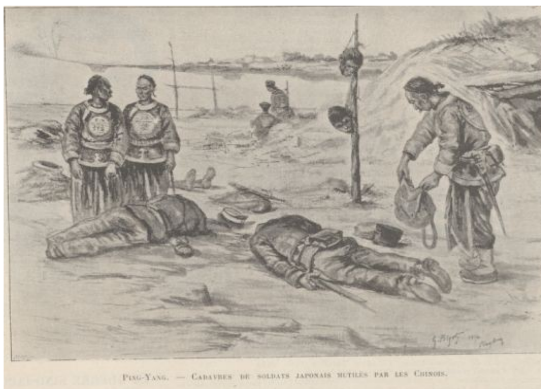
Figure 6 : Cadavres de soldats japonais mutilés par les chinois dans : «La guerre-sino-japonaise », Le Monde Illustré , 15 décembre 1894.

toutes ses technologies et armements à la Chine, permettant alors à ces puissances coalisées d'envahir l'Europe, thème que l'on retrouve plus tard encore lors du conflit russo-japonais. De plus, il s'est ensuite avéré que cette clause d'alliance qui avait inquiété les journalistes n'était en fait qu'une « clause de style » 31 , comme le mentionne à la fin du conflit un article du Figaro sur la paix de Shimonoseki et la Triple Intervention.