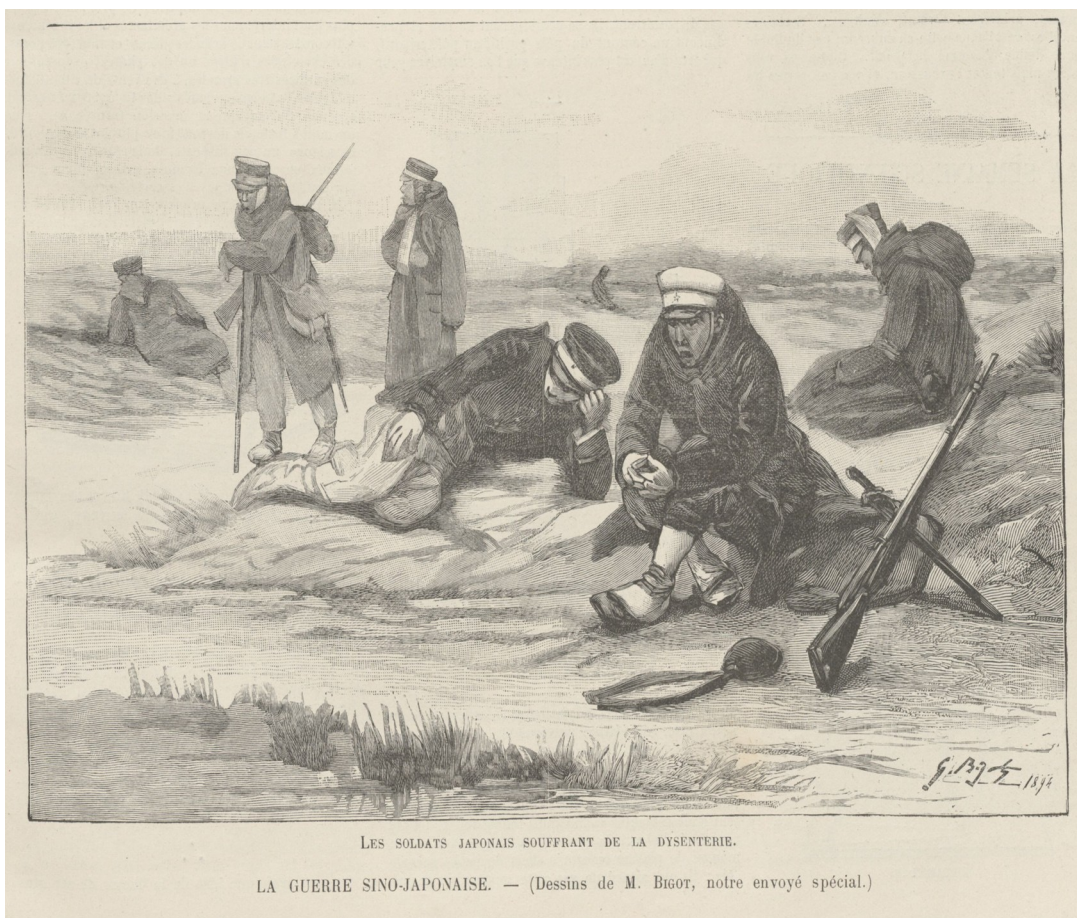
Figure 1 : Les soldats japonais souffrant de la dysenterie dans : « La guerre sino-japonaise », Le Monde Illustré, janvier 1895