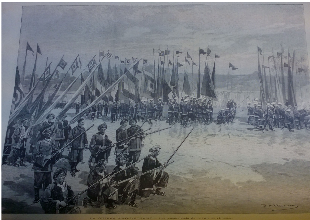
Figure 5 : Les porte-étendards de l'armée chinoise dans : « L'Armée chinoise », L'Illustration , 8 septembre 1894.

Très vite après la fin du conflit, les avis occidentaux allant dans ce sens se multiplient. En 1896, soit un an après la fin du conflit, le major britannique Charles Callwell rédige un ouvrage, Small Wars : Their Principles and Practice , qui tend à définir et expliquer les conflits auxquels participe une armée régulière contre une armée qualifiée d'irrégulière, dont « des expéditions contre des sauvages et races à demi-civilisées » ou encore des opérations de guérillas menées par des armées régulières 26 . Suite à cela, Callwell utilise l'exemple de la première guerre-sino-japonaise pour illustrer son propos. Il dit :