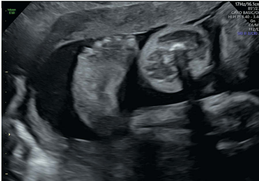
Pied bot varus équin droit 24SA, échographiste Dr ADRADOS

Clichés échographiques suspects de pied bot varus équin anténatal