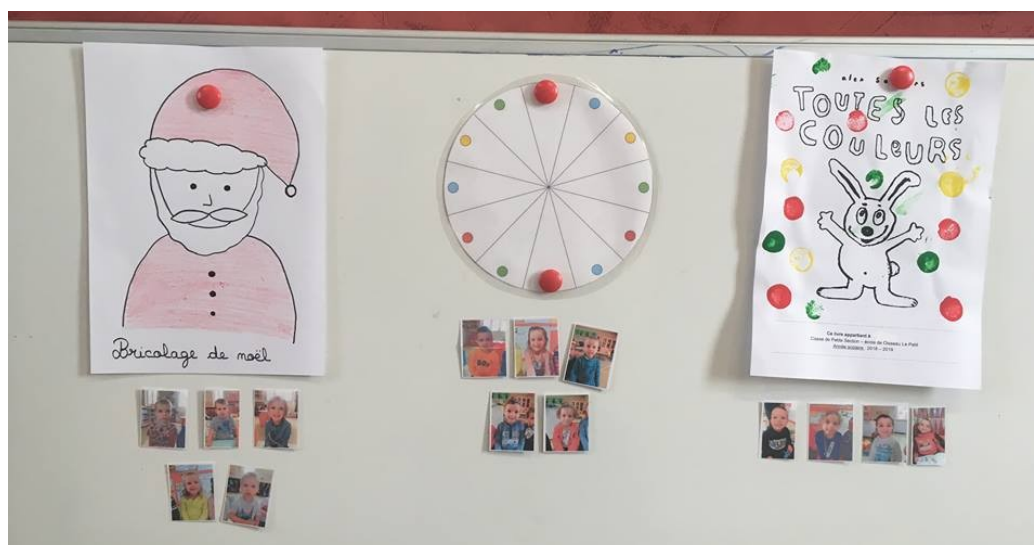
Illustration 1 : Premier fonctionnement

En ce qui concerne la passation des consignes, j'ai choisi de m'appuyer sur une manière de faire que j'ai pu observer à plusieurs reprises lors de mes précédents stages. Je tente donc de suivre le fonctionnement que j'ai pu essayer dans une classe de grande section, en l'adaptant à mes élèves de petite section. Pour ce faire, je rassemble les élèves au coin regroupement puis je présente les consignes des ateliers, les unes après les autres, avant d'indiquer les différents groupes d'élèves correspondant aux activités. Pour que les élèves aient une représentation de l'activité qu'ils doivent réaliser, une photo ou représentation est affichée. J'ai fait le choix de mettre les photos des élèves sous l'activité qu'ils devaient réaliser puisque je n'ai pas de groupes fixes. Le choix des photos a été pensé au service des élèves. L'intérêt étant qu'ils se repèrent plus rapidement et qu'ils se concentrent majoritairement sur l'activité correspondant à leur photo.