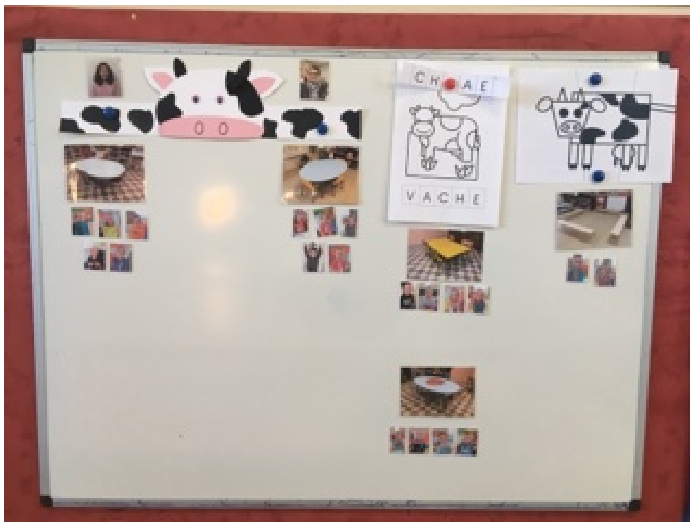
Illustration 2 : Le fonctionnement après évolution

Afin de faire évoluer le fonctionnement des ateliers, j'ai fait le choix d'ajouter des photos :