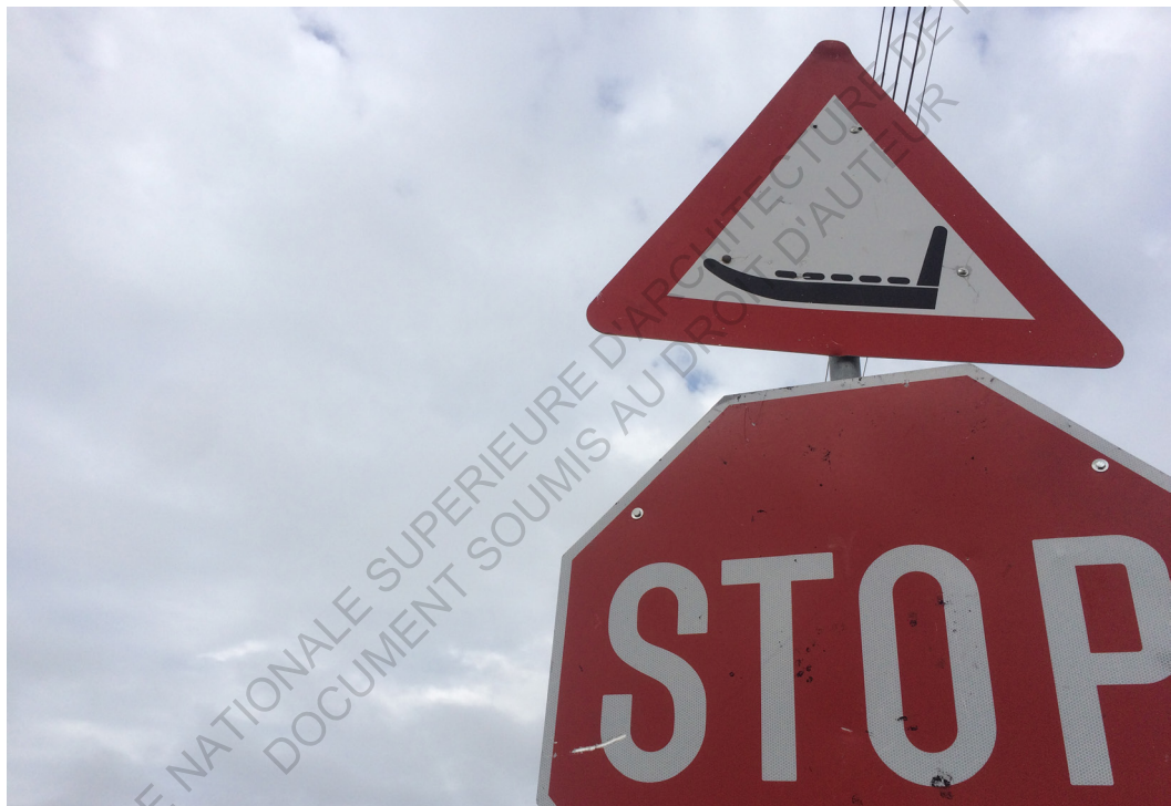
Panneau de signalisation à Ilulissat