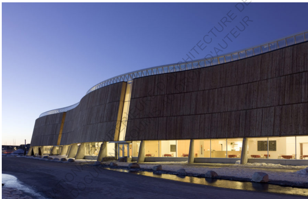
Centre culturel Katuaq à Nuuk - Schmidt Hammer Lassen, agence danoise