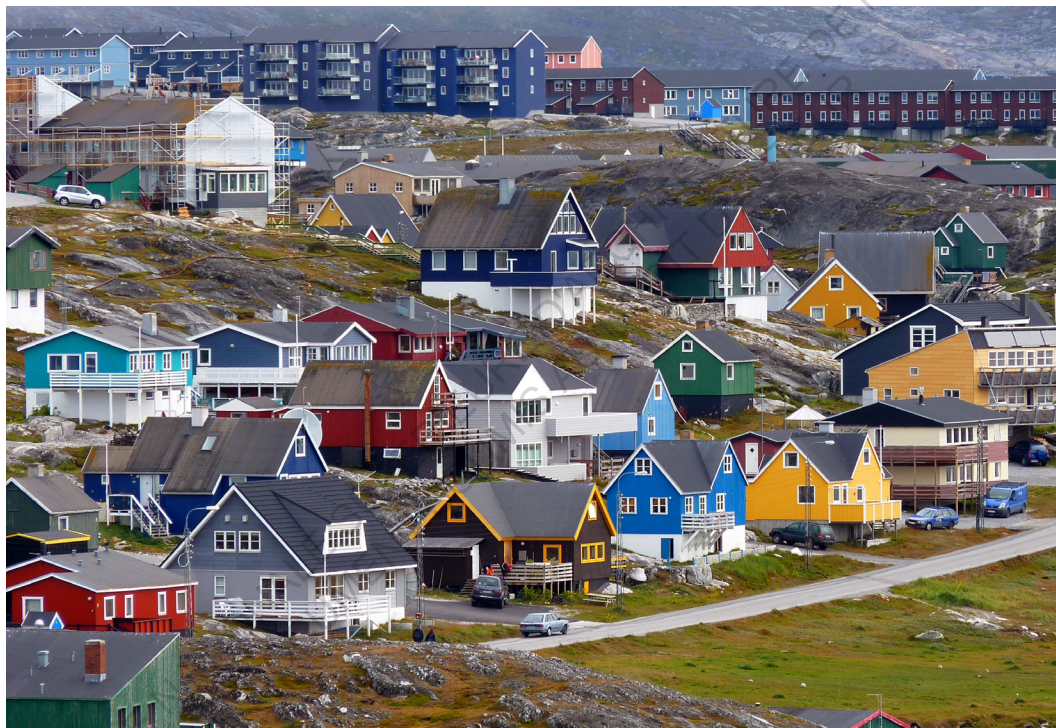
Nuuk en été