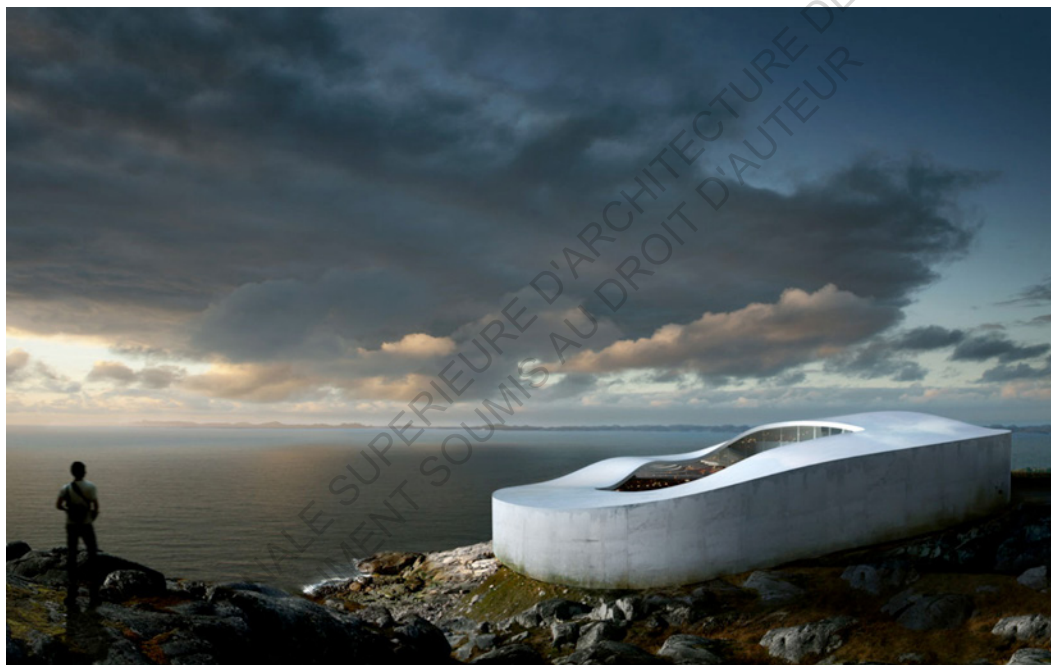
National Gallery - BIG