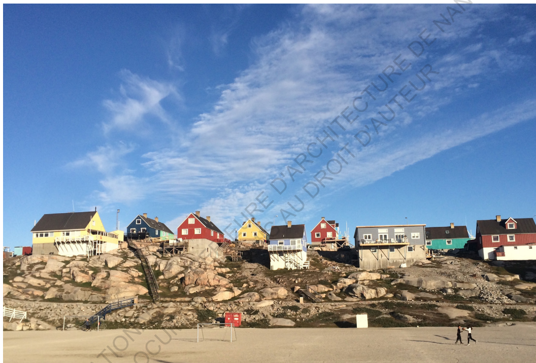
Maisons à Ilulissat