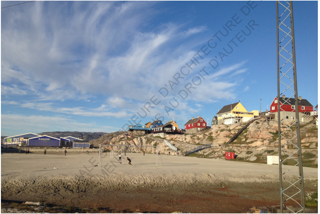
Terrain de football au coeur d'Ilulissat