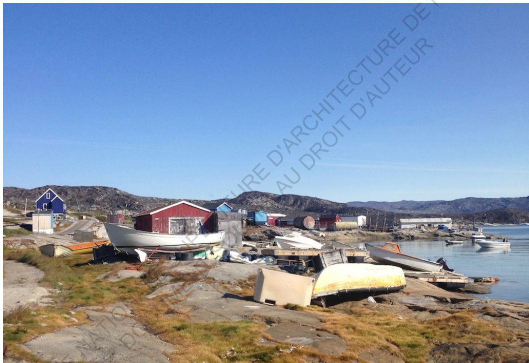
Oqaatsut , village de pêcheurs