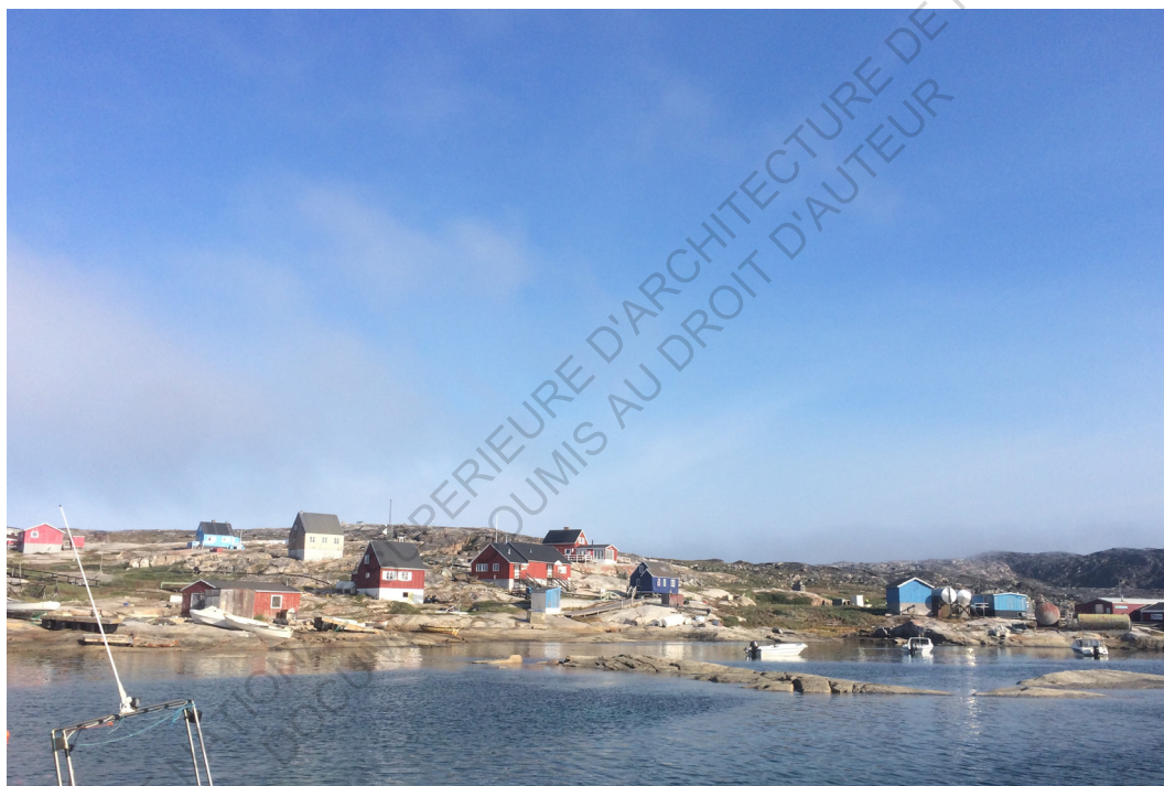
Oqaatsut, petit village au nord d'Ilulissat d'une cinquantaine d'habitants