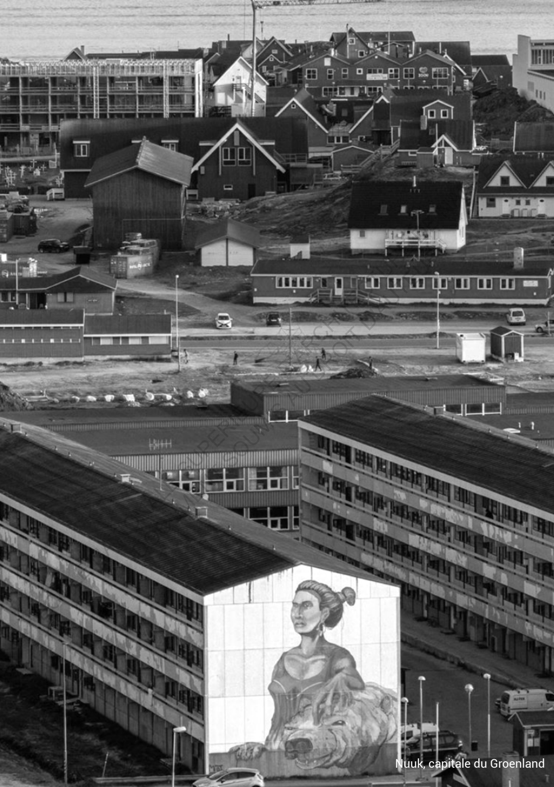
Nuuk, capitale du Groenland