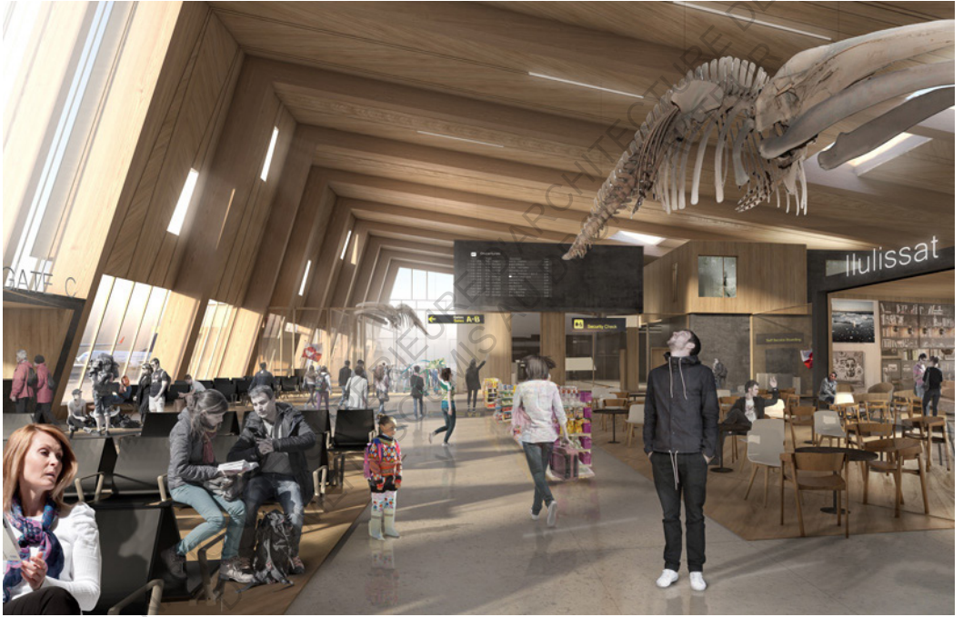
Air+Port - Projet d'aéroport interconnecté au trafic aérien et fluvial par BIG