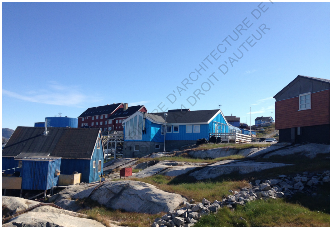
Maisons en kit importées du Danemark à Ilulissat