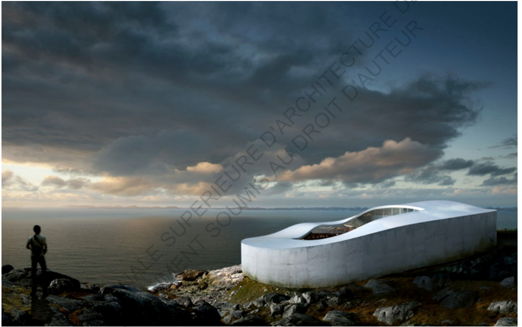
National Gallery - BIG