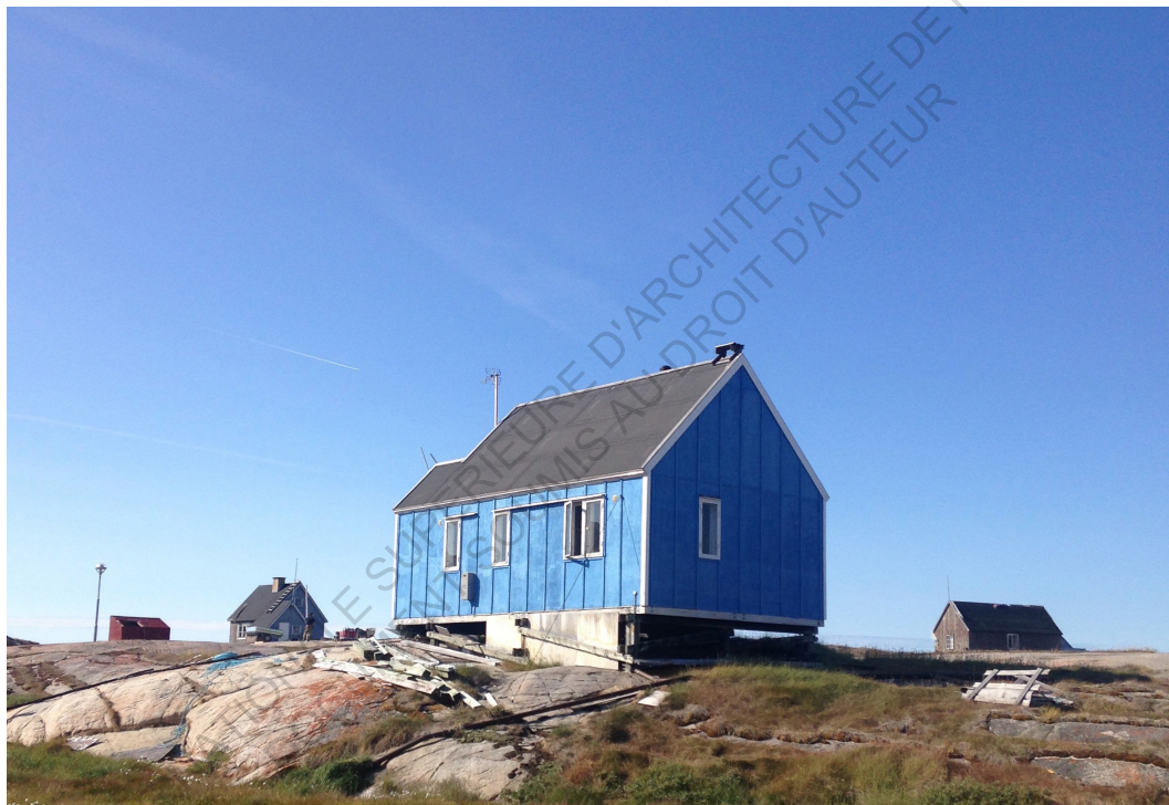
Petite maison à Oqaatsut