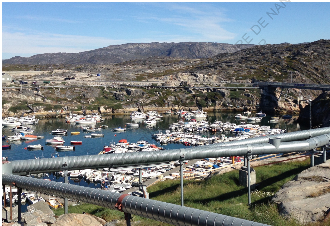
Port et canalisations à Ilulissat