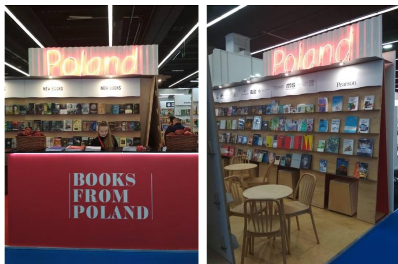
Stand de l'Institut du livre polonais à Francfort, 2018.

échanges de droits. À l'occasion de la Foire de Francfort en 2018, 109 pays ont été présents à travers les 7 503 exposants 142 . Il est difficile de trouver des chiffres exacts attestant de la domination de la langue anglaise par rapport au polonais. Néanmoins, si l'on s'attarde sur les exposants déjà inscrits pour l'édition de 2019, il est possible de constater que la langue anglaise sera beaucoup plus présente que des petites langues comme le polonais. Le Royaume-Uni, les États-Unis, le Canada et l'Australie représentent environ 616 exposants sur 1 842, catégorisés comme « book publisher » ou « literary agency / scout », alors que la Pologne, seul pays où le polonais est la langue officielle, compte seulement 5 exposants, bien que parmi eux se trouve le stand de l'Institut du livre polonais 143 . Ce dernier était un stand extrêmement important pour le rayonnement de la langue polonaise lors de la Foire de Francfort de 2018, car il accueillait 48 éditeurs 144 . Bien sûr, il est toujours envisageable, certain même, que des visiteurs polonais (agents littéraires par exemple), sans stand, viennent lors de la Foire. D'après ces chiffres, on peut estimer qu'en 2018 l'anglais dominait le polonais en termes de présence sur les stands, et que ce sera sûrement aussi le cas lors de l'édition de 2019.