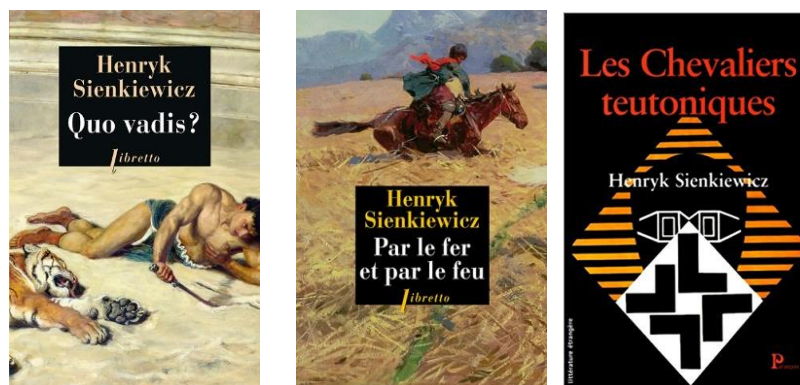
Exemples des livres traduits en français d'Henryk Sienkiewicz

Dans le corpus 175 , l'auteur polonais le plus important, toujours en termes de titres, est également un auteur faisant partie des auteurs polonais les plus populaires par rapport au nombre de langues dans lesquelles il a été traduit (28) 176 . Il s'agit d'Andrzej Sapkowski et sa saga du Sorceleur (cinq titres et quatre autres tournants autour de la série) publiée en France chez Bragelonne. Il est très important dans le corpus car chaque titre a fait l'objet d'une publication en poche chez Milady, et parfois d'éditions collector.