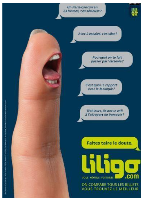
Publicité du comparateur de billets en ligne, Liligo, dans les stations de métro parisiennes, 2019.

Cet a priori à propos du sous-développement de la Pologne, malgré le dynamisme économique de celle-ci 148 , se retrouve également dans le milieu du livre. Ainsi, une chargée de droits dans une maison d'édition n'a pas pu cacher son étonnement face à une offre de coédition de la part d'un éditeur polonais pour un nombre élevé d'exemplaires d'un livre complexe et cher à la fabrication. Ces préjugés peuvent être élargis à différents services d'une maison d'édition, comme le service éditorial par exemple, et cela pourrait impacter la vision de la production littéraire, bien qu'elle soit d'aussi bonne qualité que n'importe quelle autre. En effet, elle est, elle aussi, susceptible de recevoir des prix littéraires, tout genre confondu. Par exemple, Les Livres de Jakób 149 d'Olga Tokarczuk a été sélectionné par le prix Femina ou encore l'album jeunesse Une âme égarée 150 d'Olga Tokarczuk et de Joanna Concejo a reçu le prix Sorcières, une grande reconnaissance dans le domaine de la littérature jeunesse.