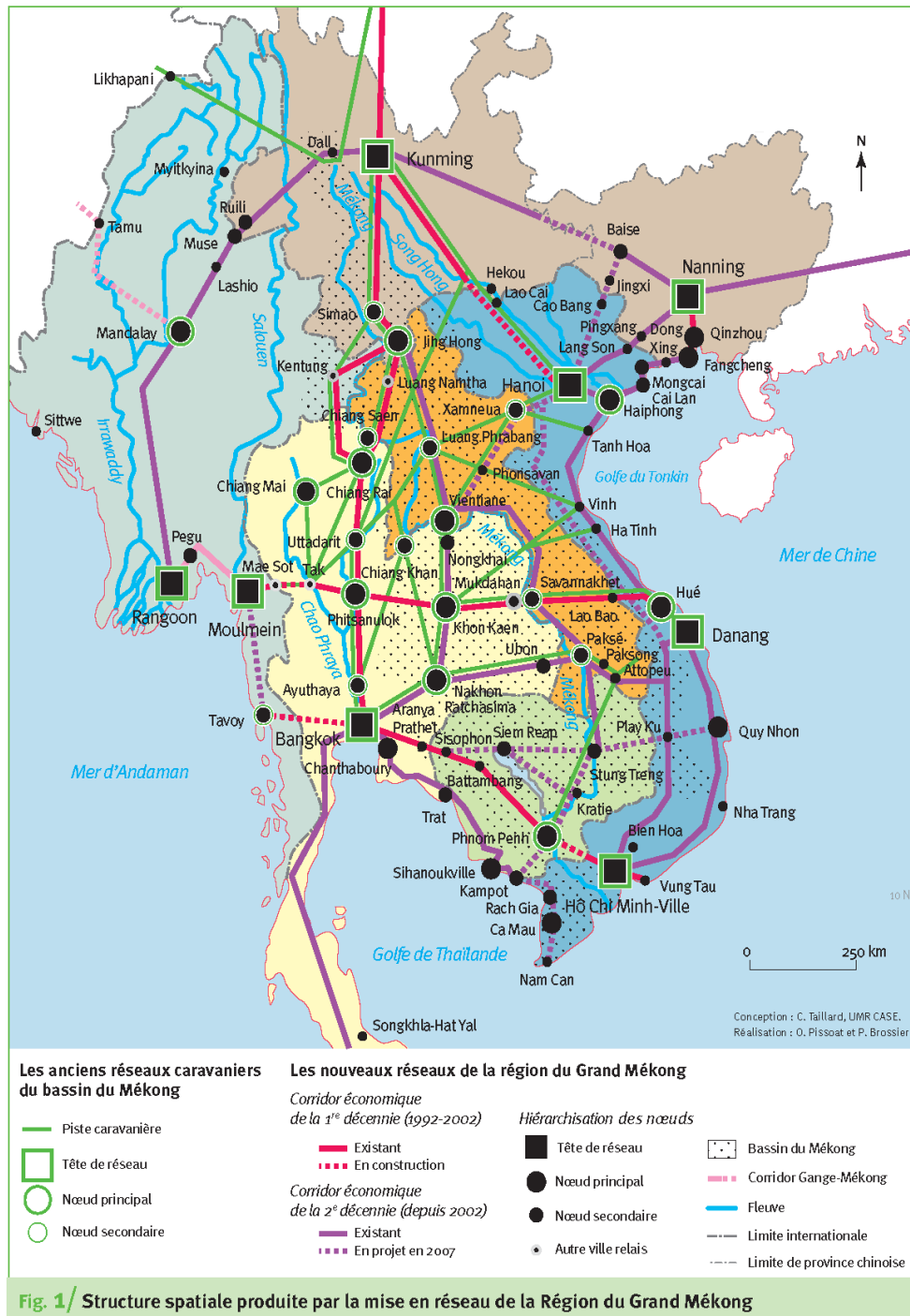
Fig. 1/ Structure spatiale produite par la mise en réseau de la Région du Grand Mékong