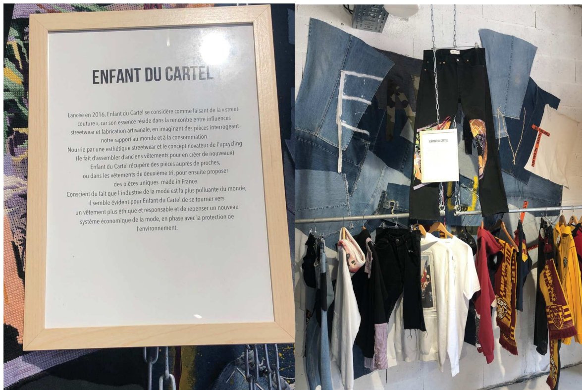
- Enfant du cartel

que l'étiquette soit petite et non mise en valeur appuie le fait que cela s'adresse à une clientèle aguerrie, qui a une certaine connaissance des caractéristiques et de la valeur du mobilier vintage. On ne cherche ici pas à le vendre à tout le monde, mais à attirer des personnes comme les brocanteurs, les collectionneurs, et donc une cible vintage très différente de celle concernée par les marques de produits neufs par exemple. Sur les réseaux sociaux du mad lab, une communication a toutefois été réalisée au sujet de ses meubles, peut-être dans le but d'attirer une cible secondaire dans les boutiques et de créer une nouvelle occasion de visite. Brokatom, la marque de meubles, présente ses produits comme des « meubles et objets du passé ». Cela implique alors leur appartenance à une époque différente de celle dans laquelle ils sont présents actuellement. Ces meubles sont donc purement vintage, puisque créés et appartenant au passé des années 40 aux années 60, mais ont été transformés et se vendent dans le présent au sein d'un univers vintage : le Mad Lab semble alors devenir une bulle du passé, ou une sorte de machine à remonter le temps, une pause temporelle dans le présent. De plus, les objets de la marque sont décrits comme des trésors, accentuant leur caractère unique et rare, et créant une expérience de découverte autour des objets présentés en magasin.