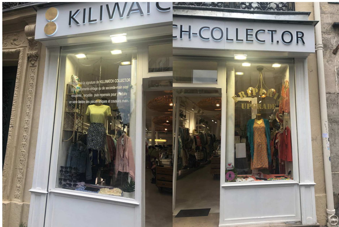
Une vitrine de chaque côté de l'entrée, prises en photo au même moment (mars).