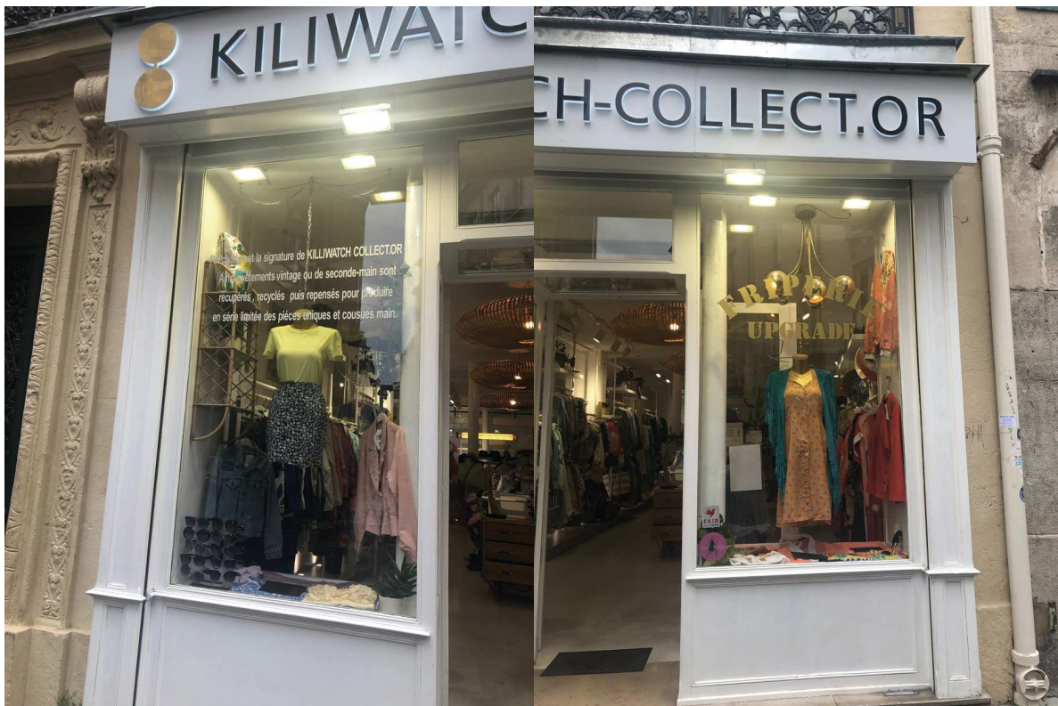
Une vitrine de chaque côté de l'entrée, prises en photo au même moment (mars).