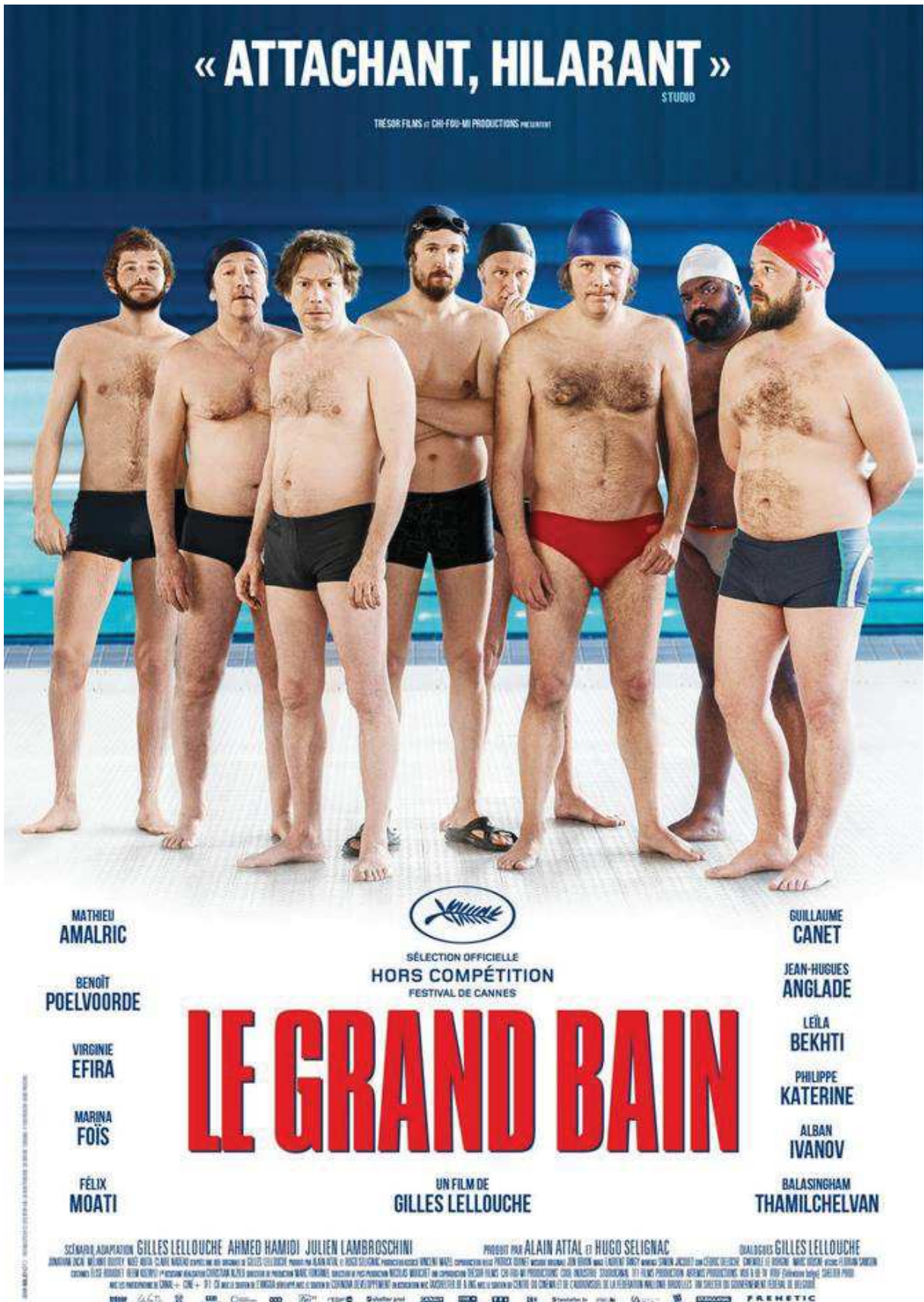
Annexe 1 : Affiche du film Le Grand Bain