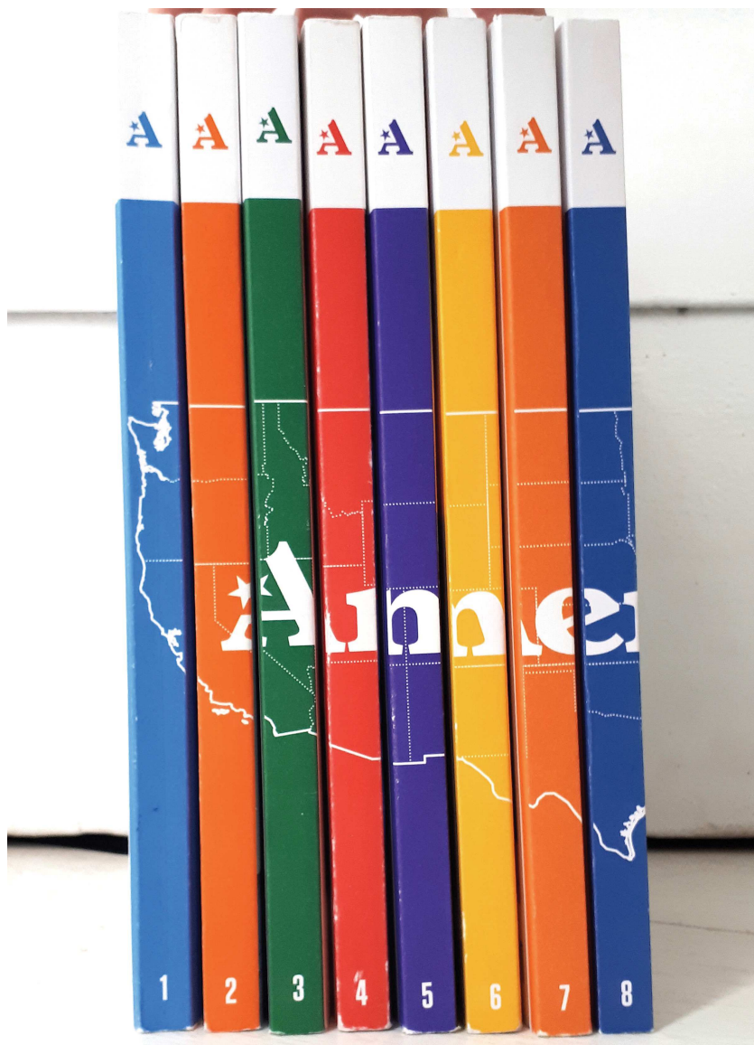
Les huit premiers numéros d' America alignés forment la moitié de la carte de l'Amérique.