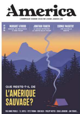
Couverture du n°5 : « Que reste-t-il de l'Amérique sauvage ? »