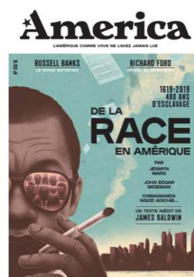
Couverture du n°8 : « De la race en Amérique »

menés sur le long cours. Un pari risqué, mais qui s'est finalement soldé en véritable succès de presse. Selon des chiffres communiqués par la rédaction, America est aujourd'hui tiré à 60 000 exemplaires par numéro, et comptabilise 3 600 abonnés. En un an, pour ses trois premiers numéros, America s'est vendue à plus de 100 000 exemplaires. A l'occasion des 1 an de la revue, François Busnel remerciait justement dans son édito cet engagement de la part des lecteurs. « En un an, vous avez fait de lui un incroyable succès de presse, garantissant notre indépendance et notre pérennité : merci ! Grâce à vous, nous continuerons d'explorer ce territoire, sa culture, son peuple, cherchant à comprendre et non à juger » (1) .