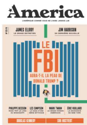
Couverture du n°3 : « Le FBI aura-t-il la peau de Donald Trump ? »