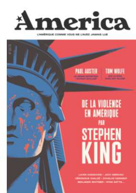
Couverture du n°4 : « De la violence en Amérique »