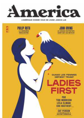
Couverture du n°6 : « Ladies First »