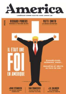
Couverture du n°7 : « Il était une foi en Amérique »