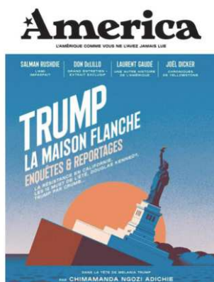
Couverture du n°2 : « Trump, La Maison flanche »