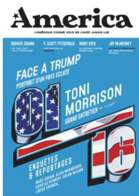
Couverture du n°1 : « Face à Trump, portrait d'un pays éclaté »