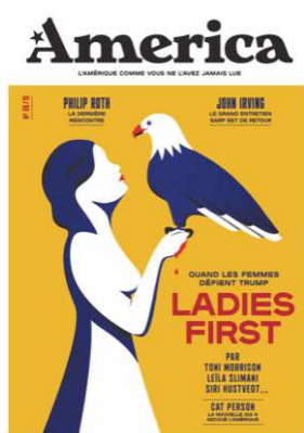
Couverture du n°6 : « Ladies First »