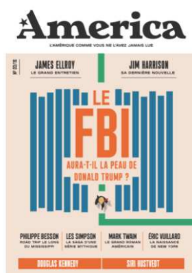
Couverture du n°3 : « Le FBI aura-t-il la peau de Donald Trump ? »