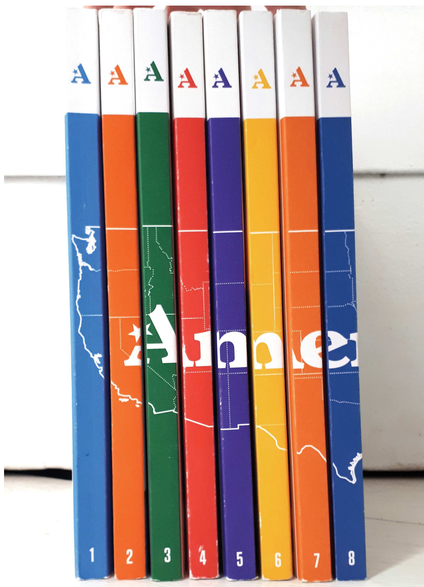
Les huit premiers numéros d' America alignés forment la moitié de la carte de l'Amérique.