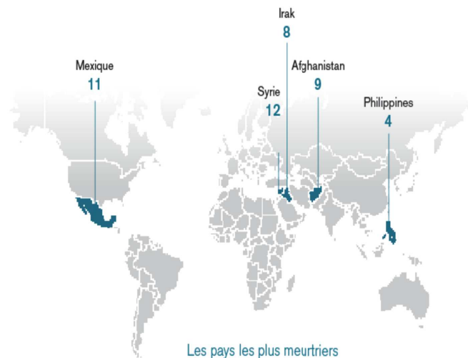
Figure 1 : Pays les plus meurtriers pour les journalistes en 2018

« La liberté d’expression au Mexique devient un mythe 1 ». Daniel Moreno, fondateur et rédacteur en chef de Animal Político - l’un des sites d’information les plus influents au Mexique, créé en 2010 et centré sur l’information politique du pays et en particulier sur le trafic de drogue, sur la corruption, sur les violences de genre et sur les droits de l’homme - constate une dégradation constante des conditions de travail des journalistes mexicains. Il faut dire qu’avec 9 journalistes assassinés en 2018, le Mexique est le pays libre le plus meurtrier pour cette profession, selon le dernier bilan publié en décembre 2018 par Reporters sans frontières (RSF) 2 . Ce chiffre place le Mexique au 144 e rang mondial sur 180 en terme de liberté de la presse 3 . Un classement peu flatteur pour un pays pourtant développé et qui nous amène à nous demander si l’exercice du journalisme y est encore possible.