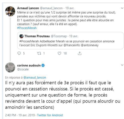
Les échanges directs avec les internautes permettent d'expliquer le fonctionnement des procès

chroniqueur judiciaire participe à l'assurance d'une certaine transparence de l'appareil judiciaire. Le micro-blogging d'audience a un rôle à part entière à jouer dans ce processus, amplifié par l'interactivité qu'amène les réseaux sociaux. Les journalistes n'hésitent à répondre aux questions des lecteurs et à leurs interrogations sur le fonctionnement de la justice.