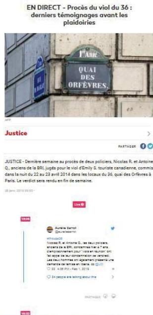
Capture d'écran du site LCI.fr, réalisée le 28 avril 2019