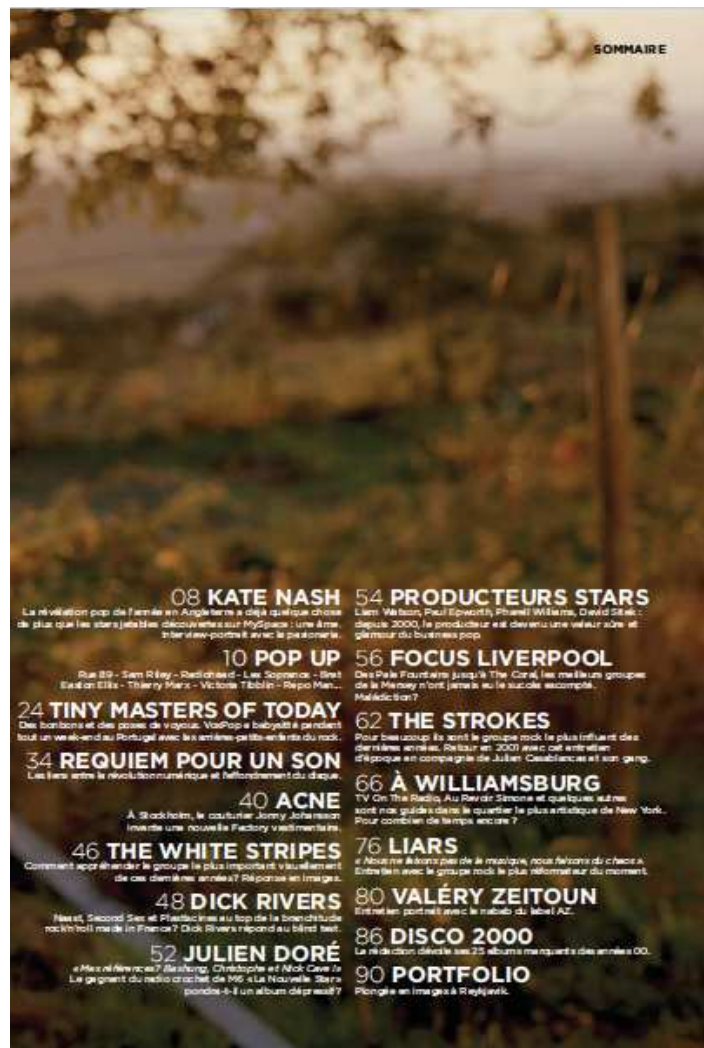
Sommaire du numéro 1 de VoxPop.

Des années plus tard, les avis des cofondateurs restent les mêmes : ils ont conçu le magazine qu'ils souhaitent et dont ils sont toujours fiers. Jean-Vic Chapus nous a confié (non sans humour) que le dernier numéro est « quasiment le meilleur numéro de magazine lu ces dix-quinze dernières années » 33 .