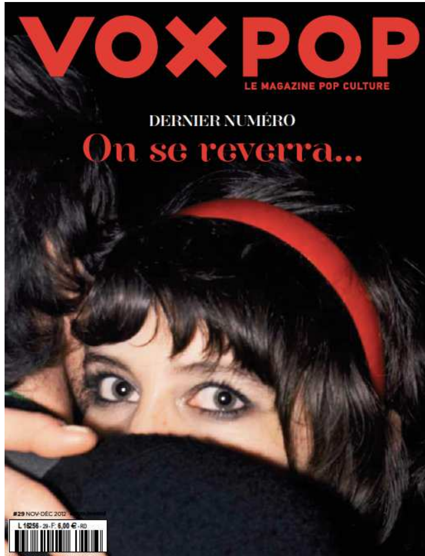
Numéro 29 de VoxPop de novembre/décembre 2012.