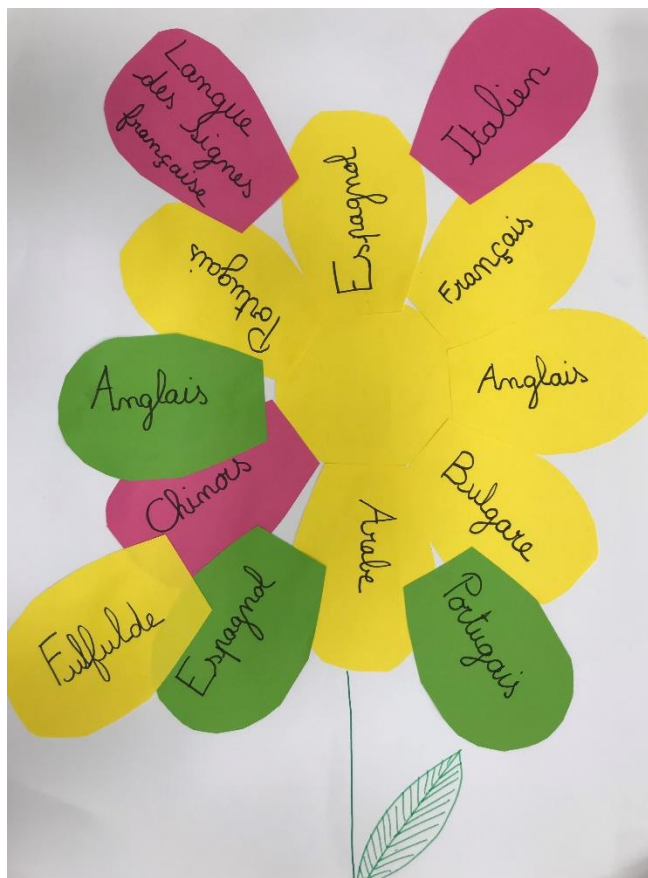
Première fleur des langues de la classe