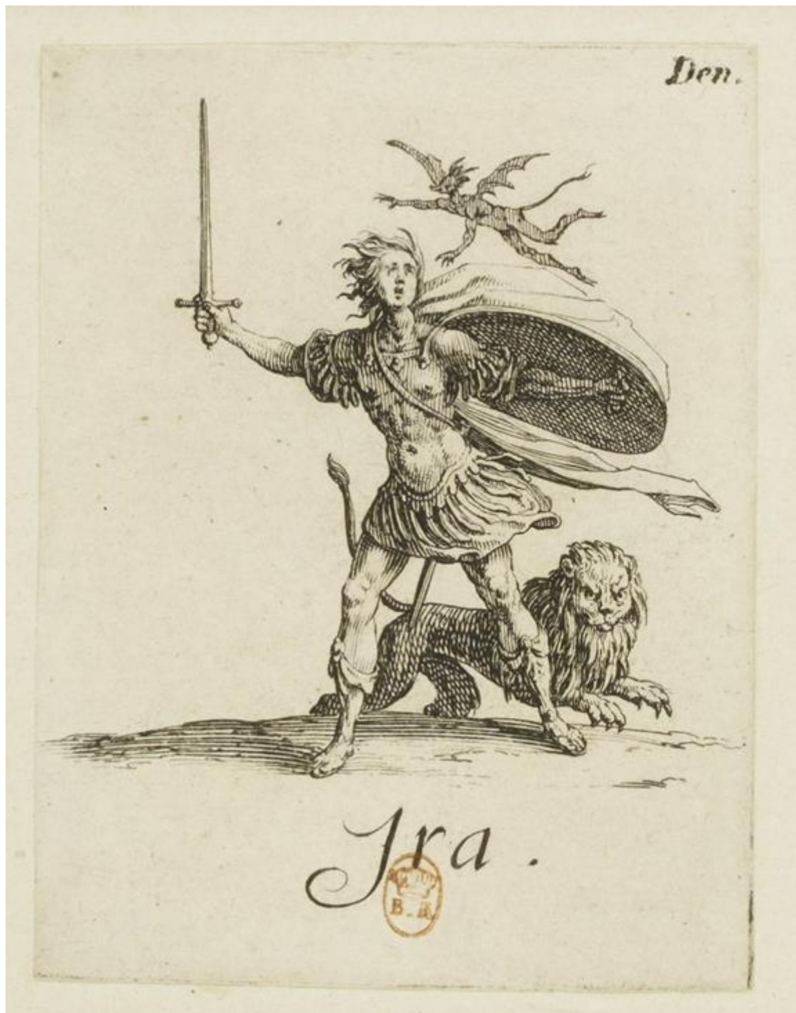
Ill. 8. Jacques Callot, Les péchés capitaux, Florence, 1617-1621.

La colère semble être ici un péché d'homme puisque c'est un personnage masculin qui incarne ce vice, à la différence de l'envie, mais aussi de l'orgueil que nous allons étudier. Dans cette allégorie, le protagoniste tient deux objets : un bouclier et une épée. Le graveur s'attache alors à la représentation d'une des manifestations extérieures de la colère, en l'occurrence, l'affrontement. Sa tenue peut d'ailleurs rappeler les soldats antiques. À l'image de l'allégorie