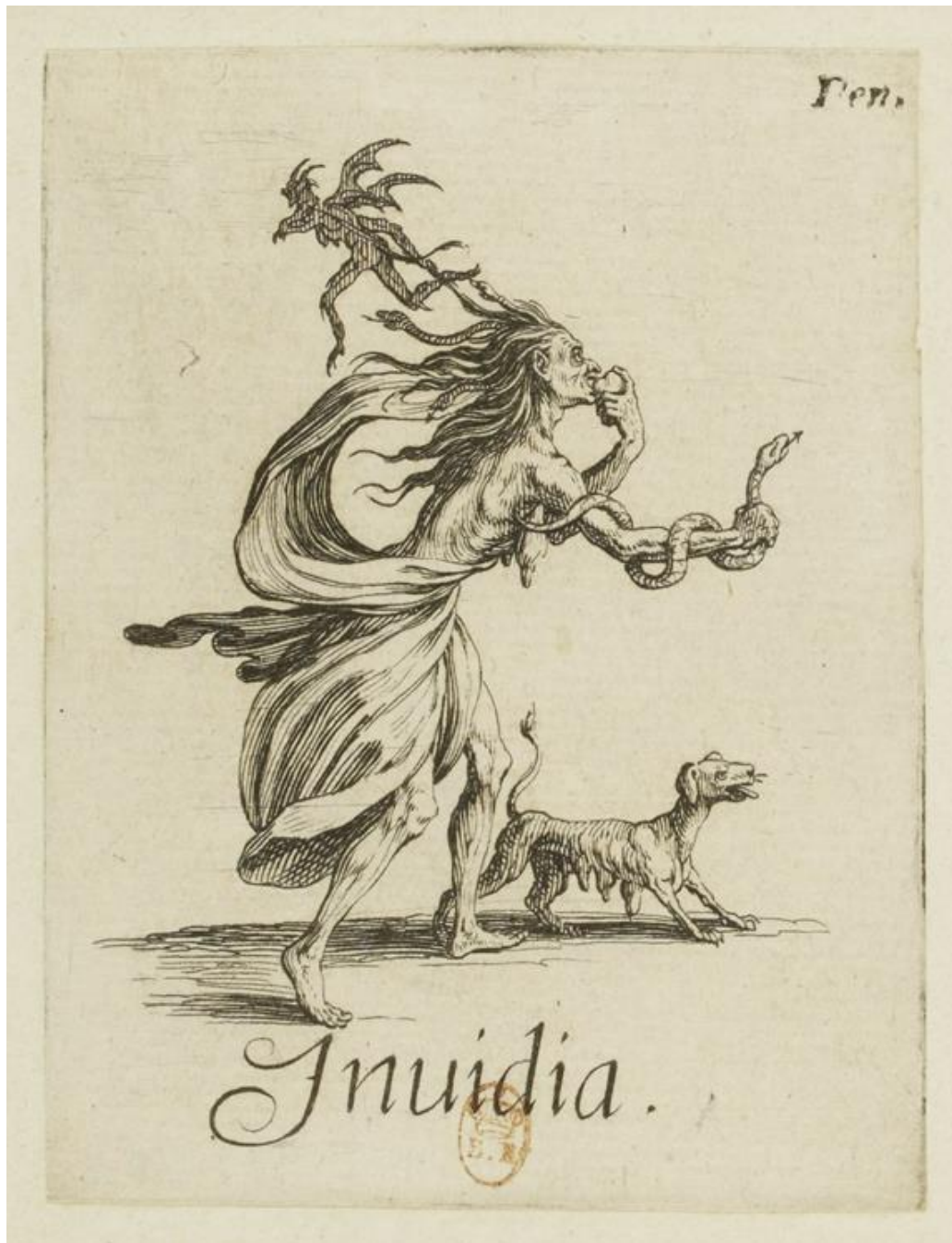
Ill. 4. Jacques Callot, Les péchés capitaux, Florence, 1617-1621.