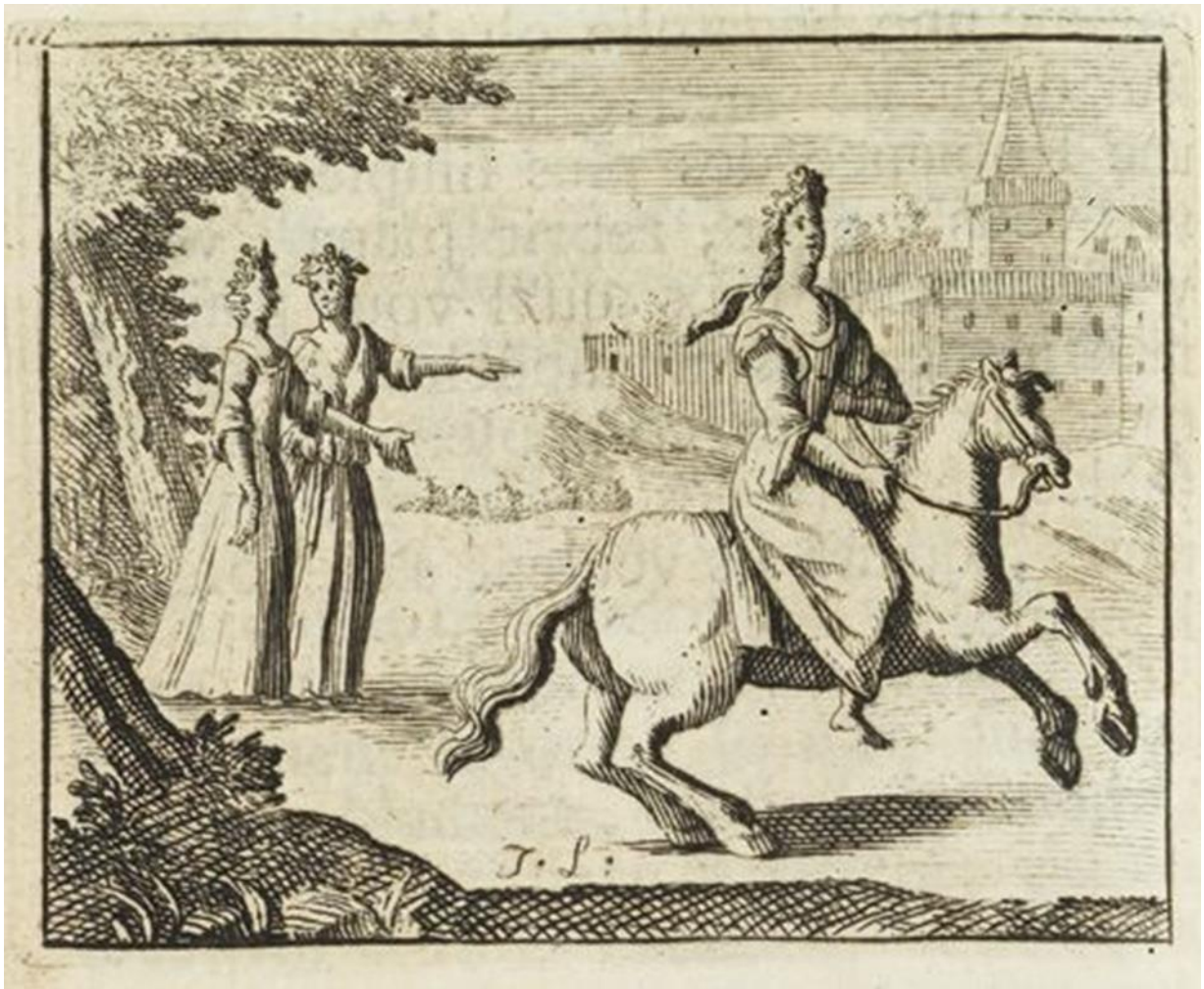
Ill. 5. Jean Lamsvelt, Le Cabinet des fées , Amsterdam, Marc Michel Rey, entre 1708 et 1754.

Dans cette illustration, Finette est représentée à cheval, regardant droit devant elle et laissant derrière elle ses deux sœurs qui la pointent du doigt. Celles-ci ne tournent pas leur regard vers Finette mais se regardent entre elles. De fait, nous pouvons remarquer que dans nos trois illustrations, le thème de la vue pose question. Les yeux sont soit entièrement cachés, dans le cas de l'homme au chapeau, soit à moitié représentés, comme dans le cas de l'envieuse montrée de profil. Dans la première et dernière illustration, le regard ne se dirige pas vers l'objet qui suscite l'envie, en témoignent le trio central dans l'allégorie du XV e siècle et les sœurs de Finette dans cette gravure. De plus, les mêmes gestes apparaissent, les envieux pointent du doigt l'envié ou tendent leur bras vers lui. Nous pouvons aussi noter que les envieux sont représentés à droite, et les envieux à gauche, la gauche étant associée au Diable et, par conséquent, à ce qui lui est lié, en l'occurrence, les péchés. Presque trois siècles séparent ces illustrations, mais les mêmes thèmes reviennent pour représenter l'envie.