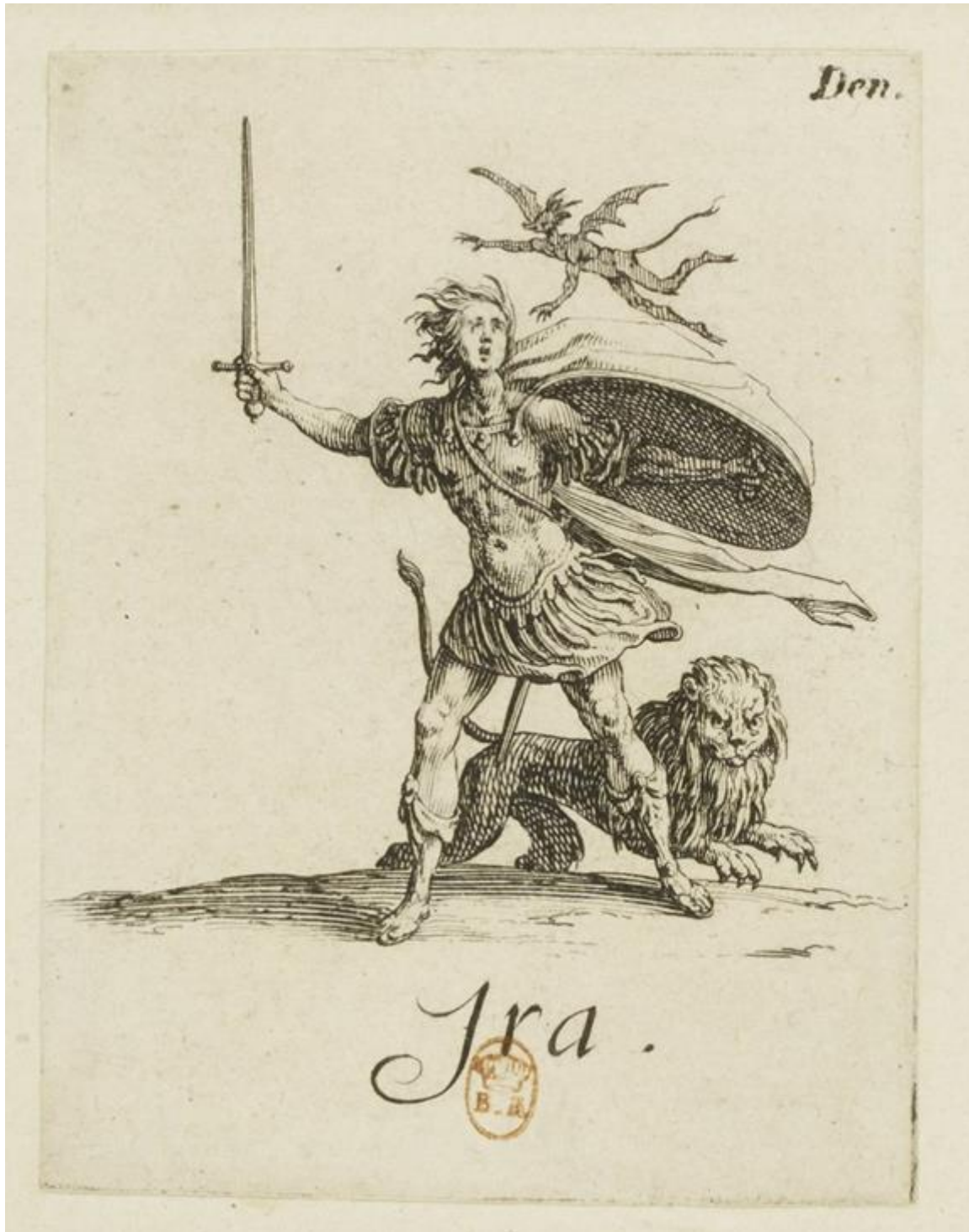
Ill. 8. Jacques Callot, Les péchés capitaux, Florence, 1617-1621.

La colère semble être ici un péché d'homme puisque c'est un personnage masculin qui incarne ce vice, à la différence de l'envie, mais aussi de l'orgueil que nous allons étudier. Dans cette allégorie, le protagoniste tient deux objets : un bouclier et une épée. Le graveur s'attache alors à la représentation d'une des manifestations extérieures de la colère, en l'occurrence, l'affrontement. Sa tenue peut d'ailleurs rappeler les soldats antiques. À l'image de l'allégorie