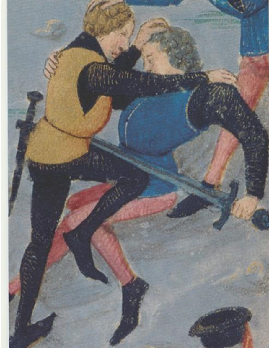
Ill. 7. La Colère et Léviathan (détail), Livre d'heures , Poitiers, 1475. © New York, The Pierpont Morgan Library, 1001, fol. 088r.

Ainsi, la violence contre soi-même est représentée dans la première partie de l'illustration, violence qui peut être induite par une colère intérieure, alors que la deuxième illustration montre une colère extériorisée, qui aboutit à une rixe. Nous pouvons remarquer que le péché de colère semble, dans cette représentation, toucher tant les hommes que les femmes puisque ces dernières paraissent encourager la lutte et vouloir y participer.