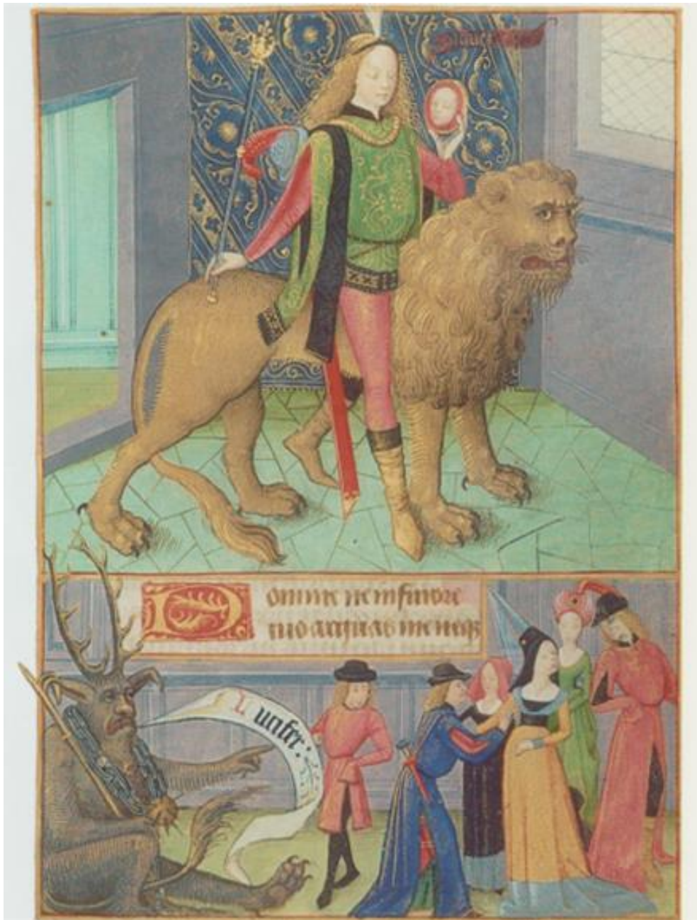
Ill. 10. L'Orgueil et Lucifer, Livre d'heures , Poitiers, 1475. © New York, The Pierpont Morgan Library, 1001, fol. 084r.

Nous pouvons voir dans le haut de l'illustration un personnage noble, sûrement un prince ou un roi, comme le suggèrent son sceptre, son diadème qui forme une sorte d'aigrette sur sa tête et ses riches vêtements. La manifestation du péché d'orgueil est très extérieure, dans cette représentation, le vice est suggéré par tout ce qui a trait à l'apparence et au superficiel : les habits, les accessoires, mais aussi le décor qui présente une riche tenture. Cette représentation de l'orgueil est allégorique puisque ces divers éléments « correspondent trait pour trait aux