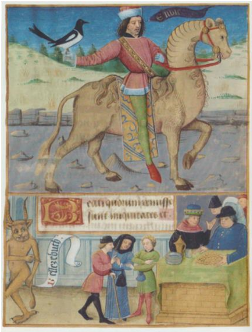
Ill. 3. L'Envie et Belzébuth, Livre d'heures , Poitiers, 1475.

Cette illustration, intitulée « L'Envie et Belzébuth », est divisée en deux parties. Dans la partie du haut, montrant une scène extérieure, nous voyons que le mot « envie » est noté dans un encart au-dessus du cheval. L'envieux semble être ici un courtisan, nous pouvons remarquer ses habits assez riches, ce qui confirme les propos de J. de Salisbury : « les envieux sont présents dans toute communauté, mais à la Cour ils abondent : on dirait qu'ils y confluent de toute part comme vers la sentine du monde 132 ». Le personnage est monté sur un cheval, cet animal ne semble pas utilisé pour sa valeur symbolique, puisqu'il n'incarne pas l'envie, mais uniquement parce qu'il est une monture traditionnelle en cette fin du Moyen Âge. Le visage de l'envieux est triste et sa bouche est ouverte, comme s'il allait parler. La diffamation ou le murmure