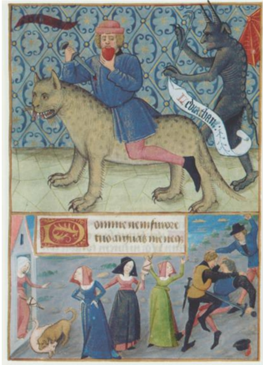
Ill. 6. La Colère et Léviathan, Livre d'heures , Poitiers, 1475. © New York, The Pierpont Morgan Library, 1001, fol. 091r.

Orientons désormais notre étude vers le péché de colère, représenté comme suit dans « La Colère et Léviathan » :