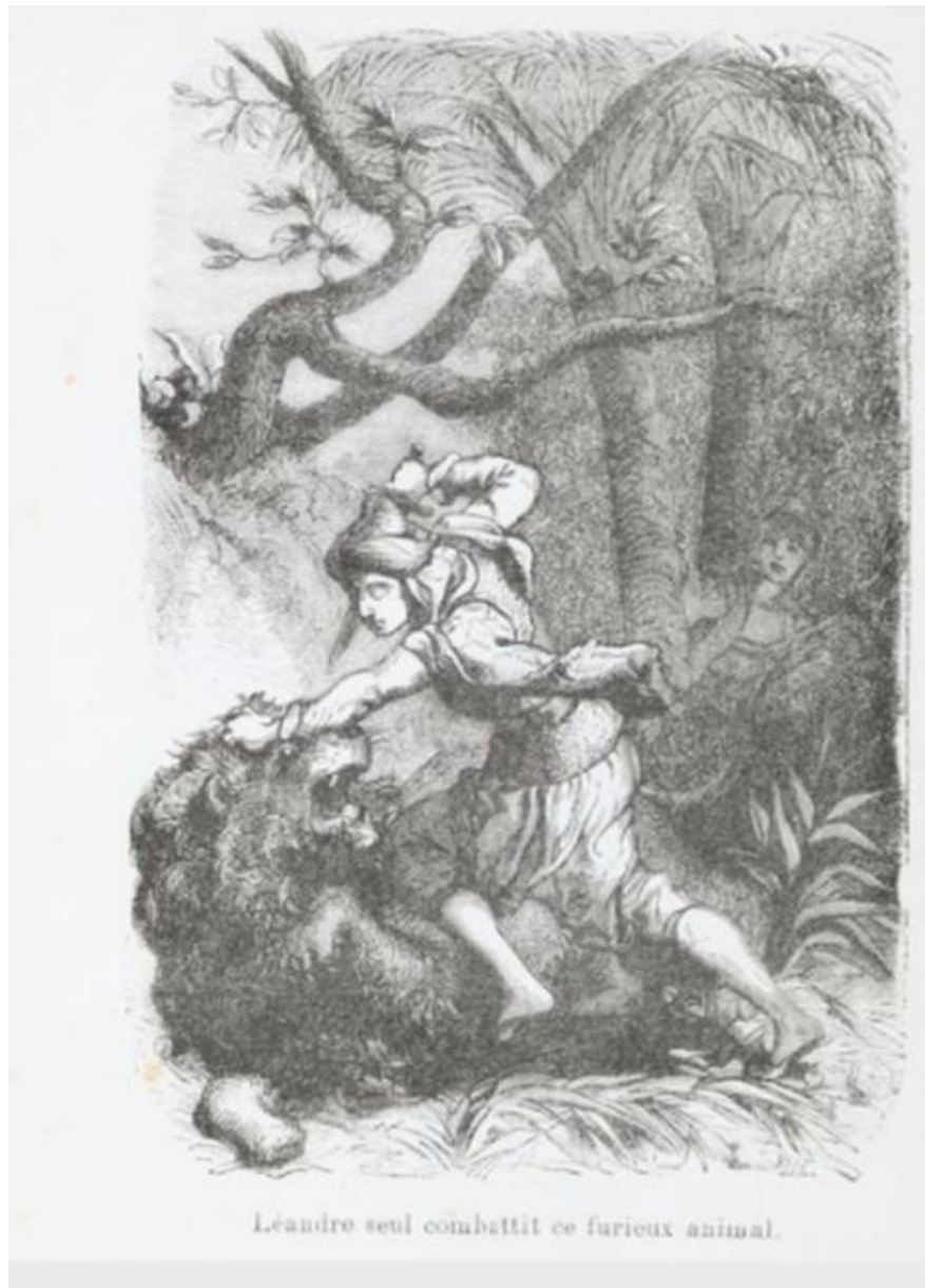
Ill. 1. Jules Désandré, Contes des fées , illustration de « Le Prince Lutin », 1868.

importance puisqu'elle fait notamment l'objet d'une illustration de Jules Désandré dans l'édition des Contes des fées 100 de Bernardin-Béchet :