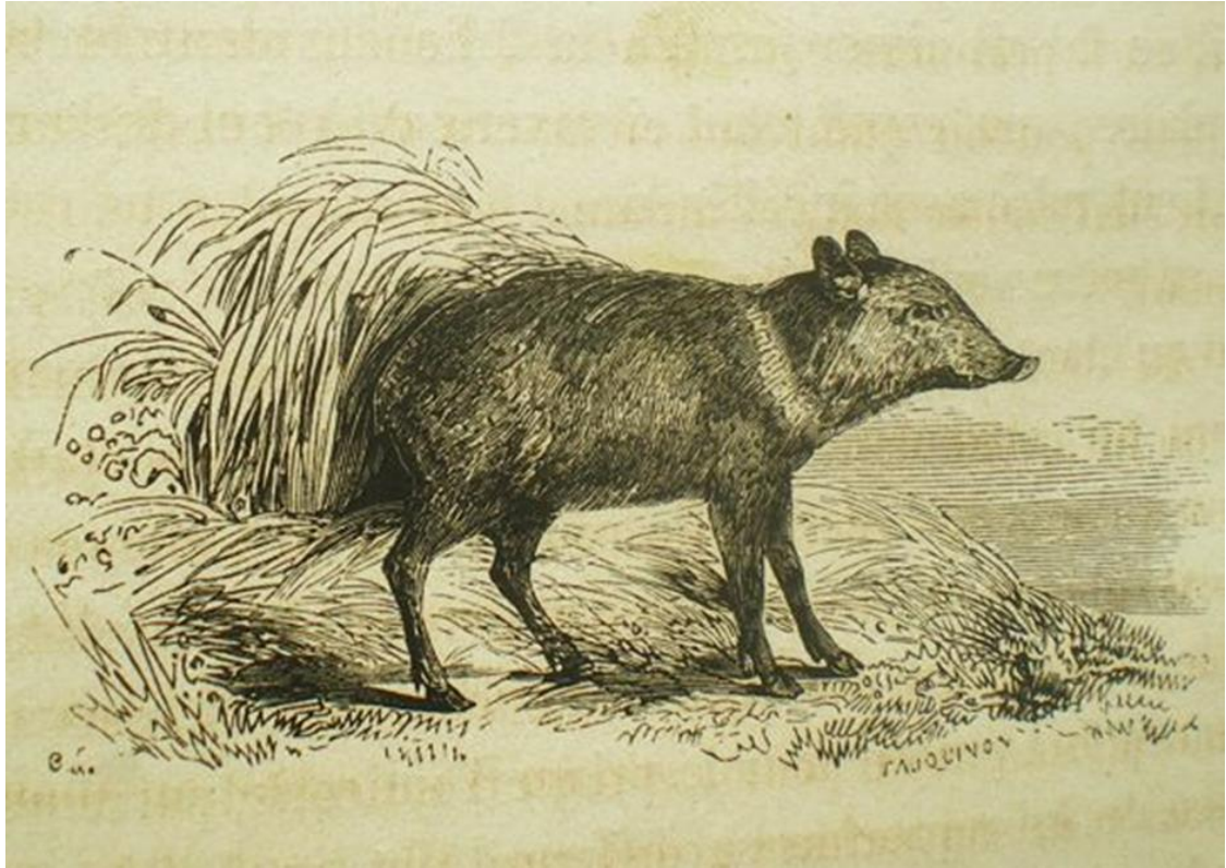
Ill. 2. Illustrateur inconnu, Contes des fées par Perrault, Mme d'Aulnoy, Hamilton... , Paris, Garnier frères, illustration de « L'Oiseau Bleu », entre 1850 et 1880 (date conjecturale).

Dans cette illustration, Truitonne semble davantage métamorphosée en sanglier qu'en cochon domestique. L'animal est dans un décor sauvage, haut sur pattes, il a de petites oreilles, un poil foncé comme celui des sangliers et une défense semble bien avoir été esquissée en blanc. Davantage encore que le cochon, le sanglier symbolise la colère. Ce choix de l'illustrateur semble donc témoigner d'une connaissance des péchés capitaux, ou tout du moins de leur symbolique. Du cochon domestique au cochon sauvage, il n'y a qu'un pas, ce que notent G. Duchet Suchaux et M. Pastoureau : « à la fin du Moyen Âge, la symbolique négative du sanglier paraît même s'accroître encore, car on commence à le doter de tous les vices jusque-là attribués au seul porc domestique [...] Entre le cochon domestique et le cochon sauvage la frontière symbolique n'est plus imperméable 114 ».