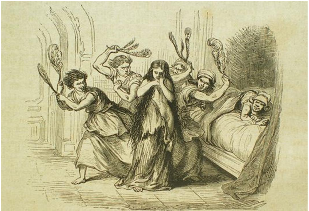
III. 9. Illustrateur anonyme, Contes des fées par Perrault, Mme d'Aulnoy, Hamilton... , Paris, Garnier frères, entre 1850 et 1880 (date conjecturale).

Dans « Gracieuse et Percinet », la violence que subit la jeune fille est ainsi montrée :