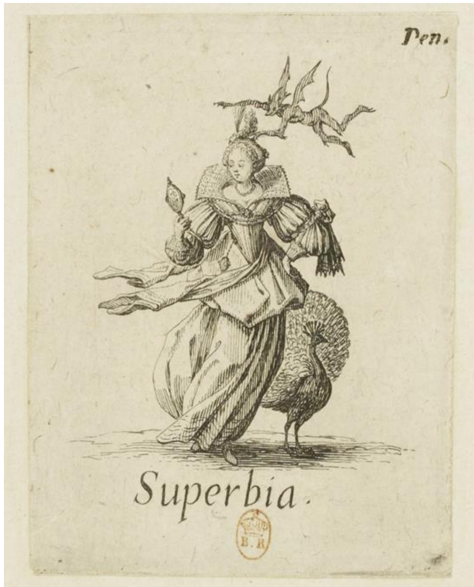
Ill. 11. Jacques Callot, Les péchés capitaux, Florence, 1617-1621.

Le personnage qui incarne ce péché est une femme, ce qui suggère peut-être que ce vice touche particulièrement le sexe féminin. Nous avons d'ailleurs pu remarquer ce phénomène dans les Contes , où figurent majoritairement des femmes orgueilleuses. Comme dans l'illustration du XV e siècle, le personnage pécheur n'est qu'apparat, il porte de riches vêtements, des bijoux, une couronne et même un accessoire symbole de vanité : un miroir. Ainsi, l'orgueil paraît toucher une catégorie très précise de la société, les classes hautes, l'univers de la Cour. Un démon ailé vole au-dessus de la femme, mais celle-ci ne lui prête aucun intérêt et semble subjuguée par son reflet. Sa pose, une main sur les hanches, est assez hautaine et suffisante. En outre, nous pouvons noter que l'animal choisi pour représenter l'orgueil est un paon, ce qui correspond tout à fait à la symbolique animalière des péchés. De plus, ce dernier