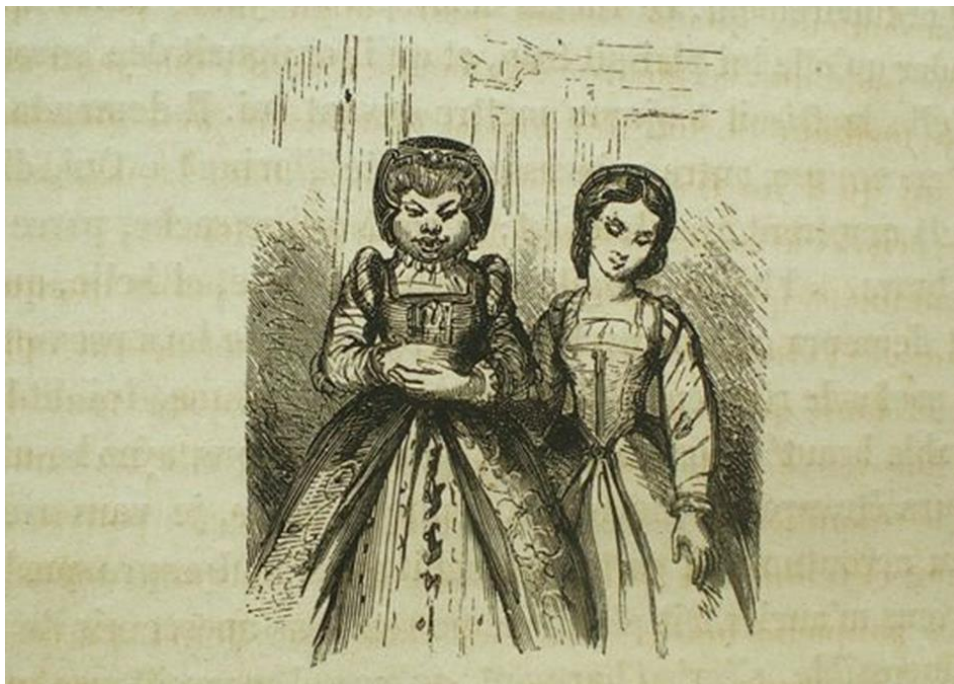
III. 13. Illustrateur anonyme, Contes des fées par Perrault, Mme d'Aulnoy, Hamilton... , Paris, Garnier frères, entre 1850 et 1880 (date conjecturale).