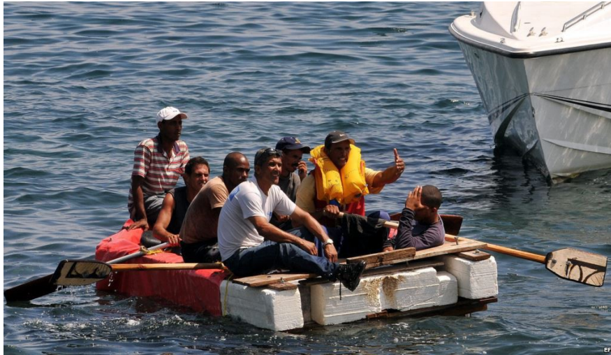
Illustration 7-4 – Photographie de quelques balseros sur leur embarcation de fortune en 1994 47

Cependant ils ne sont pas accueillis comme des combattants de la liberté car le président démocrate Bill Clinton se sent désormais débarrassé de toute contrainte idéologique et le gouvernement s'inquiète d'une trop forte latinisation des États-Unis 48 . Le gouvernement fédéral les envoie dans des camps provisoires en dehors du territoire et les regroupe ensuite tous à Guantanamo. En mai 1995 s'ouvrent des négociations avec Castro pour renvoyer les balseros chez eux à Cuba. L'administration Clinton avait déjà durci les mesures envers les migrants en faisant chuter le nombre de visas accordés par an de 2330 en 1989 à 544 en 1994 49 . En 1996 est ratifiée la loi Helms-Burton qui renforce les mesures de la loi Torricelli sur l'embargo. En septembre 1996 est voté l'Illegal Immigration Reform and Immigrant Responsibility Act qui accélère les procédures d'expulsion des étrangers. La même année 26 000 visas sont finalement accordés à ces exilés dont la plupart étaient détenus à Guantanamo. Une certaine exception persiste malgré tout car le Cuban Immigration Agreement (1995) mettait en place la politique du « pied sec, pied mouillé » c'est à dire que le gouvernement américain accordait le droit de résidence après un an pour tout Cubain trouvé sur le sol américain 50 . Tout migrant retrouvé en mer est néanmoins reconduit à la frontière cubaine, une mesure critiquée par le gouvernement cubain comme une incitation à l'immigration illégale.