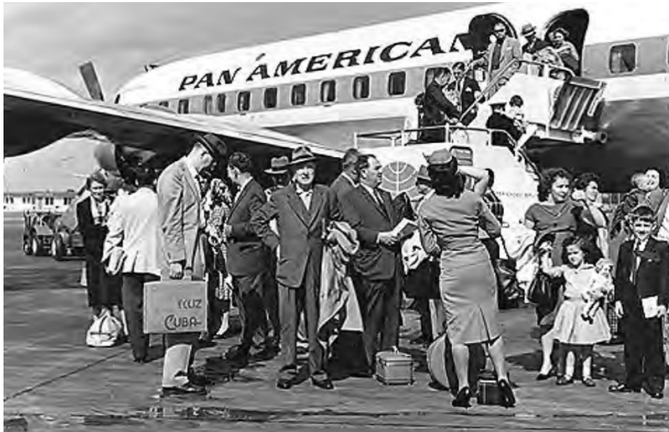
Illustration 7-1 – Photographie des exilés de 1959 qui fuient Cuba

propriétaires états-uniens qui craignent pour leurs intérêts car les guérilleros s'attaquent à leurs propriétés et lancent une vague de nationalisations dès 1960.