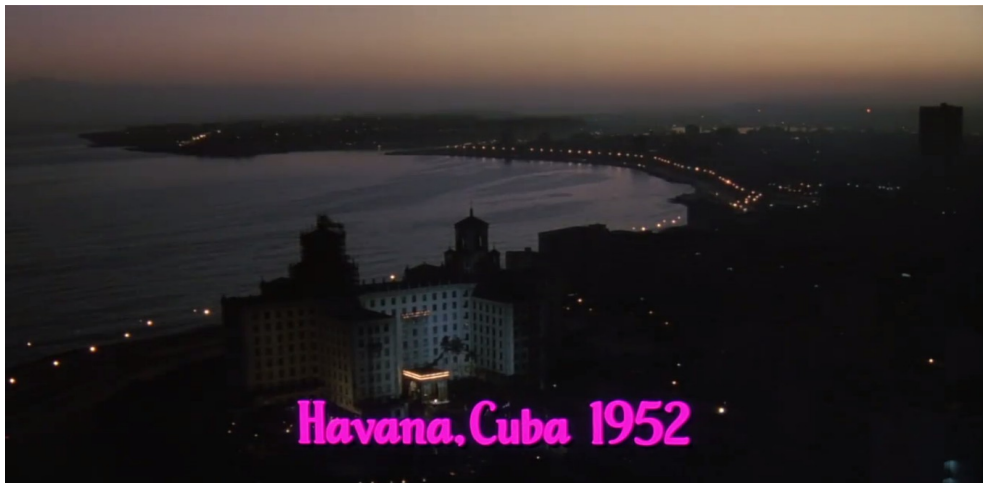
Illustration 6-4 – Sur fond de mambo, The Mambo Kings (1992) reprend presque à l'identique la même ouverture que Havana (1990) avec la vision d'une Havane nocturne identifiée par l'hôtel Nacional où avaient lieu beaucoup de fêtes.

population cubaine, qu'il espère voir s'améliorer. Tout comme Havana ou Buena Vista Social Club , la mise en avant des spectacles nocturnes de la Havane sur fond de musiques cubaines rythmées offrent pour l'imaginaire collectif une image de Cuba que les voyageurs veulent retrouver comme un âge d'or révolu qui refait progressivement surface dans les années 90.