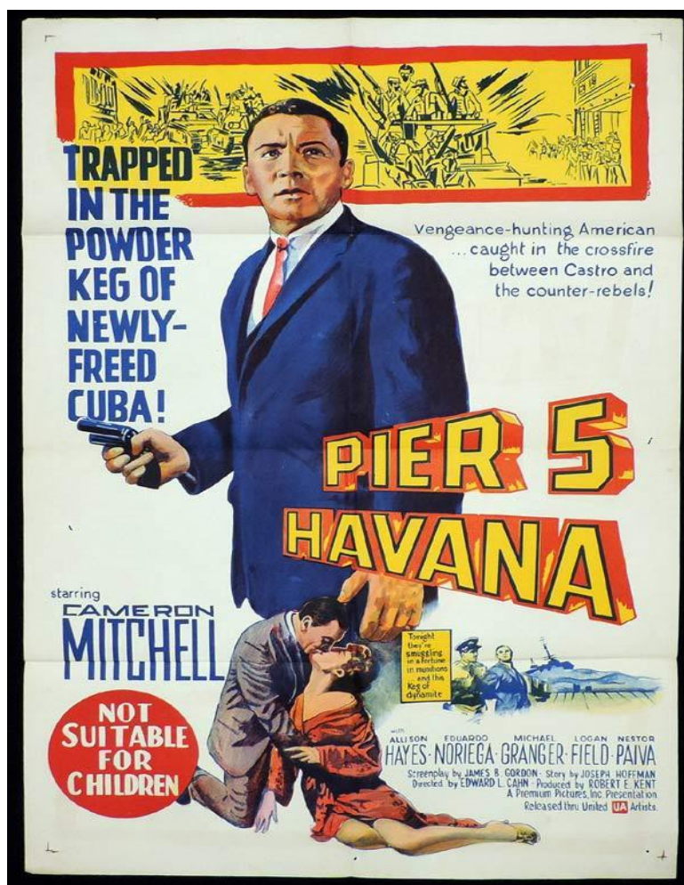
Illustration 3-2 – Poster du film Pier 5, Havana (1959)

Dès la sortie du film, le premier poster rendait clair la représentation de Castro et Batista par Edward L. Cahn :