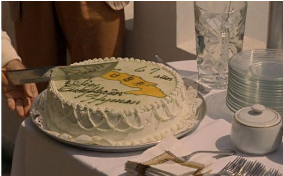
Illustration 5-1 – Extrait du Parrain – 2e partie (1974) : Hyman Roth partage Cuba entre les chefs des différentes familles

Quelques minutes avant la rencontre, le taxi de Michael est bloqué dans une rue de la Havane par l'arrestation de plusieurs personnes soupçonnées d'être liées à la guérilla castriste. Un des nombreux Cubains soupçonnés se précipite dans une voiture d'officier et crie « Vive Fidel ! ». Il enclenche au même moment une bombe qui le tue lui et l'officier présent dans la voiture. Lors de la réunion avec Hyman Roth, celui-ci affirme que les rebelles sont nuisibles à leurs affaires illégales. Lors de la nuit de la Saint-Sylvestre, Michael apprend la victoire de Castro et avertit son frère Fredo qu'un avion doit les ramener à Miami. Les derniers instants des Corleone à Cuba montrent le peuple dans la rue, pillant des hôtels et levant des bannières « États-Unis imbéciles ! ». Du point de vue des gangsters, la révolution est présentée comme un obstacle à leur trafic et aux investissements dans les casinos. Mais du point de vue de Coppola, la corruption et les liens de Batista avec des gangsters étaient les maux principaux de Cuba. Le développement de l'emprise de la mafia sur l'économie cubaine était une critique pour le réalisateur de la société américaine en général, prêt à tout pour faire du profit. Le partage du gâteau renvoie aussi finalement au contrôle que le gouvernement américain impose dès 1898 sur l'île.