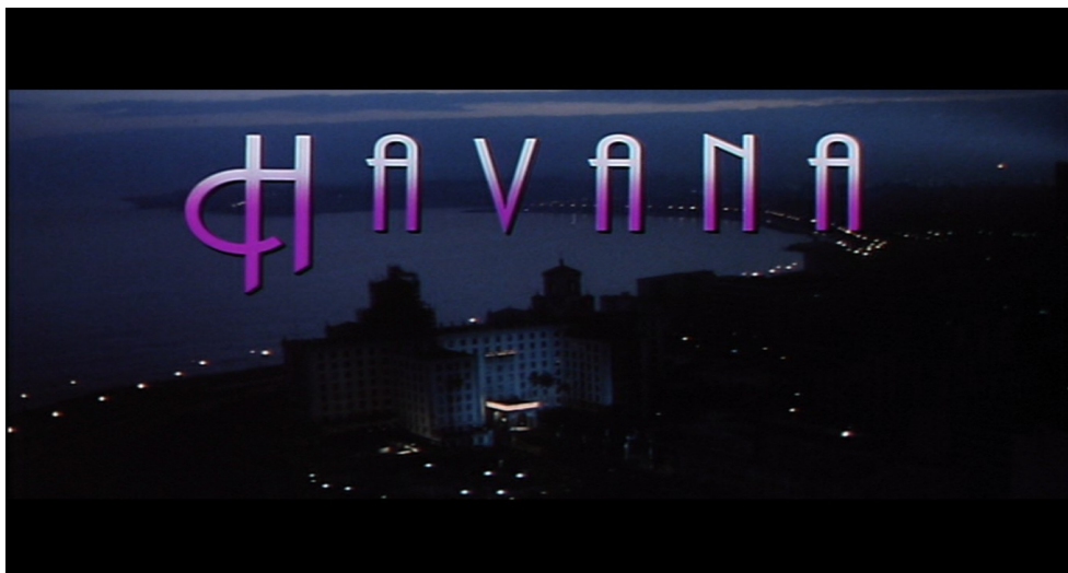
Illustration 6-3 – Générique du film Havana qui reprend la typographie que l'on peut retrouver dans les noms d'hôtels des années 50 comme l'hôtel Nacional que l'on peut apercevoir en dessous

interdits pendant plus de trente ans. Comme le dit Wim Wenders pour le Buena Vista Social Club, on peut observer un bond dans le temps entre ces images de la Havane des années 50 présentées comme un âge d'or, et les années 90 durant lesquelles les touristes peuvent retrouver une ambiance identique. Cuba semble redevenir ainsi le terrain de jeu que l'île était avant 1959, même si les citoyens états-uniens ne peuvent pas encore en profiter entièrement à cause de l'embargo.