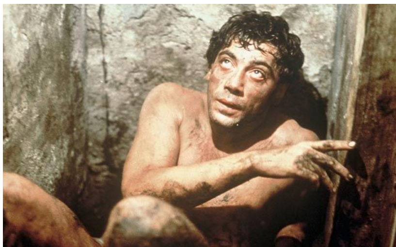
Illustration 8-2 – Reinaldo Arenas (Javier Bardem) enfermé par le régime pour « déviance idéologique »

En 1993 sont publiées ses mémoires à titre posthume dans l'ouvrage Before Night Falls : A Memoir , adapté en 2000 par le réalisateur Julian Schnabel. Celui-ci reprend assez fidèlement le récit autobiographique du poète, mais l'aspect visuel permet de renforcer la dureté des conditions de vie de Arenas, persécuté pour son orientation sexuelle. Avant d'être arrêté, ce sentiment d'oppression se ressent au début du film lorsque Reinaldo et d'autres amis homosexuels sont traités de « dégénérés » ou de maricon , terme péjoratif hispanique qui se traduirait par « pédale » en français. Il est arrêté une première fois en 1974 alors que des jeunes l'avaient accusé à tort de les avoir touché. Il s'échappe une première fois, après avoir averti l'UNESCO pour témoigner de sa situation, mais il est ensuite enfermé à la forteresse d'El Morro comme « violeur ». Schnabel illustre les mauvaises conditions dans lesquelles Arenas est enfermé en le montrant nu, dans une cellule exiguë et insalubre :