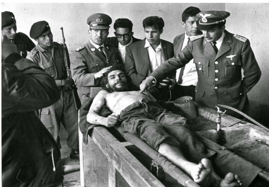
Illustration 4-3 – Photo du corps de Che Guevara prise par la CIA (10 octobre 1967)

Le révolutionnaire acquiert une image christique avec de nombreux rapprochements faits notamment avec le célèbre tableau du peintre italien Andrea Mantegna datant des années 1480. La barbe et les cheveux longs, la posture dans laquelle il est exposé avec tous les regards qui se portent sur lui, et les rumeurs qui enflent autour de ce personnage mystérieux parmi la population