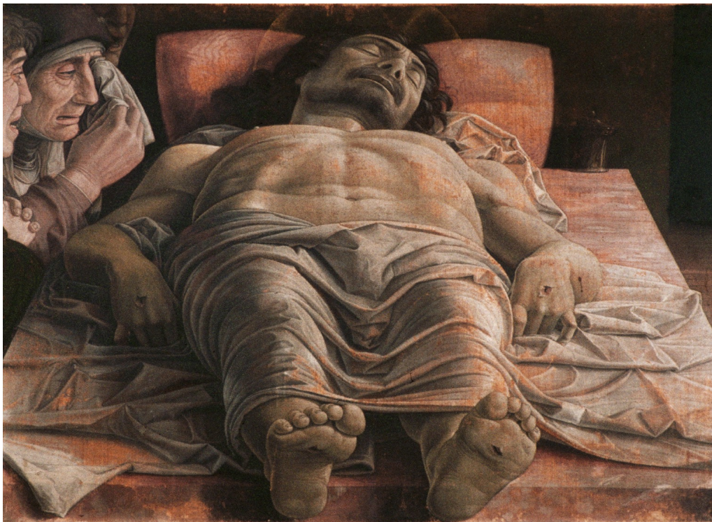
Illustration 4-2 – La Lamentation sur le Christ mort de Andrea Mantegna (fin XVe siècle)

qui serait venue laver le visage du Che et aurait remarqué sa ressemblance avec le Christ.