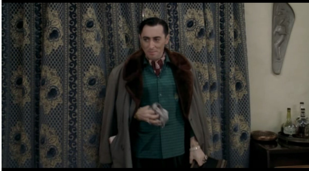
Illustration 8-3 – Fulgencio Batista (Alan Cumming) dans Company Man (2000)

Lorsqu'il arrive à la résidence de Quimp, il est accompagné de Crocker Johnson, un agent à la limite de la folie qui veut renvoyer « ce rat socialiste dans son trou » en parlant de Castro et en affirmant que « le communisme est mon problème ! ». De son côté, Fidel Castro est lui aussi caricaturé car lorsqu'on le voit pour la première fois il dit qu'il est un homme modeste qui n'aime pas la publicité alors qu'il pose pour une peinture en prenant la pause d'un sauveur et demande à ce que tous les journaux américains soient là. Tout le film n'est finalement qu'une fresque grotesque et presque anachronique quand on prend par exemple le cas de Batista qui n'est jamais resté sur l'île. En effet, il a fui dès le 1er janvier 1959 à Saint-Domingue. Les avis aussi bien des journalistes que des spectateurs sont d'ailleurs pour la plupart assez durs, ce qui se ressent au box-office à la sortie du film. Cependant Company Man montre comme Bananas avant lui qu'il y a aussi des films qui ridiculisent aussi bien Cuba que les États-Unis mais peut-être que l'absence de stars plus bankable 37 et de scènes d'action participent à leur échec commercial.