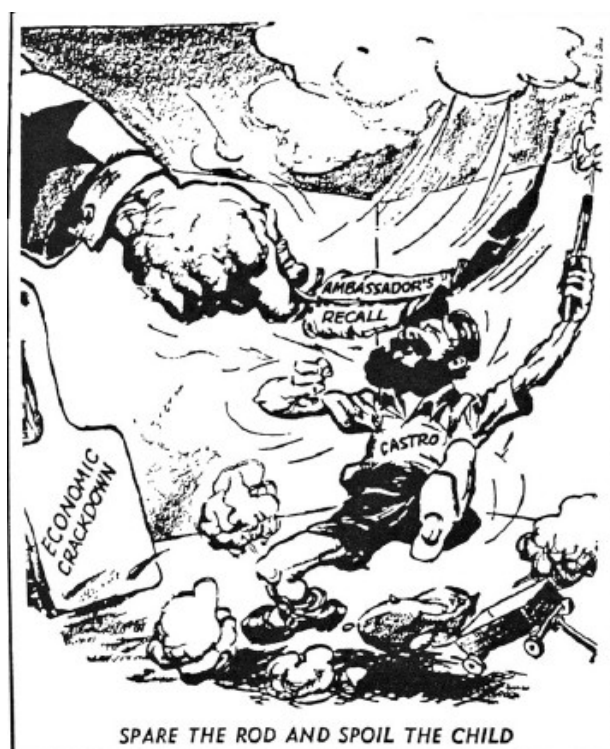
Illustration 3-3 – Cartoon « Arrêtez le bâton et gâtez l'enfant » tiré du Charleston News and Courier (1 janvier 1960)

Cette caricature 62 prouve bien que pour certains le gouvernement américain est trop gentil par rapport aux actions de Castro et ne fait que multiplier les rappels à l'ordre via les ambassadeurs pour protéger ses intérêts. En septembre 1959, Philip W. Bonsal rentre une première fois aux États-Unis et témoigne malgré tout d'une inquiétude grandissante du gouvernement par rapport à aux intérêts économiques américains que peuvent menacer certains actions politiques de Castro notamment la réforme agraire 63 . Ce projet, qui est un des premiers objectifs du programme du nouveau régime cubain, prévoit une redistribution des terres qui menacent donc directement les compagnies américaines qui exploitent des terrains sur l'île. Le discours de Castro devient de plus en plus radical envers les États-Unis en dénonçant par exemple un possible bombardement américain 64 . Pourtant le leader cubain continue d'affirmer son anti-communisme, ce que semble prendre au sérieux la CIA. L'agence affirme à Washington que même les communistes cubains ne voyaient pas Castro comme un de leurs soutiens à cause de ses origines bourgeoises 65 .