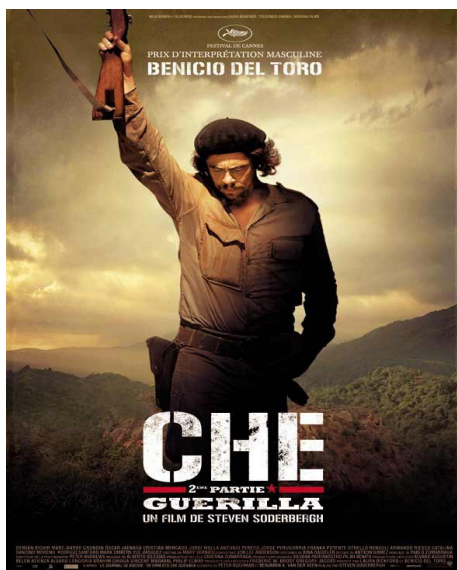
Illustration 9-2 – Affiche de Che – 2e partie : Guérilla (2008)

En 2008 le réalisateur Steven Soderbergh réalise un film biographique sur le Che de plus de 4h, montré tel quel au festival de Cannes mais qui est finalement divisé en deux parties en Europe. En France il est ainsi sorti sous les titres Che – 1e partie : L'Argentin et Che – 2e partie : Guérilla . Les deux films évoquent le parcours du Che depuis sa rencontre avec Fidel Castro au Mexique jusqu'à son exécution par la CIA après avoir échoué dans sa tentative de guérilla en Bolivie en 1967. Comme première remarque sur la pensée du réalisateur et comme réflexion sur la reprise des images on peut évoquer le poster de la deuxième partie :