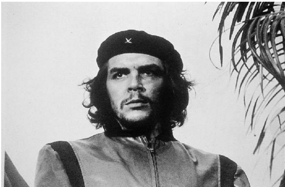
Illustration 4-1 – Photo de Che Guevara prise par Alberto Korda le 5 mars 1960

Le 5 mars 1960 a lieu une cérémonie à la Havane en hommage aux victimes de l'explosion de La Coubre , un navire transportant des armes à destination des Cubains. Alors que le Che ne fait qu'une brève apparition durant le discours de Fidel Castro, un jeune photographe cubain du nom de Alberto Diaz Gutierrez décide de le prendre en photo.