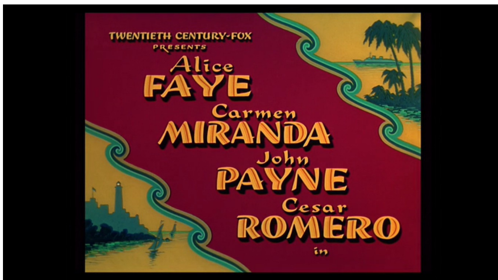
Illustration 2-4 – Générique de début du film Week-end in Havana

En novembre 1941 sort d'ailleurs Week-end in Havana réalisé par Walter Lang, alors que la saison touristique hivernale débute et que New York, où est diffusée la première du film, subit une vague de froid. Le contraste est frappant dès le début du film puisque des cartons présentent des palmiers, le Malecon avec des couleurs chaudes et de la musique qui ressemble à du mambo :