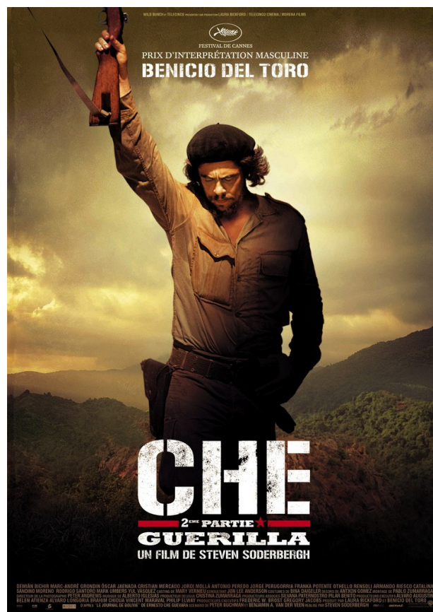
Poster de Che 2e partie : Guérilla réalisé par Steven Soderbergh (2008)

Mémoire dirigé par Madame Annick Foucier Centre de recherches d'histoire nord-américaine (CRHNA) Université Paris 1 Panthéon-Sorbonne Master 2 2017-2018