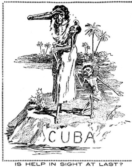
Illustration 1-1 - « Y'a t-il enfin de l'aide en vue ? 29 »

Ces images influencent la population qui est préparée à accepter l'intervention à Cuba comme devoir moral, pour des raisons humanitaires. De nombreuses pièces de théâtre à New York véhiculent aussi des idées de liberté et de patriotisme comme Cuba Free ou Cuba's Vow (1897) dont les recettes sont présentées comme des dons pour l'indépendance cubaine 30 . La presse présente cette nécessité d'intervenir comme un devoir pour les États-Unis qui ne peuvent ignorer les cris de souffrance des Cubains et doivent se comporter de manière plus honorable que les Espagnols, représentants d'un vieux système colonial dont les Américains se sont eux-mêmes affranchis dès 1776. L'explosion de l' USS Maine dans le port de La Havane est l'élément déclencheur qui confirme la nécessité d'intervenir à Cuba. Bien que cela puisse être uniquement un accident au niveau de la chaufferie, l'opinion publique influencée par la « presse jaune » dénonce un complot espagnol 31 . Ces accusations suscitent une vive émotion dans l'opinion publique et un désir d'en finir avec l'Espagne qui fait basculer William McKinley de l'hésitation à l'intervention.