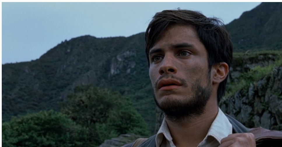
Illustration 9-2 – Gael Garcia Bernal dans la peau d'Ernesto Guevara ( Carnets de voyage , 2004)

L'affection que l'on peut porter au personnage d'Ernesto Guevara dans Carnets de voyage est aussi renforcée par le choix de l'acteur, Gael Garcia Bernal, dont le physique plutôt avantageux renforce le charisme qu'avait le Che lui-même.