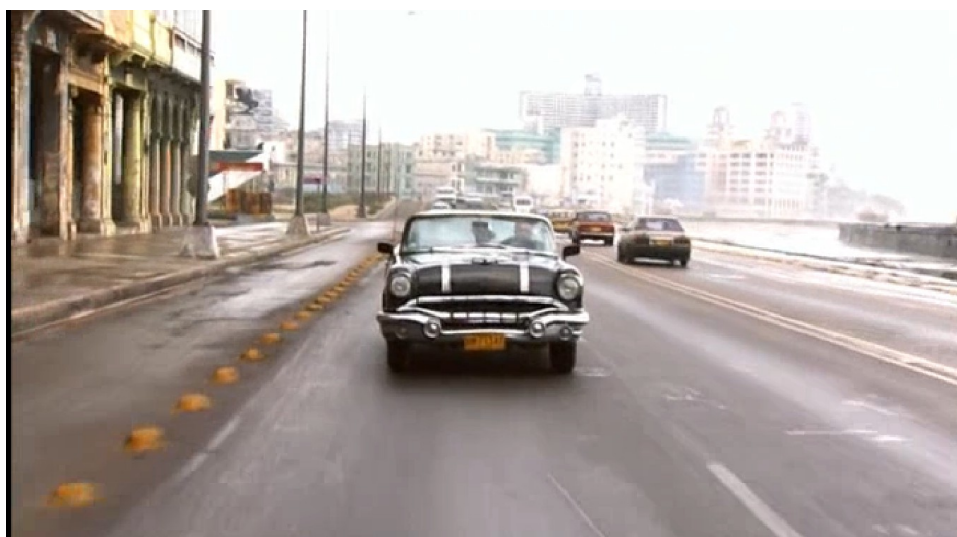
Illustration 6-1 – Compay Segundo remontant les rues de la Havane dans Buena Vista Social Club (1999)

Le film s'ouvre sur la scène du Carré à Amsterdam lors d'un concert du groupe en avril 1998. Pendant le générique défilent ensuite des images de Cuba, notamment d'une voiture américaine remontant une rue de la Havane avec Compay Segundo qui fume un cigare :