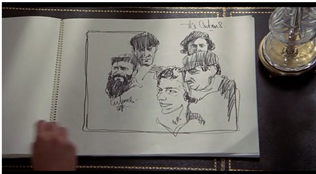
Illustration 4-4 – Extrait du film L'Étau (1969)

À l'opposé de l'idéologie contestataire de l'époque, Hitchcock présente dans ce film le régime cubain comme une tyrannie qui opprime le peuple. Fidel Castro et Che Guevara apparaissent deux fois dans le film. La deuxième fois ce sont des images d'archives d'un discours inséré par le réalisateur. Mais la première fois qu'ils sont représentés, c'est sous la forme de caricatures. La seule vision qu'on a de personnages historiques se fait à travers le miroir déformant et risible de la caricature.