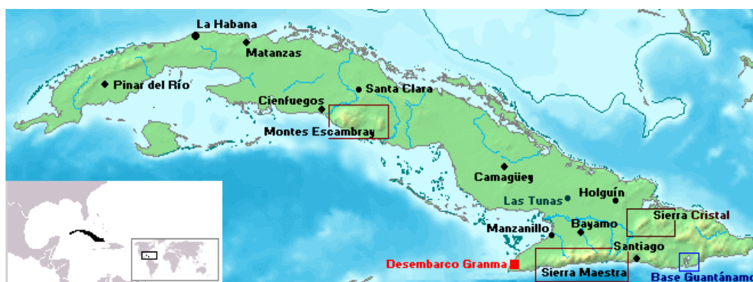
Illustration 3-1 – Carte de Cuba avec la localisation du débarquement du Granma 2

Pour l'opinion publique cubaine Fidel Castro fait partie des soixante-dix révolutionnaires qui sont morts lors du débarquement car la presse, contrôlée par le régime de Batista, préférait taire l'existence des douze survivants. Cependant, un correspondant du New York Times apporte en février 1957 un scoop retentissant qui renforce le mythe de la guérilla jusqu'aux États-Unis. Après s'être rendu en secret à Cuba le 9 février 1957 pour interviewer Castro, le journaliste Herbert L. Matthews affirme : « Ceci est la première nouvelle sûre que Fidel Castro est toujours en vie et qu'il est toujours à Cuba 3 . ». Cet article fait partie d'une série de trois articles rédigés par Matthews après ce voyage. Mais pour l'ancien correspondant à l'étranger du New York Times Anthony DePalma, la vision de Matthews est d'autant moins objective que celui-ci est un ancien reporter de guerre frustré par la défaite de l'idéalisme républicain durant la guerre civile espagnole 4 .