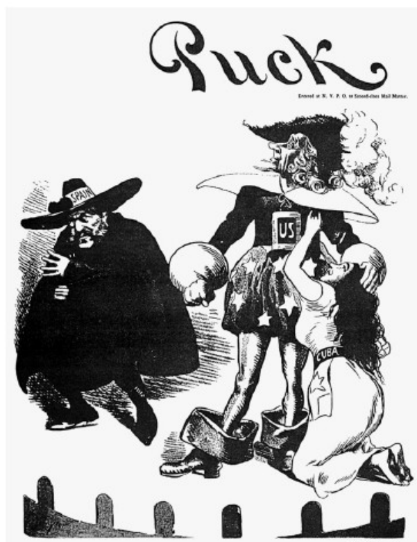
Illustration 1-4 – Caricature qui montre les États-Unis comme un noble chevalier qui protège Cuba, la demoiselle en détresse, face au bandit espagnol 67

Il est ainsi intéressant de voir que dès la naissance du cinéma américain, le premier film de propagande illustre l'intervention américaine à Cuba et véhicule une image tronquée de la réalité par le message que ces films veulent faire passer et par la façon dont ils sont réalisés. En tant que média de masse, cette image touche le spectateur qui va l'incorporer comme une réalité. Cuba entre dans l'imaginaire américain comme la demoiselle en détresse qu'il faut secourir au nom des valeurs américaines et pour repousser l'Espagne, qui représente le pouvoir colonial du Vieux Monde dont les Américains se sont eux-mêmes débarrassés en 1783.