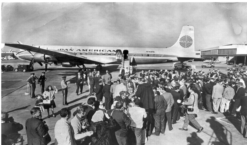
Illustration 7-2 – Photographie des exilés des freedom flights , accueillis à leur arrivée aux États-Unis par d'autres Cubains 16

Cette politique de porte ouverte employée par Lyndon B. Johnson profite à 340 000 réfugiés entre 1965 et 1973 qui sont répartis sur 2800 vols entre Varadero et Miami 14 . La composition de cette vague d'immigration change cependant légèrement : on passe de 15% de cadres pour le premier exil à 4,8% pour cette deuxième vague mais Washington continue de soutenir l'immigration vue comme une arme géopolitique et une main d'œuvre pour la Floride 15 . Ce sont des membres de la classe moyenne qui considèrent que désormais le régime castriste s'est bien installé et se résignent à ne plus retourner sur l'île, contrairement aux premiers exilés qui veulent se battre pour le renverser.