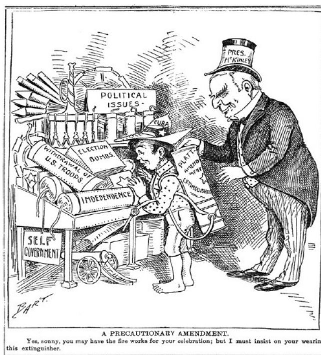
Illustration 1-2 – Caricature montrant la nécessité de l'amendement Platt pour éduquer « l'enfant » cubain 41

Dès le 1er janvier 1899, le pouvoir est transféré de l'administration espagnole à l'armée américaine. Les Américains gardent un contrôle sur Cuba, présenté comme dans l'intérêt du peuple cubain qui ne serait, selon eux, constitué que d'individus incapables de se gouverner eux-mêmes. Cette vision de supériorité se mêle à une idéologie raciste qui place la race anglo-saxonne comme supérieure à toutes les autres, alors que la population cubaine est composée de descendants d'Espagnols ou d'esclaves africains. En outre, le sénateur du Michigan Zachariah Chandler leur reproche leurs vices et leur ignorance 39 . Leur supposée incapacité à gouverner est perçue comme une menace pour la sécurité des États-Unis car leur instabilité mettrait à mal l'ordre établi dans la région, ce qui fait que Cuba ne doit pas échapper à leur contrôle 40 . La même presse américaine qui a dénoncé les conditions de vie sous le contrôle espagnol participe à la construction de ces représentations dans l'imaginaire américain. En 1901 le Minneapolis Journal présente l'amendement Platt, censé pouvoir autoriser les États-Unis à intervenir militairement en cas de troubles politiques, comme un extincteur qui empêcherait « l'enfant » cubain de jouer avec les feux d'artifice « élections », « indépendance » et « retraite des troupes américaines » :