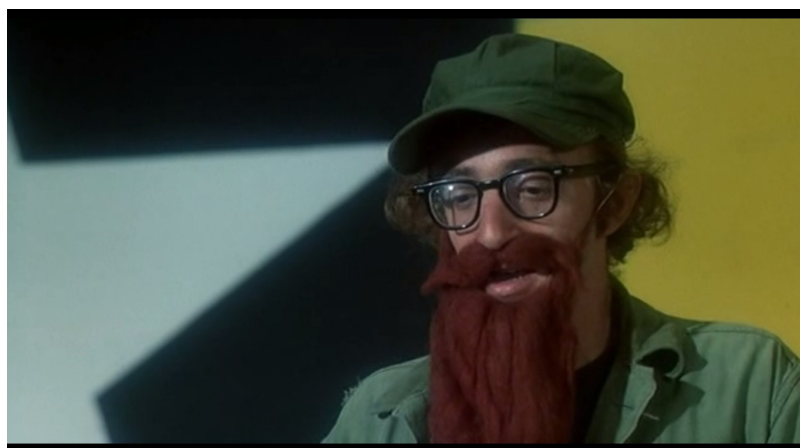
Illustration 5-2 – Extrait de Bananas (1972) : Woody Allen en révolutionnaire de San Marcos

Fidel Castro, le dictateur qui s'enfuit lorsque les rebelles prennent la ville est Batista qui part de la Havane le 31 décembre 1958, l'absence d'élections libres reflète aussi la situation politique du régime castriste, etc... Le film entier repose sur cet aspect grotesque avec des scènes risibles et caricaturales. L'ancien président de San Marcos est assassiné en direct à la télévision comme un événement sportif. Une fois au gouvernement, Esposito oblige les habitants à parler suédois. Fielding Mellish campe un semblant de rebelle très maladroit, qui ne sait rien faire, dont l'entraînement à San Marcos est accompagné d'une musique de comédie burlesque. Certes Woody Allen caricature les révolutionnaires en se grimant grossièrement comme Fidel Castro :