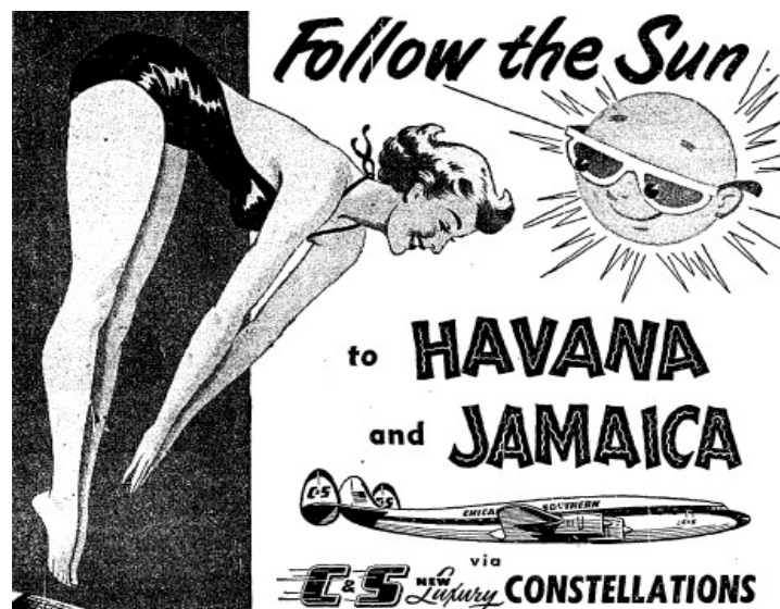
Illustration 2-3 - « Suivez le soleil jusqu'à la Havane et la Jamaïque » 27

représentent une cible très importante pour ces campagnes car ils fournissent la grande majorité des revenus touristiques de Cuba. Le Chicago Daily Tribune continue ainsi de publier des publicités autour de Cuba en jouant sur le climat exotique alors que les Américains lisent le journal en plein mois de décembre :