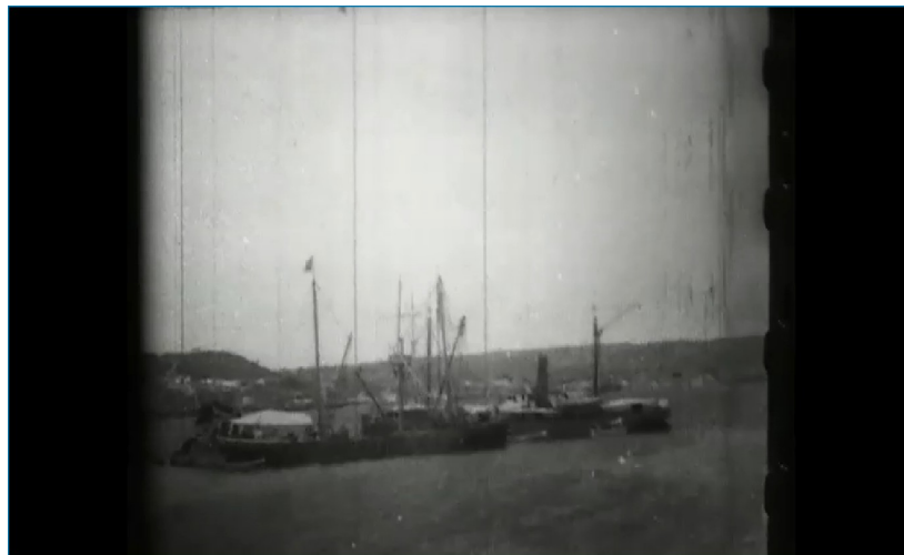
Illustration 1-3 – Extrait de The Wreck of the Maine réalisé par William Paley (1898)

affamés. Ces images servent d'argument pour justifier une intervention américaine pour des raisons humanitaires 61 .