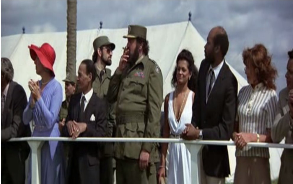
Illustration 5-3 – Dans Octopussy (1983), un militaire cubain gros et barbu s'installe en poussant les gens et en regardant avec insistance les femmes