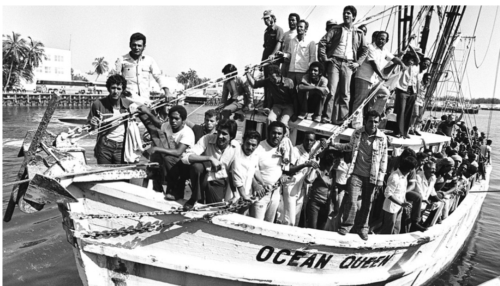
Illustration 7-3 – Photographie des marielitos en 1980 39