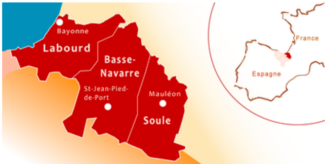
Figure 3 : Provinces du Pays Basque Nord

Elle est la sixième communauté d'agglomérations la plus peuplée de France, avec un total de 309 673 habitants en 2019 (INSEE).