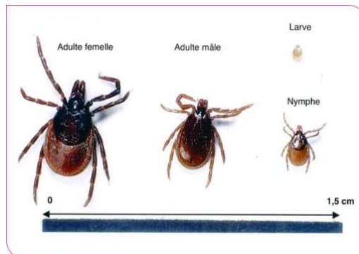
Figure 1 : Stades de développement de la tique Ixode Ricinus

Le principal vecteur de la maladie en France et en Europe est la tique du genre Ixodes . La tique est un arthropode hématophage, dont l'évolution se déroule en 4 stades ou stases : œuf > larve > nymphe > adulte (mâle ou femelle).