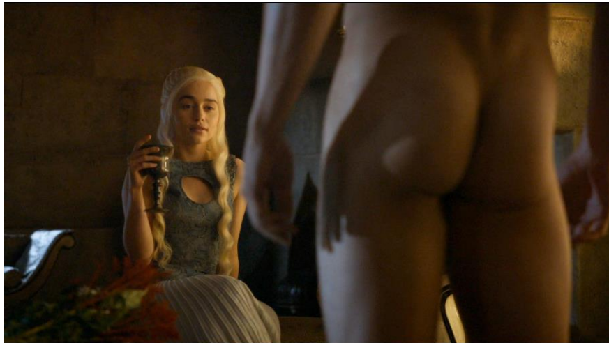
« Do what you do best: take off your clothes ». Daenerys Targaryen (Emilia Clarke) face à Daario Naharis (Michiel Huisman). Mockingbird (saison 4 épisode 7), 18 min 08 – 20 min 41