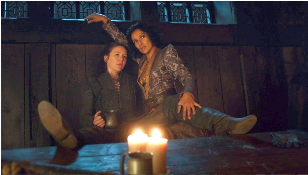
Yara Greyjoy (Gemma Whelan) et Ellaria Sand (Indira Varma) moquant la masculinité brisée de Theon Greyjoy (Alfie Allen) Stormborn (saison 7 épisode 2), 48 min 30 – 50min 05