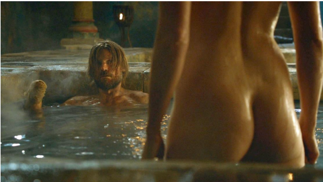
La féminité active de Brienne de Tarth (Gwendoline Christie) comme réponse au mépris de Jaime Lannister (Nikolaj Coster-Waldau). Kissed by Fire (saison 3 épisode 5), 33 min 50 – 40 min 30.

L'absence d'érotisation ou de sublimation du corps nu de Brienne, couplé au manque d'identification à un regard dans la diégèse, témoigne donc de l'absence de male gaze dans cette séquence. L'espace de quelques instants, le corps de Brienne est même utilisé de manière unique dans le discours de Game of Thrones : excédée par les moqueries de Jaime, elle se dresse frontalement devant lui, cachée au regard du spectateur, mettant en avant son corps et sa féminité. Pour un personnage aussi meurtri et introverti, ce geste signifie avant tout son empowerment de survivante tant physiquement que moralement dans un monde impitoyable avec elle. Ce faisant, elle gagne pour la première fois le respect de l'homme qu'elle déteste, et sa confiance. Échappant au male gaze , le statut de femme forte de Brienne sort ainsi grandi de cette mise à nu.