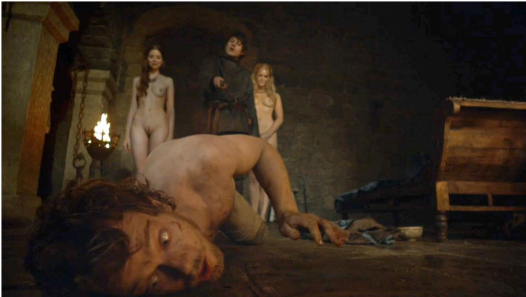
Ramsay Bolton (Iwan Rheon) castrant Theon Greyjoy (Alfie Allen) sous les yeux de ses prostituées The Bear and the Maiden Fair (saison 3 épisode 7) 33min36-38 min 46