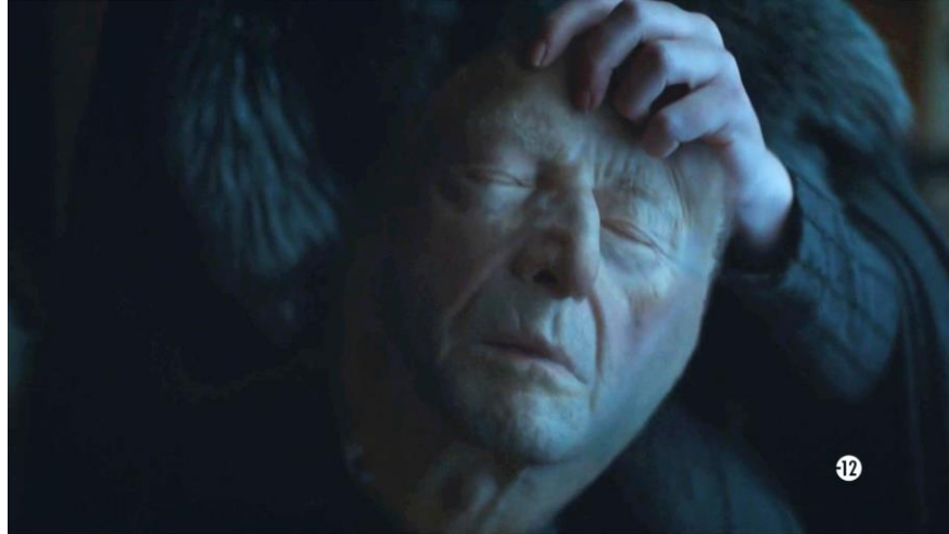
Sansa (Sophie Turner) découvre les « visages » de sa sœur. Désacralisation des facultés de mimétisme d'Arya (Maisie Williams) en simples déguisement. The Dragon and the Wolf (saison 7 épisode 7), 00 57 min 20 sec – 1h 01min 01 sec

La désacralisation des pouvoirs magiques de fantasy d'Arya est concrétisée lors de la scène du meurtre de Petyr « Littlefinger » Baelish dans l'épisode The Dragon and the Wolf (saison 7 épisode 7), orchestré par les sœurs Stark pour venger la mort de leur famille dont Littlefinger est directement responsable 160 . Celui-ci est tué en public pour marquer les esprits, comme pour Walder Frey, mais Arya exécute ici la sentence sous son vrai visage, en plus de le faire aux yeux de tous les vassaux Stark. Alors que l'artifice du mimétisme mettait le spectateur dans la confiance, l'abandon du traitement fantasy du mode opératoire d'Arya le prend ici complètement par surprise, dans un procédé d'identification avec la surprise de Littlefinger. Plus encore, c'est le premier assassinat qu'Arya commet sur ordre de sa sœur, et non pour elle-même, se dédouanant pour la première fois de son double rôle de juge et bourreau construit par son isolement narratif. La saison 7 dévoile donc progressivement les artifices de fantasy de son personnage au spectateur par le biais des scènes avec Brienne et Sansa, ramenant ses capacités dans une monstration réaliste. Cette désacralisation est d'autant plus importante qu'elle éloigne Arya du stéréotype de tomboy solitaire qui caractérisait son encapacitation 161 , et permet l'amorce d'une sororité entre les sœurs Stark, que tout semblait pourtant opposer.