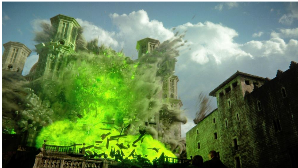
Destruction de King's Landing par le wildfire de Cersei (Lena Headey) Un choix de traitement visuel de pure fantasy. The Winds of Winter (saison 6 épisode 10), 10 min 12 – 18 min 10

À l'inverse de l'échec brutal des personnages de Daenerys et Mélisandre, plusieurs autres femmes du récit se sont progressivement et volontairement éloignées des éléments fantastiques qui étaient au cœur de leur processus d' empowerment des saisons précédentes. C'est notamment le cas de Cersei Lannister, dont la volonté de gouverner seule était contrecarrée par son père Tywin, son frère Tyrion, ses fils Joffrey et Tommen, et par l'influence grandissante de la famille Tyrell sur ces derniers. Le passage de son statut de régente sans pouvoir réel à celui de reine couronnée constituait le retournement de situation du dernier épisode de la saison 6 : elle faisait exploser ses rivaux grâce au wildfire dont elle avait secrètement ordonné la fabrication. Tant dans son traitement visuel que dans les explications diégétiques de sa fabrication (un secret jalousement gardé d'une guilde mystique), le wildfire est traité comme un élément de pure fantasy qui renvoie au feu des dragons de Daenerys, plutôt que comme un élément réaliste s'inspirant de l'authentique feu grégeois.