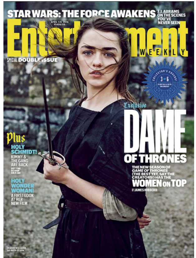
Arya Stark (Maisie Williams) en une du magazine Entertainment Weekly, avril 2016