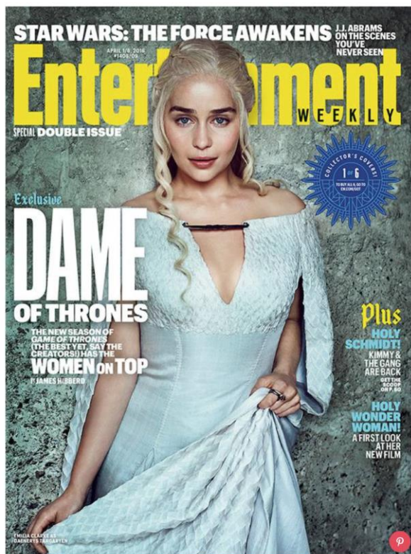
Daenerys Targaryen (Emilia Clarke) en une du magazine Entertainment Weekly, avril 2016