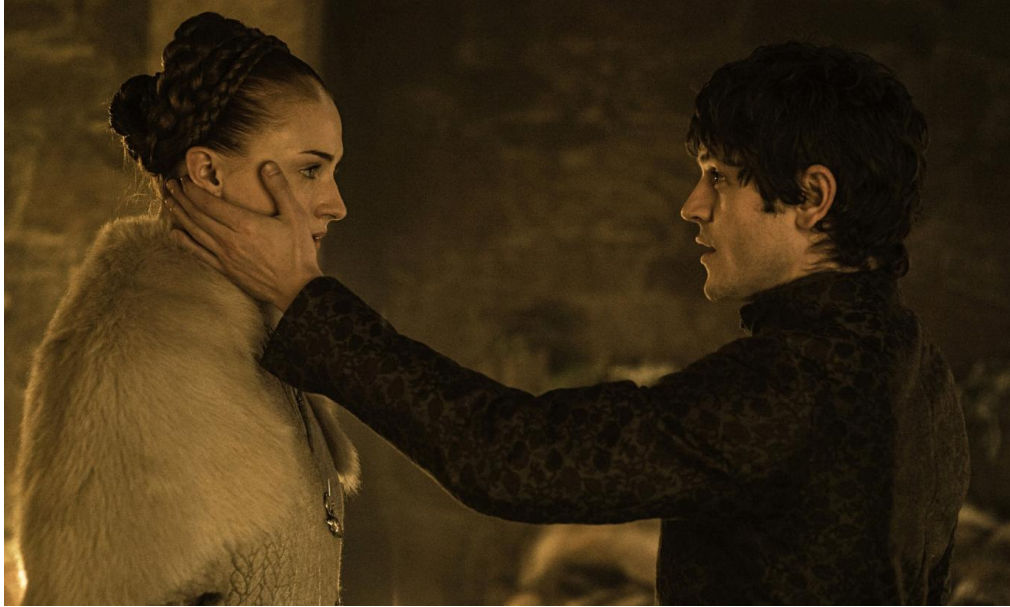
Ramsay Bolton (Iwan Rheon) sur le point de violer Sansa Stark (Sophie Turner). Unbent, Unbowed, Unbroken (saison 5 épisode 6). 48 min 27 – 52 min 17.