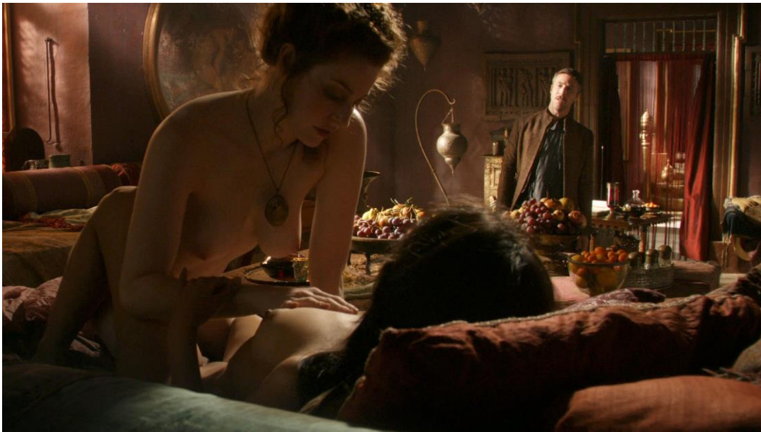
Petyr « Littlefinger » Baelish (Aiden Gillen) évaluant les prostituées de son bordel. You Win or You Die (saison 1 épisode 7), 09 min 37 – 14 min 40.

informations essentielles sur son passé mystérieux : son amour inconditionnel pour Catelyn Stark et l'humiliation qu'il a subie en tentant de la séduire, résultant de son incompetence martiale. À ce stade de la série, la révélation de la passion de Littlefinger pour Catelyn Stark entretient l'ambiguïté quant à l'allégeance du personnage, et prépare donc le cliffhanger de sa trahison du clan Stark à la fin de l'épisode.