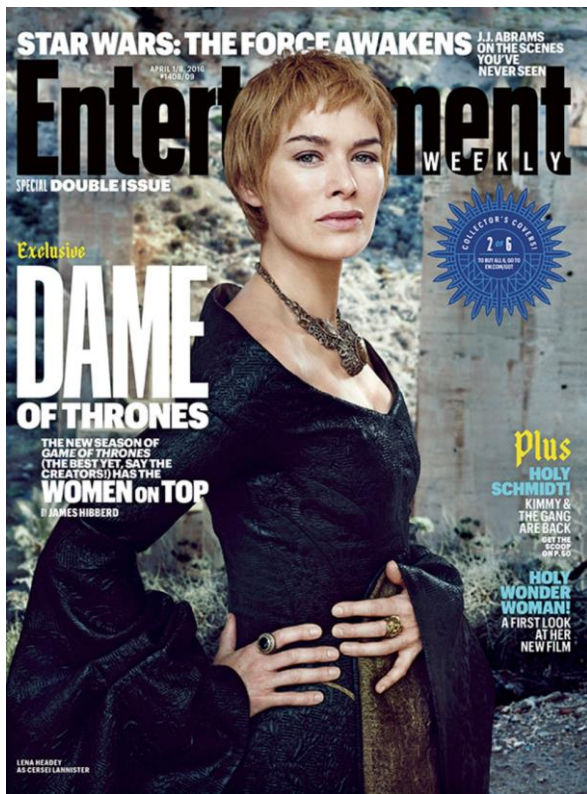
Cersei Lannister (Lena Headey) en une du magazine Entertainment Weekly, avril 2016