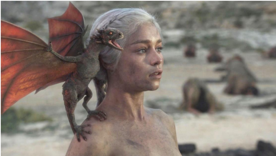
Scène finale de la saison 1. Naissance des dragons, renaissance de Daenerys (Emilia Clarke). Fire and Blood (saison 1 épisode 10), 45min 18- 51 min 28