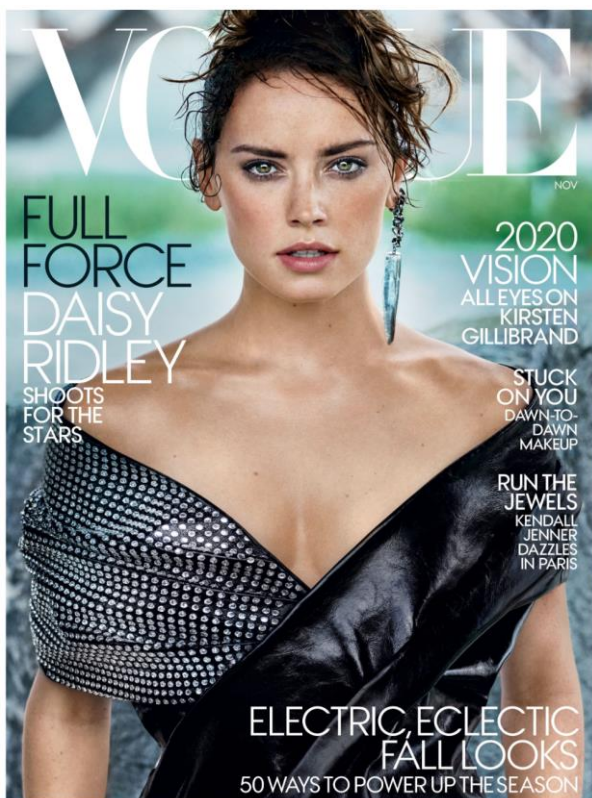
Daisy Ridley posant en couverture du magazine Vogue pour la sortie de Star Wars : The Last Jedi (2017)

(2017) dans des sites communautaires spécialisés et se revendiquant « féministes », qui dénoncent la « projection de fantasmes masculins 141 » qu'est la sexualisation de la super-héroïne : « cette dimension du personnage de Diana contrebalance son apparence de super-héroïne. [...] elle est prête aussi bien pour le sexe que pour le combat 142 . » Ces couvertures controversées soulignent avant tout la fragilité et la fausseté des justifications fictionnelles et/ou génériques avancées par les productions pour dédouaner leur traitement diégétique et promotionnel de l'empowerment féminin des accusations de sexisme.