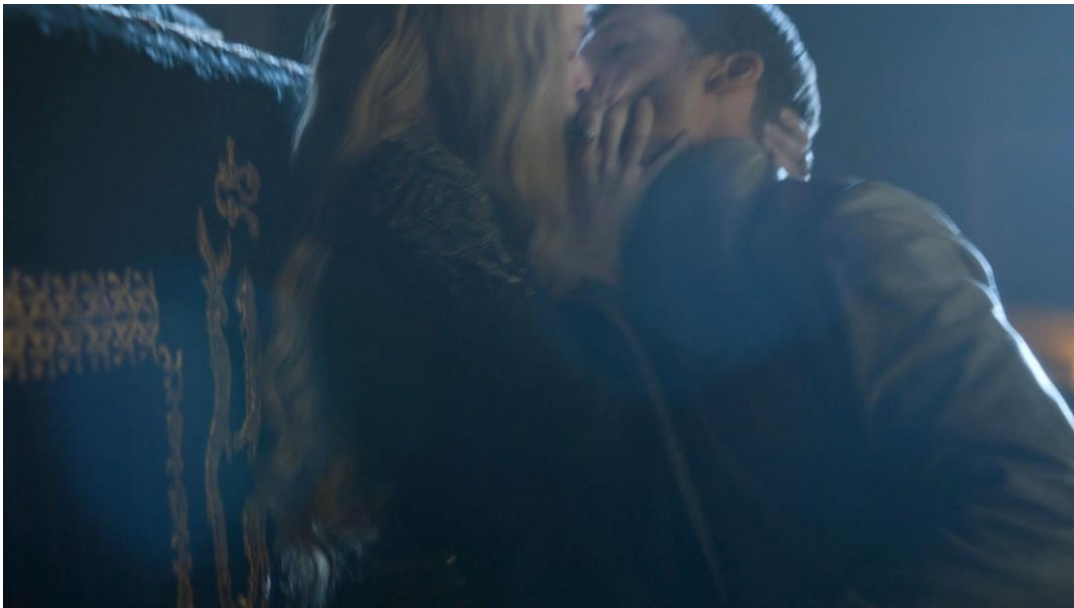
Cersei Lannister (Lena Headey) saisissant le visage de son frère et amant Jaime (Nikolaj Coster-Waldau) dans un geste ambivalent. (15:05). Breaker of Chains (saison 4 épisode 3), 12min40-15min31

Ces procédés visuels et de montage suscitent un doute légitime sur les intentions de Cersei : si celle-ci fait verbalement et physiquement état de son refus explicite de consentir au sexe, plusieurs plans montrent des gestes qui semblent induire une forme d'encouragement ou de consentement, notamment lorsqu'elle saisit le visage et l'arrière de la tête de Jaime pour l'attirer vers elle et l'embrasser. Cette ambiguïté est concrétisée dans le gros plan concluant la scène, où la main de Cersei saisit le drap mortuaire de Joffrey, dans un geste complètement ambivalent : signifie-t-il maladroitement la douleur de Cersei en train d'être violée, ou au contraire sa prise de plaisir dans une relation sexuelle consentie avec son frère et amant ?