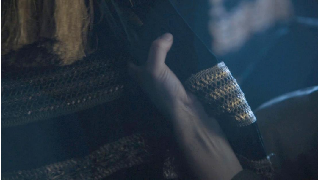
Insert sur la main de Cersei Lannister (Lena Headey), concluant la scène (15 :30). Un geste ambivalent, entre résistance et prise de plaisir. Breaker of Chains (saison 4 épisode 3), 12min40-15min31

Cette ambiguïté textuelle est fondamentale dans la compréhension du paratexte mis en œuvre par la production pour tenter d'en expliciter le sens, qui va paradoxalement en accentuer les incohérences, notamment de par les prises de positions contradictoires des différents acteurs de production. Ainsi, l'acteur Nikolaj Coster-Waldau déclare en interview que la scène « n'était pas destinée à être une scène de viol, elle n'était pas interprétée de cette façon, elle n'était pas écrite comme cela 212 », accréditant l'interprétation des gestes de Cersei comme des expressions de plaisir, dans une relation sexuelle consentie et consensuelle. Le témoignage de l'acteur est toutefois formellement contredit par les showrunners David Benioff et D.B. Weiss : « Vous voyez que Cersei résiste. Elle dit non, et il la prend de force. C'était une scène très inconfortable et une scène délicate à tourner 213 ». Ceux-ci explicitent donc la prise de force de Cersei par son frère, malgré sa tentative de résistance. Ces deux prises de positions sont en quelque sorte