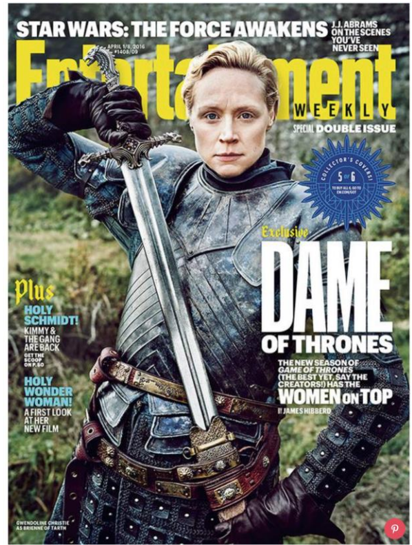
Brienne de Tarth (Gwendoline Christie) en une du magazine Entertainment Weekly, avril 2016