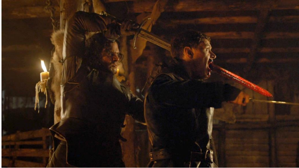
Jon Snow (Kit Harington) transperçant Karl Clubfoot (Burn Gorman) dans une mise à mort métaphorique exutoire. First of His Name (saison 4 épisode 5), 46min28-48 min 44

Toutefois, ce schéma semble être mise en œuvre de manière consciente par la production, puisqu'il est également déclinée à deux reprises comme un ressort narratif d'importance. Dans un premier temps, le viol de Theon Greyjoy par ses poursuivants apparentés à des soldats Bolton est interrompu de manière particulièrement violente : l'un des violeurs est tué d'une flèche tirée à bout portant au visage par un sauveur providentiel inconnu. Bien qu'étant une punition métaphorique du violeur qui apparaît comme légitime aux yeux du public, cette représentation prend une tout autre dimension lorsqu'il s'avère que le personnage salvateur est en réalité Ramsay Snow/Bolton. L'exécution du violeur est en réalité celle d'un de ses propres hommes, annonçant implicitement au spectateur le sadisme du personnage qui torturera Theon pendant toute la saison 3 et violera Sansa dans la saison 5. Ainsi, cette mise à mort exutoire opère comme une manipulation des attentes des spectateurs vis-à-vis d'une résolution cathartique des scènes de viol. La perversion de cette logique narrative fonctionne donc en invisibilisant temporairement le traumatisme subi par Theon, afin de le faire à terme ressurgir violemment par son émasculatation aux mains du sadique Ramsay.