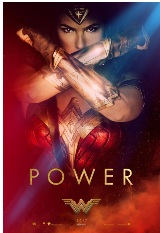
Affiche promotionnelle de Wonder Woman (2017), avec Gal Gadot dans le rôle-titre.