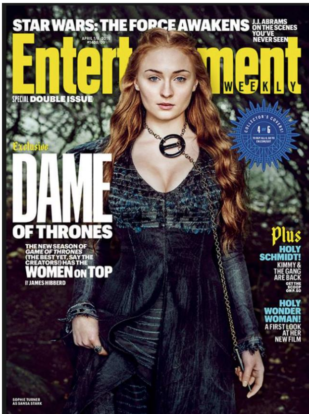
Sansa Stark (Sophie Turner) en une du magazine Entertainment Weekly, avril 2016

la revendication de progressisme de la production en ne mettant que des personnages féminins en couverture, titrant « Dame of Thrones [...] Women on Top ». Il ne sera pas ici question de post-féminisme ou de marketplace feminism au sens consumériste du terme, mais de s'intéresser à la manière dont l' empowerment féminin est visuellement sexualisé.