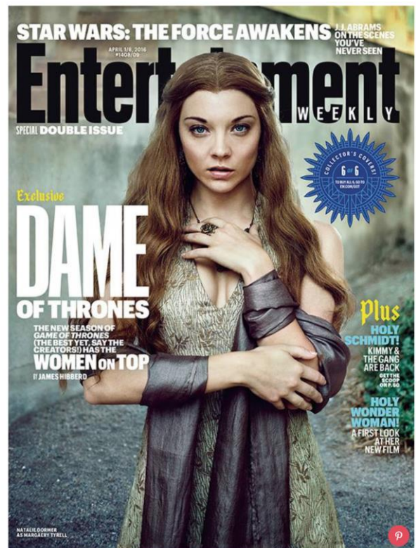
Margaery Tyrell (Natalie Dormer) en une du magazine Entertainment Weekly, avril 2016