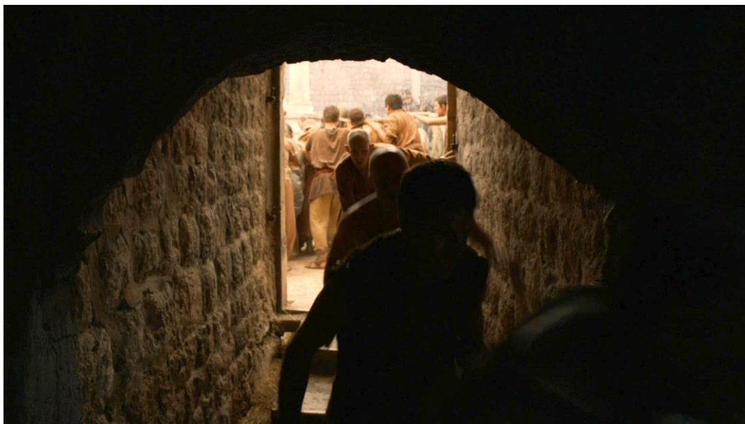
La fuite de Sansa à travers un dédale sombre et bas de plafond. Un traitement stéréotypé du viol prenant place dans un ailleurs fantasmé cauchemardesque. The Old Gods and the New (saison 2 épisode 6), 25 min 13 – 29 min 42