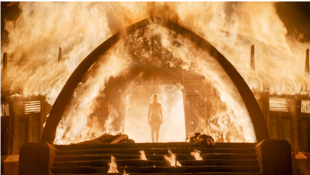
Daenerys Targaryen (Emilia Clarke) en déesse apocalyptique, soumettant le peuple dothraki par son super-pouvoir inné. Book of the Stranger (saison 6, épisode 4), 50 min 39 - 57min 18