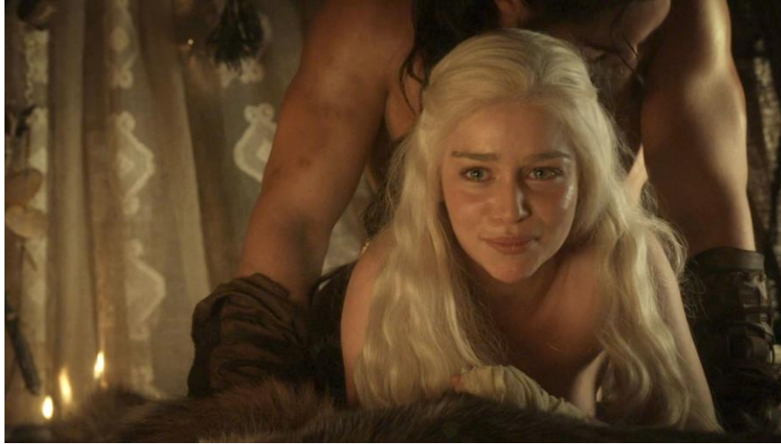
Daenerys Targaryen (Emilia Clarke) en pleurs (25 :03) lors de son viol par Khal Drogo (Jason Momoa), puis souriante à la vue de ses œufs de dragons (25 :09 et 25 :20) The Kingsroad (saison 1 épisode 2), 24 min 36-25 min 21

Le cheminement de Sansa dans la diégèse est ainsi particulièrement radical, puisqu'elle passe du stéréotype de jeune princesse naïve de fantasy (saison 1) à un personnage ambigu de femme de pouvoir froide et impitoyable (saison 7). Toutefois, cette évolution est caractérisée par une série de pertes tragiques (celles de son père, puis de sa mère et de son frère 225 ) mais aussi et surtout par des humiliations publiques (déshabillée de force et frappée sur ordre du roi Joffrey 226 ) et privées (mariage forcé avec Tyrion Lannister 227 ). Cette évolution est commentée par l'actrice Sophie Turner : « Je jure, cette série, après la première saison où les gens détestaient Sansa. Les showrunners [David Benioff et Dan Weiss] ont dû se dire : 'D'accord, faisons tout ce qu'on peut pour faire d'elle le personnage le plus maltraité, le plus manipulé !' 228 ». L'impact de cette somme d'événements sur la psychologie et le comportement de la jeune femme est considérable, réduisant à néant son innocence, sa naïveté et sa gentillesse. Toutefois, l'argumentaire de la production revendiquant ces humiliations répétitives comme un