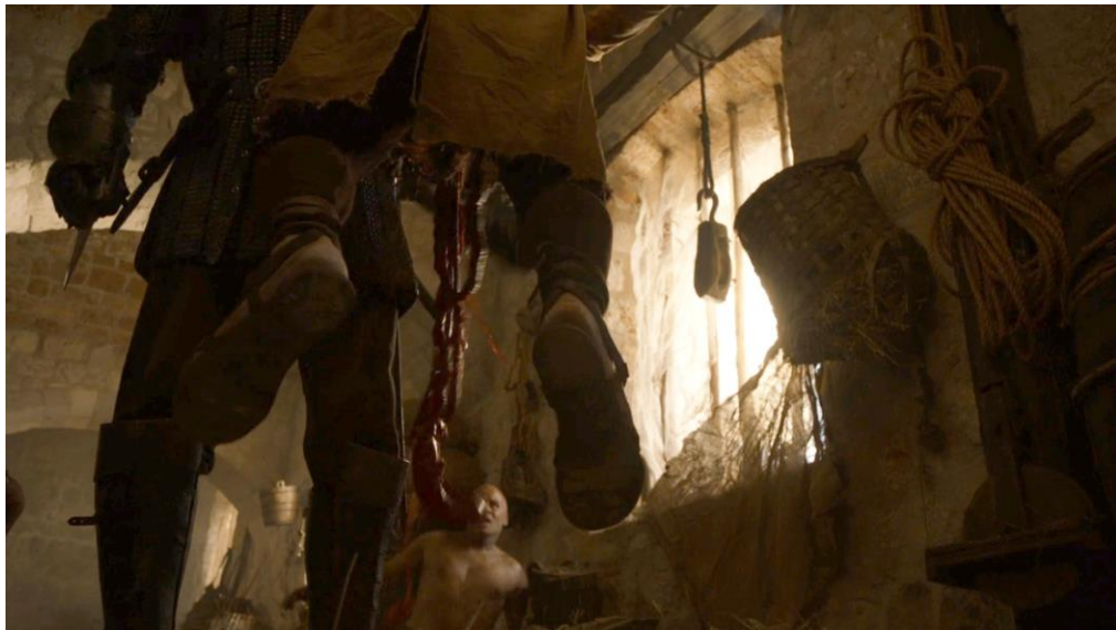
The Hound (Rory McCann) éviscérant l'un des violeurs de Sansa. The Old Gods and the New (saison 2 épisode 6), 25 min 13 – 29 min 42

monstrueuse, et le verbe « détruire » à une punition cathartique violente des coupables. La mise à mort de Karl Clubfoot est ainsi exceptionnellement violente : Jon Snow le tue au moyen d'un coup d'épée à travers la bouche et de dos, geste magnifié par un plan montrant la pose des deux personnages de profil, avant que le violeur ne s'écroule à genoux devant sa victime. Toutefois, cette violence n'est pas uniquement visuelle et agit également sur le plan symbolique : la mise à mort du violeur est viscérale, punissant à la fois le sadisme expressif de Karl qui se vante de ses actes et son corps même par une pénétration métaphorique. Un schéma similaire est également à l'œuvre dans l'interruption du viol de Sansa par la démonstration de virilité martiale impitoyable de The Hound. La mise en scène met ainsi en valeur le meurtre des violeurs par étranglement (pieds quittant le sol), éviscération (organes tombant au sol) et égorgement (gros plan sur la gorge tranchée). Si ces mises à mort de corps humains par déstructuration viscérale agissent bien comme des punitions visuelles et métaphoriques, elles opèrent aussi et surtout comme une surenchère puérile de violence valorisant une masculinité hégémonique martiale aux dépens d'une monstration du viol comme traumatique.