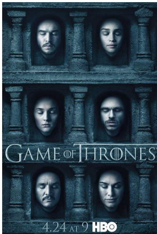
Affiche promotionnelle de la saison 6. Multiplicité et motifs visuels comme marqueurs génériques de fantasy.

Ses capacités martiales jusqu'alors soupçonnées mais invisibles à l'écran sont dévoilées pendant son duel d'entraînement avec Brienne de Tarth ( The Spoils of War , saison 7 épisode 4), sans pour autant dévoiler leur origine mystique à la curiosité de Brienne. Plus encore, les soupçons de Sansa sur l'allégeance de sa sœur l'amènent à fouiller ses affaires et découvrir, en même temps que le spectateur, les masques dont elle se sert pour commettre ses meurtres ( Beyond the Wall , saison 7 épisode 6). Arya était jusque alors montrée capable d'imiter à la perfection l'identité de ses victimes, notamment leur voix et leur taille, ce que le spectateur acceptait implicitement par le contexte fantastique du récit. Toutefois, la découverte par Sansa des masques, de réels éléments de déguisement imitant les visages des victimes, désamorce le traitement de fantastique et l'artifice de mise en scène du mimétisme parfait, qui disparaît entièrement du récit par la suite.