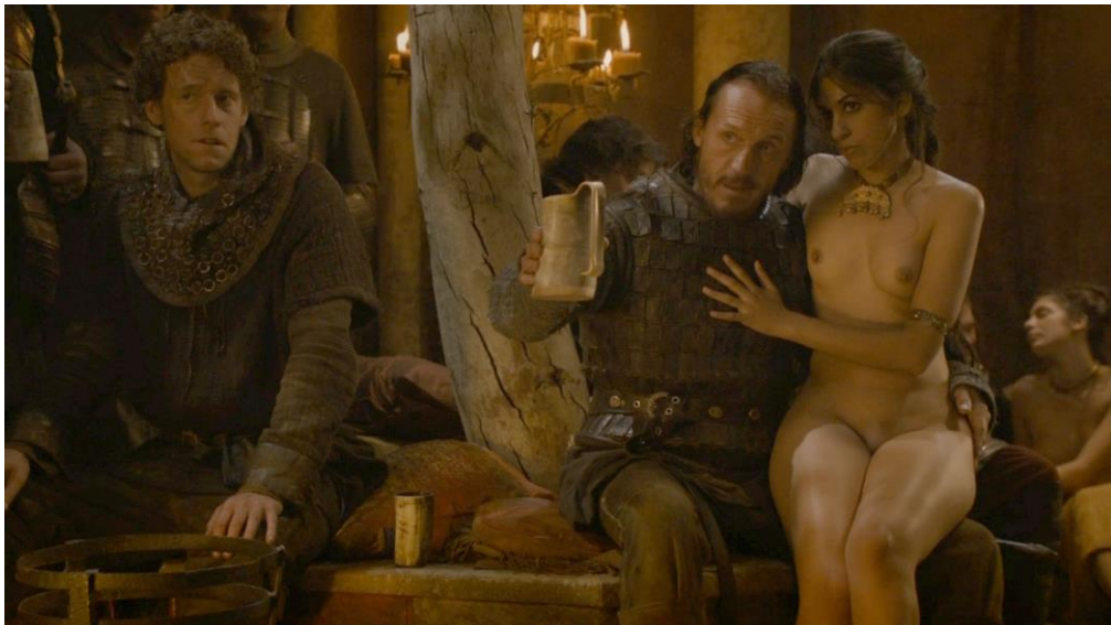
Bronn et les soldats Lannister se préparant au combat. Blackwater (saison 2 épisode 9), 09 min 38- 13 min 43.

Il fait ici référence à une scène en particulier dans laquelle Bronn, mercenaire 46 au service de Tyrion Lannister boit une dernière bière dans une taverne avant de partir au combat, en compagnie de soldats Lannister. Au nombre d'une vingtaine, ils sont tous prêts à aller se battre à la moindre alerte, en armes et armures. Au milieu de cette fraternité martiale improvisée, une prostituée est assise sur les genoux de Bronn, qu'il déshabille rapidement pour le plaisir de l'audience diégétique et spectatorielle.