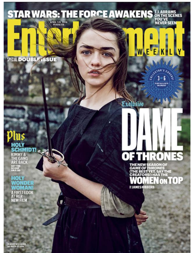
Arya Stark (Maisie Williams) en une du magazine Entertainment Weekly, avril 2016