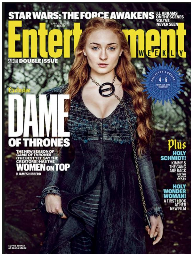
Sansa Stark (Sophie Turner) en une du magazine Entertainment Weekly, avril 2016

la revendication de progressisme de la production en ne mettant que des personnages féminins en couverture, titrant « Dame of Thrones [...] Women on Top ». Il ne sera pas ici question de post-féminisme ou de marketplace feminism au sens consumériste du terme, mais de s'intéresser à la manière dont l' empowerment féminin est visuellement sexualisé.