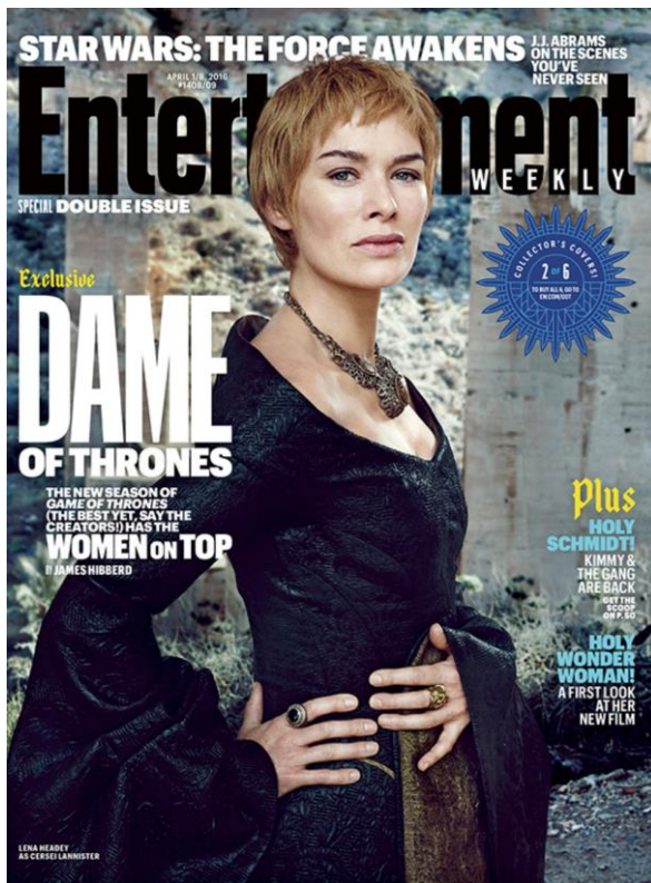
Cersei Lannister (Lena Headey) en une du magazine Entertainment Weekly, avril 2016