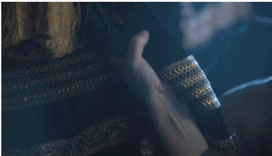
Insert sur la main de Cersei Lannister (Lena Headey), concluant la scène (15 :30). Un geste ambivalent, entre résistance et prise de plaisir. Breaker of Chains (saison 4 épisode 3), 12min40-15min31

Cette ambiguïté textuelle est fondamentale dans la compréhension du paratexte mis en œuvre par la production pour tenter d'en expliciter le sens, qui va paradoxalement en accentuer les incohérences, notamment de par les prises de positions contradictoires des différents acteurs de production. Ainsi, l'acteur Nikolaj Coster-Waldau déclare en interview que la scène « n'était pas destinée à être une scène de viol, elle n'était pas interprétée de cette façon, elle n'était pas écrite comme cela 212 », accréditant l'interprétation des gestes de Cersei comme des expressions de plaisir, dans une relation sexuelle consentie et consensuelle. Le témoignage de l'acteur est toutefois formellement contredit par les showrunners David Benioff et D.B. Weiss : « Vous voyez que Cersei résiste. Elle dit non, et il la prend de force. C'était une scène très inconfortable et une scène délicate à tourner 213 ». Ceux-ci explicitent donc la prise de force de Cersei par son frère, malgré sa tentative de résistance. Ces deux prises de positions sont en quelque sorte