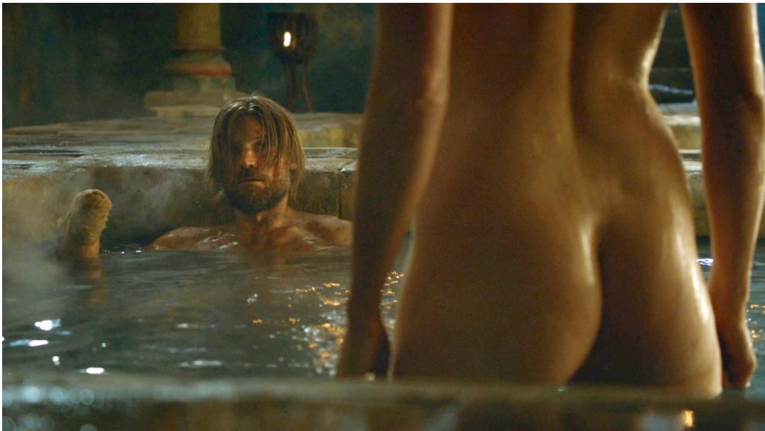
La féminité active de Brienne de Tarth (Gwendoline Christie) comme réponse au mépris de Jaime Lannister (Nikolaj Coster-Waldau). Kissed by Fire (saison 3 épisode 5), 33 min 50 – 40 min 30.

L'absence d'érotisation ou de sublimation du corps nu de Brienne, couplé au manque d'identification à un regard dans la diégèse, témoigne donc de l'absence de male gaze dans cette séquence. L'espace de quelques instants, le corps de Brienne est même utilisé de manière unique dans le discours de Game of Thrones : excédée par les moqueries de Jaime, elle se dresse frontalement devant lui, cachée au regard du spectateur, mettant en avant son corps et sa féminité. Pour un personnage aussi meurtri et introverti, ce geste signifie avant tout son empowerment de survivante tant physiquement que moralement dans un monde impitoyable avec elle. Ce faisant, elle gagne pour la première fois le respect de l'homme qu'elle déteste, et sa confiance. Échappant au male gaze , le statut de femme forte de Brienne sort ainsi grandi de cette mise à nu.