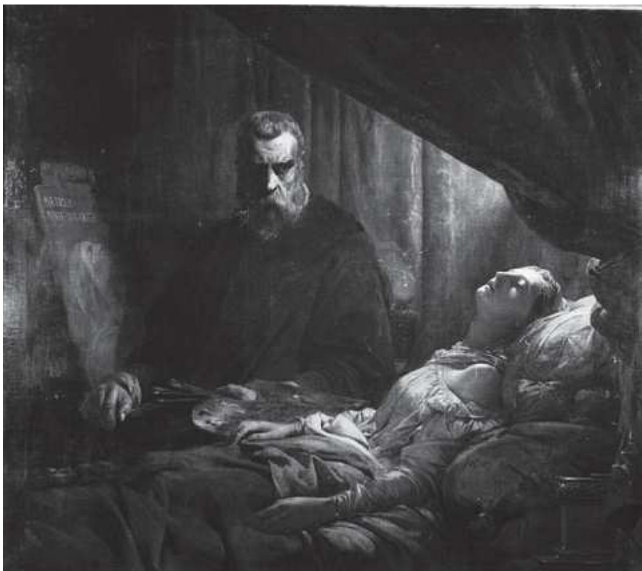
Annexe n°1 : Le Tintoret peignant sa fille morte , Léon Cogniet (1843)