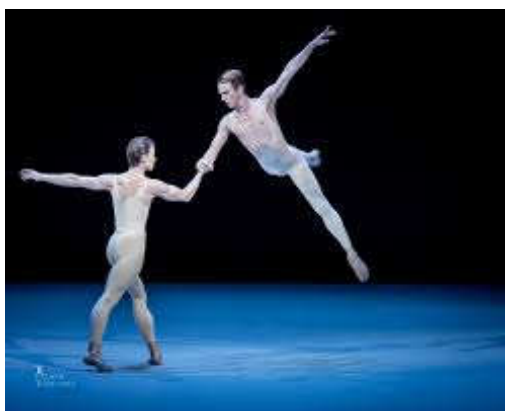
Figure 16 : « Le combat des anges », tableau XII, acte second dans Proust ou Les Intermittences du cœur .

Dans « Le combat des anges », Morel tente de séduire Saint-Loup. Mais avant cette séduction, il y a un réel affrontement. Ils se donnent des coups mais s'attirent aussi. On peut lire des indices de ce combat chorégraphié, par Morel mimant un boxeur bandant ses muscles, Saint-Loup donnant des coups à Morel déjà à terre. Ils s'attirent et se repoussent, Saint-Loup tente de fuir, Morel ne tarde pas à le rattraper. Durant tout leur pas de deux*, ils se regardent plus avec défi qu'avec désir. Le motif de Thanatos est présent dans ce tableau par la violence, la défiance qu'il y a entre ces deux hommes. Comme pour Albertine et Andrée, nous ne connaissons pas de précédent à ce pas de deux* érotique et homosexuel 160 . Ils dansent en miroir, ont des passages au sol, se portent et « s'envoient en l'air » au sens chorégraphique du terme.