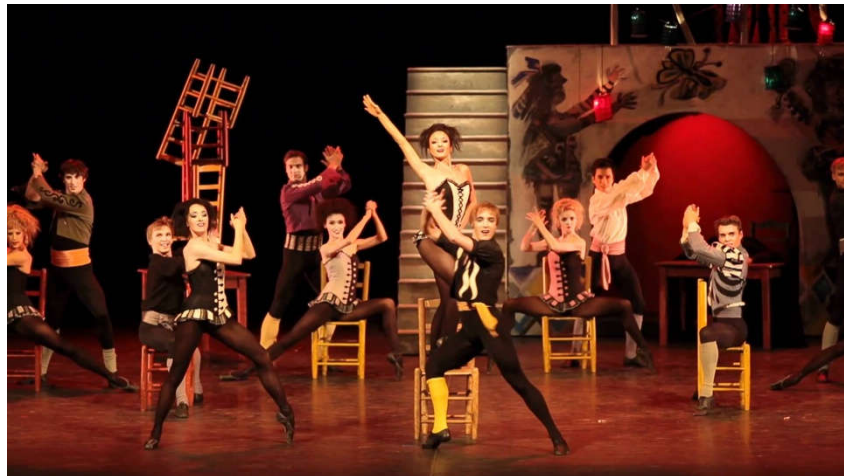
Figure 2 : Danse des chaises dans « Chez Lillas Pastias », second tableau de Carmen .

Dans le deuxième acte, les danseuses apparaissent debout sur des chaises, parfois assises, les jambes écartées. Les hommes leur tournent autour, les portent, les serrent dans leurs bras. Don José apparaît et danse une variation* accompagné du chœur qui forment alors les danseurs chantant le refrain de « l'amour est un oiseau rebelle », traduisant alors l'intériorité de ce personnage dansant qui ne peut s'exprimer. Ce passage est sans doute aussi, un clin d'œil ou une provocation envers le spectateur mélomane. La variation suivante est celle de Carmen, qui danse avec un éventail, elle en joue en se cachant le visage avec et en tapant la main d'une danseuse posée sur l'épaule de Don José, signe de jalousie. Ses pas alternent beaucoup entre l'en-dedans* et l'en-dehors*, nécessitant un rapide « jeu de jambes » 149 . Petit insère des pas non académiques dans la chorégraphie, par exemple la danseuse, en cinquième position* doit faire des ronds avec son bassin, appel évocateur à l'amour sexuel. Elle finit la variation aux pieds de Don José qui l'emporte dans ses bras. À la fin de l'acte, les danseurs entourent le couple qui effectue de petits pas rapides, face à face comme en transe. La suite du ballet sera étudiée ultérieurement.