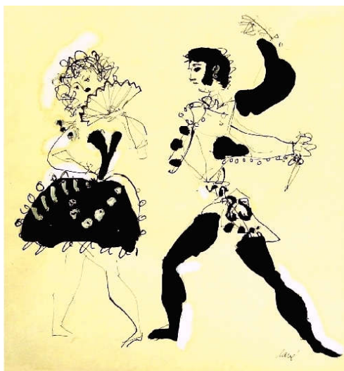
Figure 29: Costumes de Clavé pour Carmen .

Les costumes de Carmen sont également « pop » et colorés. Dans le premier tableau, les danseuses sont habillées de guenilles. Elles portent des collants et pointes noires mais aussi un tutu long noir sur lequel sont ajoutés des morceaux de tissus rapiécés. Leur coiffure n'est pas tirée mais crêpée, lâche. Elles représentent de pauvres et vulgaires cigarières. Le danseur principal est habillé de noir avec chaussettes montantes blanches et ceinture de tissus. Ce costume tente de se rapprocher de l'image que l'on se fait alors d'un espagnol. Carmen porte des collants et pointes roses, ce qui permet de la différencier, avec un tutu noir rayé de rubans verticaux, un bustier noir et un caraco bleu, laissant apparaître ses épaules. N'oublions pas sa fameuse coupe courte et noire. Don José porte un costume plus théâtral, un habit de soldat avec une cape noire. Ces premiers costumes ont, entre autre, un but didactique, le public comprend dans quel lieu ou milieu social évoluent les personnages, mais aussi qui est la danseuse principale, ou encore que le héros est un soldat.