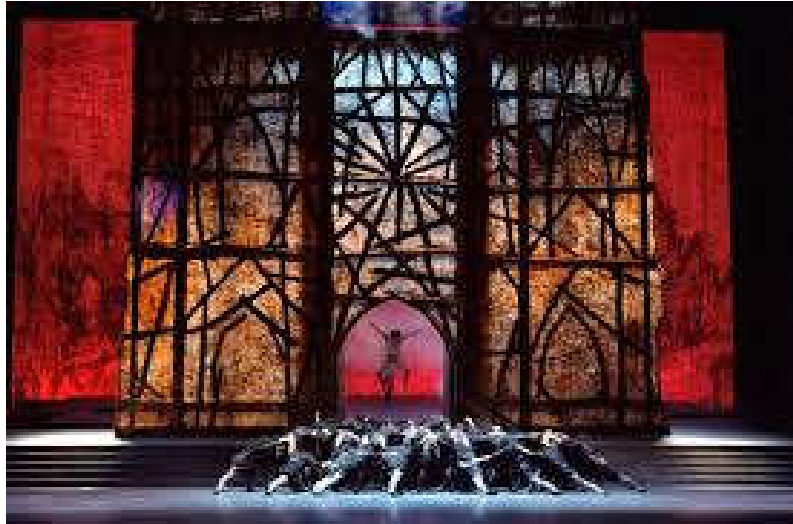
Figure 18: Décor de la cathédrale dans Notre-Dame de Paris , par René Allio.

Le tableau de la cour des miracles fait disparaître la cathédrale et laisse apparaître des trappes pour que la course-poursuite entre Quasimodo et Esméralda puisse être labyrinthique. Quand la bohémienne se réfugie dans la cour des miracles, l'éclairage passe à un rouge incendiaire, suggérant une atmosphère infernale. La taverne, comme une scène sur la scène, est surélevée. Deux bancs rappellent le texte sur les chaises. L'acte deux fait entrer le public dans la cathédrale. Quasimodo se balance sur deux grandes cloches, il grimpe sur de hautes échelles. Le décor s'élève comme si la scène descendait d'étage. Lors de l'attaque de la cathédrale, les éclairages s'assombrissent, la cathédrale descend puis remonte. Enfin, la potence, tout aussi futuriste, est avancée. Le décor de Notre-Dame rappelle un décor médiéval par la cathédrale, les trappes, la violence du changement d'éclairages, mais le tout est modernisé, stylisé comme dans Carmen .