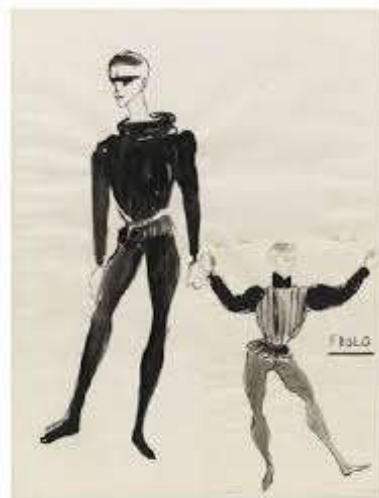
Figure 24: Costumes de Frollo, par Saint-Laurent.

Quasimodo porte un vêtement similaire mais de couleur marron, plus fade pour passer inaperçu. Ses cheveux sont touffus, épais tout comme ses sourcils, ce qui fait ressortir son animalité. Frollo est tout de noir vêtu, il porte une croix sur son haut mais aussi sur son visage, ce qui lui noircit les yeux. Même son physique est austère.