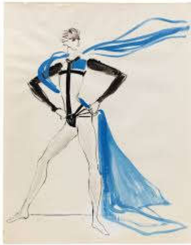
Figure 27 : Costume de Phoebus, par Saint-Laurent.

Les prostituées portent d'énormes prothèses mammaires et de longues perruques, ce qui leur donne un côté ridicule.