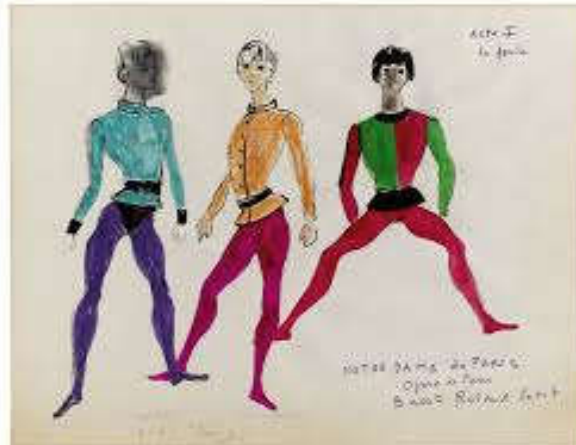
Figure 23: Costumes du peuple, par Saint-Laurent pour Notre-Dame de Paris .

Quasimodo porte un vêtement similaire mais de couleur marron, plus fade pour passer inaperçu. Ses cheveux sont touffus, épais tout comme ses sourcils, ce qui fait ressortir son animalité. Frollo est tout de noir vêtu, il porte une croix sur son haut mais aussi sur son visage, ce qui lui noircit les yeux. Même son physique est austère.