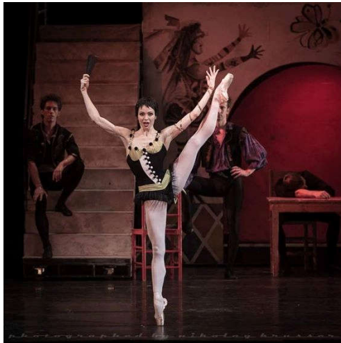
Figure 30: Costume de Carmen dans le second tableau par Antoni Clavé.

Dans le tableau de la chambre, Don José a juste retiré son gilet mais Carmen a maintenant un corset tout noir, dont le laçage devant laisse apparaître la naissance de la poitrine. Enfin, le dernier tableau est haut en couleurs, tout le monde a mis son vêtement de fête. Le costume du torero est blanc et noir, c'est un costume très théâtral, allant avec son rôle.