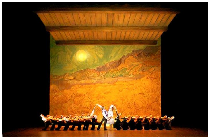
Figure 19: Décor de L'Arlésienne par René Allio.

Provence, puis la fenêtre ouverte, apporte un surplus dramatique et laisse un indice au public de la fin inéluctable de l'action.