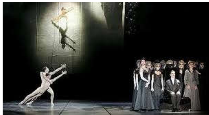
Figure 8 : « Cette idée de la mort », tableau XIII, acte second de Proust ou Les Intermittences du cœur .

Guermantes, dont « l'idée que cette femme est une image de sa mort » 154 . Des danseurs mi-convives, mi-morts vivants apparaissent. Ils se meuvent avec des mouvements saccadés. On prend en photo cette assistance. La duchesse est la maîtresse de cérémonie de ce « bal noir » 155 . Les morts vivants s'approchent du narrateur, ils s'évanouissent et se redressent à différentes reprises. Réapparaissent les couples Odette/Swann et Proust/Albertine, qui se séparent. Puis Charlus s'écroule sur scène. Saint-Loup et Morel se rejoignent puis se séparent.