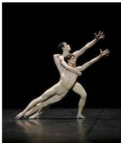
Figure 34 : Costumes du « Combat des anges ».

Dans « faire catleya », Odette porte une robe noire avec des catleyas rouges qui ressortent sur son décolleté. Les jeunes filles en fleurs sont vêtues de légères robes en mousseline blanche, Albertine n'a pas de manche, pour être reconnue parmi elles. Dans « la regarder dormir », le narrateur porte le même costume que le Swann du deuxième tableau, un pantalon rayé. La robe blanche d'Albertine rappelle celle de la jeune Odette. Le costume similaire des deux couples, rappelle le lien entre eux : les débuts de l'amour ont les mêmes apparences. Dans le deuxième acte, Charlus est en smoking. Morel est tout en noir, comme l'ange noir qu'il est. Dans le tableau suivant, les prostituées, sont en tenue légère. On voit leurs jarretières, elles ont un bustier noir, une jupe fendue blanche. Morel apparaît en peignoir. Leur costume laisse transparaître leur luxure. Dans « les enfers de Monsieur de Charlus », le baron est toujours en smoking mais les employés de la maison sont, eux, en tenue plus décontractée, notamment un qui est torse nu. Le contraste entre les personnages se fait aussi par les costumes qu'ils portent. Dans « le combat des anges », Morel et Saint-Loup portent tout deux un académique couleur chair, qui laisse peu de liberté au public de ne pas les imaginer dansant nu.