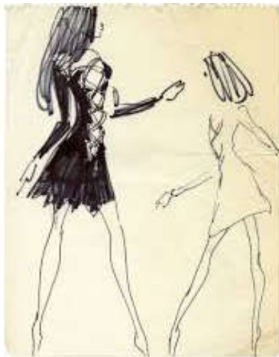
Figure 28 : Costumes des prostituées, par Saint-Laurent.

Les prostituées portent d'énormes prothèses mammaires et de longues perruques, ce qui leur donne un côté ridicule.