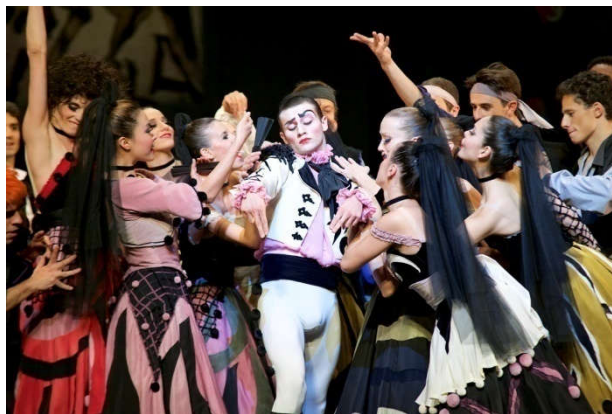
Figure 31: Costume du torero Escamillo.

Dans le tableau de la chambre, Don José a juste retiré son gilet mais Carmen a maintenant un corset tout noir, dont le laçage devant laisse apparaître la naissance de la poitrine. Enfin, le dernier tableau est haut en couleurs, tout le monde a mis son vêtement de fête. Le costume du torero est blanc et noir, c'est un costume très théâtral, allant avec son rôle.