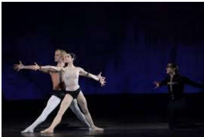
Figure 12 : Pas de trois dans Notre-Dame de Paris , premier acte, scène VII, « La taverne ».

nous l'avions déjà remarqué dans Carmen et Proust , la frontière entre Éros et Thanatos est perméable.