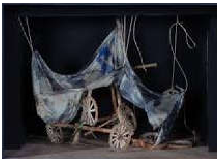
Figure 17: Décor du quatrième tableau de Carmen , « La Grange », par Antoni Clavé.

En effet, dans Carmen , la chaise est un élément de la chorégraphie mais on la voit aussi dans Les Forains , Le Jeune Homme et la Mort , ou encore dans Notre-Dame , Proust ou La Dame de Pique . La scène de la chambre est colorée par un grand rideau orange, et une porte fuchsia. Les volets de la fenêtre sont à moitié tirés, une chaise est posée contre le mur. Il y a un lit côté cour et des instruments côté jardin. Dans le quatrième tableau, on voit une sorte de roulotte avec une bâche est suspendue, des dizaines de roues, et des clôtures côté cour et en fond de scène. L'alternance des figures rondes et des traits verticaux de la clôture font de la scène un tableau cubiste.