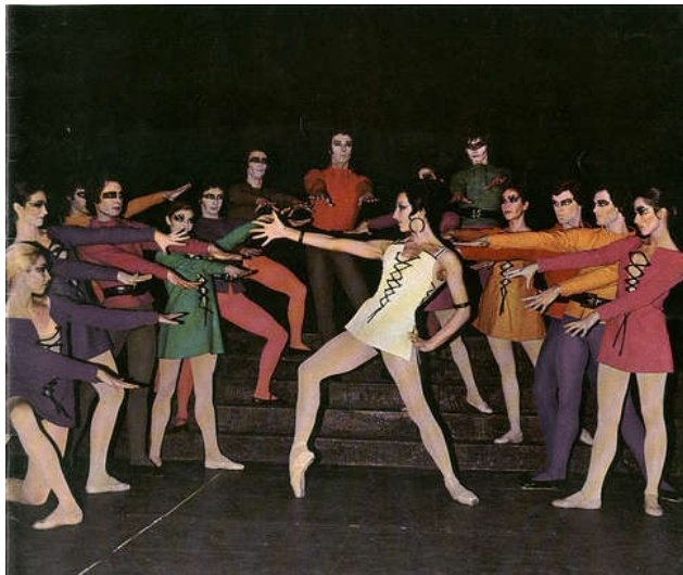
Figure 3 : Esméralda apparaissant dans la foule, tableau III de Notre-Dame de Paris .

Dans Notre-Dame de Paris , comme dans Carmen , les passages chorégraphiés à connotations érotiques se trouvent dans la première variation* d'Esméralda et dans la scène de la taverne. Le personnage de Frollo sera étudié dans le paragraphe sur le double motif d'Éros et Thanatos car en lui seul se battent ces pulsions de vie et de mort. Nous avons vu que le personnage d'Esméralda est sensuel mais que ce n'est pas une séductrice, contrairement à Carmen. Elle apparaît au milieu de la foule, tambourin à la main mais s'en sépare vite. Elle a, comme dans Carmen , les mains sur les hanches, ce qui met en valeur son dos cambré et sa poitrine en avant. Elle joue également avec ses épaules et une alternance d'en-dedans* et d'en-dehors*. Ses bras alternent entre des lignes tirées, des angles droits et des ondulations plus sensuelles. Quand elle se met à genoux, Quasimodo est attiré comme un animal rampant vers elle, Frollo le retient. La foule suit et répète certains de ses mouvements, elle les magnétise.