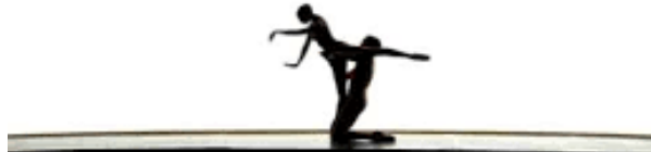
Figure 21: Décor de "Rencontre fortuite dans l'inconnu", dans Proust ou Les Intermittences du cœur .

La chambre d'hôtel dans « les enfers de Monsieur de Charlus » rompt avec les couleurs chaudes du tableau précédent. Le décor est lugubre. Ce n'est plus un lustre mais une ampoule nue qui est suspendue, il y a une simple table et des chaises disposées côté jardin. Le tableau suivant, « Rencontre fortuite dans l'avenir », est totalement blanc pour que les ombres des danseurs puissent évoluer.