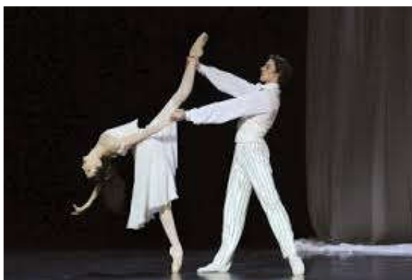
Figure 15 : Pas de deux de « La Prisonnière », tableau VII, acte premier dans Proust ou Les Intermittences du cœur .

Dans « Monsieur de Charlus vaincu par l'impossible », des prostituées comme on a pu en voir dans Carmen ou Notre-Dame de Paris , jouent de leurs charmes. Elles