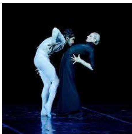
Figure 6 : Pas de deux entre Hermann et la Dame de Pique, tableau III, « Le bal ».

Plus tard, quand il se retrouve seul avec la comtesse pour lui demander son secret, Hermann commence par la supplication puis devient violent. Entre ces deux états, on le voit prendre la main de la comtesse et la baiser longuement. Pourtant, on ne voit pas transparaître d'érotisme dans ce mouvement car il s'agit plus d'une marque de respect que de désir. Ce ballet n'a pas une forte teinte érotique, le cadre s'y prête moins et la chorégraphie est plus « sage ». La chorégraphie est moins explicite que dans Carmen , Notre-Dame , ou Proust mais l'érotisme est tout de même présent.