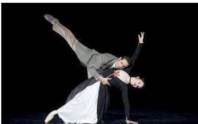
Figure 5 : « Les métaphores de la passion », tableau IV, acte premier de Proust ou Les Intermittences du cœur .

Dans « Les métaphores de la passion », l'érotisme apparaît plus distinctement. Les danseurs s'enlacent de plus en plus, et ce n'est pas par la nécessité des portés mais par désir. Ils s'étreignent, s'embrassent rapidement, comme des baisers volés. À la différence des ballets précédents, ce sont ici, des personnages de l'aristocratie et ils jouent une sorte de jeu avant de vraiment se laisser aller à leurs pulsions. Après lecture et étude du livret, nous sommes déçus que la chorégraphie n'utilise pas plus les catleyas, qui sont les objets métaphorisants. Swann baise le bras et la poitrine d'Odette mais sans l'excuse des fleurs à arranger. Odette part dans les bras de d'autres hommes puis revient vers Swann dont elle attise la jalousie. Elle tente de se faire pardonner mais Swann la fait languir avant de lui accorder de nouveau sa confiance. C'est un jeu auquel se livre traditionnellement les nouveaux amants, et qui participe à la montée du désir érotique entre eux deux.