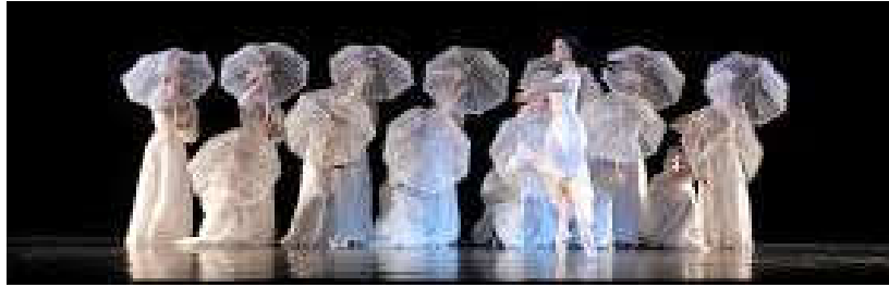
Figure 33 : Costumes des « Aubépines », par Christine Laurent dans Proust ou Les Intermittences du cœur .

Dans « faire catleya », Odette porte une robe noire avec des catleyas rouges qui ressortent sur son décolleté. Les jeunes filles en fleurs sont vêtues de légères robes en mousseline blanche, Albertine n'a pas de manche, pour être reconnue parmi elles. Dans « la regarder dormir », le narrateur porte le même costume que le Swann du deuxième tableau, un pantalon rayé. La robe blanche d'Albertine rappelle celle de la jeune Odette. Le costume similaire des deux couples, rappelle le lien entre eux : les débuts de l'amour ont les mêmes apparences. Dans le deuxième acte, Charlus est en smoking. Morel est tout en noir, comme l'ange noir qu'il est. Dans le tableau suivant, les prostituées, sont en tenue légère. On voit leurs jarretières, elles ont un bustier noir, une jupe fendue blanche. Morel apparaît en peignoir. Leur costume laisse transparaître leur luxure. Dans « les enfers de Monsieur de Charlus », le baron est toujours en smoking mais les employés de la maison sont, eux, en tenue plus décontractée, notamment un qui est torse nu. Le contraste entre les personnages se fait aussi par les costumes qu'ils portent. Dans « le combat des anges », Morel et Saint-Loup portent tout deux un académique couleur chair, qui laisse peu de liberté au public de ne pas les imaginer dansant nu.