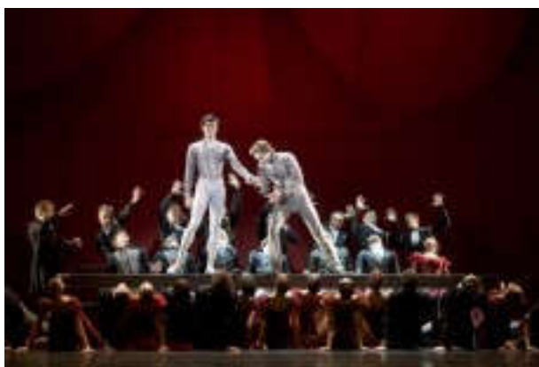
Figure 9 : Final de La Dame de Pique , scène VI « La dernière carte ».

Le dernier tableau, des hommes installant une partie de jeu, ressemble plus à une cérémonie funéraire. En effet, ce début de musique et de chorégraphie est très lent, les danseurs évoluent comme s'ils étaient des automates. Un personnage avec une tête blanche cadavérique s'avance et sourit ironiquement au public. Les invités arrivent dont le confiant Hermann. Quand ce dernier s'aperçoit qu'il a perdu, tout se met à tanguer autour de lui, les danseurs se balancent d'un pied sur l'autre pour donner cette impression, et il tombe à terre. La Dame de Pique arrive pour voir le trépas final d'Hermann. Dans le livret, le héros perdait seulement l'esprit, dans le ballet, il semble succomber à la défaite.