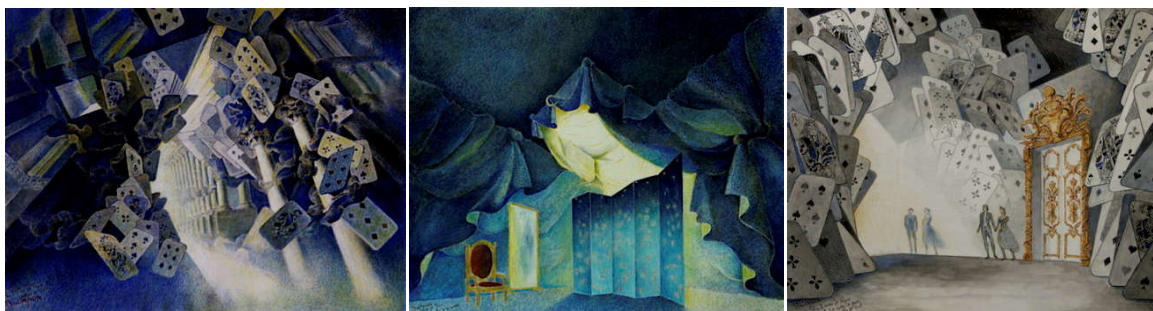
Figure 22: Décors de Beaurepaire pour La Dame de Pique .

Dans le générique de notre captation de La Dame de Pique , nous nous apercevons que le décor n'est plus de Beaurepaire 169 , mais de Jean-Michel Wilmotte, architecte urbaniste et designer français. Dans la version originale de Beaurepaire, le décor alternait entre réalisme et surréalisme. Il y avait une représentation d'une salle de bal avec de gros lustres comme dans Proust mais aussi des toiles de fonds où d'immenses cartes engloutissent la scène.