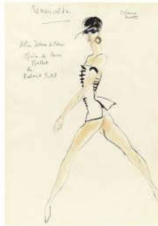
Figure 25 : Costume d'Esméralda, par Saint-Laurent.

Les habitants de la cour des miracles sont vêtus de combinaisons rouges, tels des êtres sortant des entrailles de la Terre. Dedans, on ne peut distinguer les danseurs les uns des autres, ce qui les déshumanise, et correspond à leur chorégraphie.