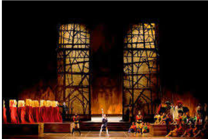
Figure 7 : Le procès d'Esméralda, tableau VIII, acte second.

La cathédrale est envahie, Esméralda est aux mains des assaillants. Quasimodo tente de l'aider. Frollo fait apparaître Phoebus, mort, qu'Esméralda pleure. Le peuple parisien, vêtu de noir, attend l'exécution qu'on leur a promise. Ils se retrouvent amassés, sur le parvis de la cathédrale et forment une haie d'honneur pour Frollo suivi d'Esméralda. La foule est en délire, le gibet est avancé sur scène. En même temps que meurt Esméralda, meurt aussi Frollo, étranglé par Quasimodo. Une fois ce geste accompli, Quasimodo remet lui-même son corps droit, avance vers la bohémienne pendue, la détache de la potence et le prend dans ses bras.