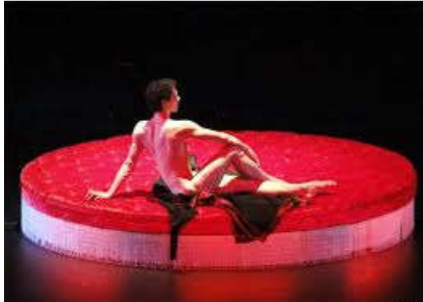
Figure 20: Décor de « Monsieur de Charlus face à l'insaisissable » de René Allio dans Proust ou Les Intermittences du cœur .

La chambre d'hôtel dans « les enfers de Monsieur de Charlus » rompt avec les couleurs chaudes du tableau précédent. Le décor est lugubre. Ce n'est plus un lustre mais une ampoule nue qui est suspendue, il y a une simple table et des chaises disposées côté jardin. Le tableau suivant, « Rencontre fortuite dans l'avenir », est totalement blanc pour que les ombres des danseurs puissent évoluer.