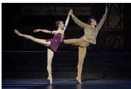
Figure 4 : Pas de deux entre Esméralda et Quasimodo, tableau XI, acte second.

Dans le second acte, le pas de deux* entre Quasimodo et Esméralda n'est pas à proprement parler érotique. Pourtant, on voit le bossu tomber amoureux de la bohémienne, mais cet amour est platonique car il sait qu'elle ne l'aimera jamais. Au début, il veut la toucher mais il se retient. Ils deviennent complices, il y a de l'affection, peut-être de l'amour mais cette forme d'amour change de ce qu'on a l'habitude de voir dans les chorégraphies de Petit, il n'est plus passionnel mais platonique.