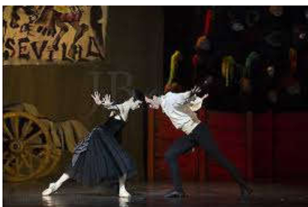
Figure 11 : L'affrontement de Carmen et de Don José dans le dernier tableau, « La Corrida ».

Dans le dernier acte, celui de la corrida, au milieu de la fête, Carmen découvre Don José caché derrière un pendant. Elle se fige, Don José s'approche et lève le voile noir de la mantille de la bohémienne. La corrida entre eux deux commence, après avoir donné son amour à Carmen, il ne peut rien lui offrir d'autre que la mort. Il l'embrasse puis la rejette. Ils s'affrontent tête contre tête comme s'ils avaient des cornes de taureaux.