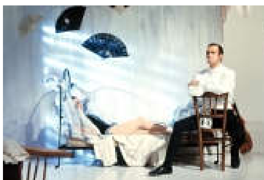
Figure 10: Ouverture du troisième tableau de Carmen , « La chambre ».

Dans le tableau de la chambre de Carmen , le rideau du troisième acte se lève sur Don José fumant une cigarette, on peut aisément le supposer, après l'amour. Il tend sa cigarette à la main de Carmen, encore au lit.