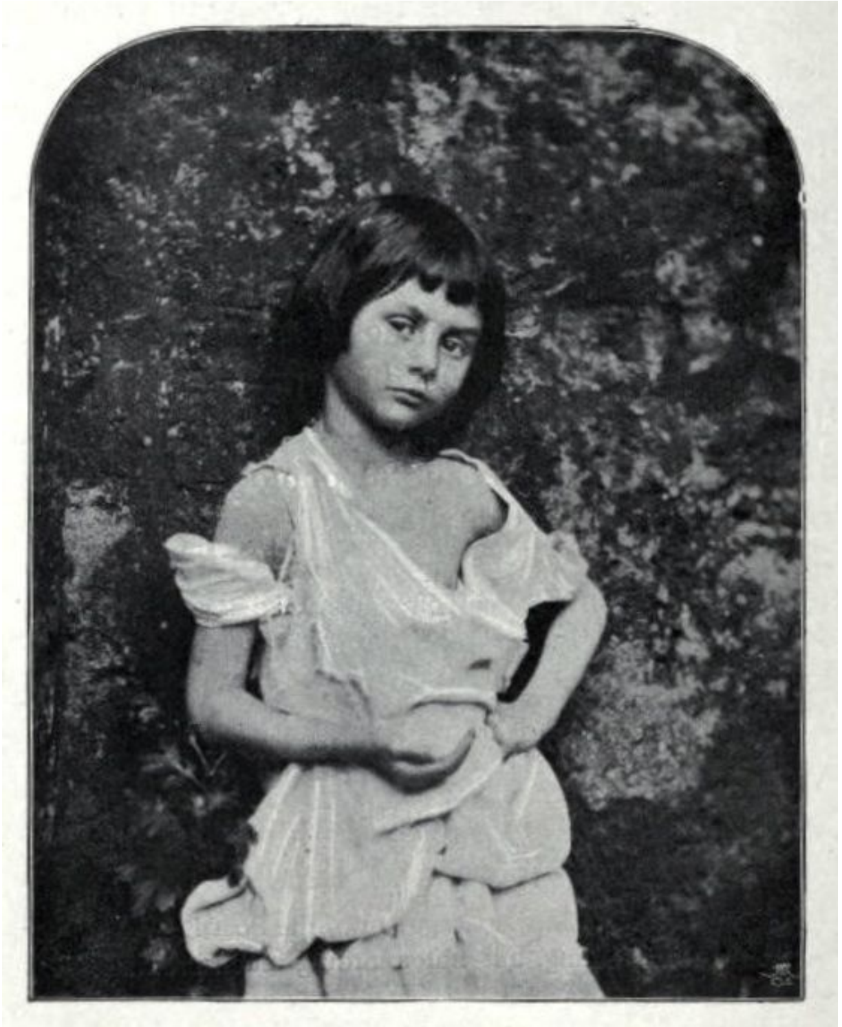
Alice Liddell as Beggar-Child , Lewis Carroll (Charles Lutwidge Dodgson) (1832-98)

http://www.victorianweb.org/photos/carroll/3.html (consulté le 22 mai 2020)