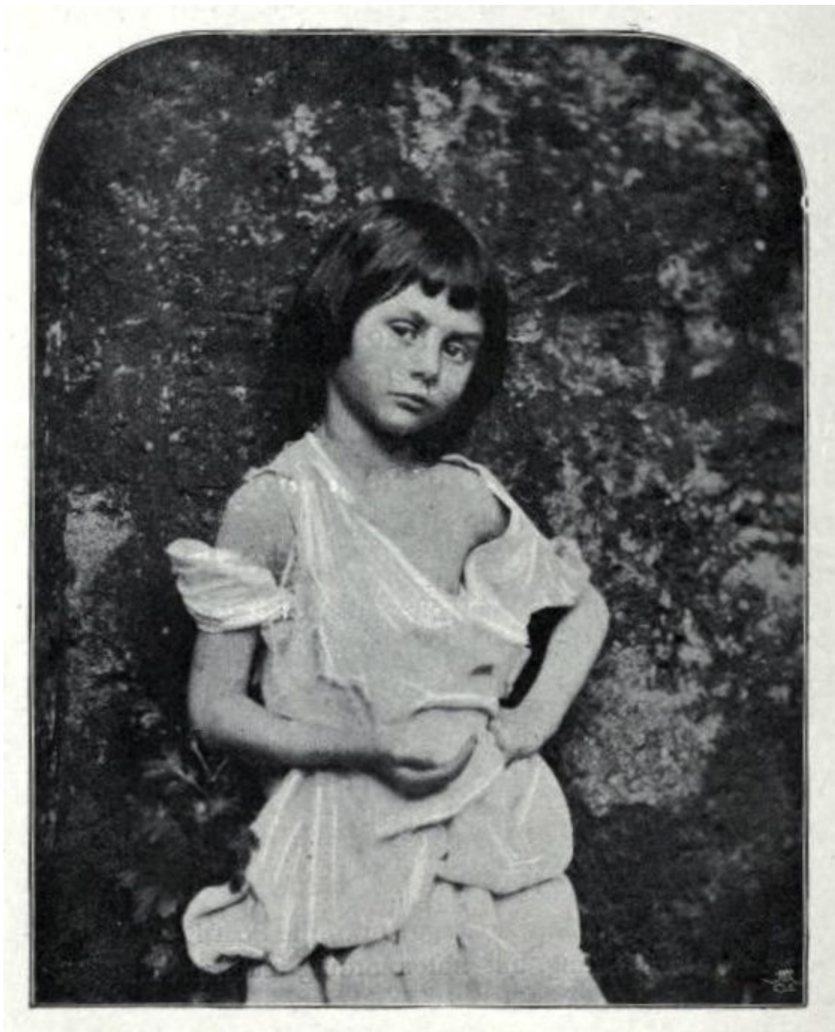
Alice Liddell as Beggar-Child , Lewis Carroll (Charles Lutwidge Dodgson) (1832-98)

http://www.victorianweb.org/photos/carroll/3.html (consulté le 22 mai 2020)