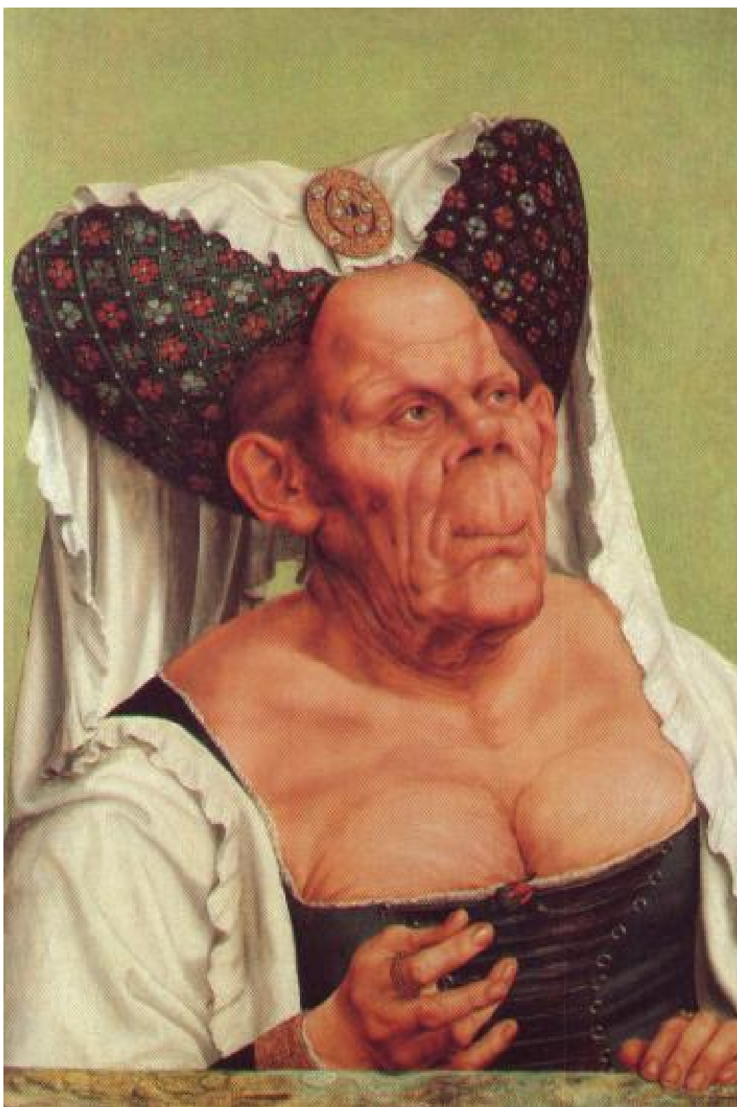
The Ugly Duchess, Quentin Matsys

https://enacademic.com/dic.nsf/enwiki/11693718 , consulté le 22 mai 2020