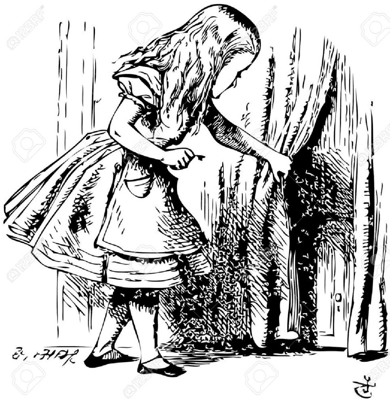
Illustration de Tenniel pour Alice's Adventures in Wonderland, 1865

https://fr.123rf.com/photo_35096867_alice-au-pays-des-merveilles-alice-est-%C3%A0-la-recherche-derri%C3%A8re-un-rideau-pour-r%C3%A9v%C3%A9ler-une-porte-d%C3%A9rob%C3%A9e-alice-.html , consulté le 22 mai 2020