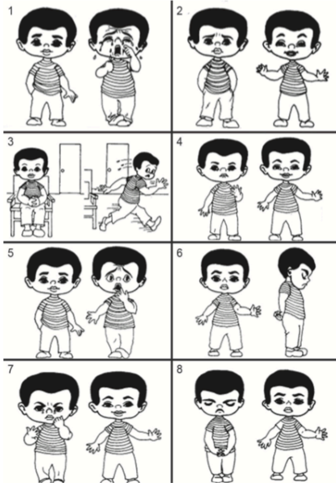
Annexe 3 : Venham's Picture Test [1]