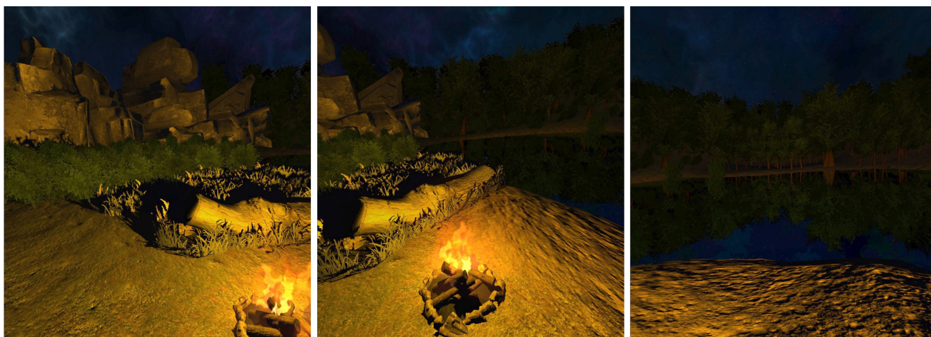
Illustration 3: De gauche à droite - vues de gauche, de face et de droite