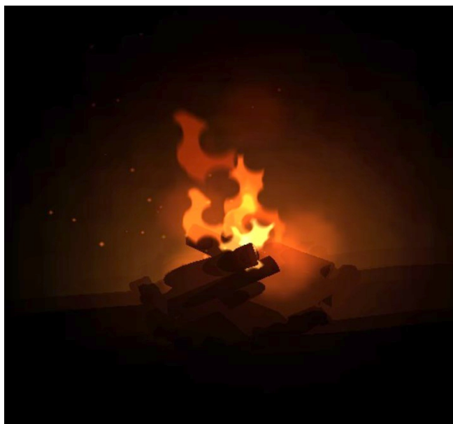
Illustration 2: Feu de camp seul