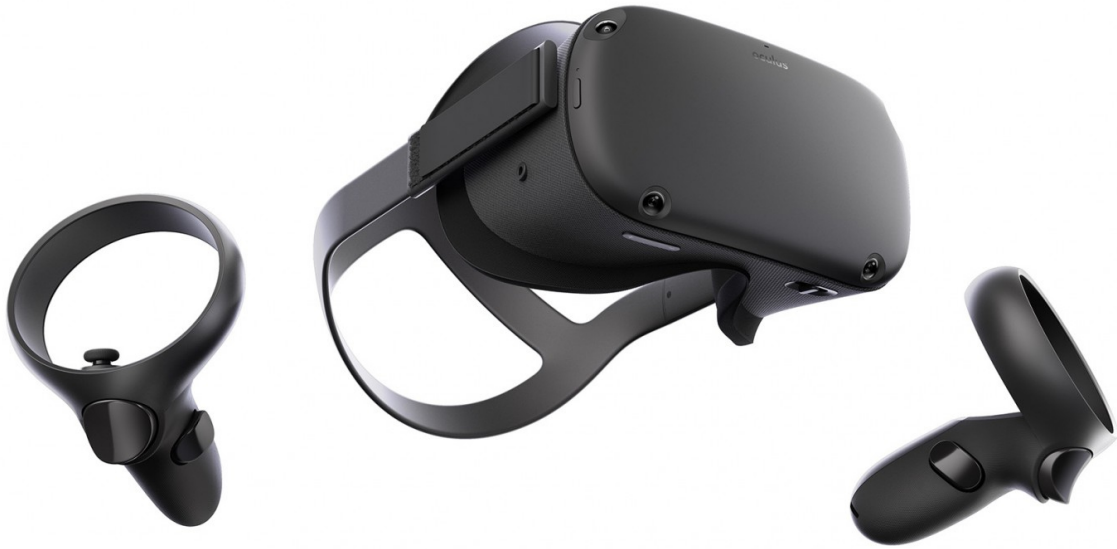
Illustration 1: Oculus Quest