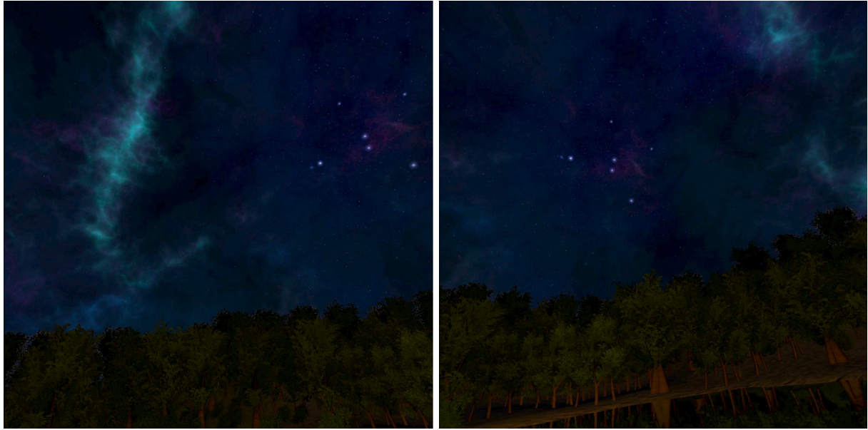
Illustration 4: Ciel étoilé