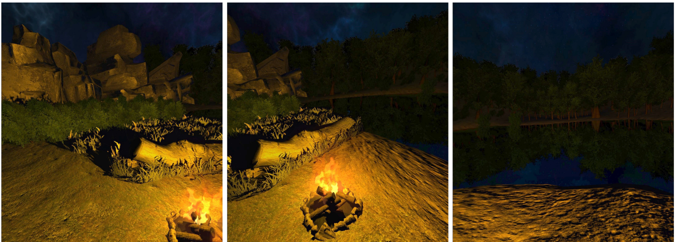
Illustration 3: De gauche à droite - vues de gauche, de face et de droite