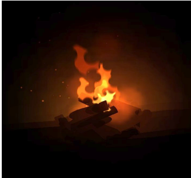
Illustration 2: Feu de camp seul