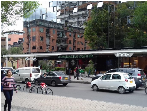
Figure 6 – Le parc un mercredi à 13h