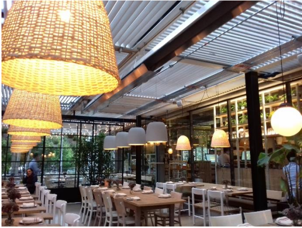
Figure 8 – La salle de restaurant de Minga