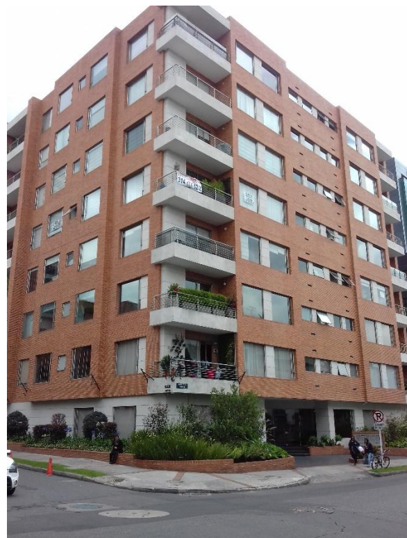
Figure 2 – Résidences dans le quartier aux alentours de Minga