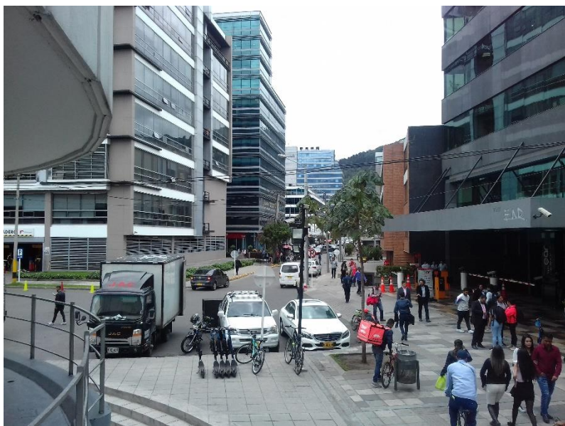
Figure 1 – Immeubles d’entreprises dans le quartier aux alentours de Minga