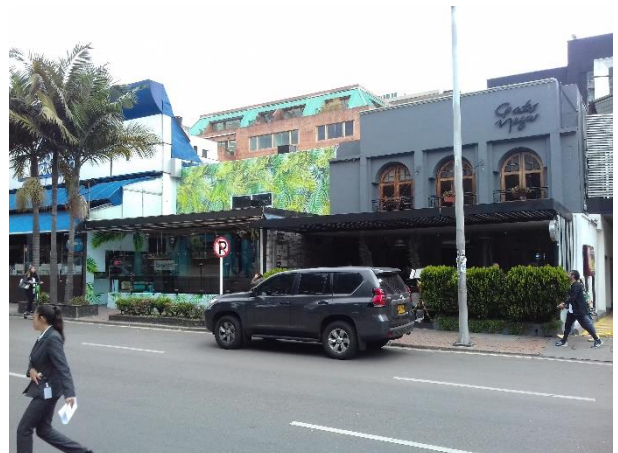
Figure 7 – Le parc un mercredi à 13h