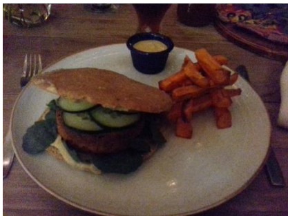
Figure 16 – Un hamburger végétarien avec des frites de patates douces

Le hamburger occupe une position particulière dans la gastronomie mondialisée. Symbole de la mondialisation et de l'influence états-unienne ainsi que du fast-food, il est,