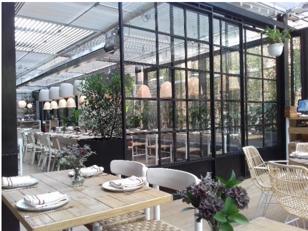
Figure 10 – La terrasse de Minga