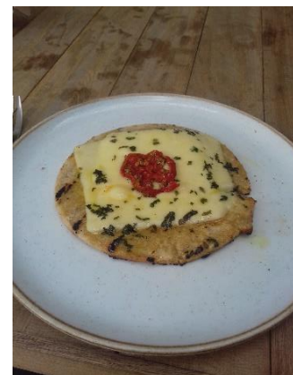
Figure 15 – Un arepa de quinoa avec du fromage et des tomates séchées

techniques et dans les ingrédients. Les carimañolas (figure 14) sont des beignets de farine de yuca (manioc) garnis de viande et frits dans l'huile. La friture étant un adversaire récurrent dans les