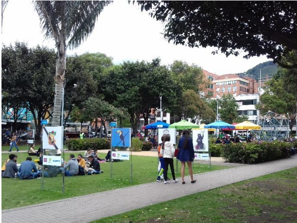
Figure 4 – Le parc un mercredi à 13h