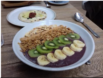
Figure 12 – Un açaï bowl , garni de différents fruits et céréales

différentes formes de distinction liées à l'alimentation. Je propose donc ici une liste de plats significatifs dans la caractérisation de Minga comme un espace de restauration offrant à sa clientèle une alimentation qui lui permet d'affirmer un style de vie basé sur l'esthétisation et sur l'alliance entre santé et plaisir. Commençons par deux classiques du