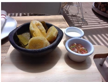
Figure 14 – Des carimañolas au four

Minga donne une place importante à la cuisine colombienne dans son menu. Leur carte comme les discours des client-es font cohabiter les cuisines étrangères et le patrimoine