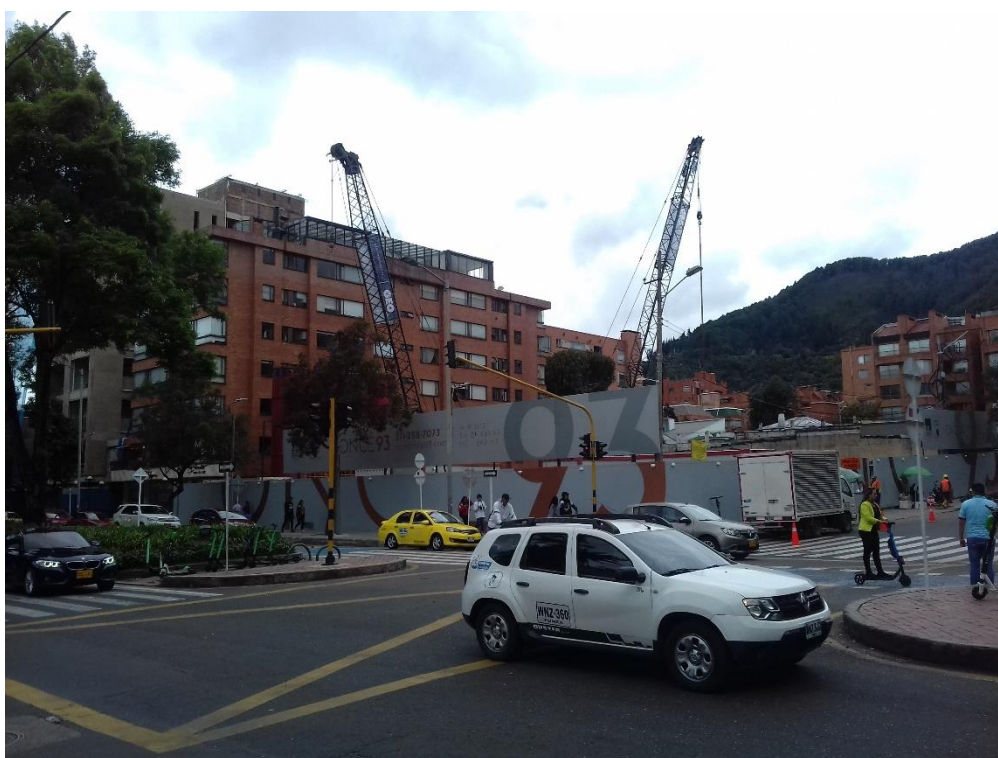
Figure 3 – Chantier en cours dans le quartier aux alentours de Minga