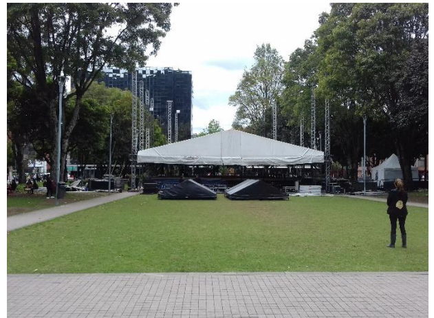
Figure 5 – Le parc un mercredi à 13h