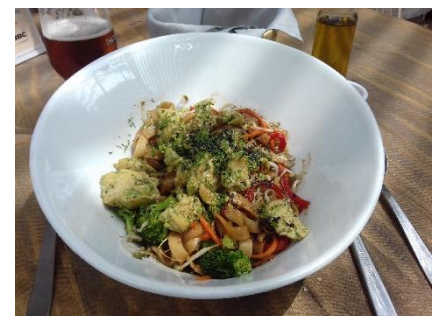
Figure 17 – Un wok de los Andes

Le dernier plat que je mettrais en avant est significatif ne serait-ce que par son nom : le wok de los Andes . Ni adaptation ni importation directe d'un plat étranger, il combine une technique issue de la cuisine asiatique (le wok) et le patrimoine agricole des Andes (quinoa, carottes, brocolis, poivrons). Ce plat réunit parfaitement le goût pour la cuisine étrangère, ici la cuisine asiatique particulièrement à la mode à Bogota, et l'attachement à un territoire et à son patrimoine alimentaire, ici les Andes représentées comme centrales dans l'identité colombienne.