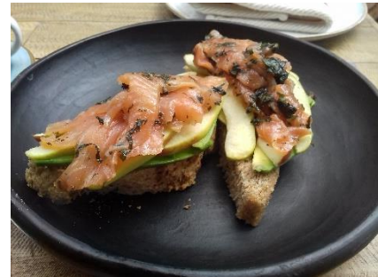
Figure 13 – Un toast avocat, saumon et pommes

brunch californien : l' açaï bowl (figure 12) et le toast avocat saumon (figure 13). Leur seule présence dénote l'influence de la Californie justement comme centre névralgique d'une alimentation alliant innovation gastronomique et attention pour la santé. Les deux plats se construisent autour de plusieurs super-aliments 7 : l'açaï, une baie principalement cultivée au Brésil ; l'avocat, qui a aussi l'avantage d'être central dans la cuisine colombienne ; le saumon, signe également d'une certaine aisance financière et d'un certain raffinement culinaire.