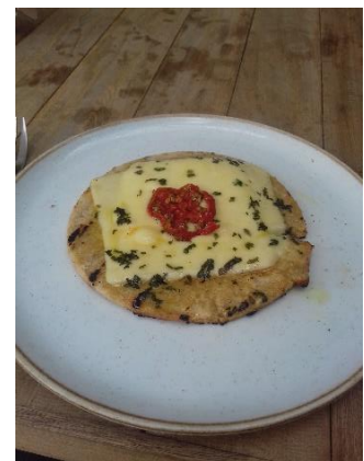
Figure 15 – Un arepa de quinoa avec du fromage et des tomates séchées

techniques et dans les ingrédients. Les carimañolas (figure 14) sont des beignets de farine de yuca (manioc) garnis de viande et frits dans l'huile. La friture étant un adversaire récurrent dans les