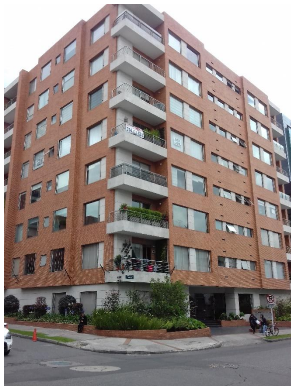
Figure 2 – Résidences dans le quartier aux alentours de Minga