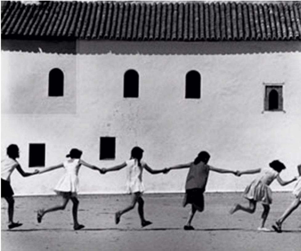
Ramón Masats , La Rábida Huelva ,1965