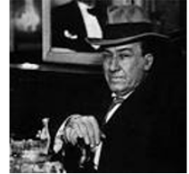
Antonio Machado Sevilla 1875-Collioure 1939

Pegaso ( Pégase , cheval ailé) Un corcel (le coursier) colorado = rojo chispear (étinceler) las candelas ( les chandelles ) la alegría ( la joie) una moneda (une pièce)