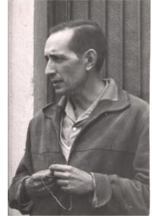
Miguel Delibes , escritor y periodista, España, (1920-2010)

Miguel Delibes, Mi querida bicicleta , 1988