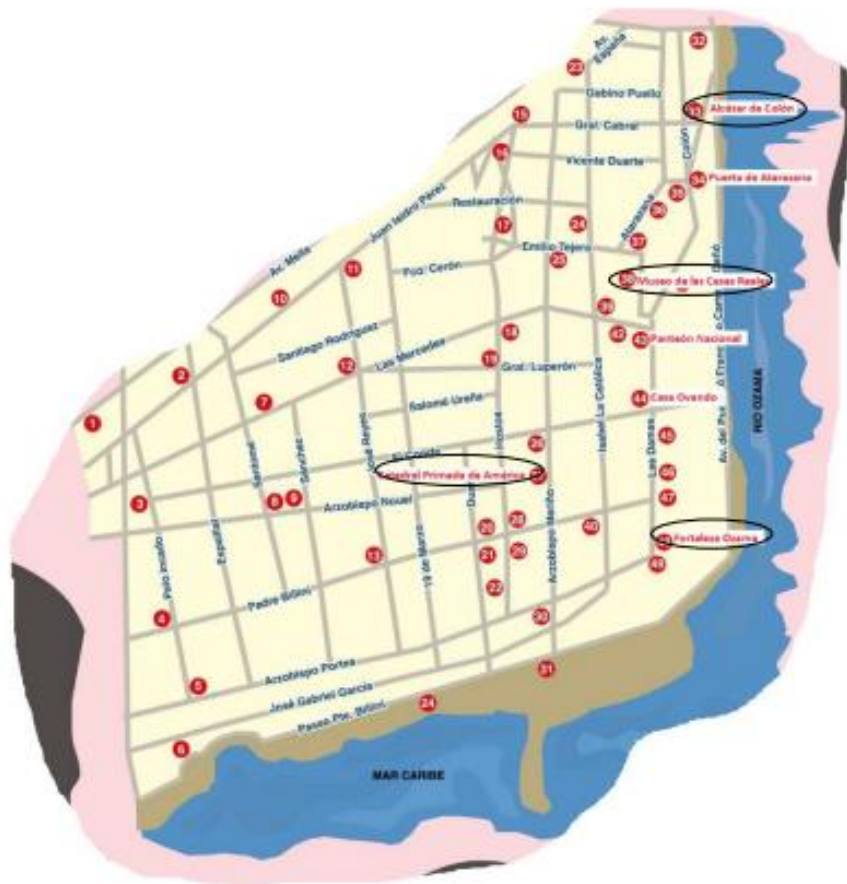
Mapa de la zona colonial de Santo Domingo