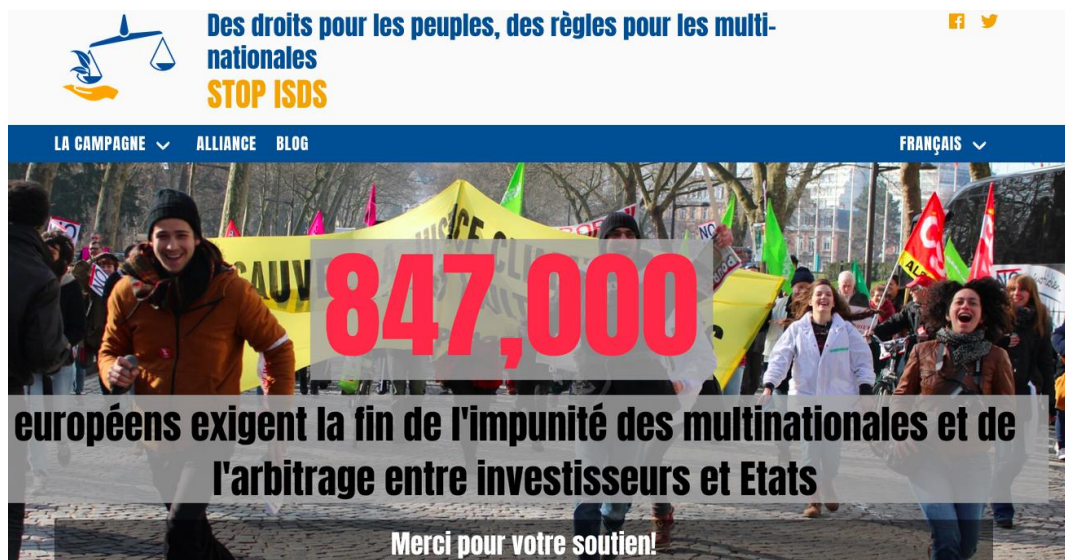
Figure 1. Capture d'écran du site de la campagne européenne « Des droits pour les peuples, des règles pour les multinationales », avril 2020.

autour de la dénonciation de « l'impunité des multinationales ». Dans ce contexte, une pétition a été lancée et plusieurs actions communes de plaidoyer et de mobilisation ont été menées dans toute l'Europe à l'automne 2019.