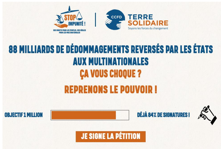
Figure 2. Capture d'écran du site de la campagne « Reprenons le pouvoir », avril 2020.