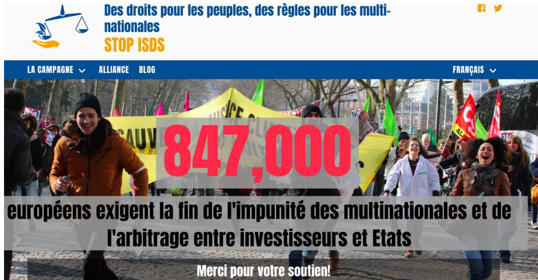
Figure 1. Capture d'écran du site de la campagne européenne « Des droits pour les peuples, des règles pour les multinationales », avril 2020.

autour de la dénonciation de « l'impunité des multinationales ». Dans ce contexte, une pétition a été lancée et plusieurs actions communes de plaidoyer et de mobilisation ont été menées dans toute l'Europe à l'automne 2019.