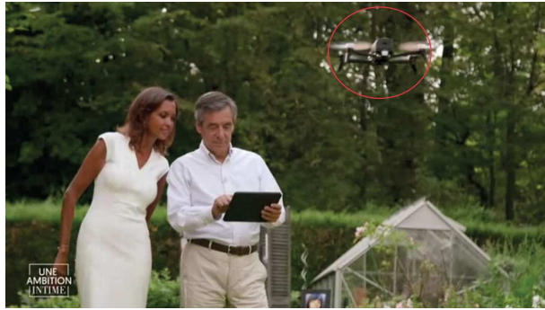
F. Fillon fait fonctionner un drone à l'aide d'une tablette.