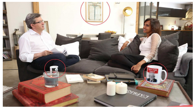
Déclaration des droits de l'Homme et Mugs à l'effigie de Bernie Sanders, le « socialiste » américain.

Nous en concluons que nous entrons donc dans une intimité factice qui vient contrarier l'effet d'authenticité pourtant recherché par l'émission. Mais surtout, l'installation d'éléments de décor choisis par la production avec la complicité des proches renforce, selon nous, la fonction peopolisante de l'émission en ce qu'elle focalise l'attention sur des aspects à faible valeur politique de la personnalité des candidats à l'exclusion d'autres par élimination. C'est avant tout l'homme du quotidien qui nous est raconté par la scénographie, celui qui ressemble à Monsieur tout-le-monde mais qui n'est pas non plus n'importe qui par la force de son caractère, de ses goûts ou de son vécu.