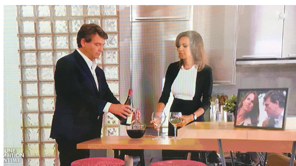
On distingue ici sur la table un cadre photo d'Arnaud Montebourg et sa compagne

L'analyse que nous avons réalisée sur les huit portraits montre que les éléments du décor viennent soutenir le dispositif narratif en soulignant des éléments de la personnalité de l'invité. En rendant le lieu de l'interview conforme à la l'intimité du candidat, Nous relevons qu'il conduit l'attention du spectateur à se resserrer sur l'échange et la figure de la personnalité politique. Pour illustrer notre propos, nous prendrons, en premier lieu, les photos disposées dans le lieu de tournage qui viennent illustrer le récit biographique. Des images de l'enfance aux clichés de vacances en passant par les photos du conjoint ou du candidat en situation (sports, travail, etc.), la production propose un véritable album familial. Ainsi, au cours de l'entretien avec Arnaud Montebourg, nous pouvons apercevoir soit disséminé dans le décor, soit directement à l'écran des photos du candidat lorsqu'il était enfant, des photos de ses parents mais également de ces grands-parents et notamment de son grand-père maternel algérien et, enfin, de sa compagne.