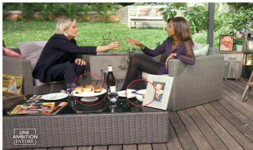
Bol et Far bretons rappellent les origines régionales que M. Le Pen revendique souvent