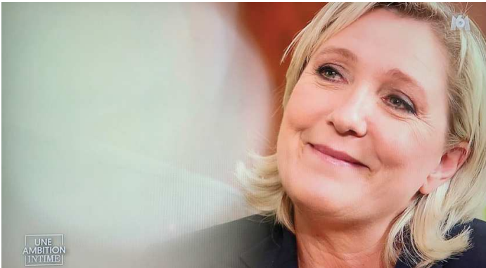
Marine Le Pen revient sur le départ de sa mère du domicile conjugal