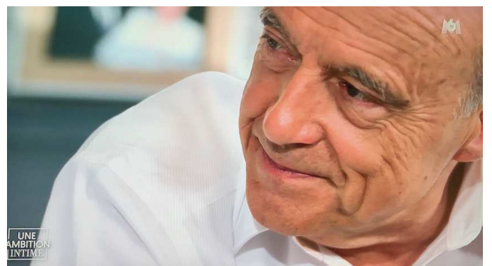
Alain Juppé repense avec tristesse à sa mère disparue