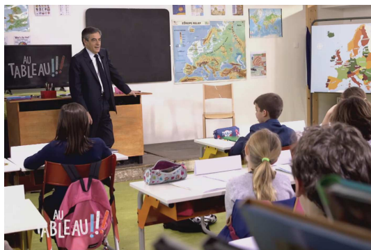
François Fillon au tableau, seul, face aux enfants

Ultime étape dans l'effacement de la figure du journaliste politique, sa disparition complète de l'écran dans l'émission Présidentielle : Candidats au tableau ! Dans ce programme, ce sont les enfants qui posent des questions - bien élaborées - aux candidats et le rôle du journaliste se limite à préparer l'émission, les questions et réaliser le montage final. Il n'apparaît même plus à l'écran.