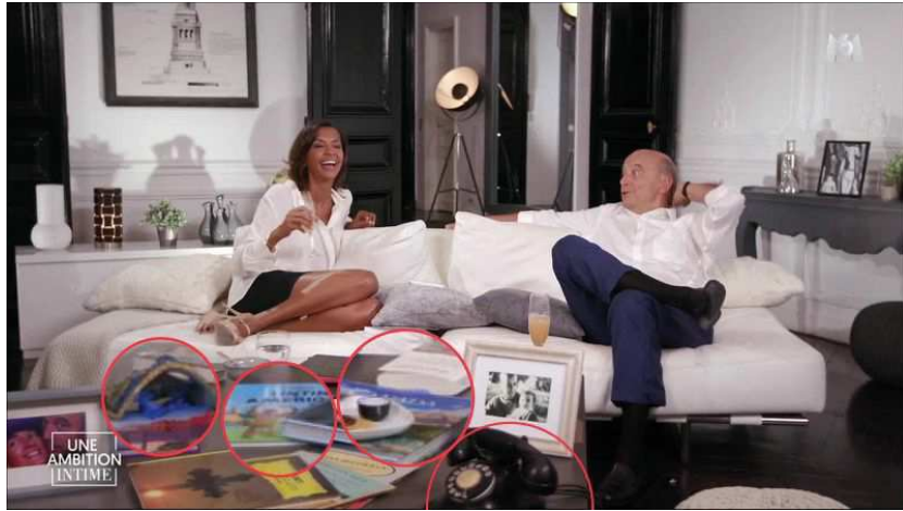
Masque de Venise, Beau livre sur le Canada et bande-dessinée « Tintin en Amérique » évoque le parcours d'A. Juppé. Le téléphone années 80 n'est sans doute pas là par hasard.