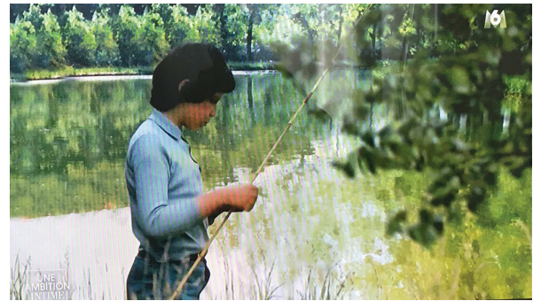
Arnaud Montebourg, enfant, à la pêche dans sa région natale, la Saône-et-Loire.

En second lieu, des objets ont été soigneusement disposés pour apparaître dans le cadre afin d'évoquer les passions voire la personnalité du candidat :