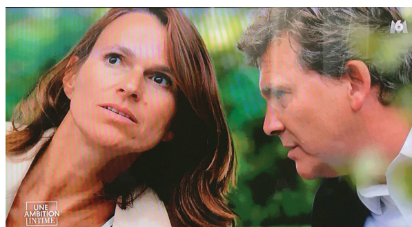
La photo fait, plus tard, l'objet d'un gros plan pour soutenir la narration sur une paternité compliqué