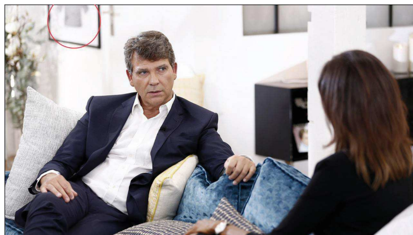
Habilement disposé derrière A. Montebourg, la marinière symbole de son combat pour le Made in France