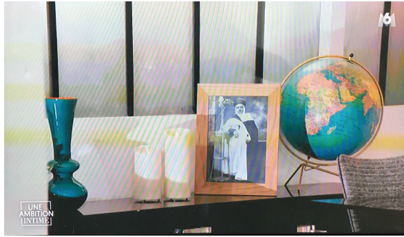
Sur le buffet un cadre photo du grand-père algérien d'Arnaud Montebourg