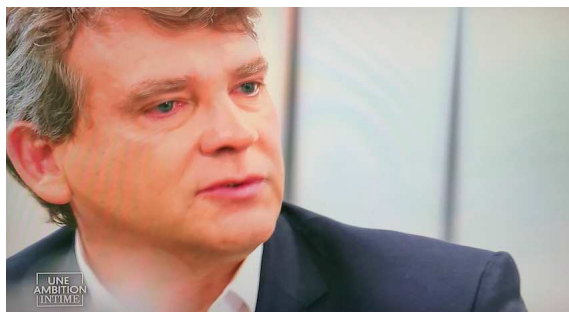
Arnaud Montebourg, les yeux rougis lorsqu'il parle de la naissance prématuré de sa fille.