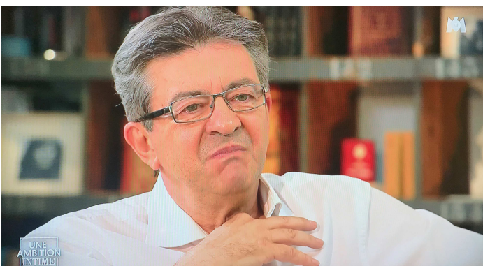
Jean-Luc Mélenchon ému aux larmes en écoutant Maria Callas