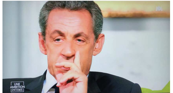
Nicolas Sarkozy devant les larmes de son fils