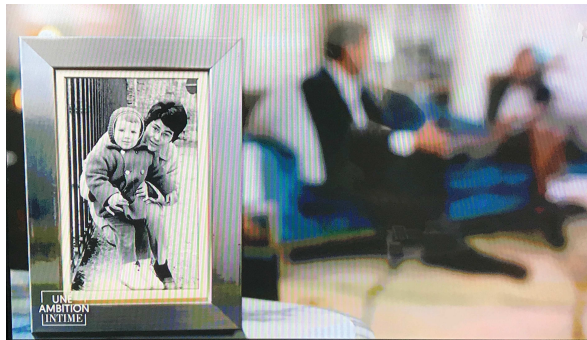
Arnaud Montebourg dans les bras de sa mère, l'une des photos de l'album familial