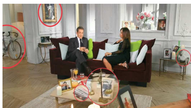
Eléments de décors qui évoquent la personnalité de N. Sarkozy : Vélo de course, balance de justice, représentations de l'empereur Napoléon 1 er , journal L'Equipe.