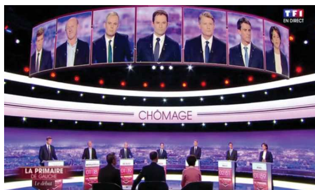
Débat de la Primaire de la Gauche

L'Emission politique sur France 2 tente aussi de rendre son format plus attractif en proposant une séquence plus spectaculaire intitulée « sans filet » où le politique est amené sur un terrain inconnu et confrontés aux citoyens sans avoir été préparé à l'avance.