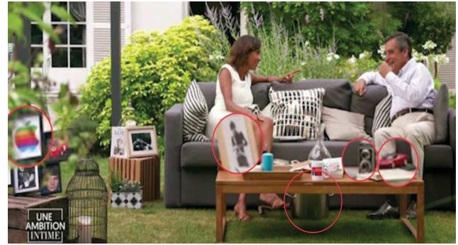
Les passions de F. Fillon sont soulignées par des objets qui évoquent les technologies, l'alpinisme, la photographie et la course automobile.