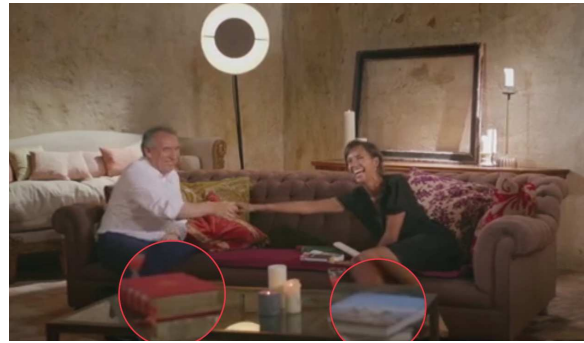
A l'intérieur, seuls les œuvres reliées de Rabelais et un beau livre sur les Pyrénées soulignent ses goûts pour la littérature et son attachement à sa région.