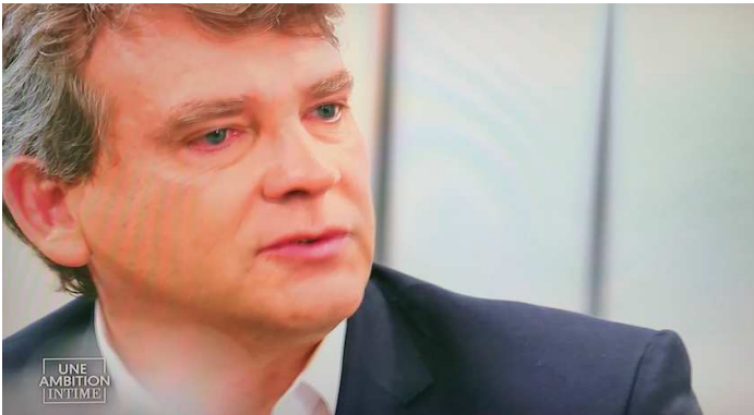
Arnaud Montebourg évoque la naissance prématurée de sa fille