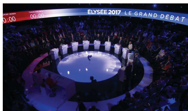
Le grand débat de la Présidentielle