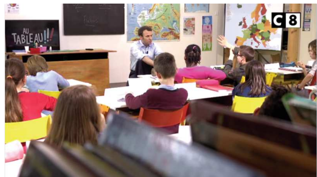
Les journalistes ont disparu du champ de vision des téléspectateurs

Des décors qui évoquent des jeux télévisés, des mises en scène qui favorisent le sensationnel et des journalistes qui animent un débat plus souvent qu'il ne le crée, nous constatons que le renouvellement des formats des émissions d'information politique fait tendre la représentation politique à la télévision vers le divertissement. Dans ce choc, Une ambition intime incarne un succès du divertissement sur l'information qui, selon nous, est fortement lié à l'image de du média et de sa présentatrice vedette.