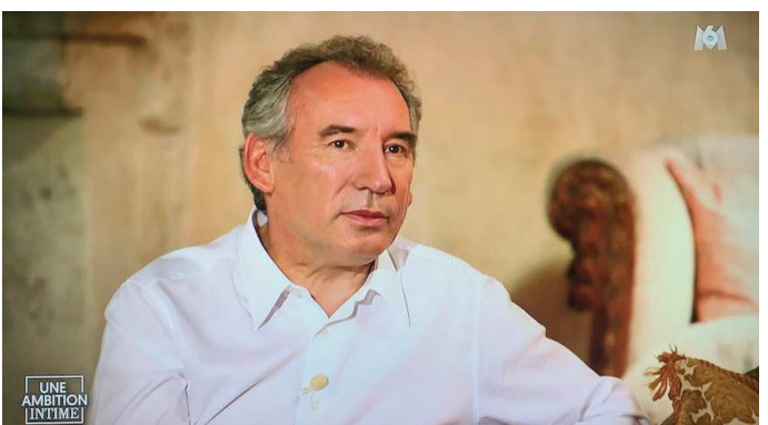
François Bayrou révèle l'anorexie de sa fille