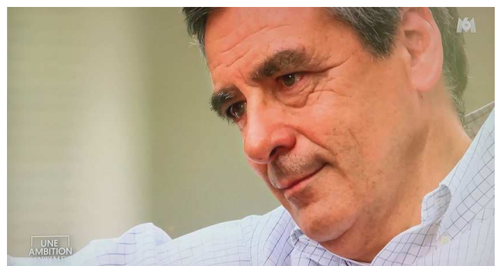
François Fillon bouleversé à l'évocation de la mort de son ami Philippe Séguin