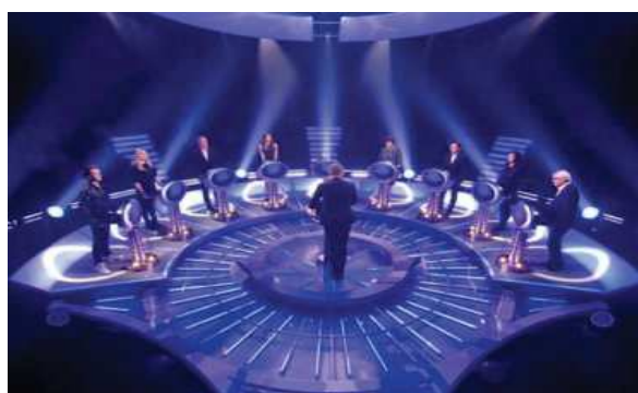
Le maillon faible

Pour les débats des primaires, le format des programmes n'est pas sans rappeler des émissions de divertissement telles que Le maillon faible ou La France à un incroyable talent :