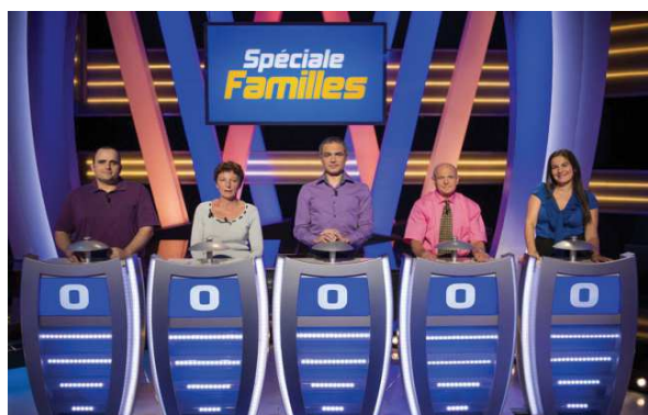
Question pour un champion

A cet égard, la diffusion des débats pour l'élection présidentielle de 2017 est caractéristique de ce que nous voulons démontrer. Que ce soit pour les primaires de la droite et du centre ou de la gauche, la mise en scène évoque les programmes phares du divertissement tels que Question pour un champion ou Koh-Lanta . Didier Froehly, réalisateur du premier débat de la primaire de la gauche confirme : « On a des candidats qui sont presque alignés comme sur un plateau de jeu (...) Cette année dans L'Emission politique de France 2, on a essayé d'amener des codes de la variété dans la politique. Dans la lumière, dans les teintes, on a amené des choses du divertissement pour illustrer un propos sérieux et fort ». 48