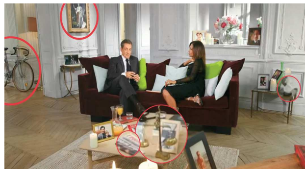
Eléments de décors qui évoquent la personnalité de N. Sarkozy : Vélo de course, balance de justice, représentations de l'empereur Napoléon 1 er , journal L'Equipe.