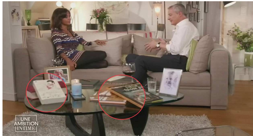
Le roman Lolita et les bandes-dessinées « Quai d'Orsay » et « Tintin et la toison d'or » figurent au premier plan, face au téléspectateur.