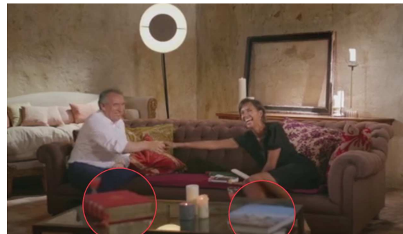
A l'intérieur, seuls les œuvres reliées de Rabelais et un beau livre sur les Pyrénées soulignent ses goûts pour la littérature et son attachement à sa région.