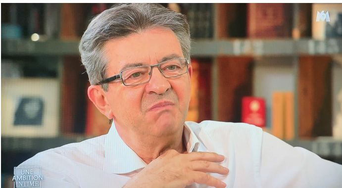
Jean-Luc Mélenchon ému aux larmes en écoutant Maria Callas