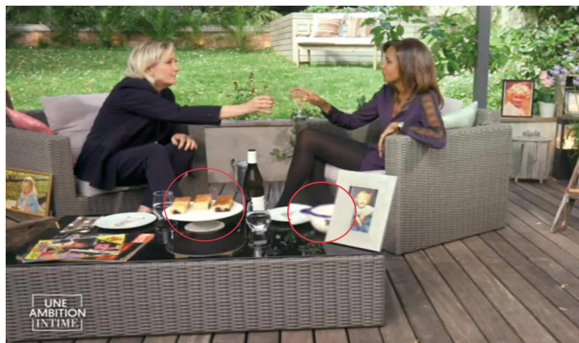
Bol et Far bretons rappellent les origines régionales que M. Le Pen revendique souvent