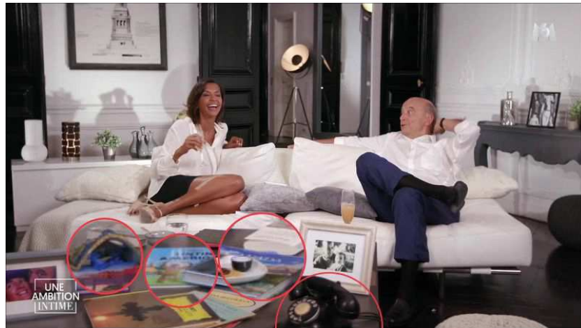
Masque de Venise, Beau livre sur le Canada et bande-dessinée « Tintin en Amérique » évoque le parcours d'A. Juppé. Le téléphone années 80 n'est sans doute pas là par hasard.