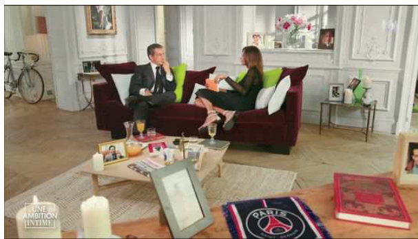
Au premier plan, l'écharpe aux couleurs du PSG ; Les cadres photos de N. Sarkozy sont disposés partout dans la pièce.