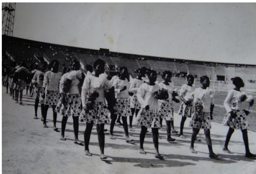
Défilé des jeunes filles aux premiers jeux africains de juillet