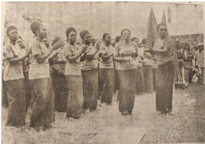
« L'U.R.F.C. soutient sans failles l'action émancipatrice du Parti Congolais du Travail. Sur cette photo les militantes au meeting du 23 février 284 . »

Il est difficile d'admettre que le changement de présidence de l'U.R.F.C. est une conséquence directe de la tentative de coup d'état de février 1972. Le besoin de renforcement du pouvoir autour de Marien Nguabi est pourtant incontestable. La participation nouvelle de Céline Nguabi aux activités du Congrès de mars 1973 accentue cette idée.