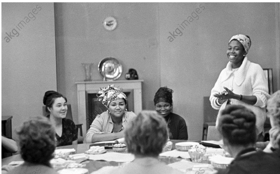
Une délégation de l'U.R.F.C. rencontre le Comité des femmes soviétiques 1 Octobre 1965