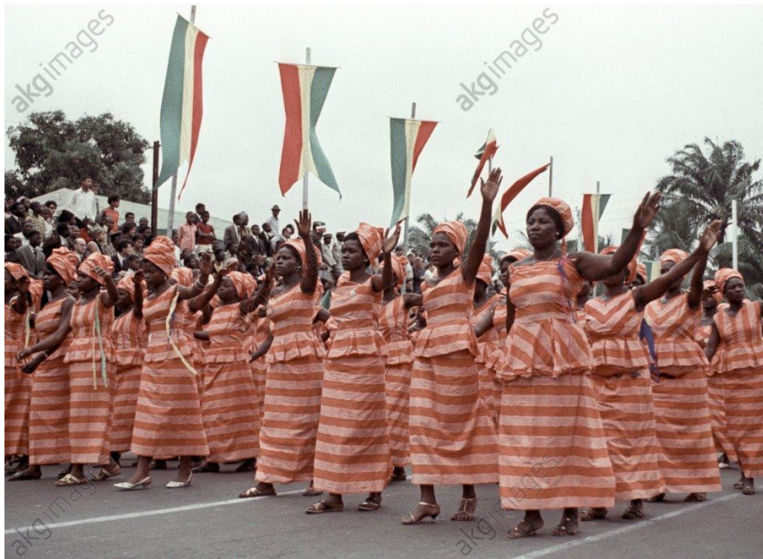
« Parade independance day »1965

La visibilité de l'organisation est également une donnée essentielle de sa reconnaissance dans ses premières années. A l'occasion des anniversaires de la Révolution où de l'organisation, les femmes rayonnaient dans les défilés comme pour la fête de l'indépendance ci-dessous.